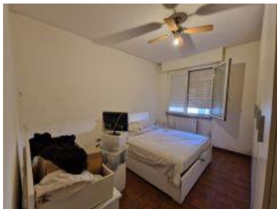
camera da letto