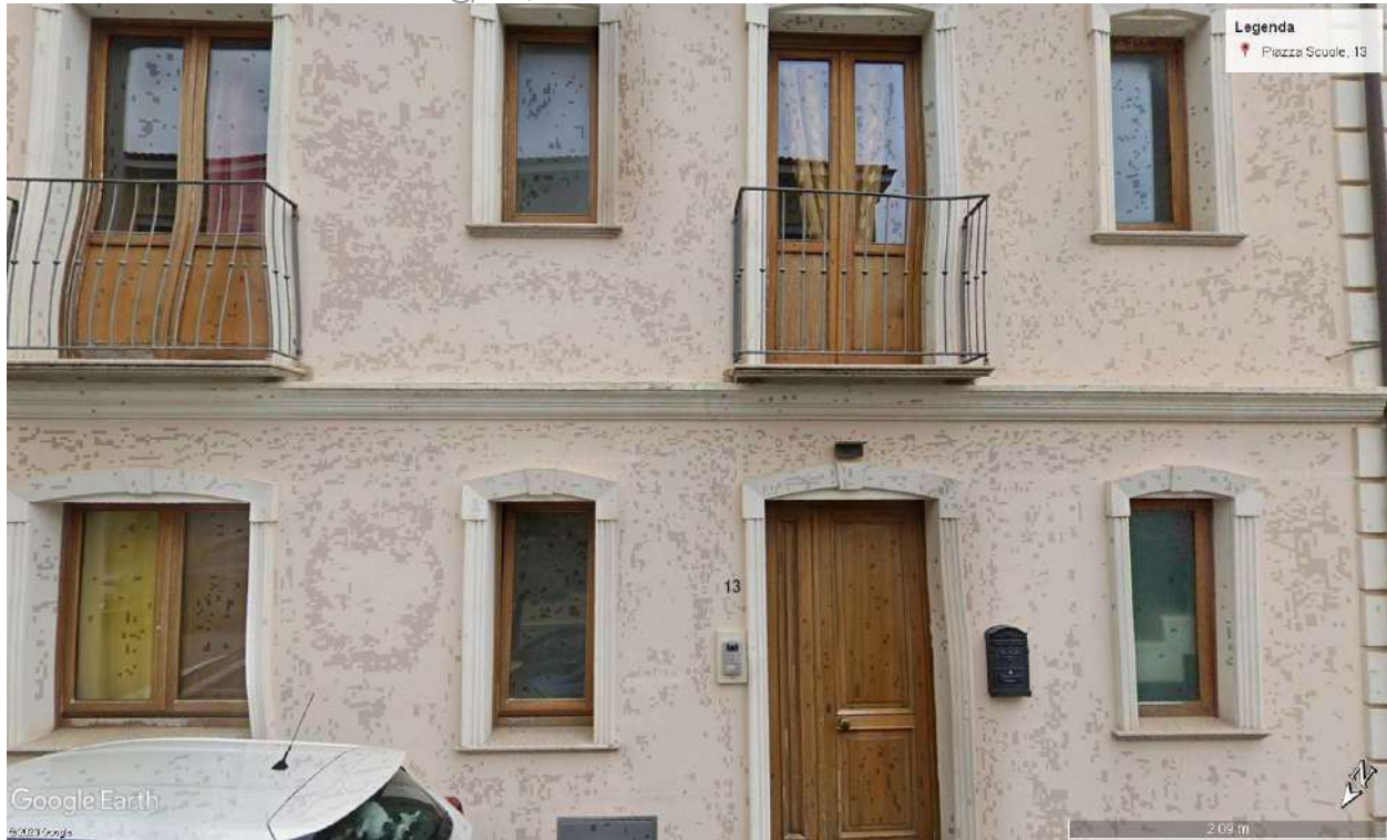
Prospetto principale dell'edificio

PEC: cubadda.arks@pec.it ; P.I. 02987690928 C.F. CBDLCU72D06B354I