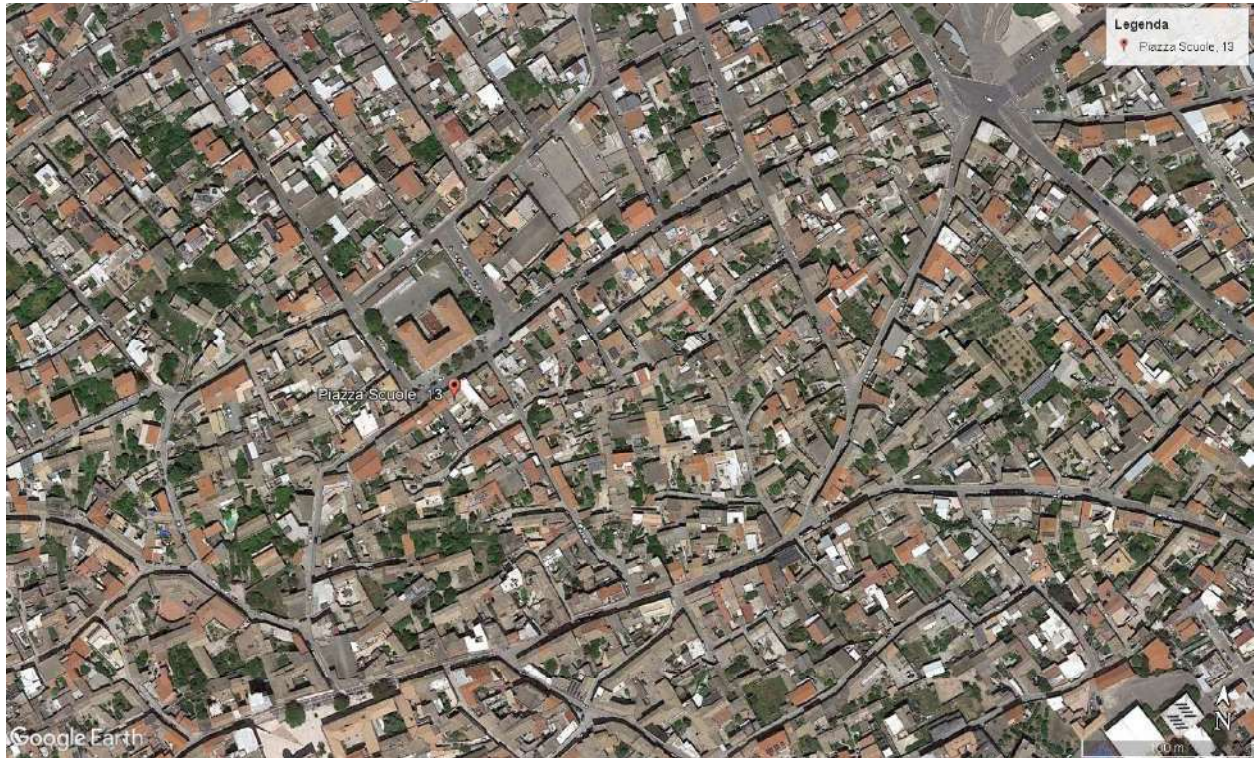
Inquadramento territoriale dell'edificio

PEC: cubadda.arks@pec.it ; P.I. 02987690928 C.F. CBDLCU72D06B354I