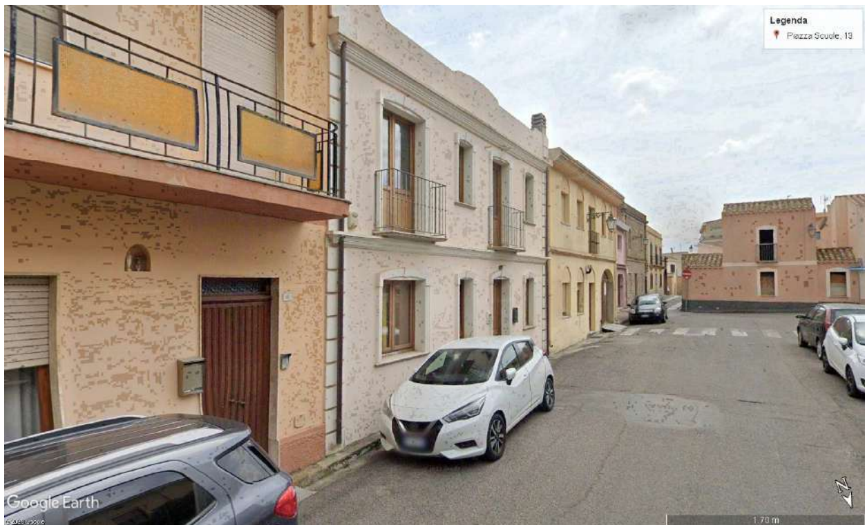
Prospetto principale dell'edificio