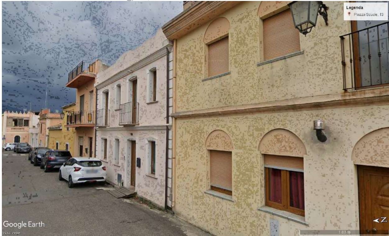
Prospetto principale dell'edificio

PEC: cubadda.arks@pec.it ; P.I. 02987690928 C.F. CBDLCU72D06B354I