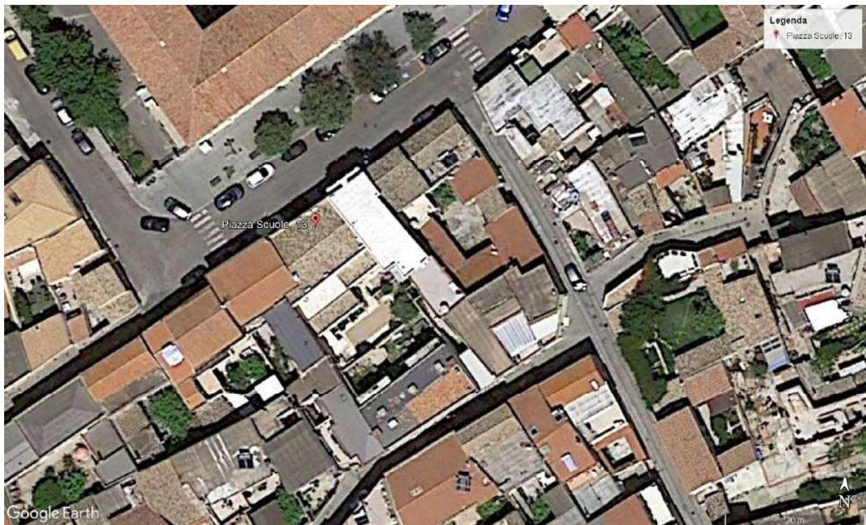
Inquadramento territoriale dell'edificio