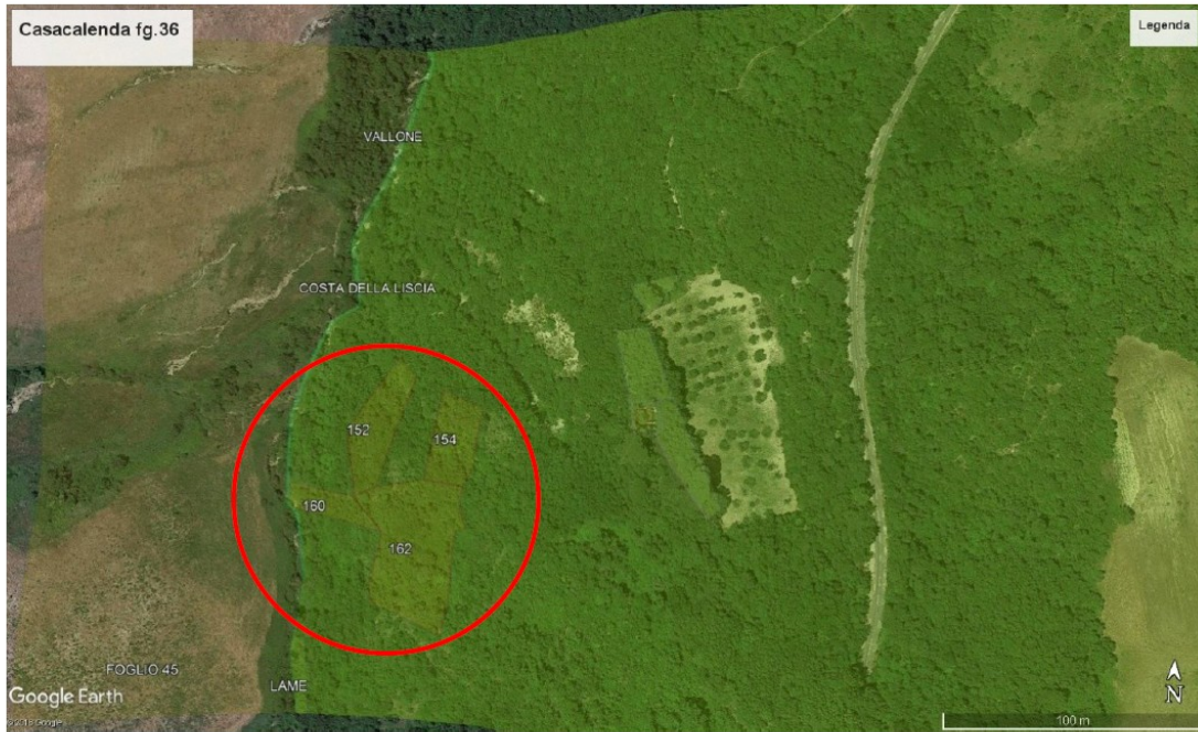
Foto n.1 - Vista satellitare con individuazione dei terreni