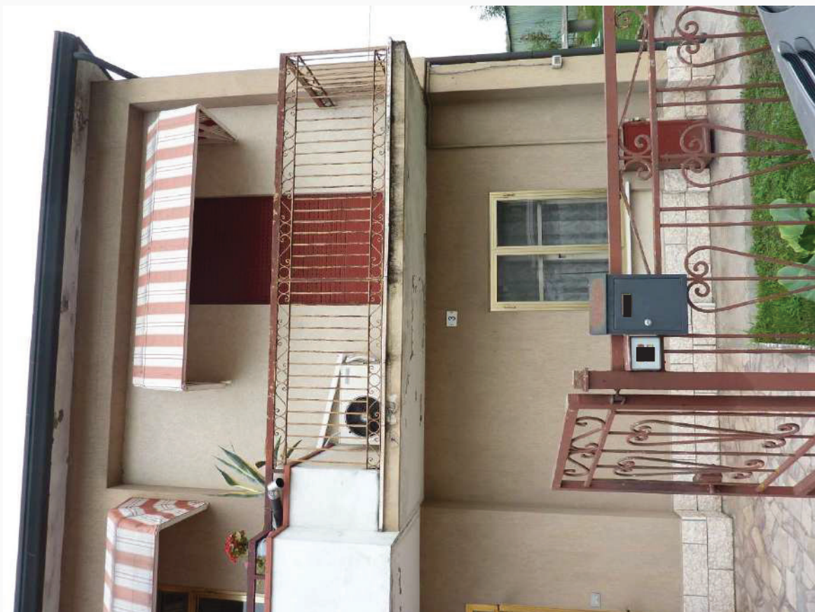
FOTO 10 _ PARTICOLARE PROSPETTO OVEST DEL FABBRICATO DA VIA PO