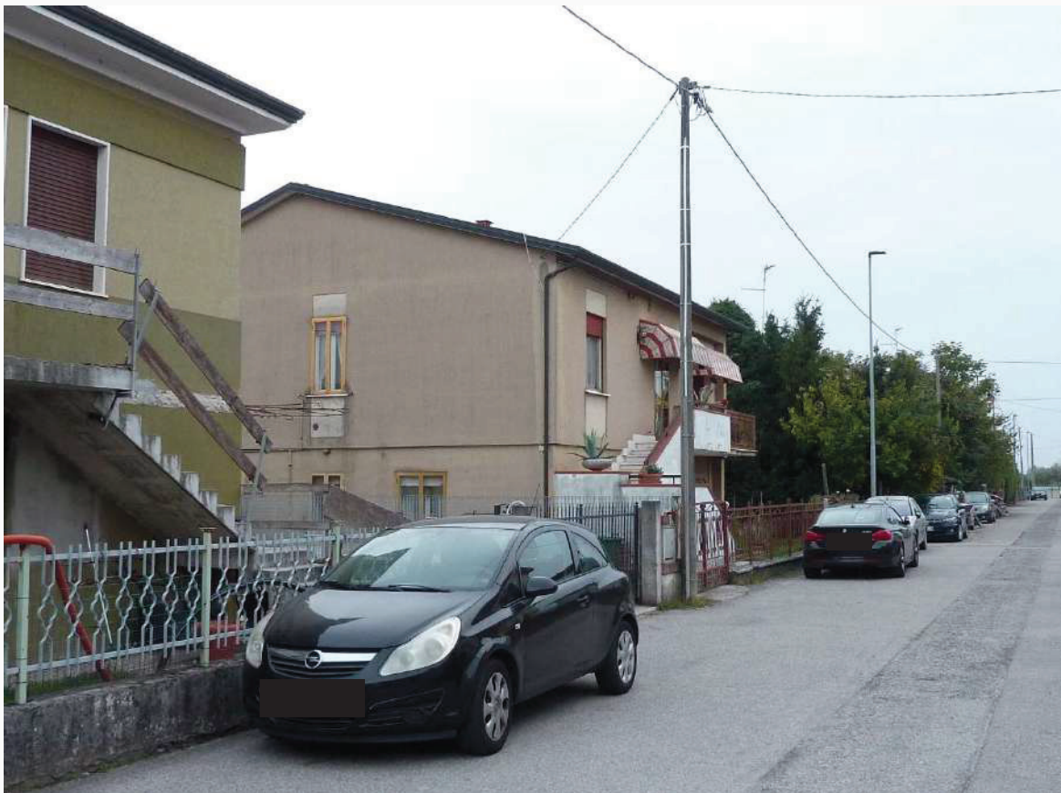
FOTO 4 _ VISTA ANGOLARE DEL FABBRICATO E DELL'AREA ESTERNA COMUNE DA VIA PO – PROSPETTI OVEST E NORD