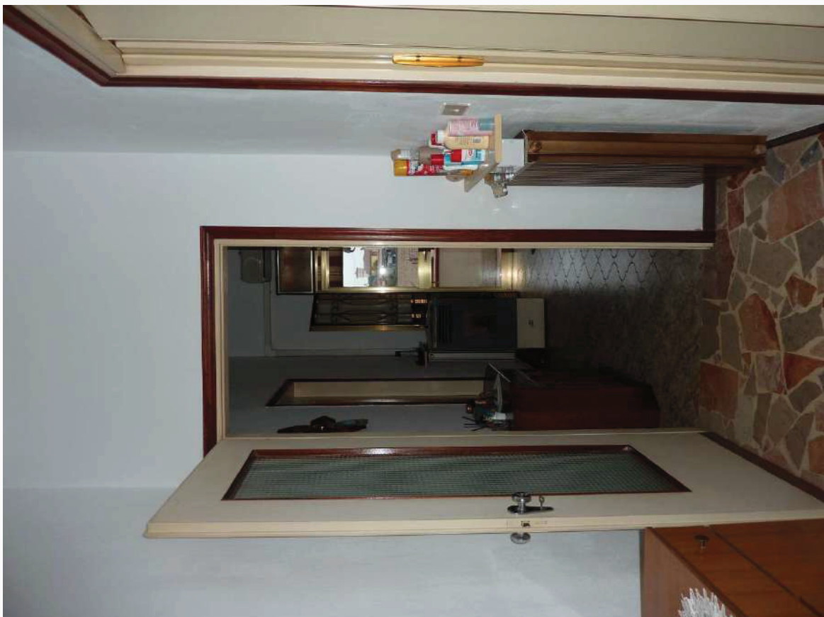
FOTO 12 _ VISTA INTERNA APPARTAMENTO PIANO PRIMO SUB 2: DISIMPEGNO