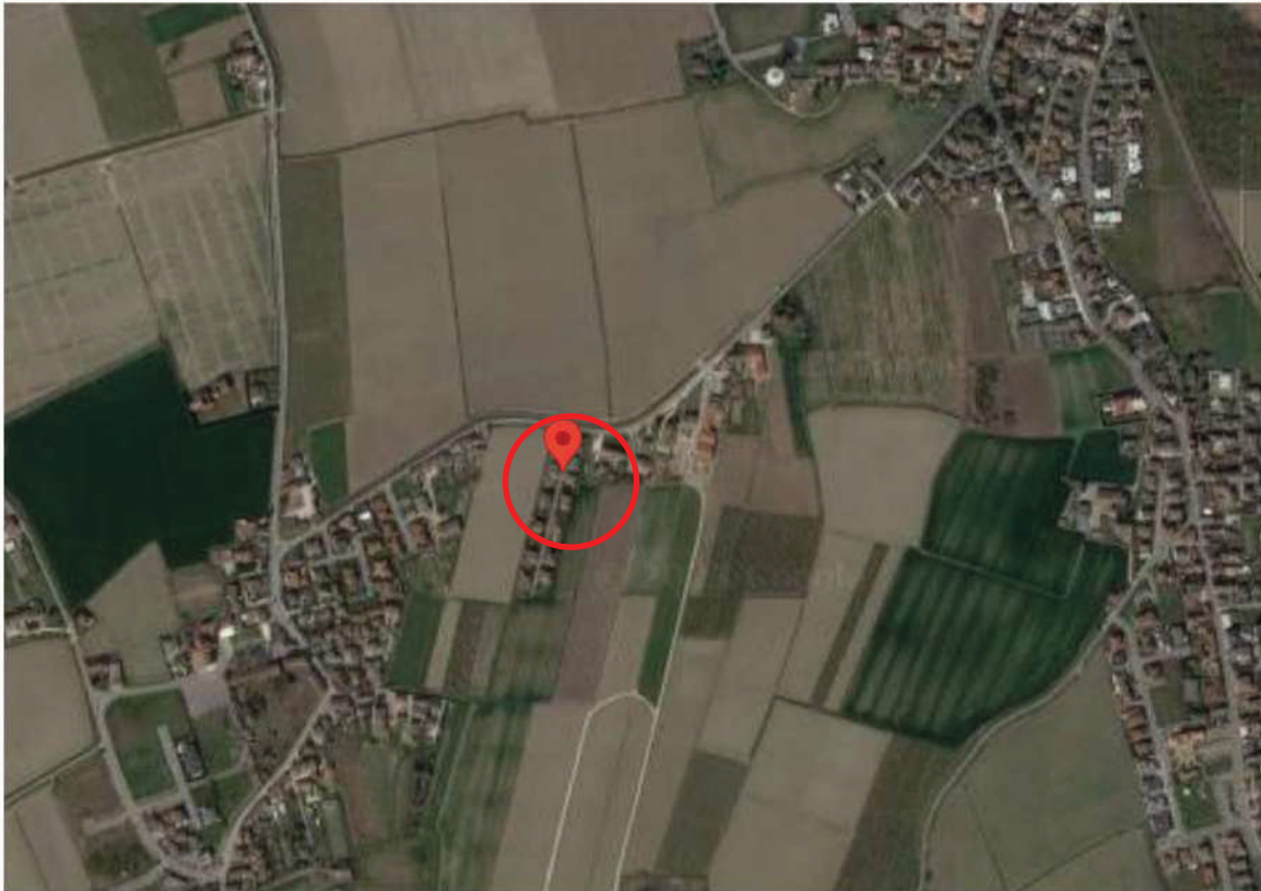
FOTO 1 _ VISTA AEREA