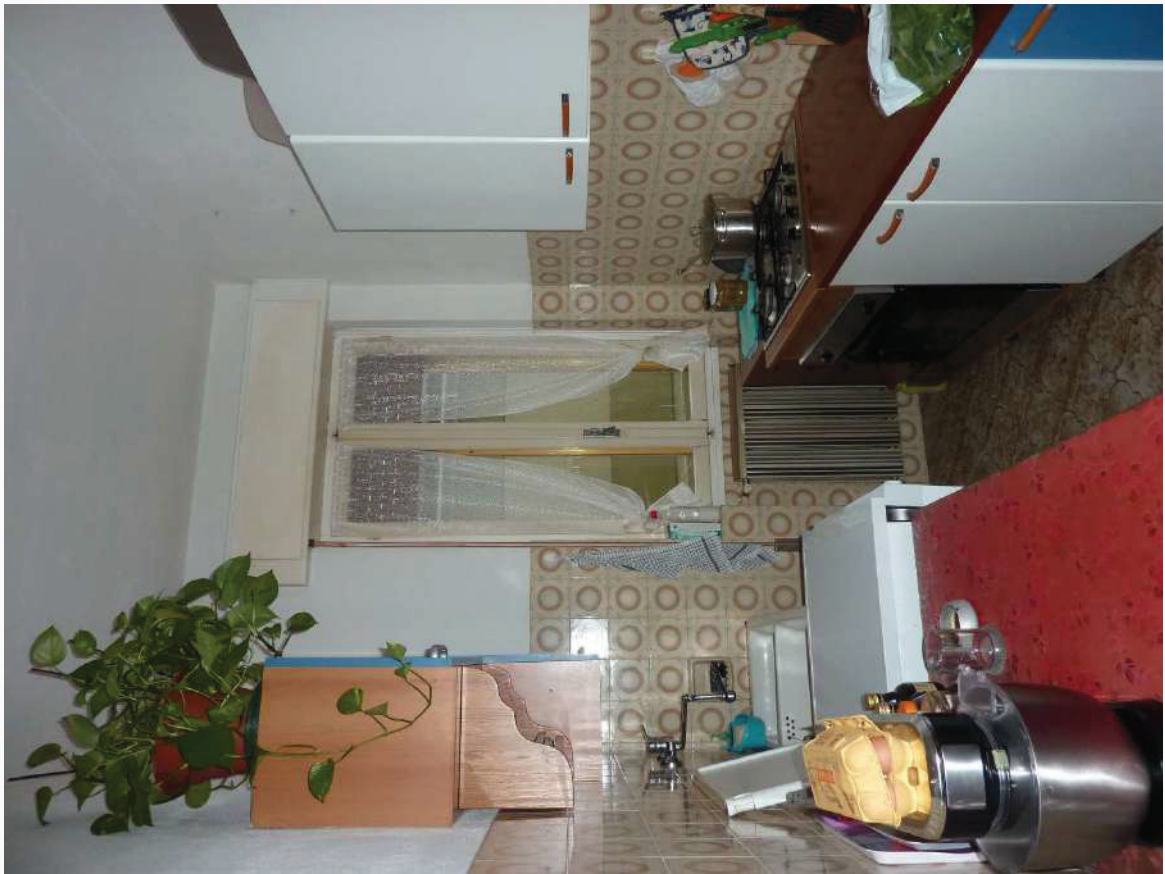
FOTO 15 _ VISTA INTERNA APPARTAMENTO PIANO PRIMO SUB 2: CUCINOTTO