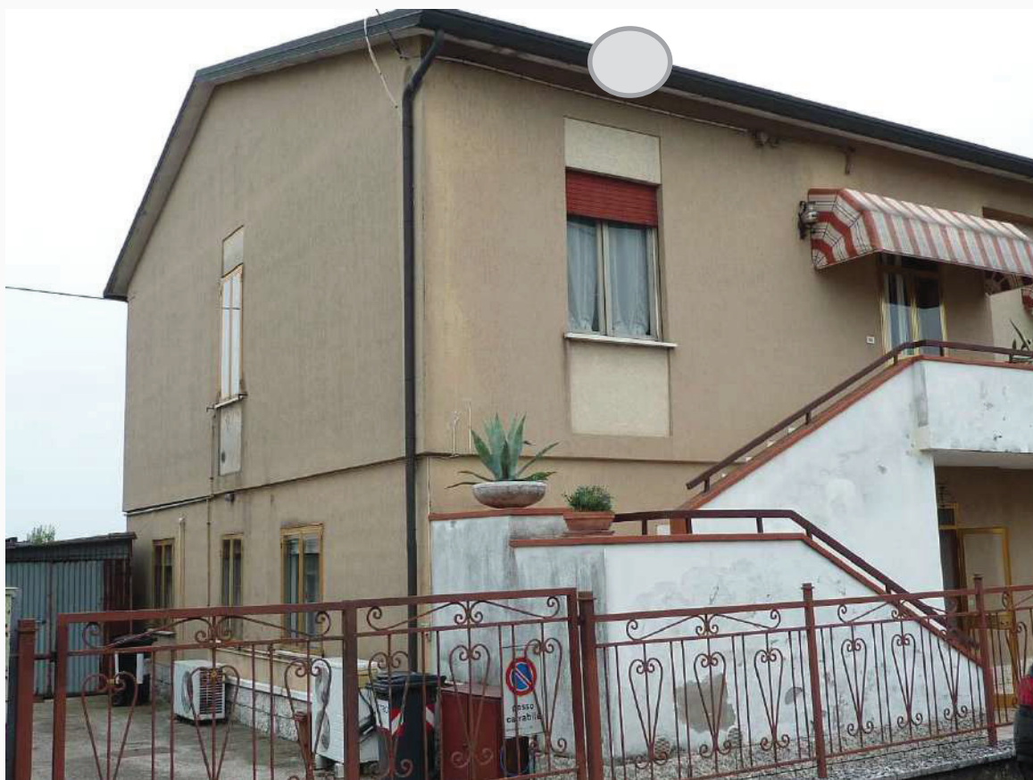
FOTO 6 _ VISTA ANGOLARE DEL FABBRICATO E DELL'AREA ESTERNA COMUNE DA VIA PO – PROSPETTI OVEST E NORD