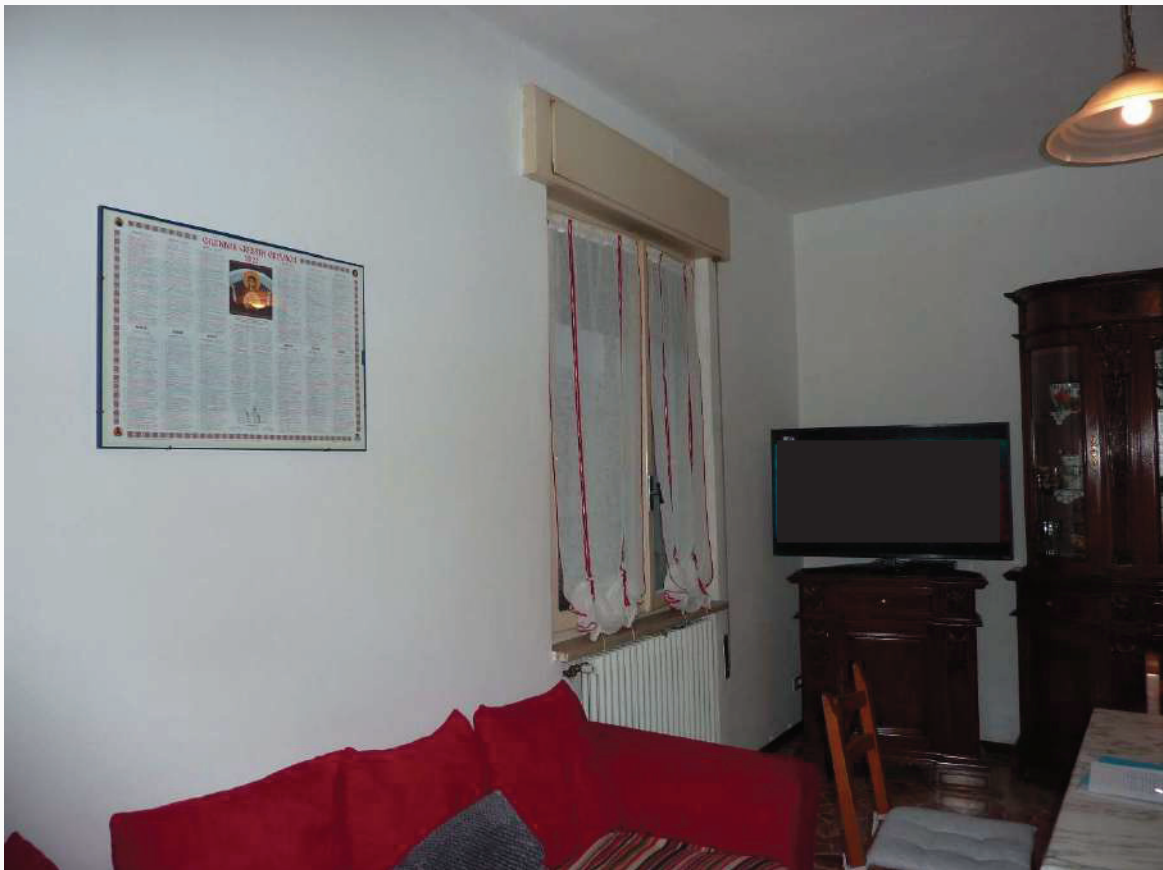
FOTO 18 _ VISTA INTERNA APPARTAMENTO PIANO PRIMO SUB 2: SOGGIORNO