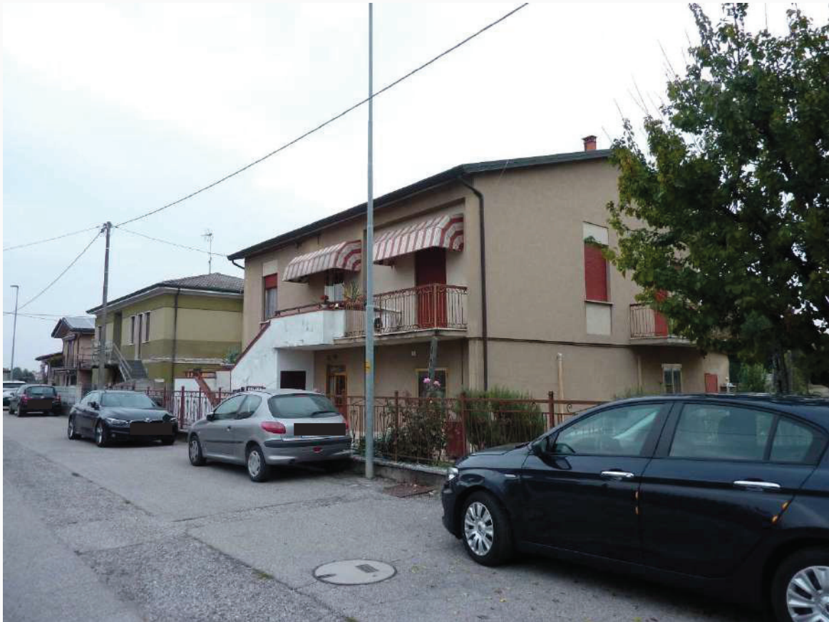
FOTO 3 _ VISTA ANGOLARE DEL FABBRICATO E DELL'AREA ESTERNA COMUNE DA VIA PO – PROSPETTI OVEST E SUD