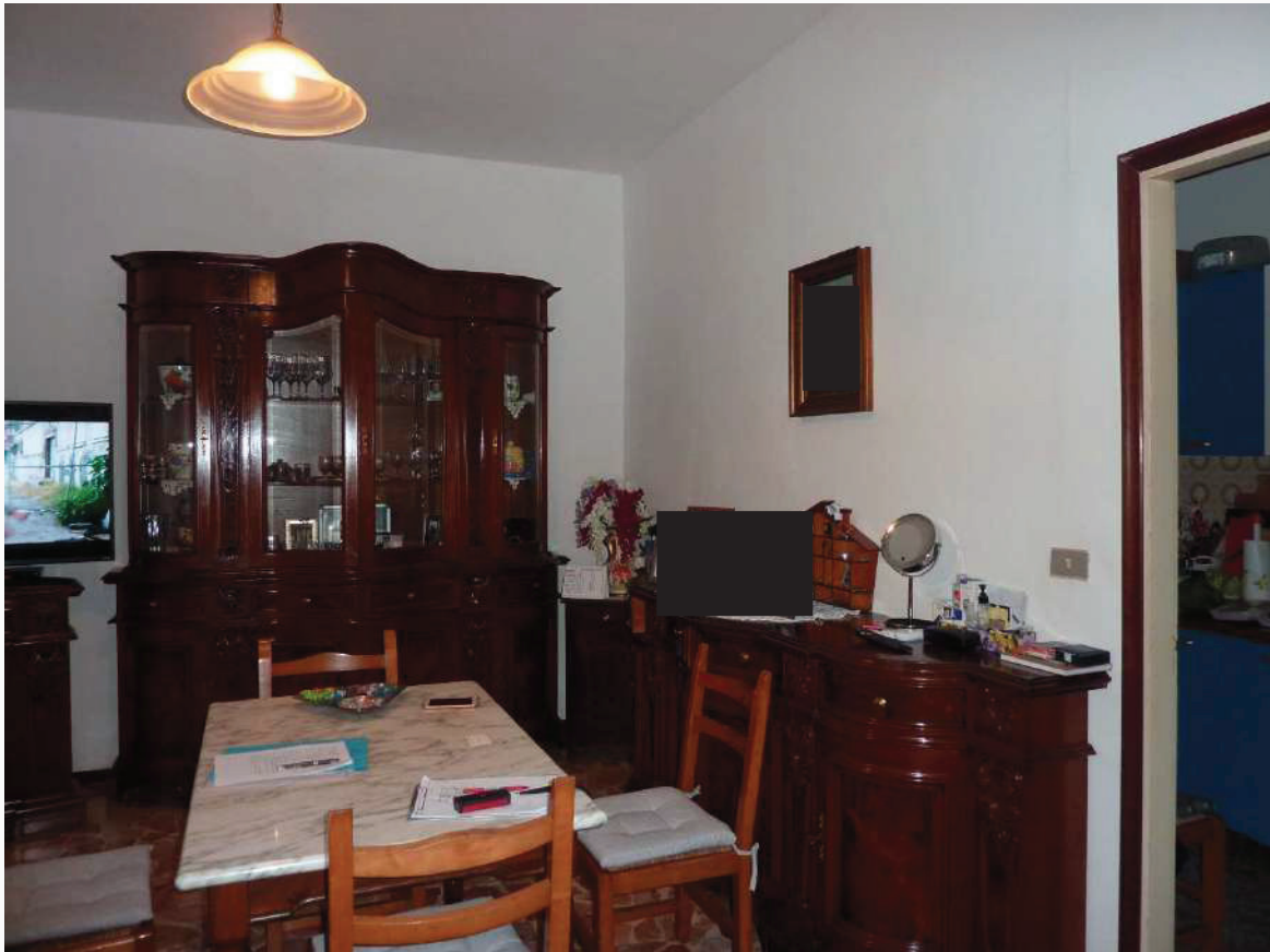
FOTO 17 _ VISTA INTERNA APPARTAMENTO PIANO PRIMO SUB 2: SOGGIORNO