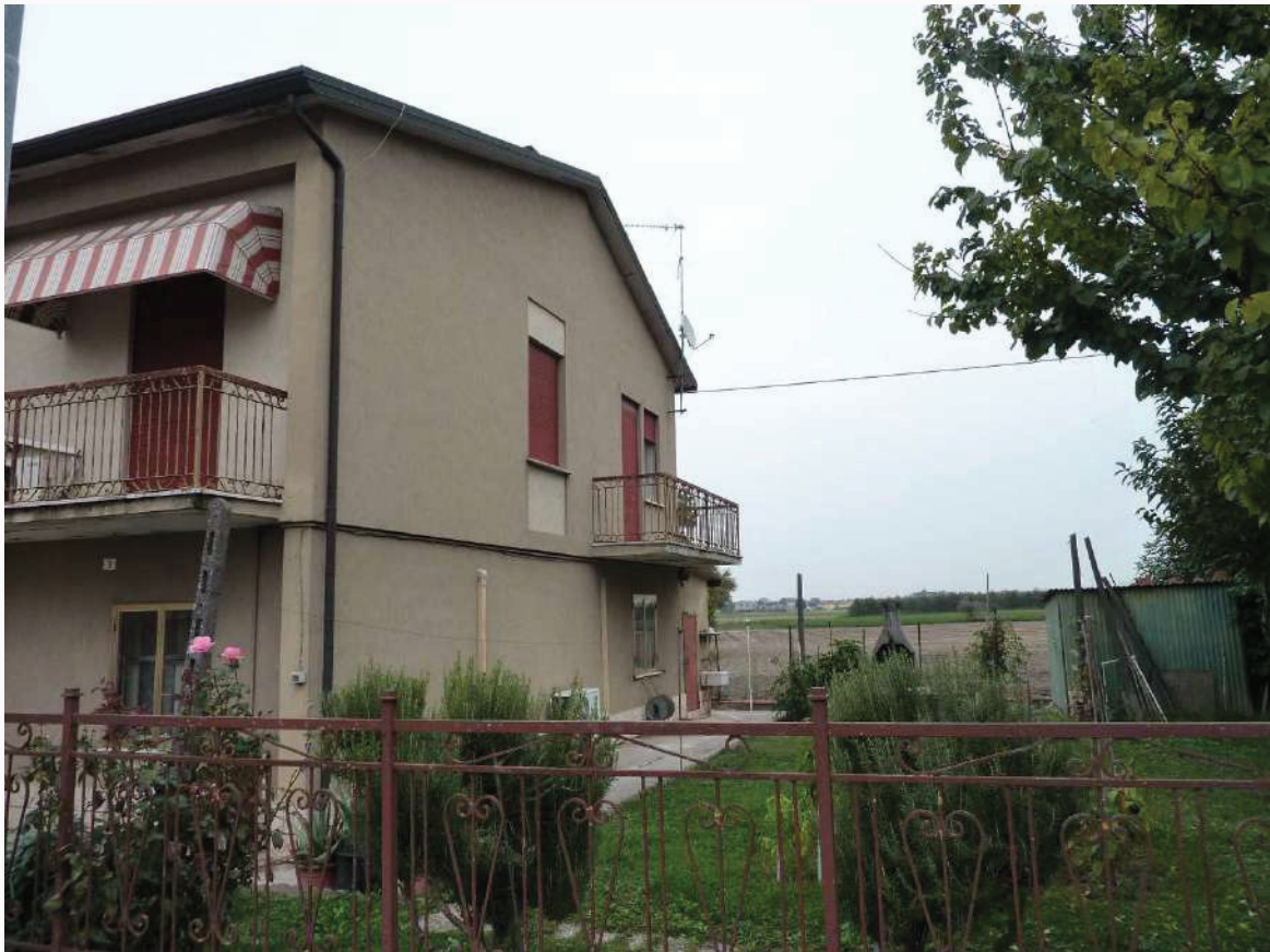
FOTO 7 _ VISTA ANGOLARE DEL FABBRICATO E DELL'AREA ESTERNA COMUNE DA VIA PO – PROSPETTI OVEST E SUD