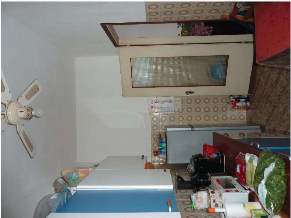
FOTO 16 _ VISTA INTERNA APPARTAMENTO PIANO PRIMO SUB 2: CUCINOTTO