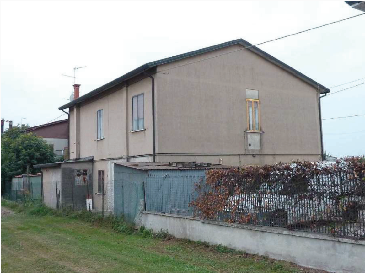
FOTO 9 _ VISTA ANGOLARE DEL RETRO DEL FABBRICATO – PROSPETTI NORD ED EST