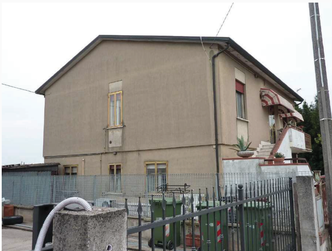
FOTO 5 _ VISTA ANGOLARE DEL FABBRICATO E DELL'AREA ESTERNA COMUNE DA VIA PO – PROSPETTI OVEST E NORD