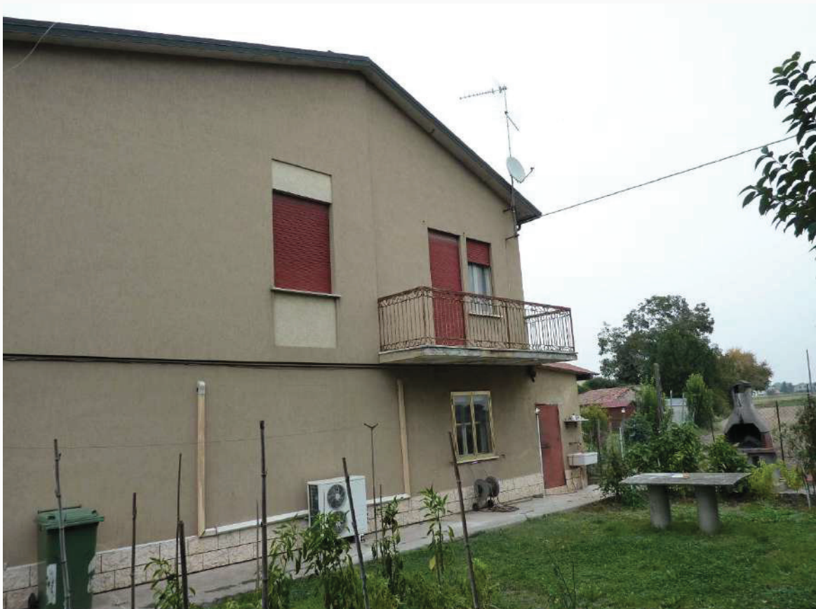
FOTO 8 _ PARTICOLARE PROSPETTO SUD DALLA CORTE COMUNE