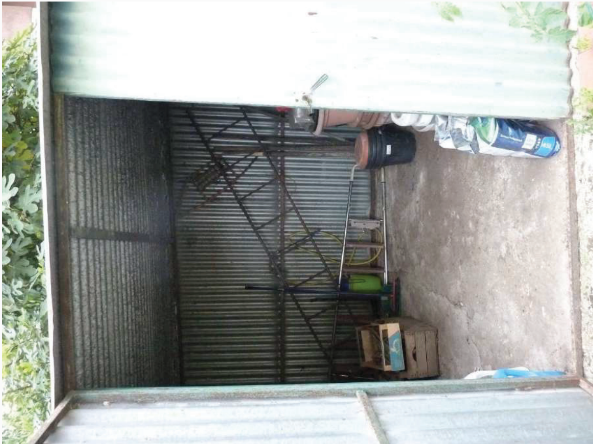
FOTO 15 _ PARTICOLARE RIPOSTIGLIO ESTERNO IN LAMIERA SUB 1