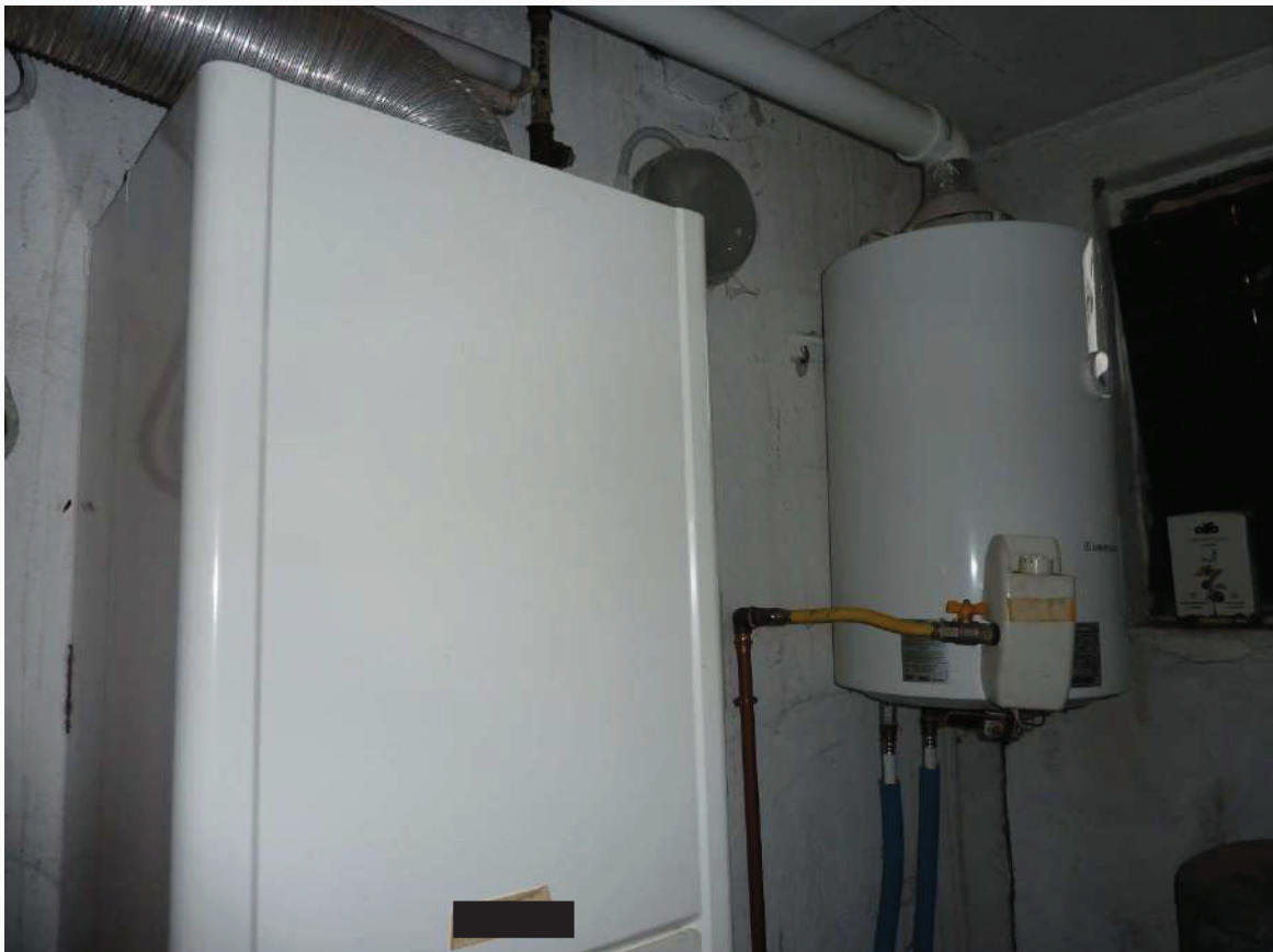
FOTO 14 _ PARTICOLARE CALDAIA APPARTAMENTO PIANO TERRA SUB 1 – CENTRALE TERMICA SUB 1