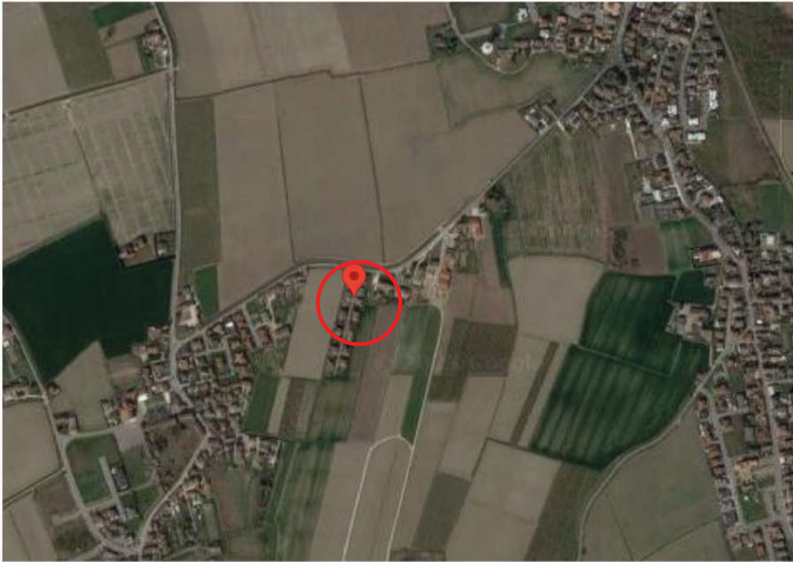
FOTO 1 _ VISTA AEREA