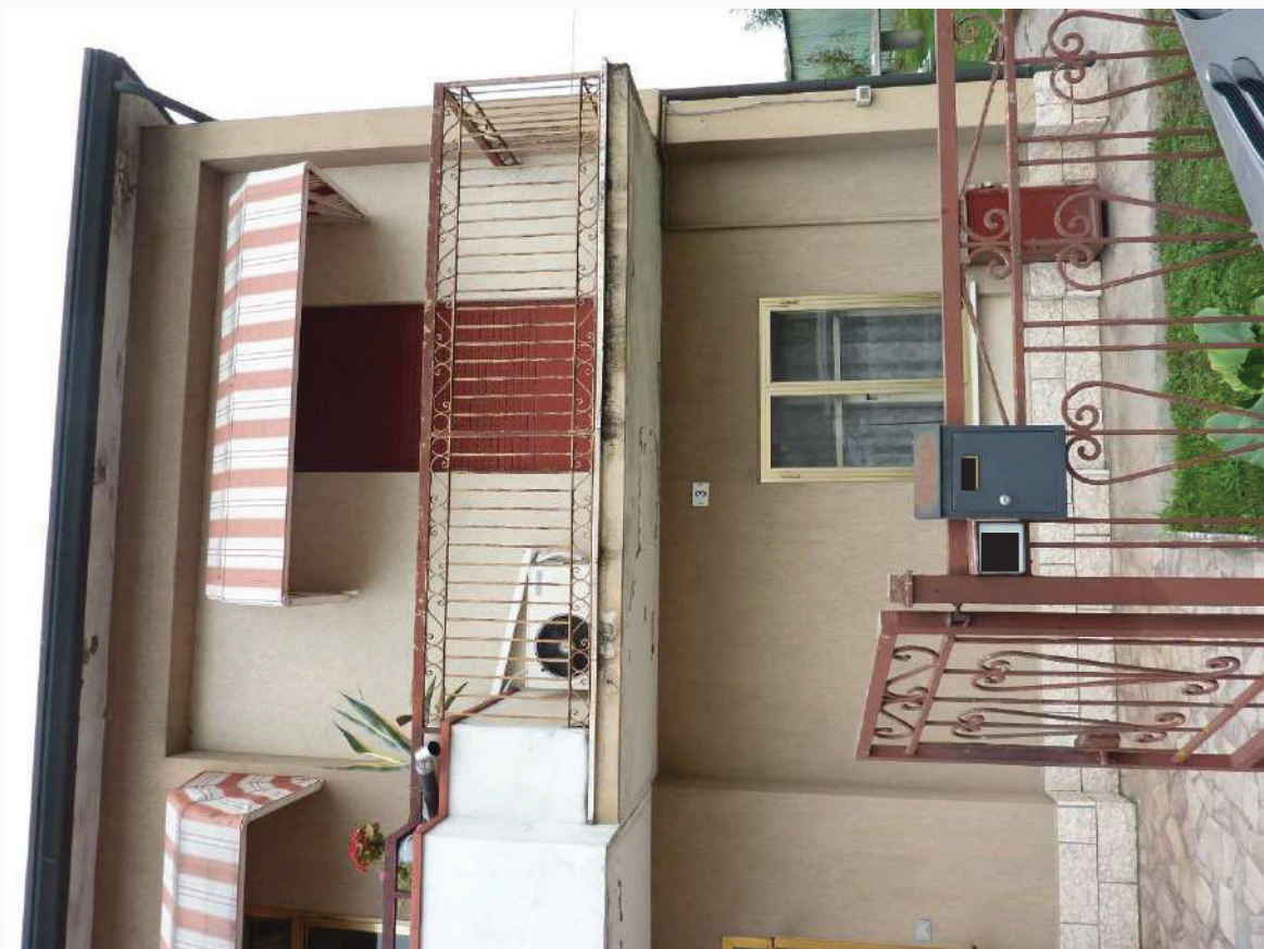
FOTO 10 _ PARTICOLARE PROSPETTO OVEST DEL FABBRICATO DA VIA PO