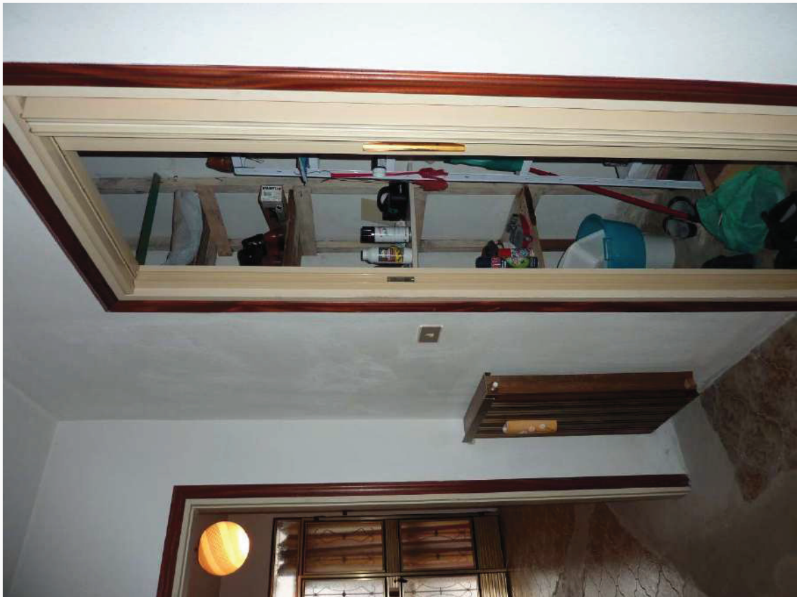
FOTO 21 _ VISTA INTERNA APPARTAMENTO PIANO TERRA SUB 1: DISIMPEGNO