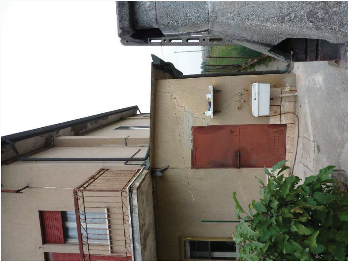
FOTO 11 _ PARTICOLARE ACCESSO CENTRALE TERMICA SUB 1