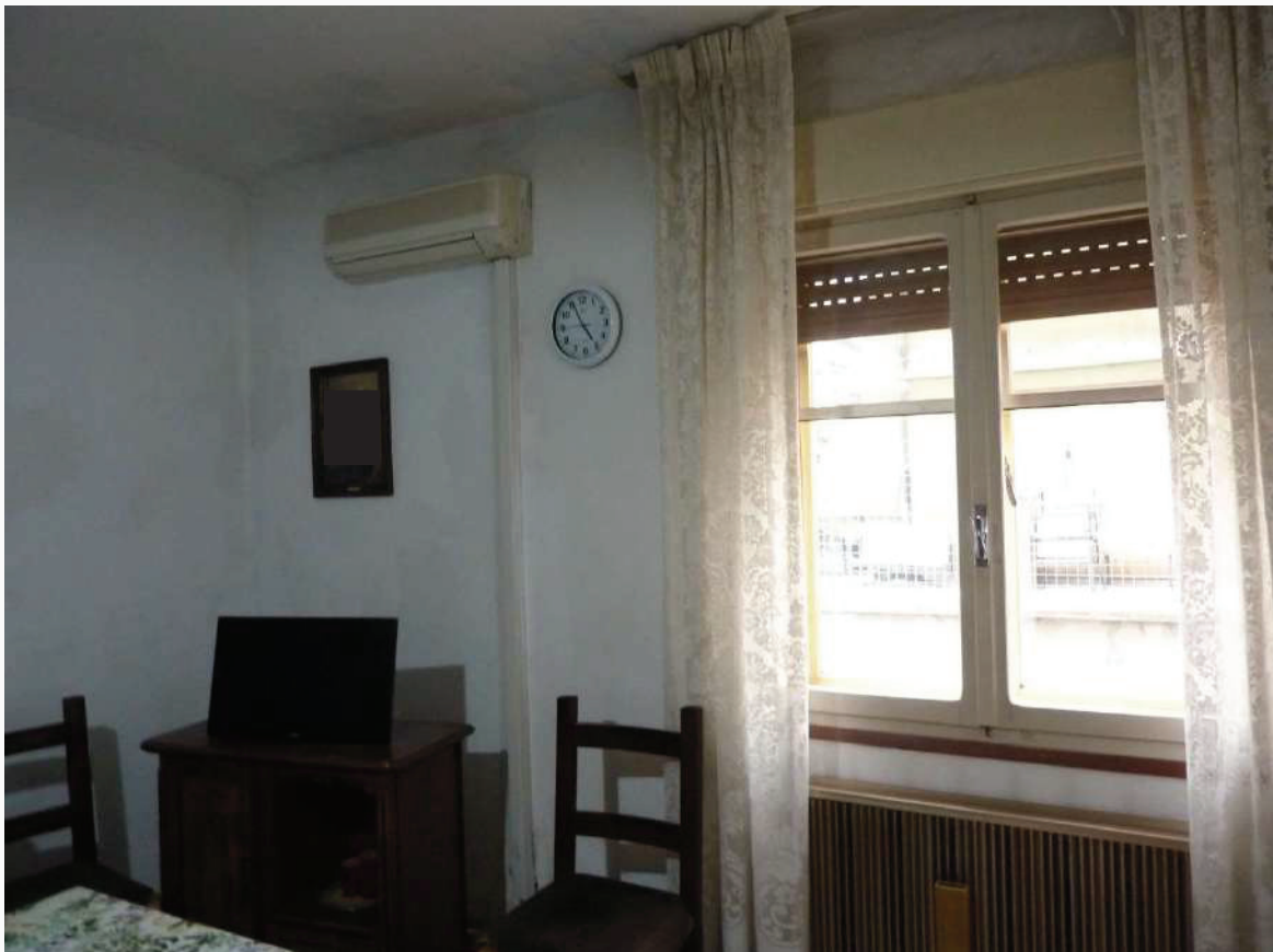
FOTO 28 _ VISTA INTERNA APPARTAMENTO PIANO TERRA SUB 1: SOGGIORNO