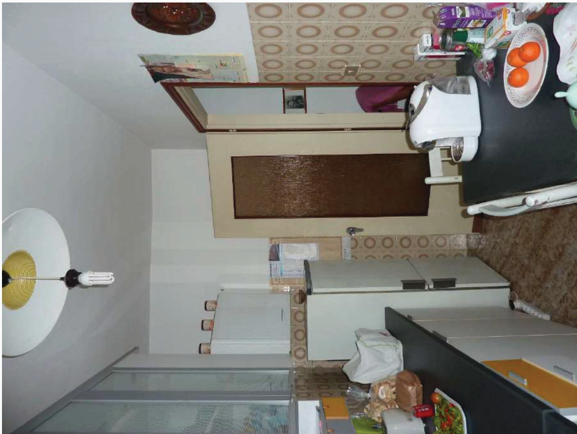
FOTO 27 _ VISTA INTERNA APPARTAMENTO PIANO TERRA SUB 1: CUCINOTTO