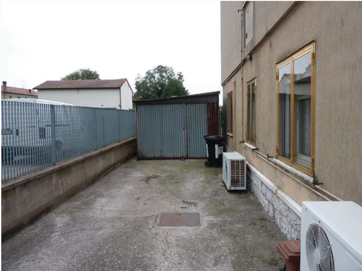
FOTO 17 _ VISTA AUTORIMESSA SUB 3 DALLA CORTE PERTINENZIALE COMUNE