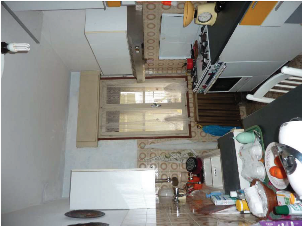
FOTO 26 _ VISTA INTERNA APPARTAMENTO PIANO TERRA SUB 1: CUCINOTTO