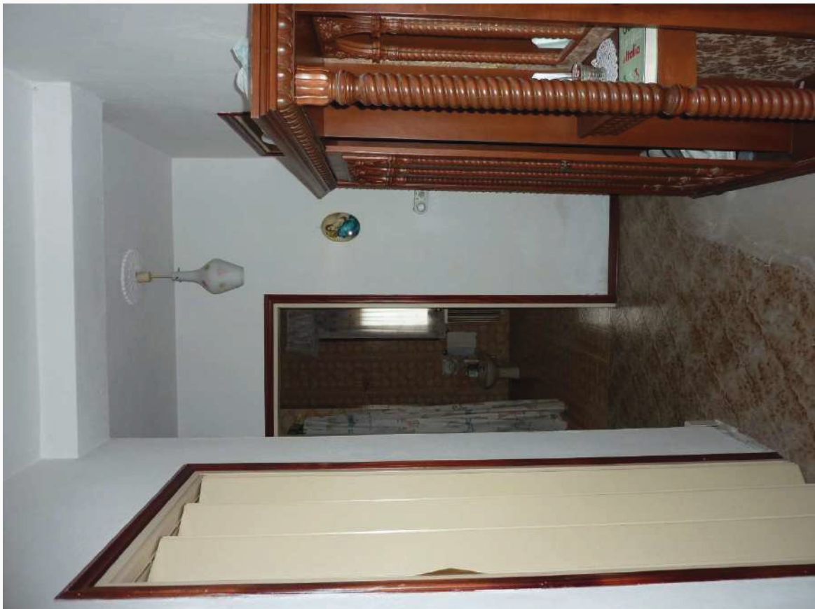
FOTO 20 _ VISTA INTERNA APPARTAMENTO PIANO TERRA SUB 1: DISIMPEGNO