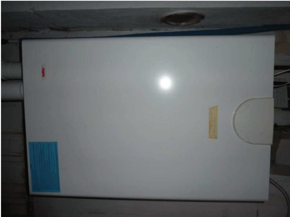
FOTO 13 _ PARTICOLARE CALDAIA APPARTAMENTO PIANO PRIMO SUB 2 – CENTRALE TERMICA SUB 1