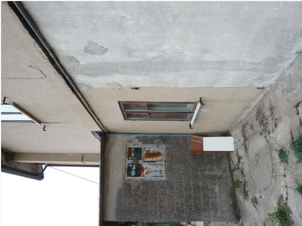
FOTO 12 _ PARTICOLARE RETRO CENTRALE TERMICA SUB 1