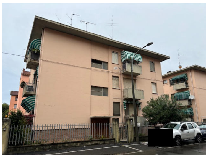
ESTERNI da Via XXV Aprile