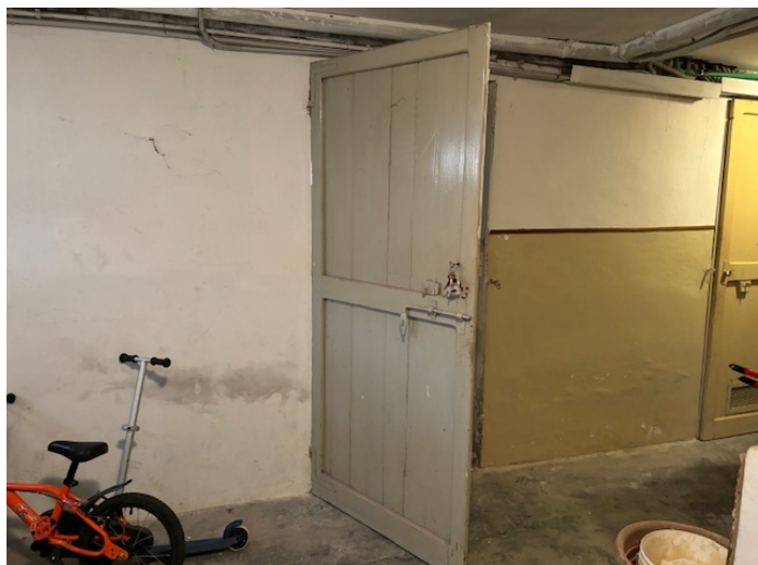
Ingresso cantina da parti comuni