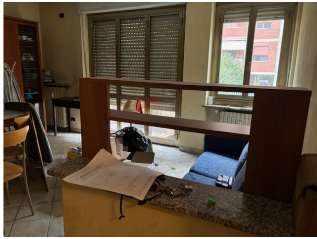
soggiorno (unico locale senza disimpegno e cucina)