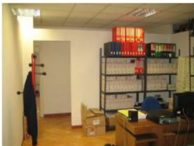
Foto 3, Ingresso ufficio 1