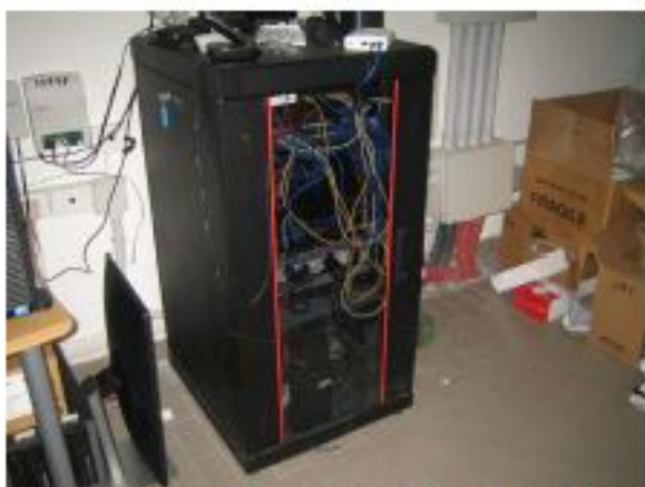
Foto 15-16, Particolare dispositivi di controllo "centralina e quadro elettrico", dell'impianto fotovoltaico