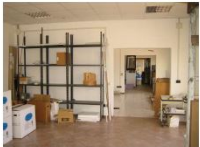
Foto 4, Vista interna dei locali