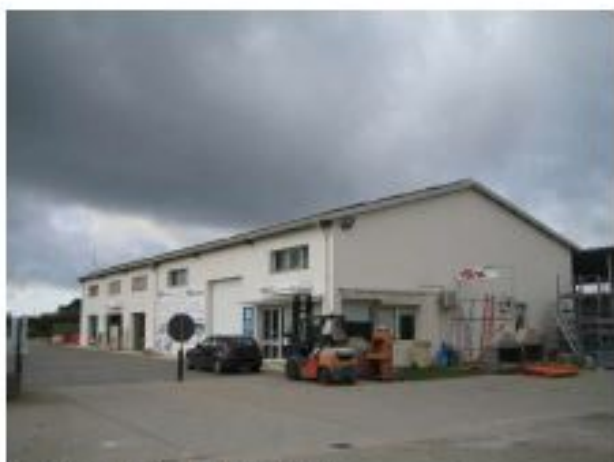
Foto 1, Fabbricato H vista frontale

Fabbricato in Oristano Frazione Donigala Fenughedu (OR) STRADA STATALE 292 n° SNC, F.3; MAPP.864; SUB.1; CAT. D/7 Fabbricato (H) Piano Terra 540,99 mq; Piano Primo 231,84 mq;