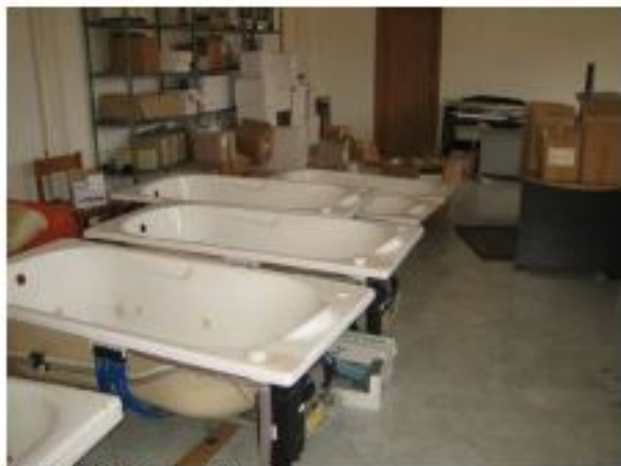
Foto 7, Vista interna dei locali

Fabbricato in Oristano Frazione Donigala Fenughedu (OR) STRADA STATALE 292 n° SNC, F.3; MAPP.864; SUB.1; CAT. D/7 Fabbricato (B) 277,92 mq; Locale tecnico 27,04 mq; Tettoia 126,48 mq;