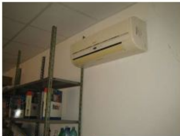
Foto 8, Unità interna climatizzazione