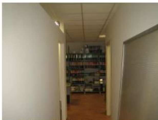
Foto 8, Disimpegno uffici Piano Primo