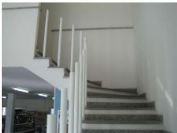
Foto 1, Scale di accesso al Piano primo

Fabbricato (H) Piano Terra 540,99 mq; Piano Primo 231,84 mq;