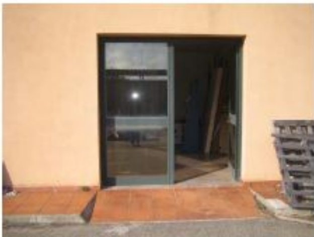
Foto 3, Ingresso fabbricato B