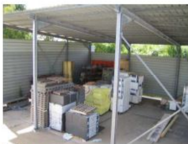
Foto 4, Interno