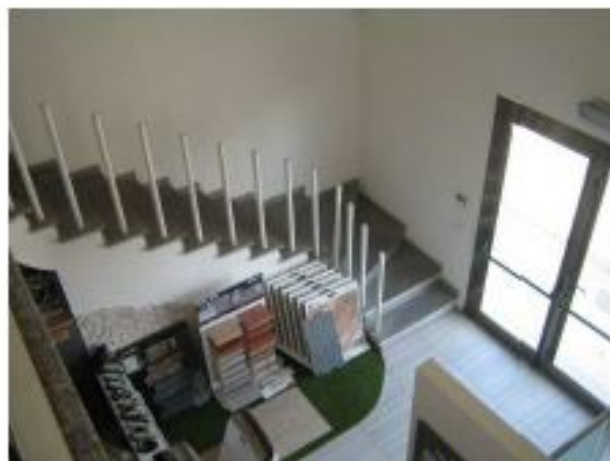
Foto 4, Ingresso piano terra, zona esposizione e vendita