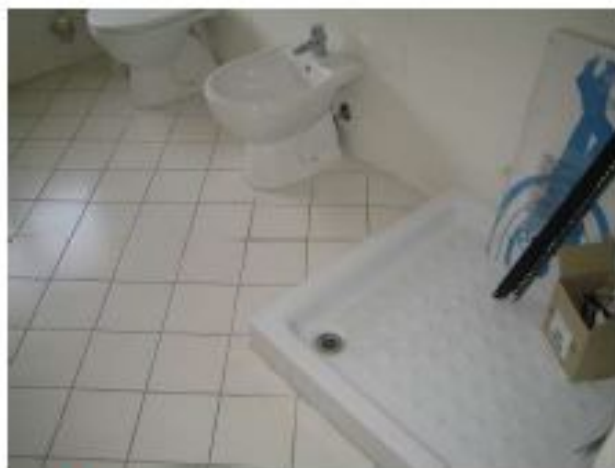
Foto 6, Bagno 1