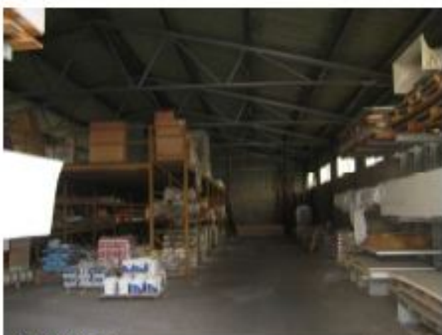
Foto 3, Vista interna