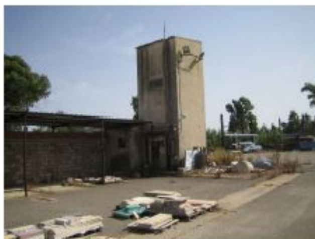
Foto 3, Vista esterna Cabina elettrica