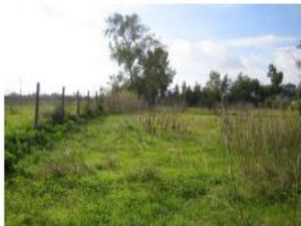
Foto 4, Vista terreno