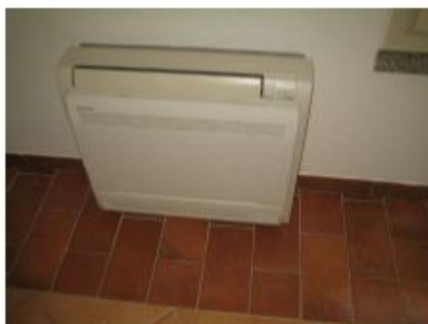
Foto 10, Unità di riscaldamento e raffreddamento interno Ufficio 2