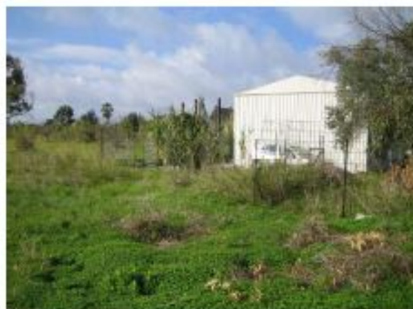
Foto 3, Vista terreno