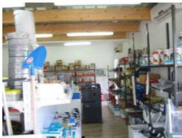
Foto 22, Magazzino PT con soppalco