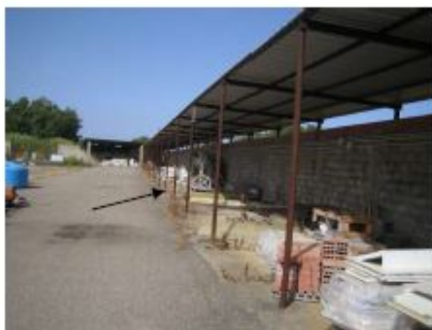
Foto 4, Vista esterna tettoia 2