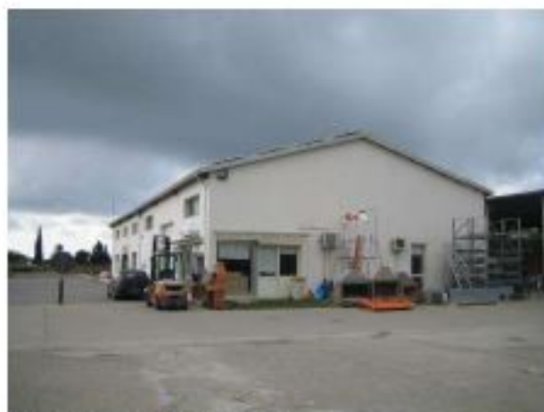
Foto 2, Fabbricato H vista laterale