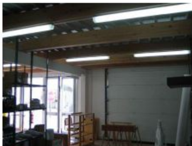
Foto 20, Magazzino PT con soppalco