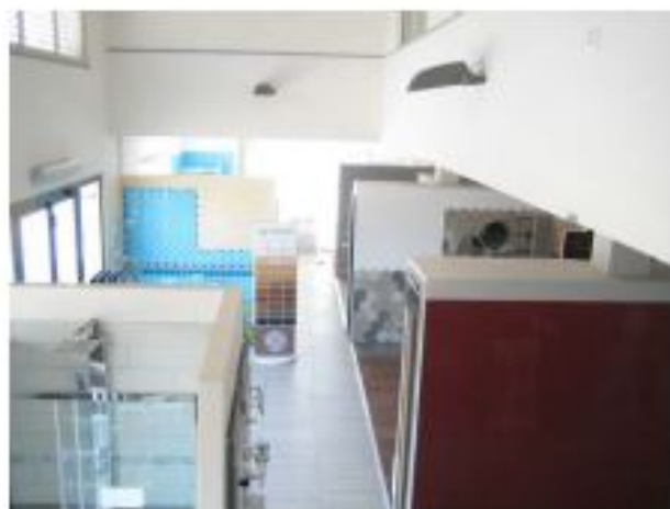
Foto 6, Vista zona esposizione e vendita Piano Terra