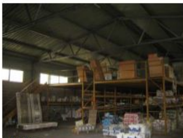
Foto 4, Vista interna