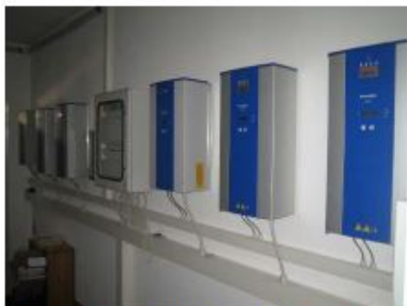
Foto 14, Sala di controllo dell'impianto fotovoltaico al Piano Terra