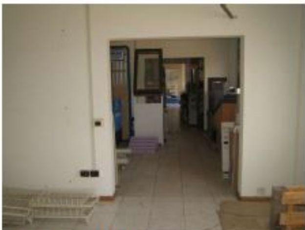
Foto 5, Vista interna dei locali