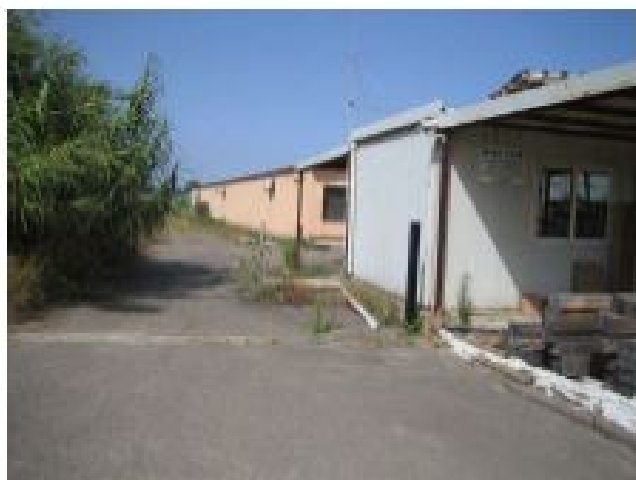
Foto 3, Vista posteriore