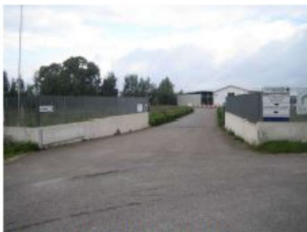
Foto 3, Ingresso 1 dalla STRADA STATALE 292

Lotto 5) Fabbricati in Oristano Frazione Donigala Femughedu (OR) Strada Statale n. 292 snc, F.3; MAPP.864; SUB.1 cat. D/7;