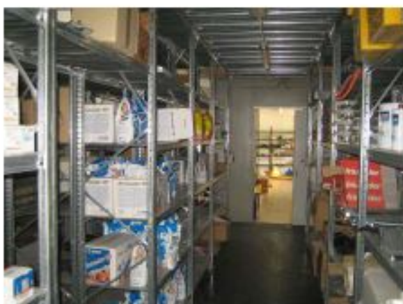
Foto 17, Magazzino PT con soppalco