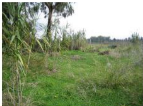
Foto 2, Vista terreno