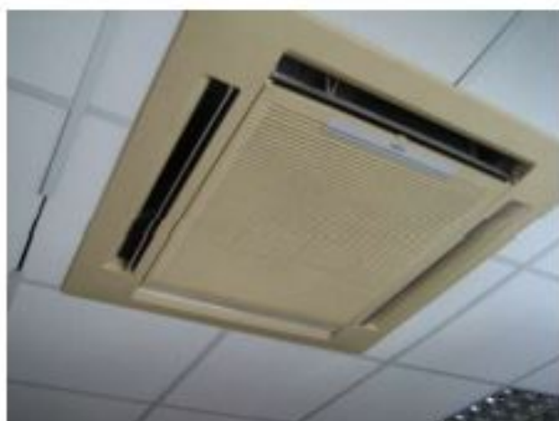
Foto 11, Unità di riscaldamento e raffreddamento a soffitto