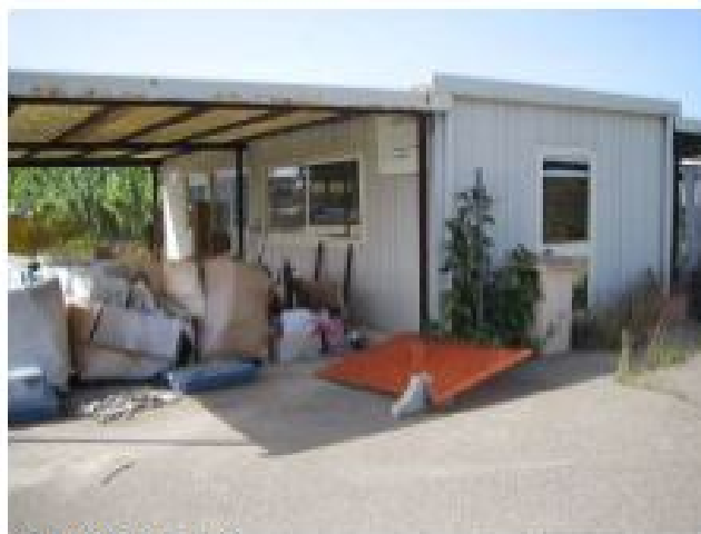
Foto 2, Vista frontale