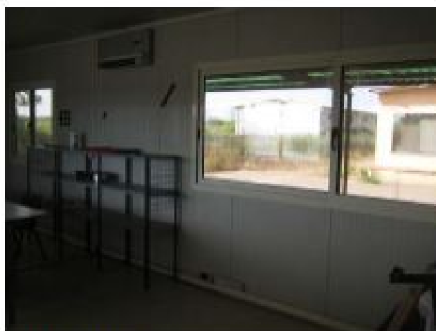
Foto 6, Vista interna