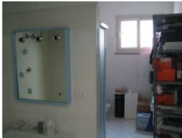
Foto 12, Bagno Piano Terra