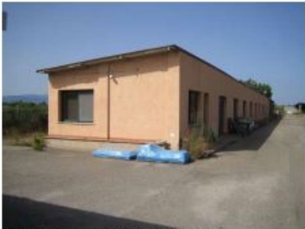
Foto 1, Vista esterna dell'edificio fabbricato B

Fabbricato (B) 277,92 mq; Locale tecnico 27,04 mq; Tettoia 126,48 mq;