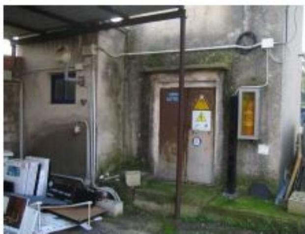
Foto 4, Vista esterna Cabina elettrica