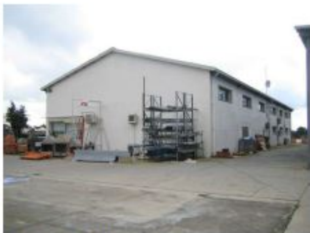
Foto 3, Fabbricato H vista posteriore