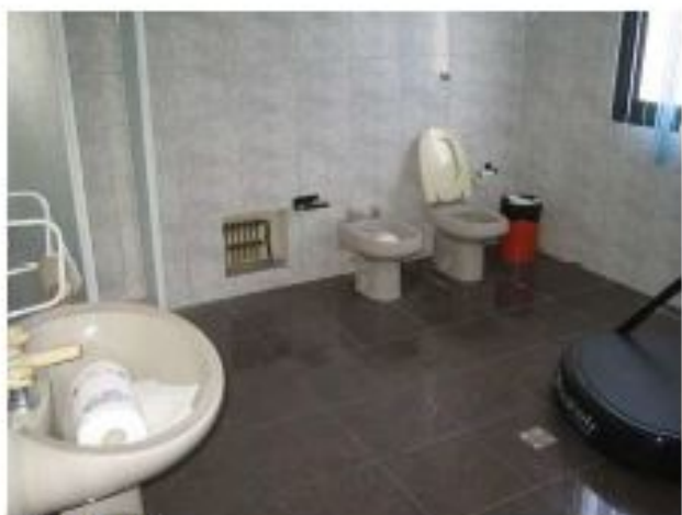
Foto 9, Bagno