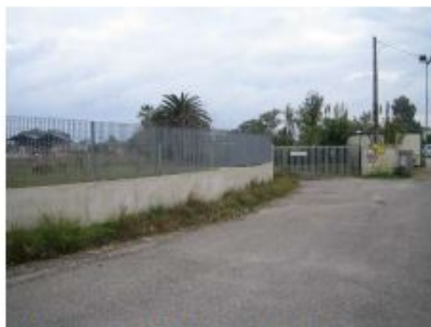
Foto 4, Ingresso 2 dalla STRADA STATALE 292