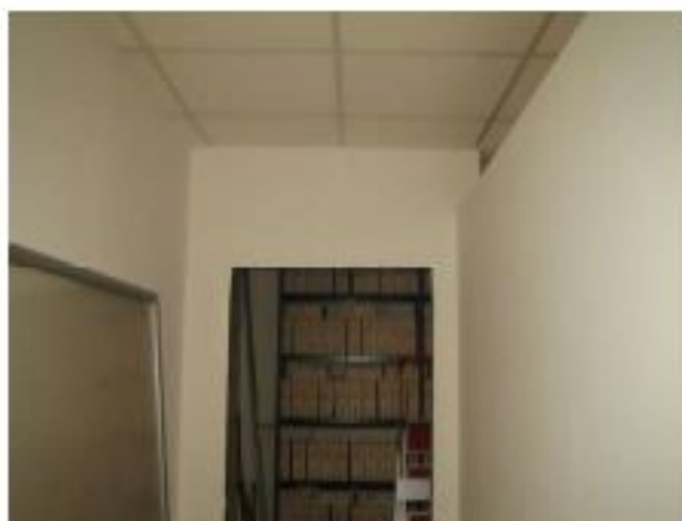
Foto 4, Disimpegno