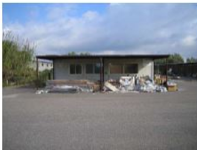
Foto 4, Vista tettoia laterale