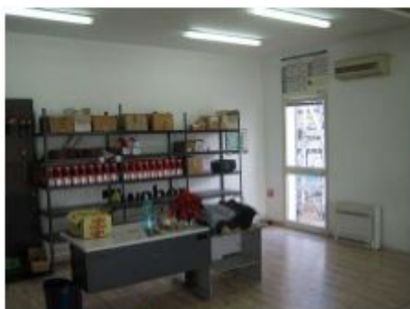
Foto 18, Magazzino Piano Terra