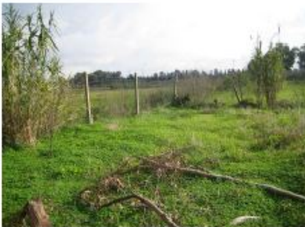
Foto 5, Vista terreno