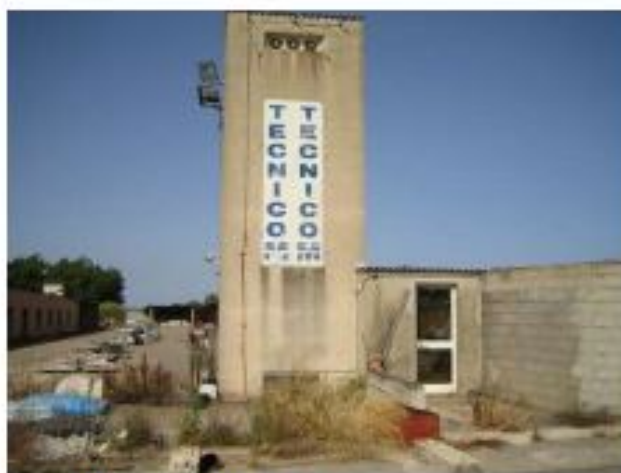
Foto 2, Vista esterna Cabina elettrica