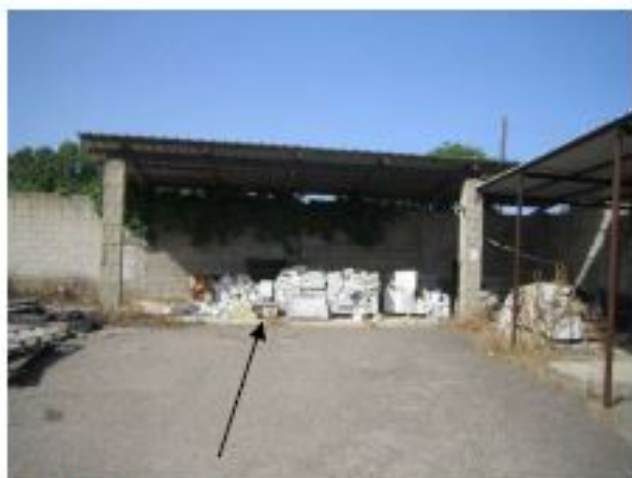
Foto 1, Vista esterna tettoia 1

Fabbricato in Oristano Frazione Donigala Fenughedu (OR) STRADA STATALE 292 n° SNC, F.3; MAPP.864; SUB.1; Tettoia 1, 46,96 mq; Tettoia 2, 386,46 mq