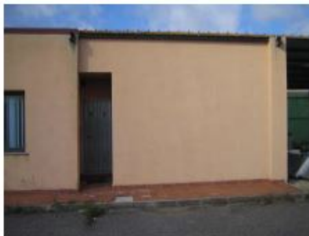
Foto 10, Locale tecnico ingresso