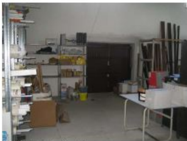
Foto 21, Magazzino Piano Terra