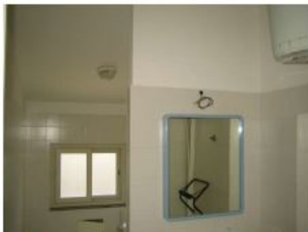
Foto 5, Bagno 1