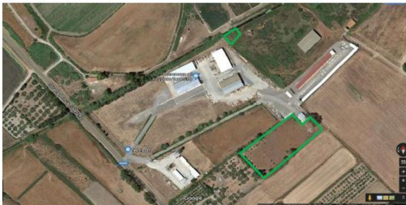
Foto 1, Vista aerea della zona

Appezamento di terreno in Oristano Frazione Donigala Fenughedu (OR) STRADA STATALE 292 n° SNC, F.3; MAPP.864; SUB.1; Appezamento di terreno in Zona E2, 5964.00 mq;