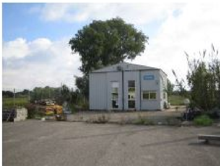
Foto 1, Vista esterna fabbricato

Fabbricato in Oristano Frazione Donigala Fenugheda (OR) STRADA STATALE 292 n° SNC, F.3; MAPP.864; SUB.1; CAT. D/7 Fabbricato (E) 52,56 mq;