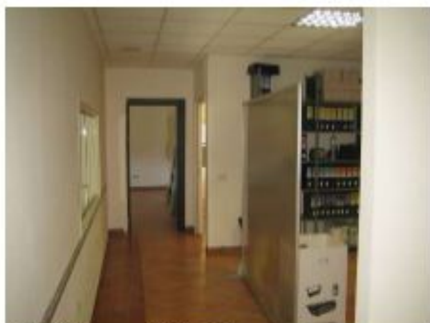
Foto 7, Disimpegno uffici Piano Primo

Fabbricato (H) Piano Terra 540,99 mq; Piano Primo 231,84 mq;