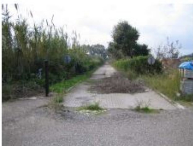
Foto 6, Viale da ingresso 2