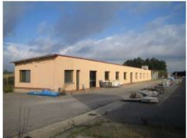
Foto 2, Vista esterna fabbricato