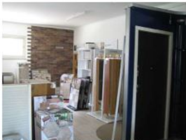
Foto 7, Vista zona esposizione e vendita Piano Terra

Fabbricato in Oristano Frazione Donigala Fenughedu (OR) STRADA STATALE 292 n° SNC, F.3; MAPP.864; SUB.1; CAT. D/7 Fabbricato (H) Piano Terra 540,99 mq; Piano Primo 231,84 mq;