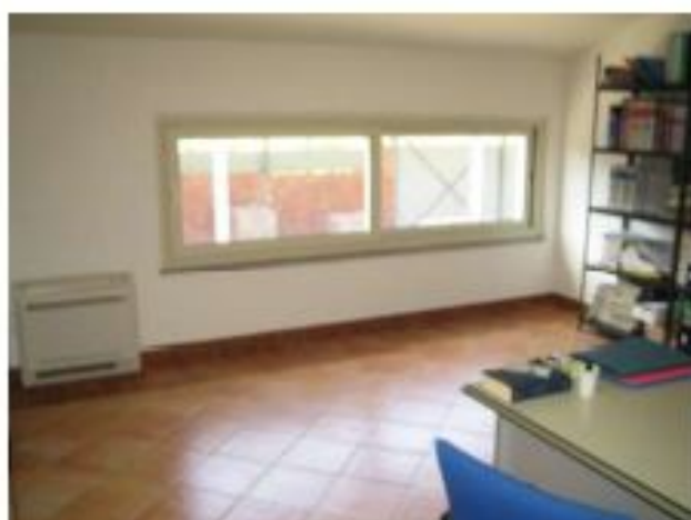
Foto 9, Ufficio 2