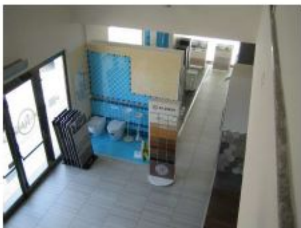
Foto 5, Vista zona esposizione e vendita Piano Terra