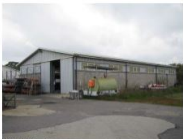
Foto 1, Vista esterna

Fabbricato in Oristano Frazione Donigala Fenughedu (OR) STRADA STATALE 292 n° SNC, F.3; MAPP.864; SUB.1; CAT. D/7 Fabbricato (A), 481,90 mq;