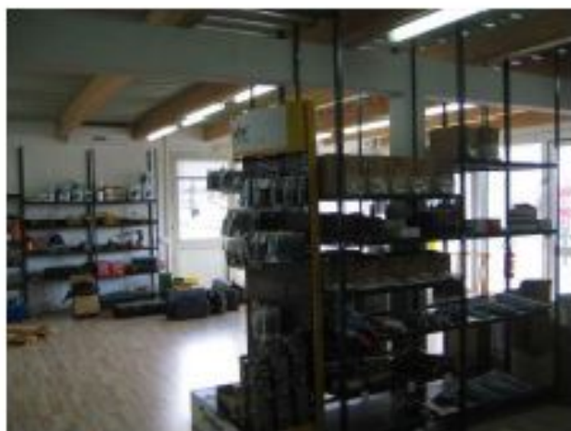
Foto 19, Magazzino PT con soppalco

Fabbricato (H) Piano Terra 540,99 mq; Piano Primo 231,84 mq;