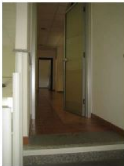
Foto 2, Accesso al Piano Primo