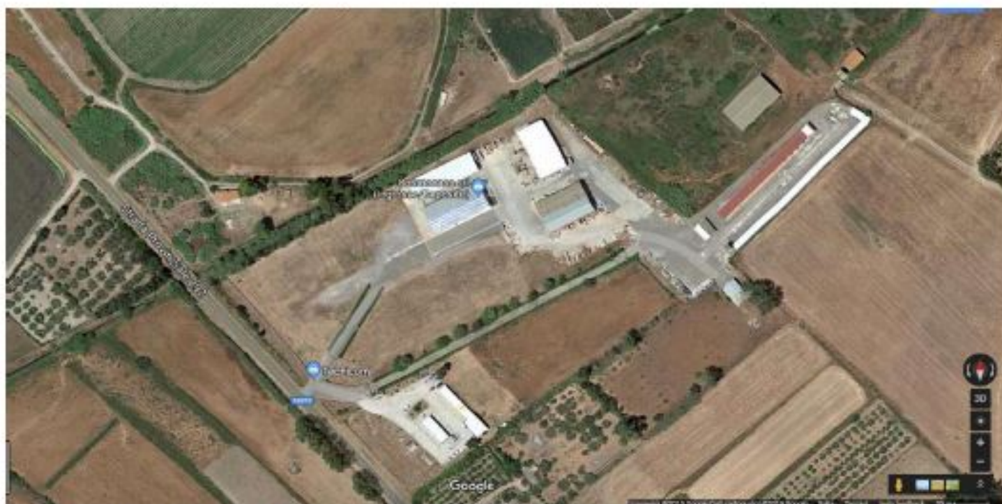
Foto 1, Vista aerea della zona Google Maps

Lotto 5) Fabbricati in Oristano Frazione Donigala Fenughedu (OR) Strada Statale n. 292 snc, F.3; MAPP.864; SUB.1 cat. D/7;