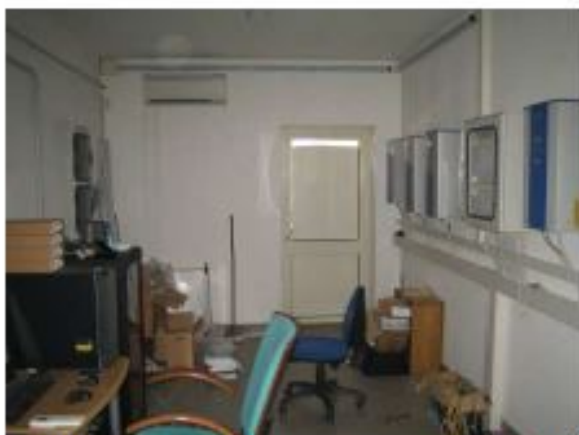
Foto 13, Sala di controllo dell'impianto fotovoltaico al Piano Terra

Fabbricato (H) Piano Terra 540,99 mq; Piano Primo 231,84 mq;