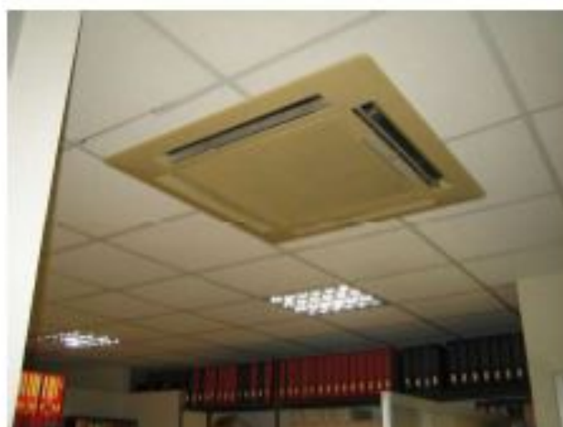
Foto 12, Unità di riscaldamento e raffreddamento a soffitto