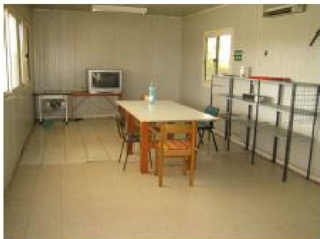
Foto 5, Vista interna