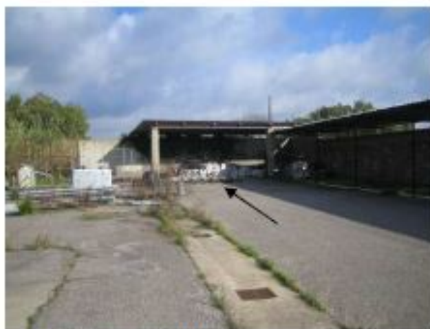
Foto 2, Vista esterna tettoia 1