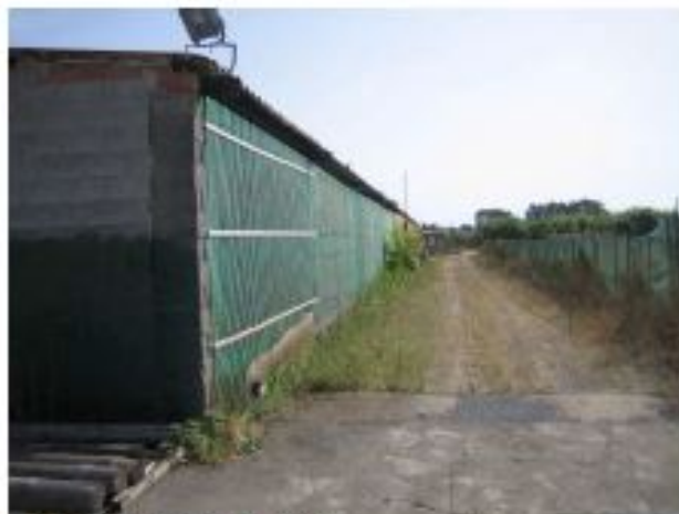
Foto 12, Tettoia vista posteriore