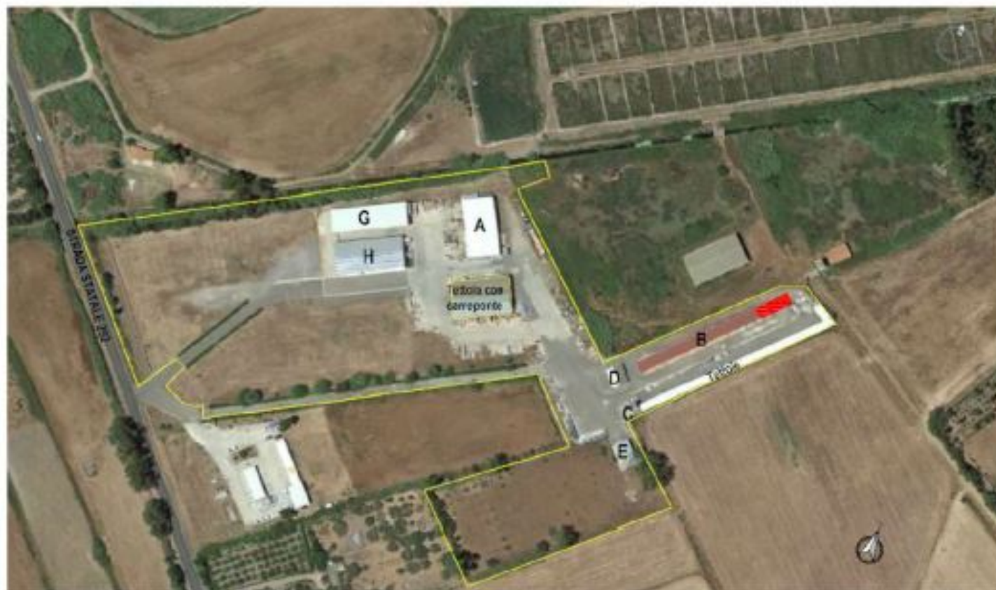
Foto 2, Vista aerea INDIVIDUAZIONE DEI FABBRICATI