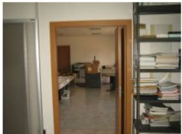
Foto 6, Vista interna dei locali