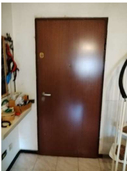
6) Vista dell'ingresso all'abitazione dall'interno;