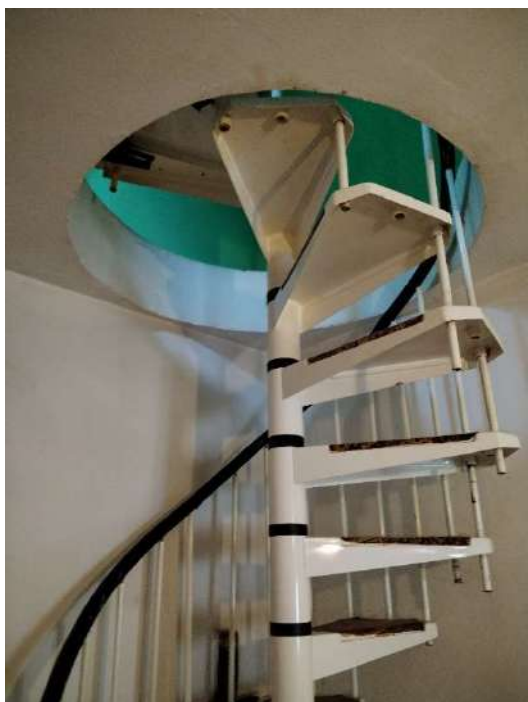
16) scala d'accesso al sottotetto;