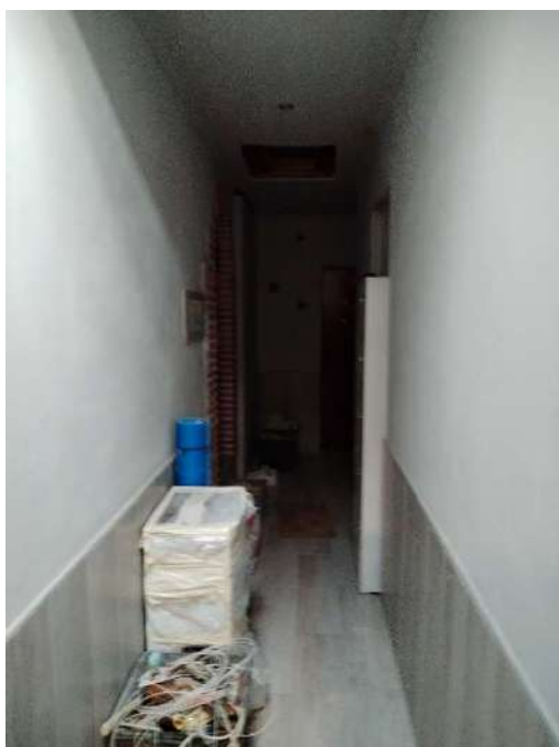
5) Corridoio d'accesso all'appartamento al secondo piano;