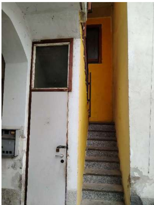
3) Scala d'accesso al ballatoio di distribuzione comune per raggiungere il secondo piano;