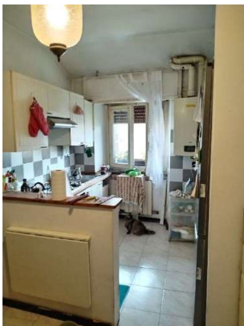
7) Vista dell'ingresso verso la cucina;