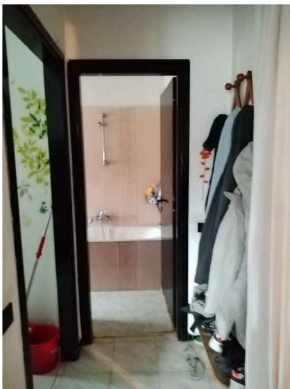
11) Vista della distribuzione bagno/ripostiglio;