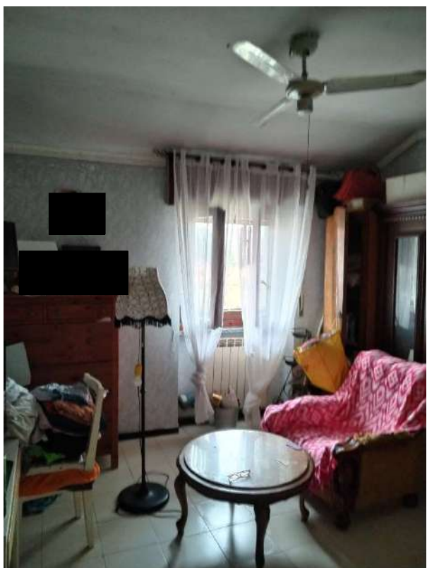
9) Vista della soggiorno;