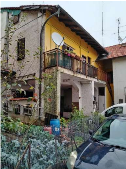
2) Vista laterale (da via S. Cosma) dell'abitazione del fabbricato dove è inserita l'unità immobiliare;