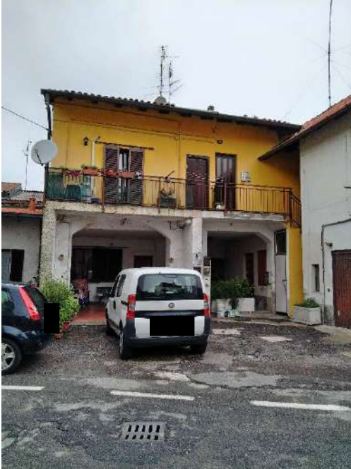
1) Vista Frontale dell'abitazione del fabbricato dove è inserita l'unità immobiliare;