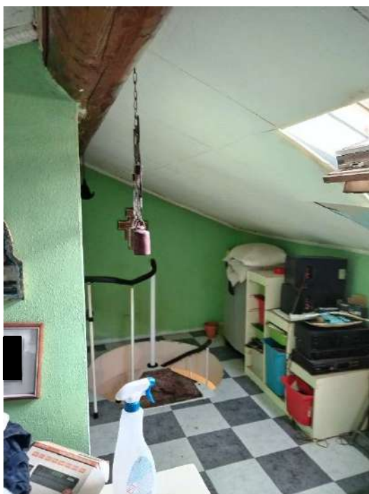
17) locali nel sottotetto;