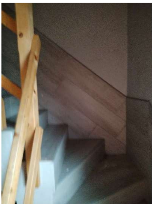
4) Scala d'accesso al ballatoio al secondo piano;