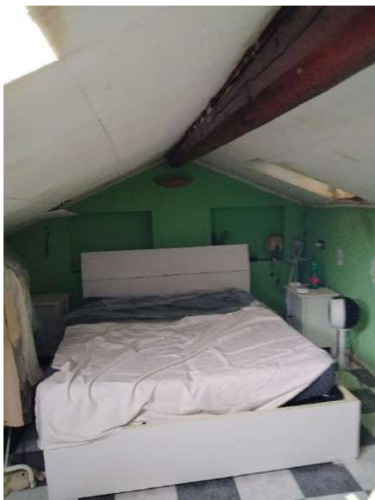
18) locali nel sottotetto;