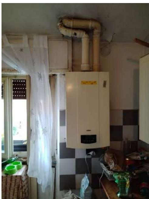
8) Vista della cucina dove è posizionata la caldaia;