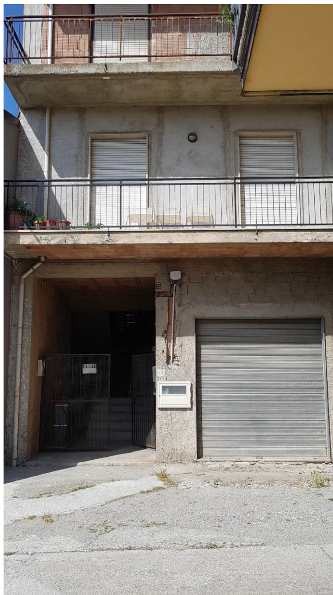
Foto N.2: Ingresso esterno del fabbricato dove ricade l'immobile oggetto di stima.