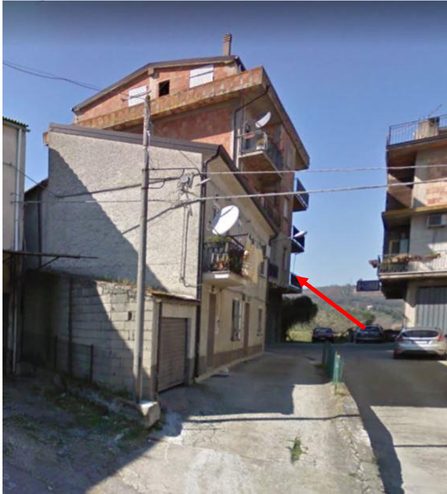
Foto N.1: Fabbricato dove ricadono gli immobili oggetto di stima.