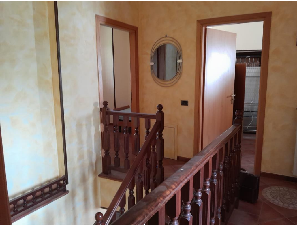
Foto 3 Interni