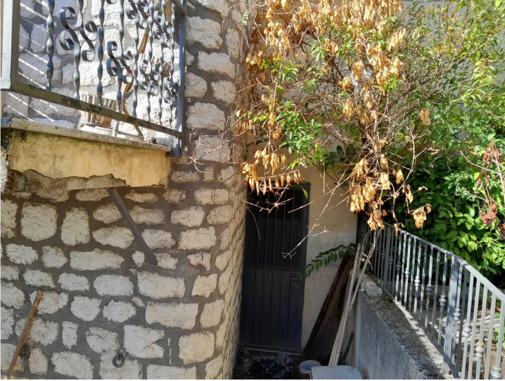
Foto 9 Accesso piano seminterrato