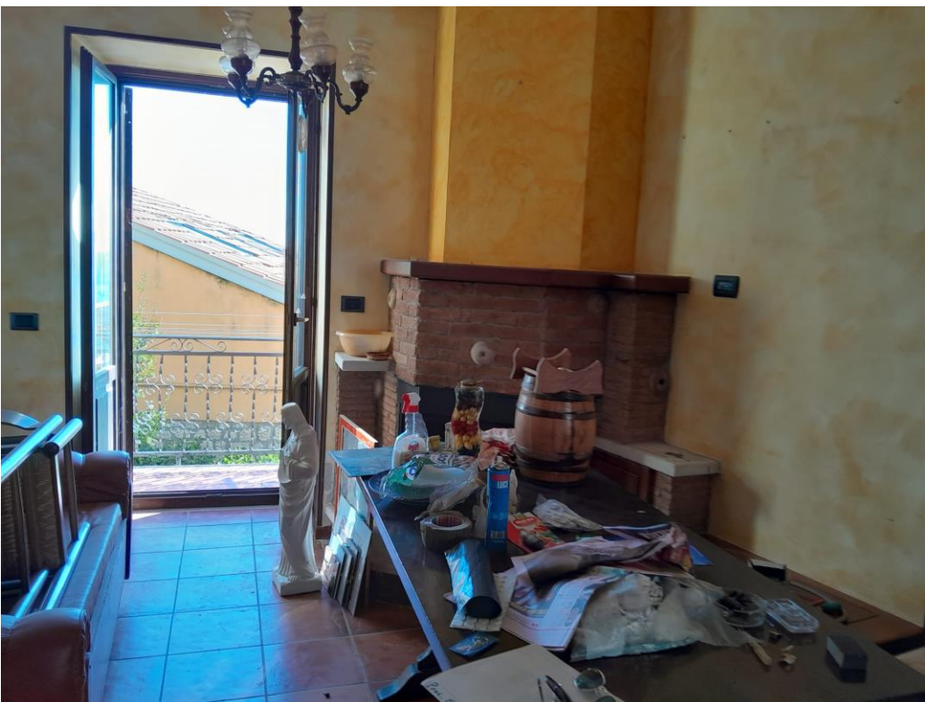
Foto 4 Interni