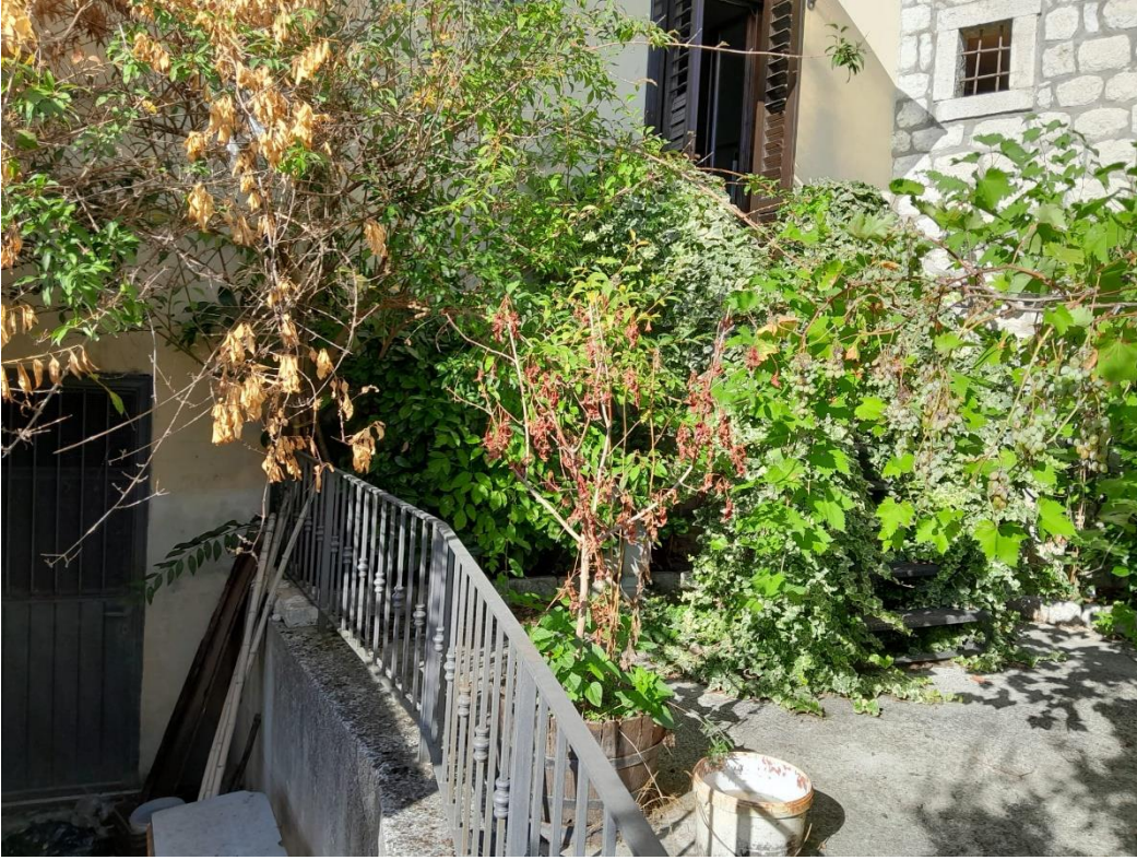
Foto 7 Corte esclusiva