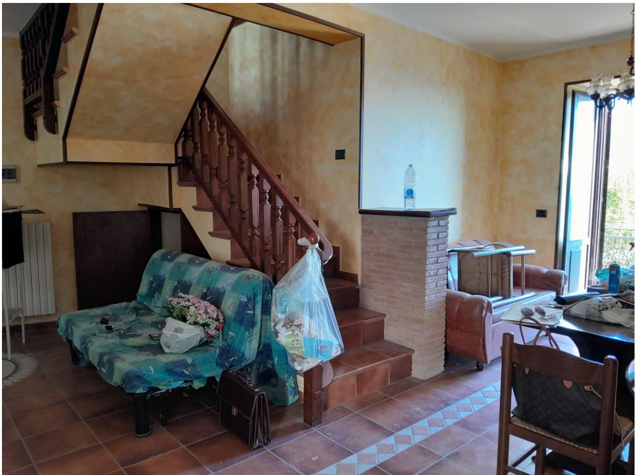
Foto 2 Interni