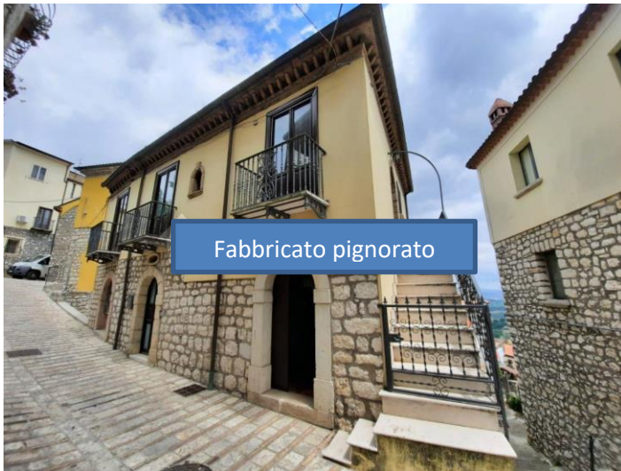
Foto 1 Fabbricato pignorato visto da via Curignale