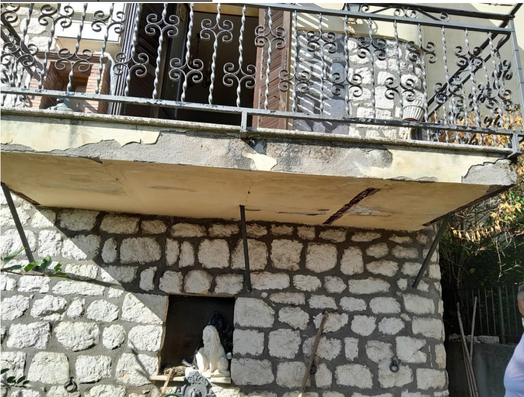
Balcone piano terra facciata laterale