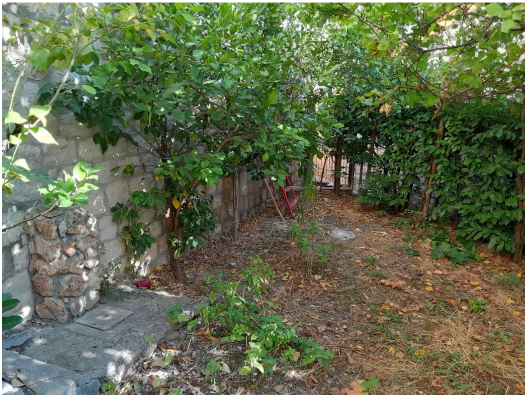
Foto 5 Corte esclusiva