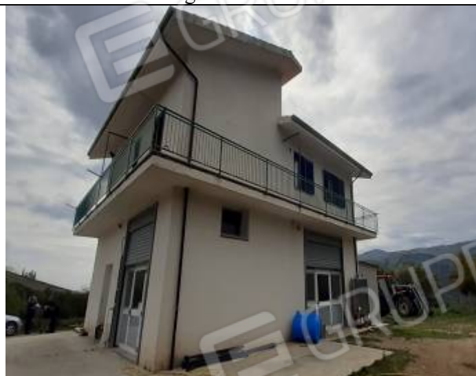
Vista esterna del complesso edilizio identificato come particella n° 306 del foglio n° 68