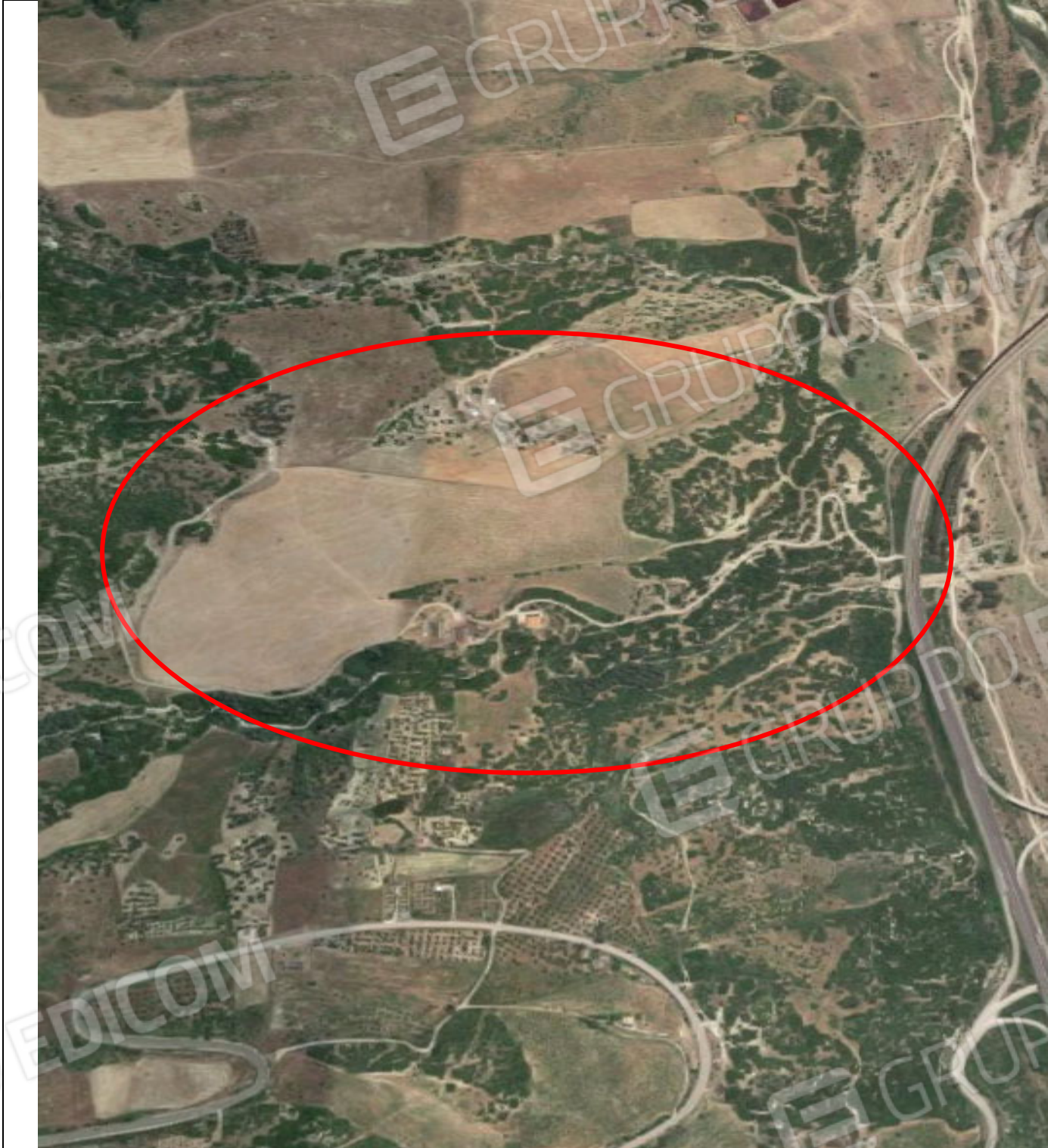
Veduta aerea del compendio immobiliare oggetto di esecuzione