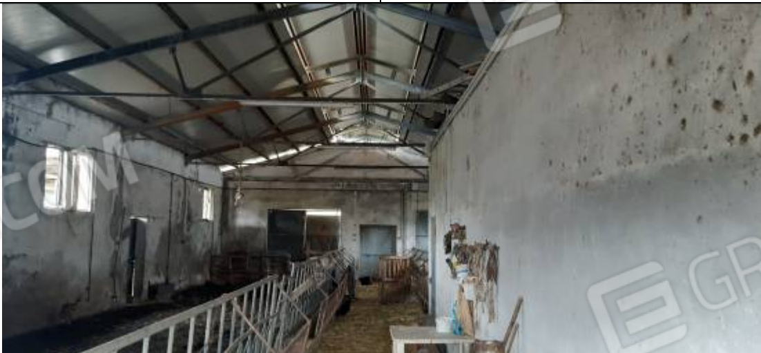
Unità immobiliare destinata a stalla – Particella n° 305/307, sub. 1