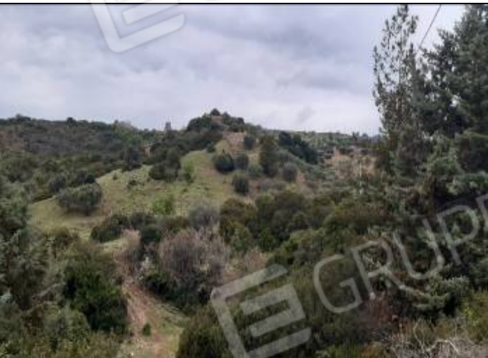
Vista dei terreni circostanti il complesso agricolo – Particelle varie - Foglio n° 68 e 75