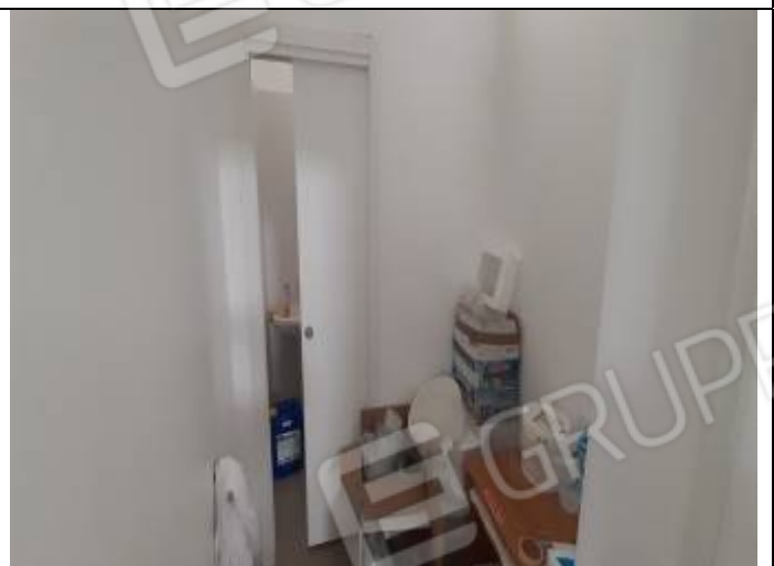
Unità al piano terra del complesso edilizio – Particella n° 306, sub. 4 e 5