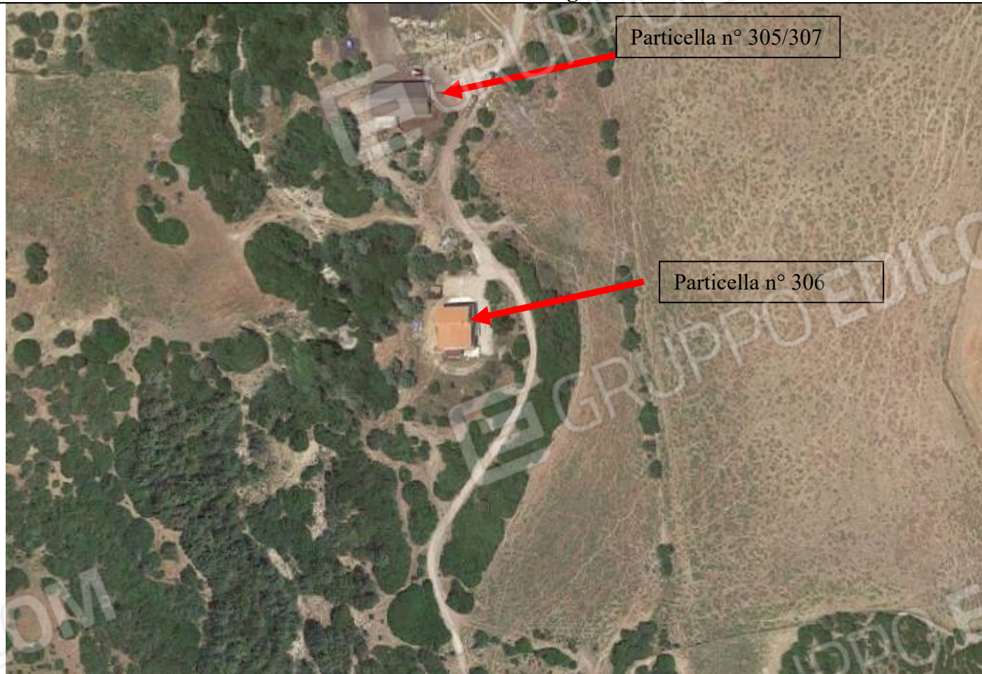
Veduta aerea delle particelle n° 306 – 305/307 del foglio n° 68