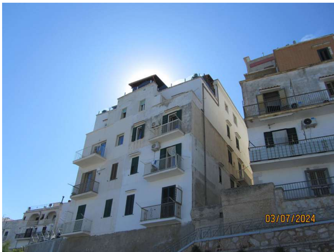
FOTO N. 2 – VISTA DEL PORTONE D'INGRESSO CONDOMINIALE SU VIA CAPPUCCINI.