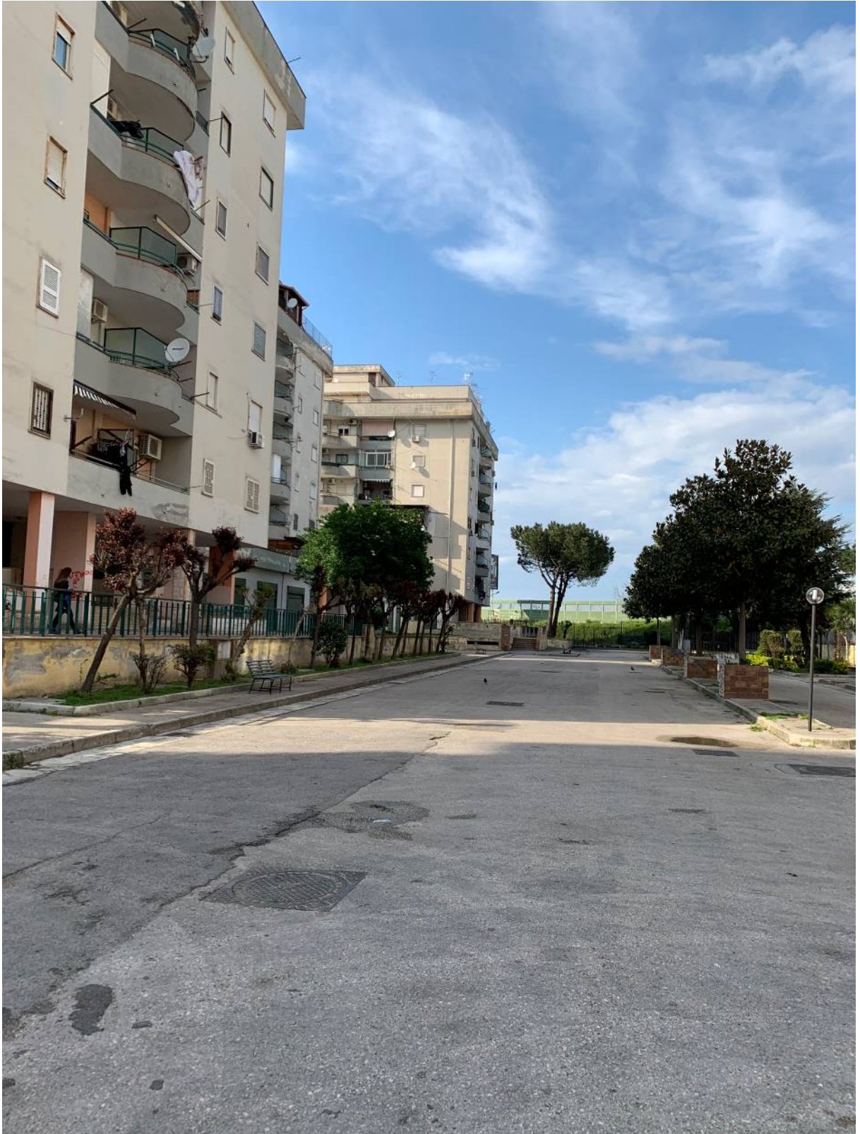
Vista dal viale condominiale del Parco