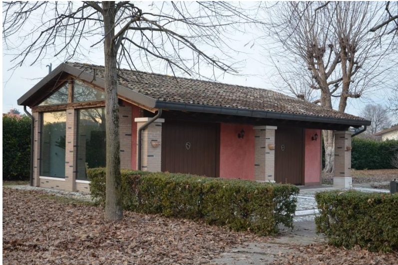
Edificio catastalmente identificato come disbrigo e individuato nella scheda con il sub 2

Si tratta di un edificio non visionato internamente, con tipologia simile al precedente immobile descritto e individuato con il sub 3, a un piano fuori terra con pianta rettangolare con dimensioni esterne di ml 5.80 x ml. 10.80 circa, tetto a due falde con copertura in coppi e lattonerie in rame, porticato sul fronte est con profondità di circa 140 cm, il portico è costituito da tre pilastri con dimensione 50 cm x 50 cm con finitura in mattoni pieni in laterizio con faccia a vista, le travature del tetto sono a vista dal portico. Altezza misurata in corrispondenza del colmo, sotto trave ml 3.97 e in corrispondenza dell'angolo sud est ml 3.04 (sotto al portico).