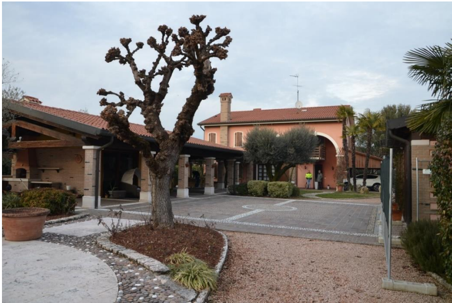
Vista da sud di parte del compendio immobiliare con aree esterne pavimentate

L'area esterna è in parte pavimentata con lastre di trachite, cubetti di porfido, ciottoli di fiume che formano disegni geometrici, camminamenti e spazi pertinenziali all'edificio: lato est del garage, lato sud del garage con piazzetta pavimentata e camminamenti, fascia di collegamento tra abitazione e garage nella zona corrispondente al ex pergolato ora portico.