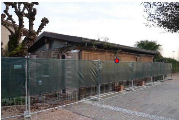
Edificio a garage porzione est in proprietà

Sul lato est della proprietà, lungo il confine, è indicata catastalmente e presente sul posto una porzione di edificio (sub 4) della quale non si è trovata traccia di autorizzazione edilizia, l'edificio risulta in gran parte realizzato su altra proprietà, non è stato possibile visionarlo internamente in quanto transennato.