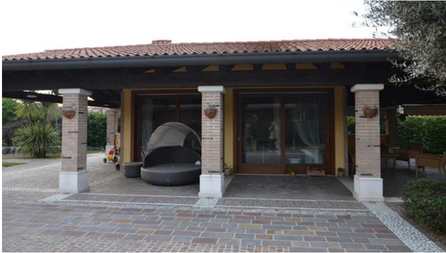
Lato est edificio autorizzato a garage sub 3 collegato con il pergolato all'abitazione

perimetrale in laterizio intonacato e tinteggiato, travi in legno a vista, pilatri quadrati dimensioni 38 cm x 38 cm con finitura in mattoni in laterizio con faccia a vista, nel prospetto ovest sono presenti tre finestre protette da oscuri in legno. Si tratta di un edificio autorizzato a garage ma utilizzato a dependance con bagno, e predisposizione per cucina esterna lato sud, l'altezza autorizzata è pari a ml 2.50.