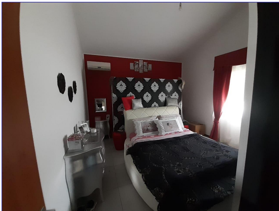
Foto 41 – Imm. 2 – Camera da letto con in fondo condizionatore quale sistema di riscaldamento dell'appartamento insieme alla stufa posta nel vano soggiorno.