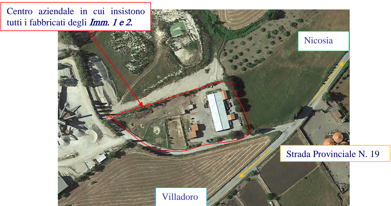
Foto 2 – Vista satellitare ingrandita con individuazione sia del centro aziendale dove sono ubicati i fabbricati, la corte esterna e l'area incolta ed individuazione della Strada Provinciale N. 19, limitrofa allo stesso centro aziendale.