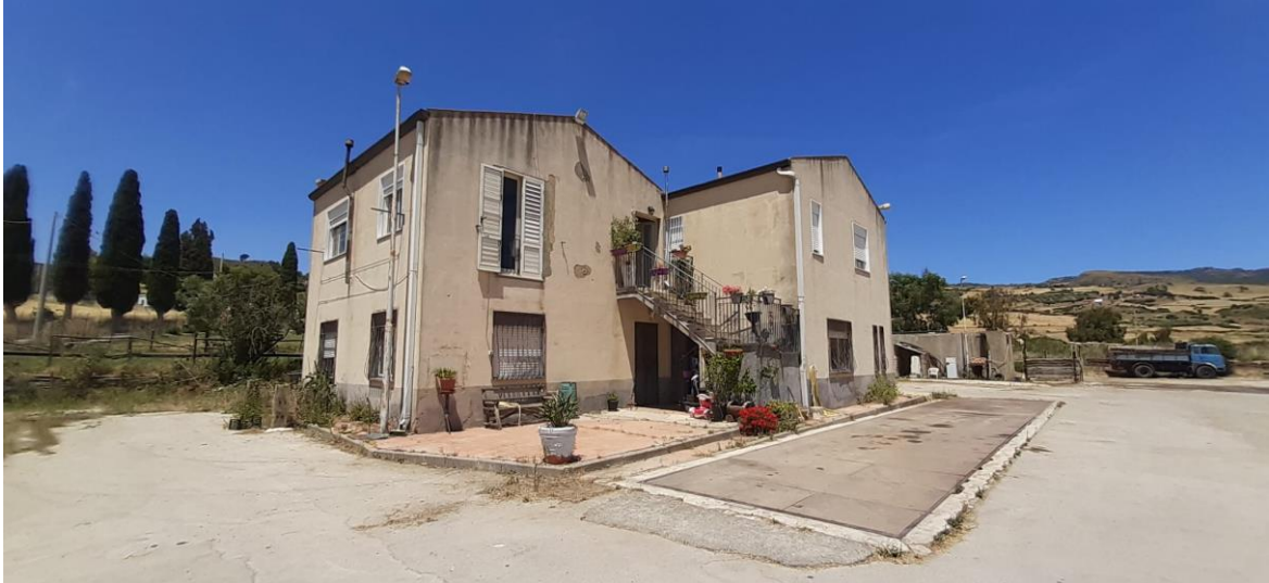
Foto 34 – Imm. 1 – Corte esterna da collegamento tra il fabbricato su due elevazioni in cui si ha l'ufficio e l'appartamento, la pesa a ponte e la vasca di accumulo d'acqua, oltre ai locali stalla e magazzini.