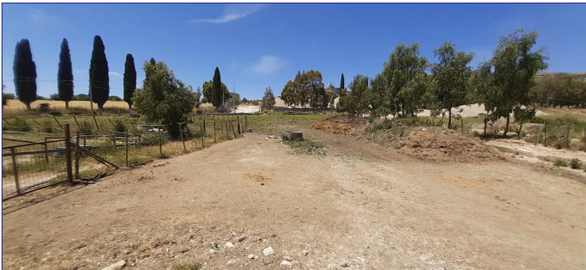
Foto 35 – Imm. 1 – Area incolta limitrofa alla corte facente parte del lotto dell'Imm. 1, racchiusa da opportuna recinzione con paletti in ferro e rete romboidale a maglie strette.