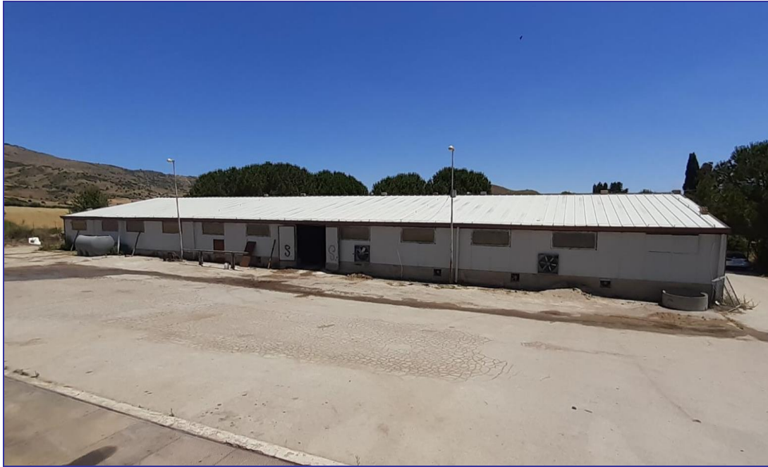
Foto 5 - Imm. 1 - Prospetto principale della stalla.