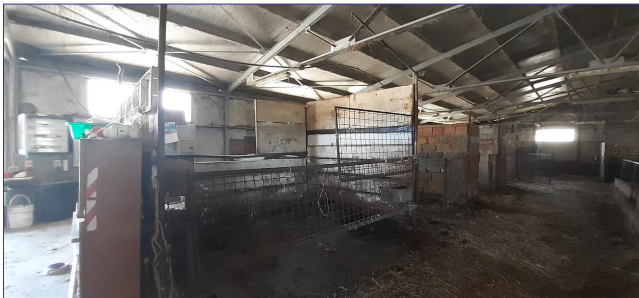
Foto 14 – Imm. 1 – Immagine di alcune partizioni interne alla stalla per la creazione di box.