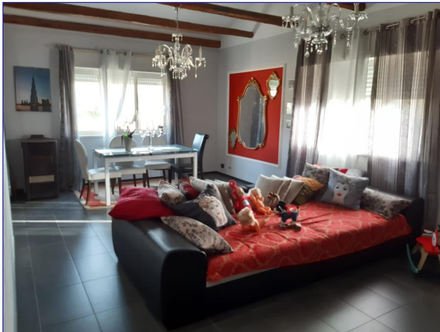
Foto 39 – Imm. 2 - Vista del soggiorno con in fondo la stufa a pellet presente quale sistema di riscaldamento dell'intero appartamento insieme al condizionatore posto nella camera da letto.