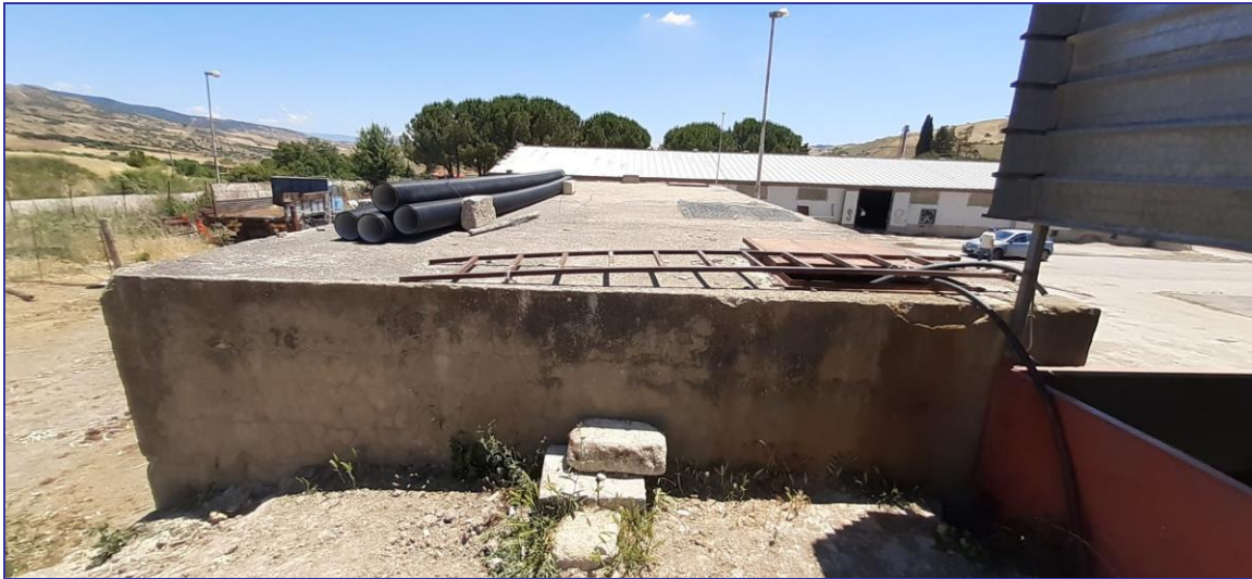
Foto 28 – Imm. 1 – Vasca di accumulo in calcestruzzo da mc. 112,00