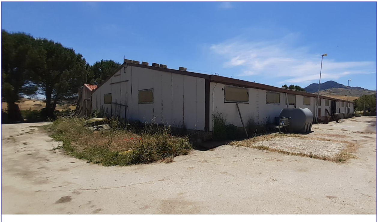
Foto 6 - Imm. 1 - Stalla con adiacente spazio non pavimentato per concimaia.