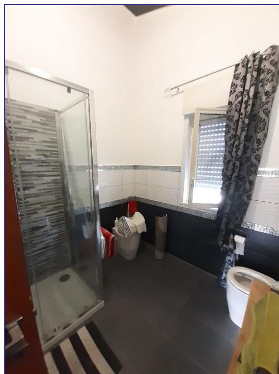
Foto 44 – Imm. 2 - Vista interna del bagno interno all'appartamento.