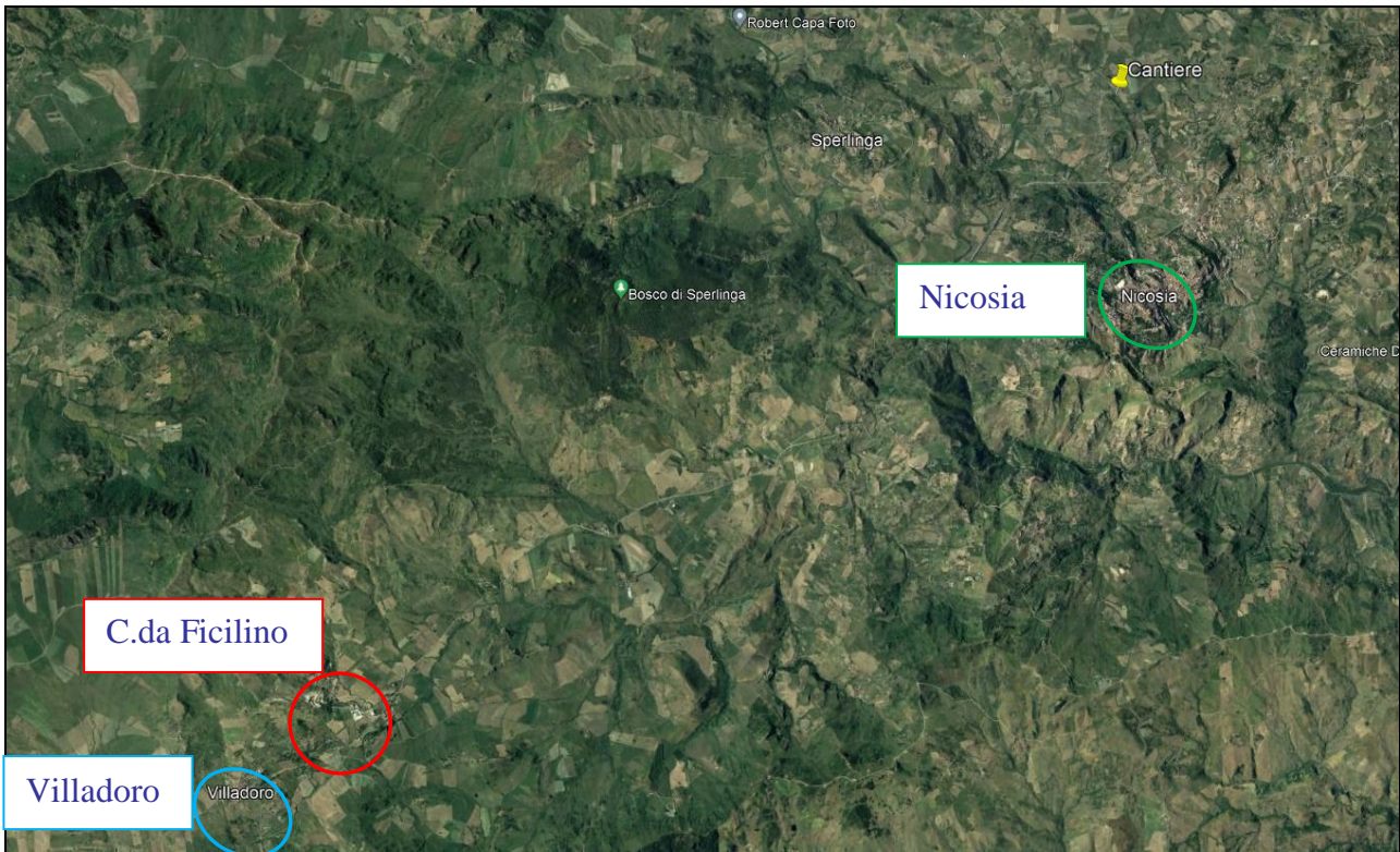
Foto 1 – Vista satellitare della C.da Ficilino sul territorio di Villadoro frazione del comune di Nicosia con individuazione sia del centro abitato di Villadoro che di Nicosia.