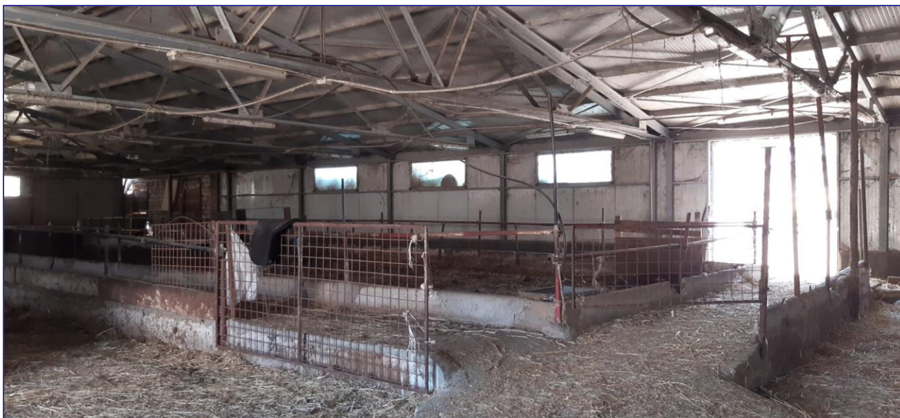
Foto 13 – Imm. 1 – Parte interna alla stalla in cui si hanno le mangiatoie.