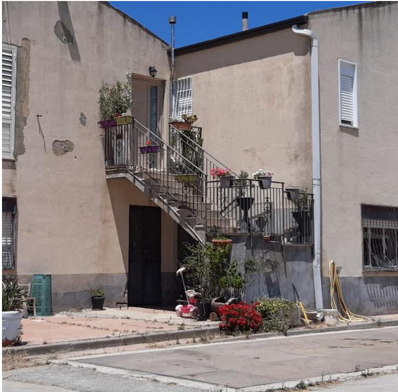
Foto 36 – Imm. 2 – Scala esterna di accesso all'appartamento posto al piano primo al di sopra degli uffici facenti parte dell'Imm. 1.