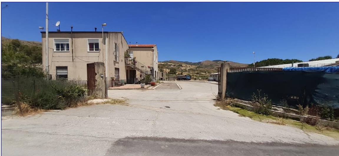
Foto 4 – Imm. 1 e Imm. 2 - Ingresso alla corte esterna che permette di raggiungere mediante la pavimentazione in conglomerato bituminoso tutti i fabbricati presenti e l'area incolta retrostante.