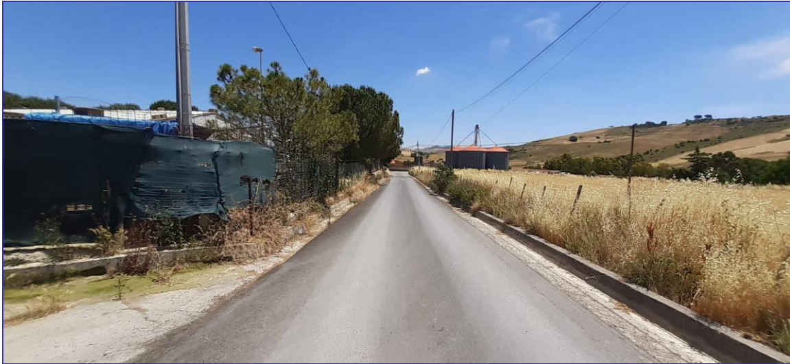
Foto 3 – Strada che permette di collegare i fabbricati oggetti di interesse con la Strada Provinciale N. 19

Immagine acquisite durante il sopralluogo del 17.07.2021