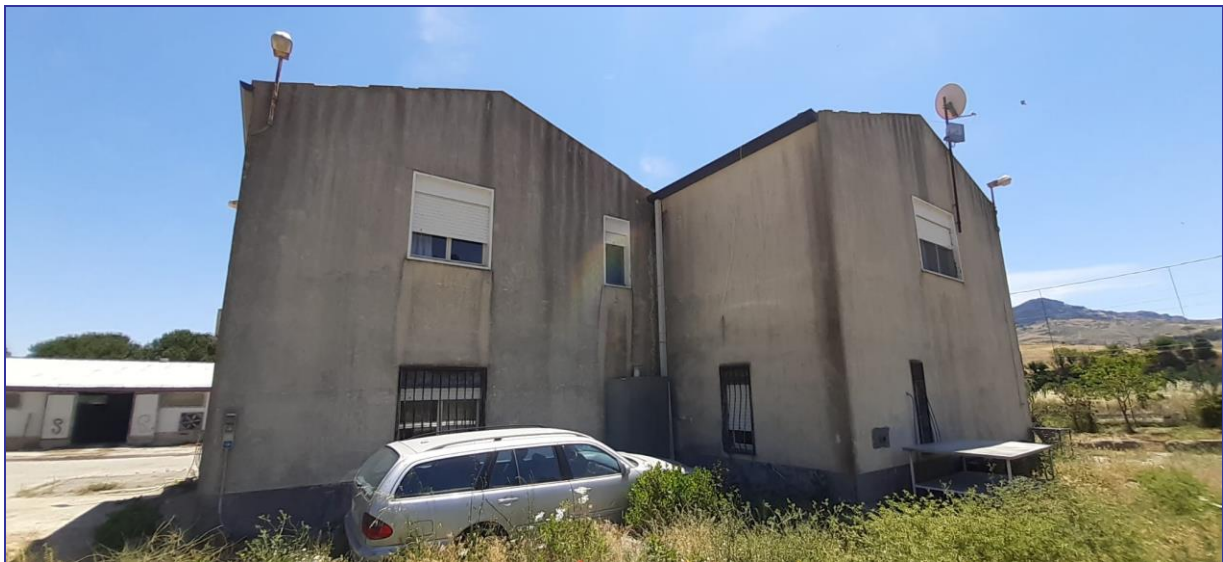
Foto 23 – Imm. 1 – Imm. 2 – Retrospetto fabbricato ufficio piano terra ed appartamento piano primo.