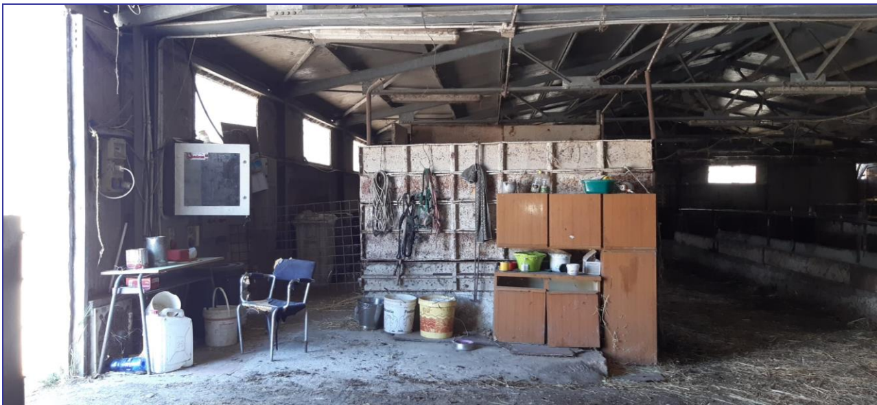
Foto 12 – Imm. 1 – Parte interna della stalla dove si hanno le mangiatoie e dei locali box.