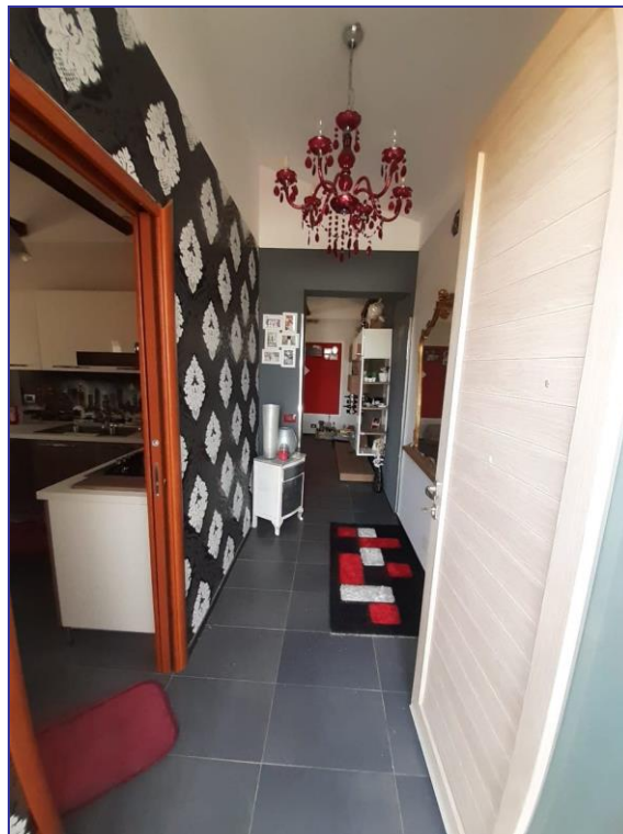
Foto 37 – Imm. 2 – Ingresso appartamento piano primo con distribuzione ai vari vani interni.