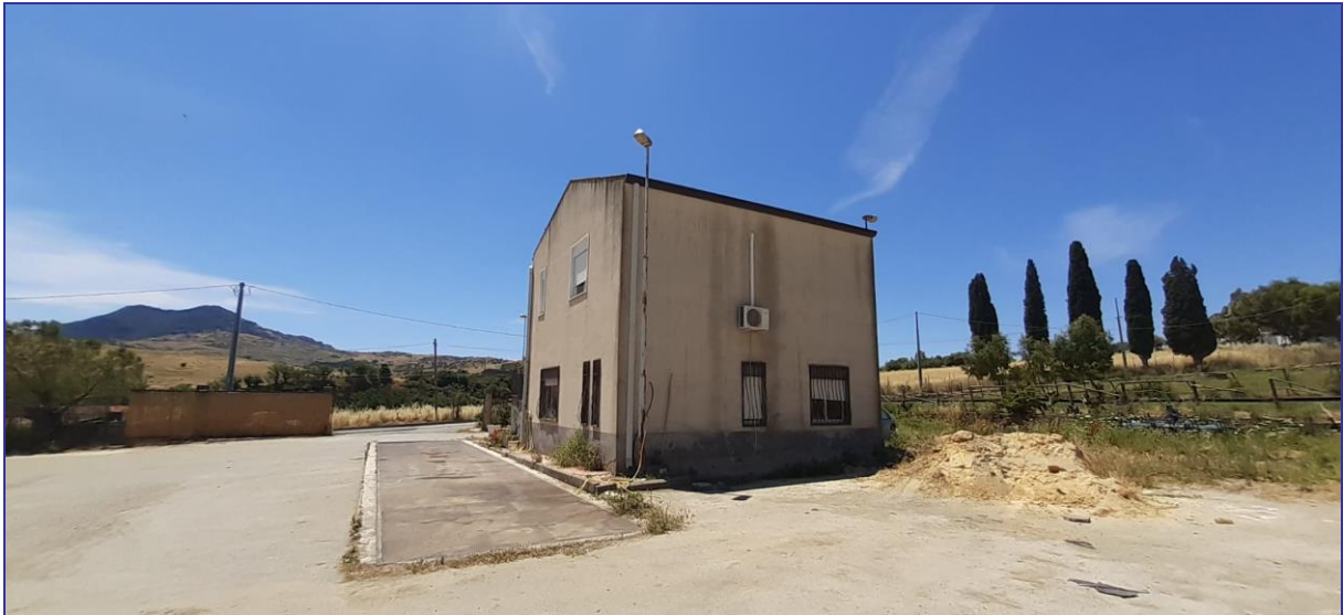
Foto 22 – Imm. 1 – Imm. 2 - Vista laterale dell'immobile verso la parte interna della corte.