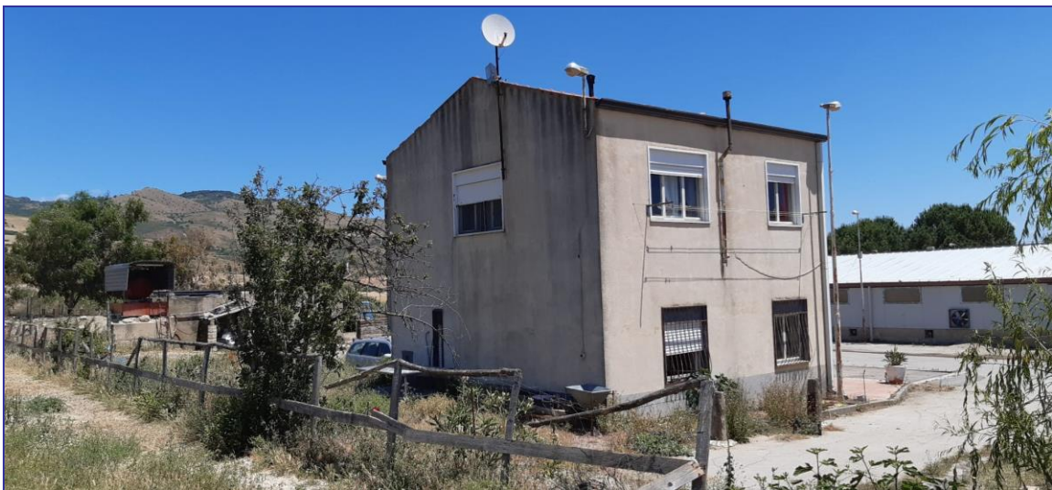
Foto 21 – Imm. 1 – Prospetto laterale in affaccio all'accesso al lotto.