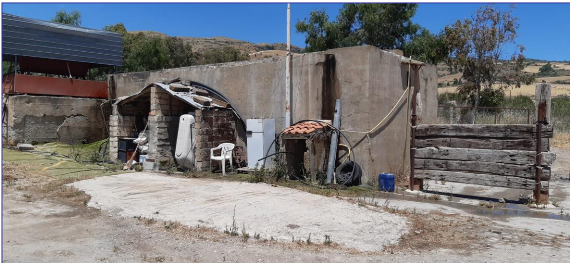
Foto 29 – Imm. 1 – Altra vista della vasca di accumulo all'interno della corte esterna, davanti all'accesso al lotto.