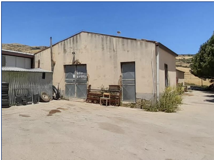
Foto 17 – Imm. 1 – Immagine del magazzino 2 non collegato con la limitrofa stalla.