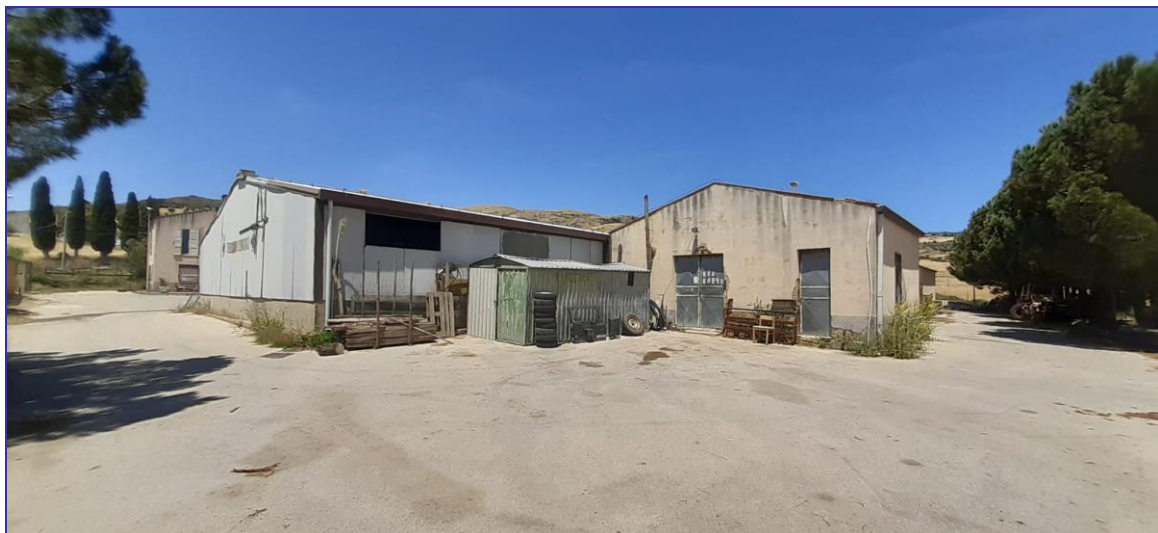
Foto 8 – Imm. 1 - Immagine dell'altro prospetto laterale con adiacente magazzino con accessi indipendenti dalla stalla.