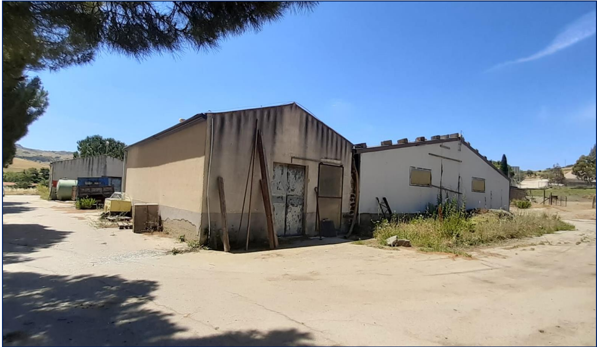
Foto 7 – Imm. 1 – Prospetto laterale della stalla con adiacenti i magazzini.