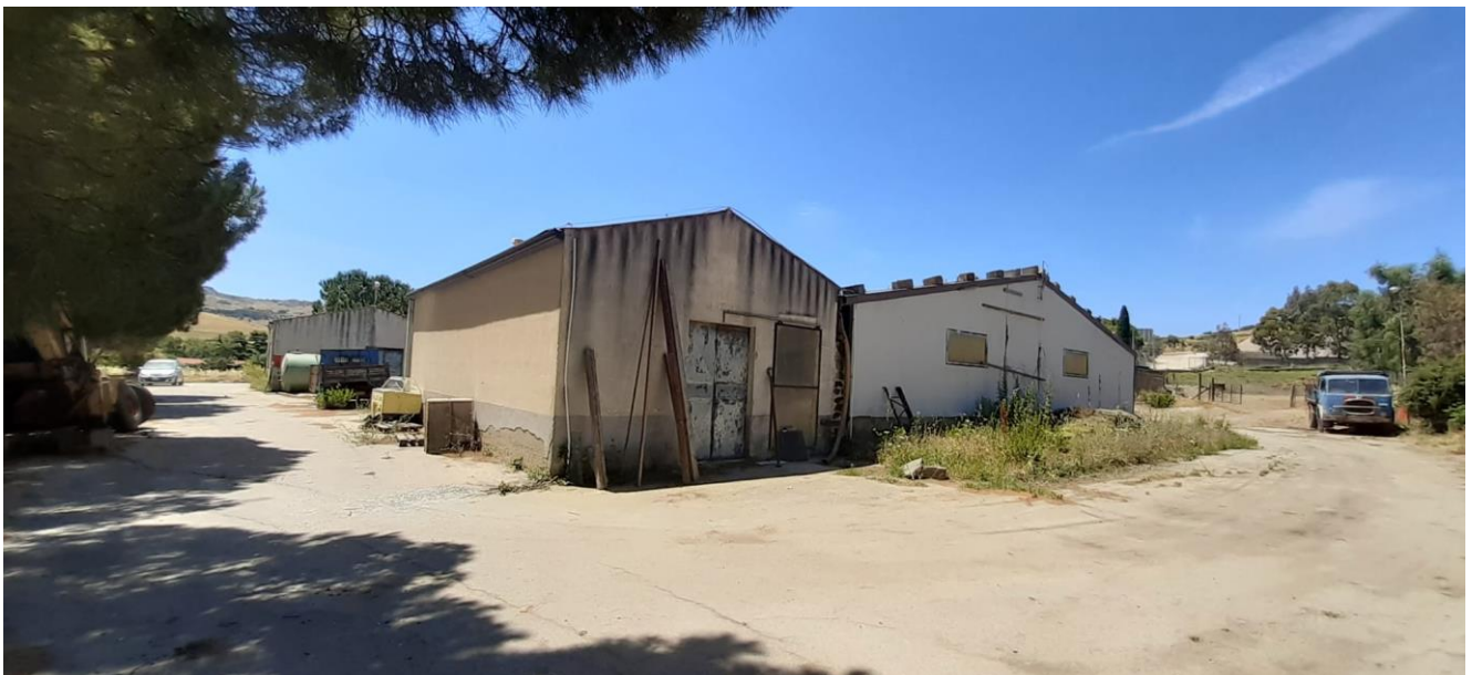
Foto 33 – Imm. 1 – Immagine della corte esterna nella parte retrostante alla stalla da collegamento ai magazzini, sempre con pavimentazione in conglomerato bituminoso.