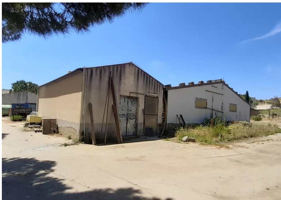
Foto 15 – Imm. 1 – Prospetti magazzino 1 adiacente alla stalla e collegati internamente tra loro.