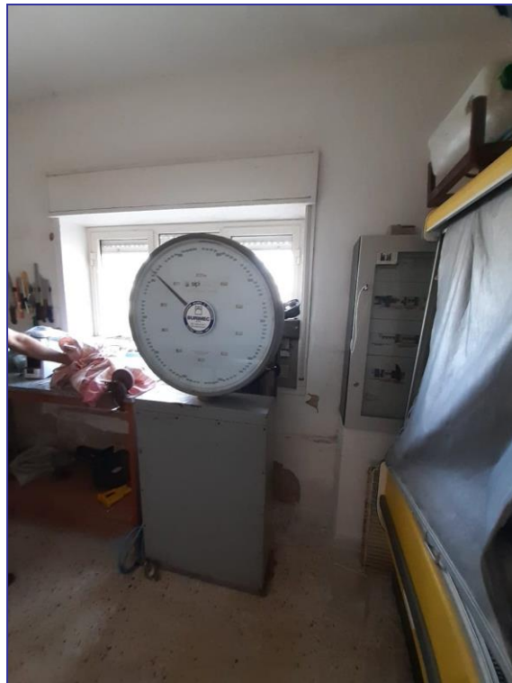
Foto 31 – Imm. 1 – Vista del misuratore pesa a ponte posto all'interno del locale ufficio.