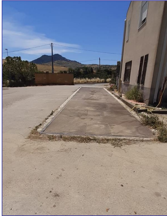
Foto 30 – Imm. 1 – Pesa a ponte da 900 quintali posta davanti il locale ufficio dove all'interno si ha il misuratore.