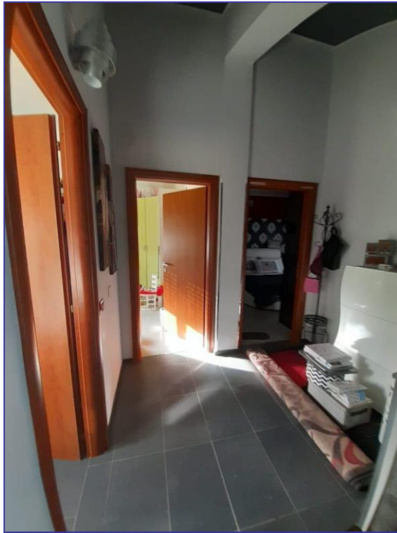
Foto 40 – Imm. 2 – Vista del disimpegno di accesso alle camere da letto, lavanderia e bagno.