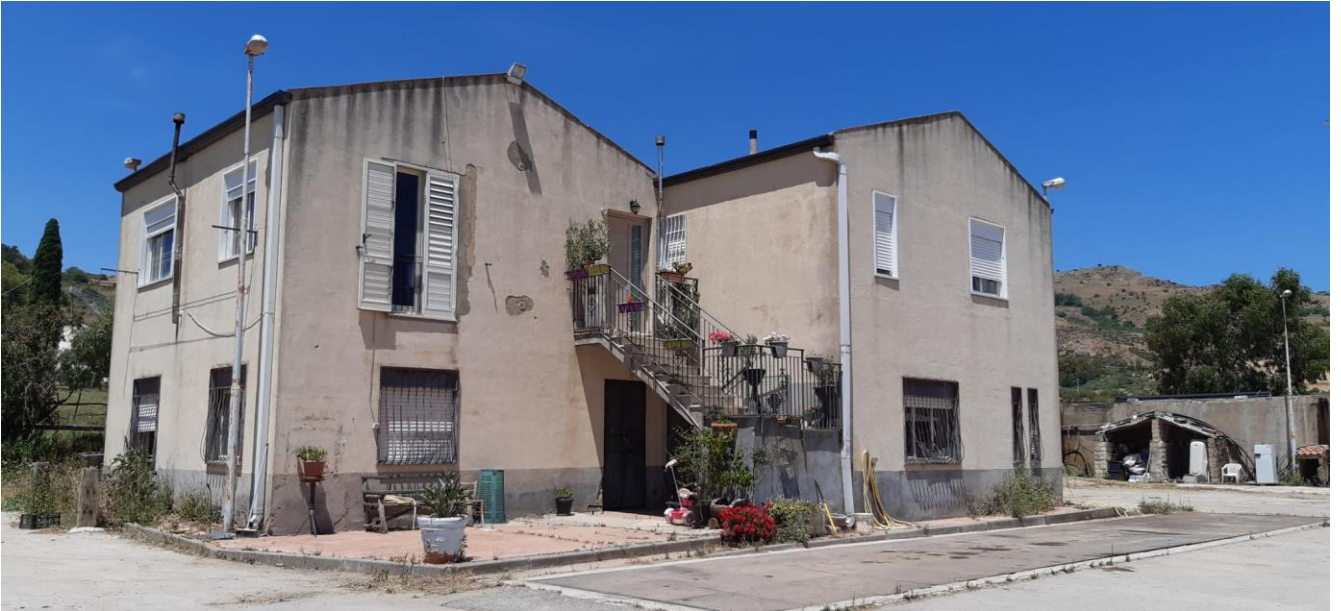
Foto 20 – Imm. 1 – Imm. 2 – Prospetto principale del fabbricato su due elevazioni in cui si ha al piano terra l'ufficio appartenente all'Imm. 1 ed al piano primo l'appartamento identificato quale Imm. 2.