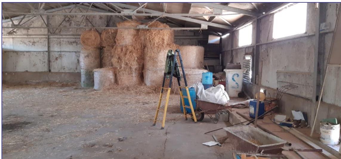
Foto 10 – Imm. 1 - Immagine dell'interno del locale stalla libero da divisione.