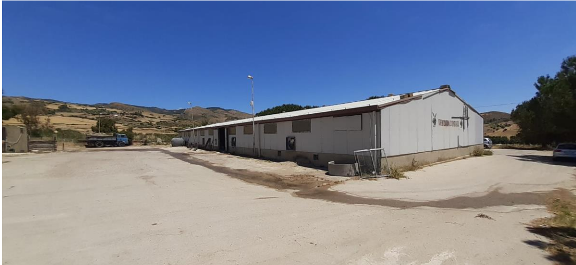
Foto 32 – Imm. 1 – Immagine della corte esterna dall'ingresso principale con pavimentazione in conglomerato bituminoso e con l'impianto di illuminazione esterna su pali.