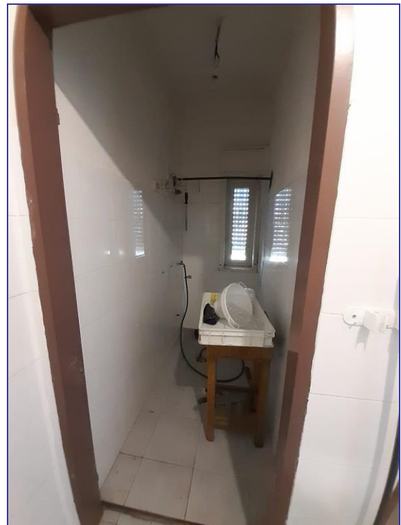
Foto 25 – Imm. 1 - Servizi interni all'immobile destinato ad uffici.