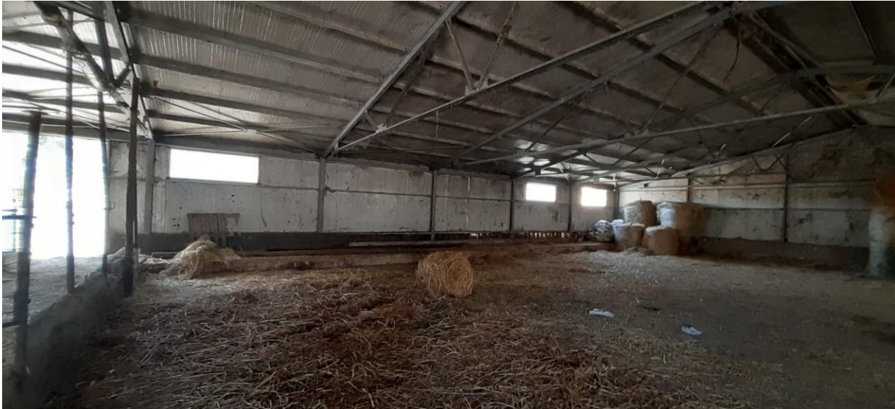
Foto 11 – Imm. 1 – Altra immagine dell'interno del locale stalla.