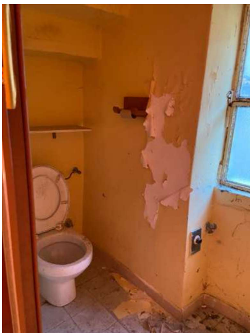
Wc piano primo