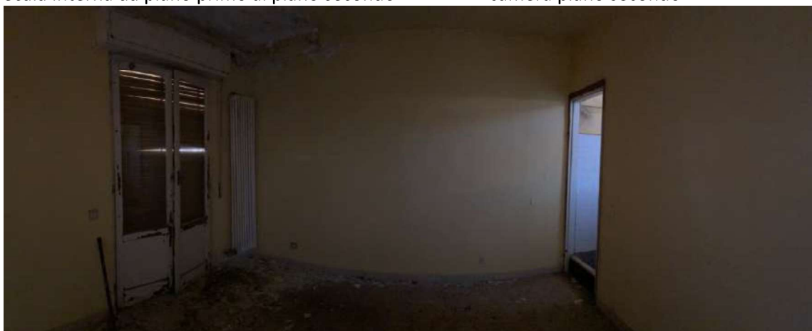
Camera piano secondo