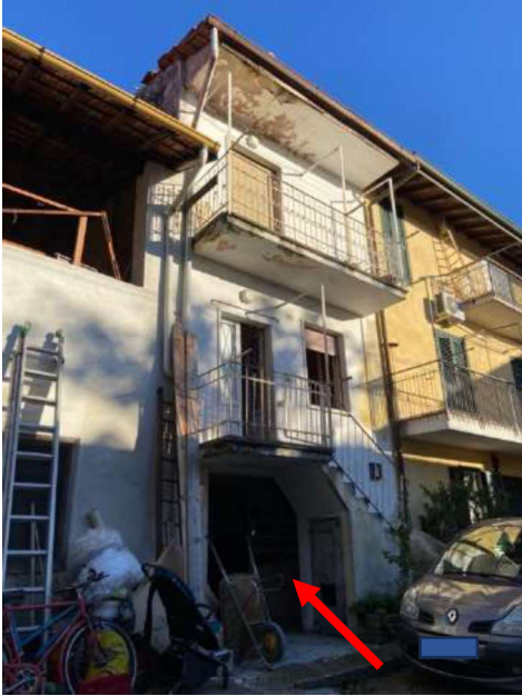
Accesso rustico piano terra