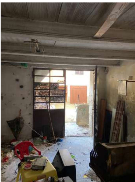
Rustico piano terra