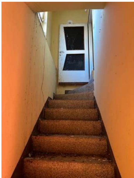
Scala interna da piano primo al piano secondo