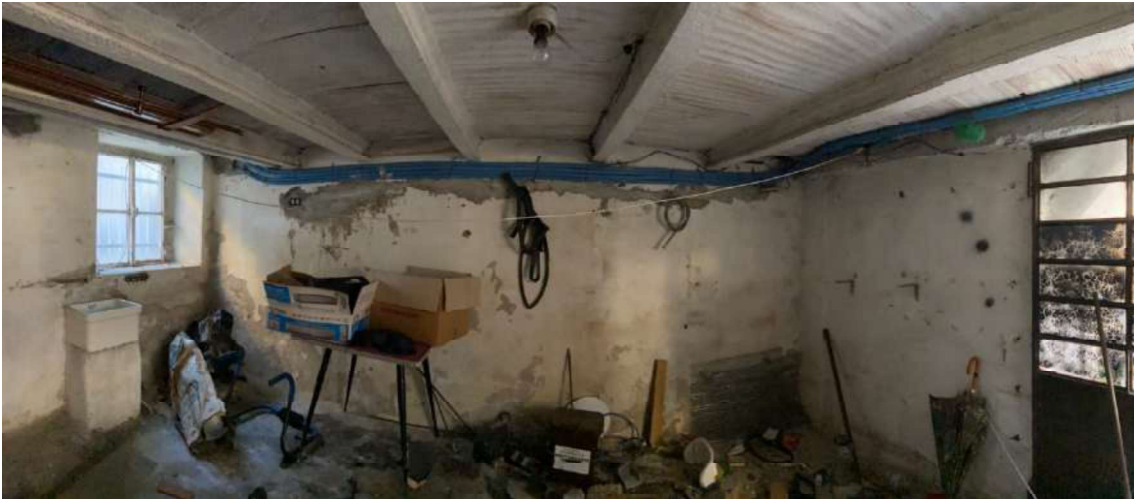
Rustico piano terra