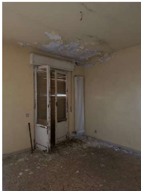
camera piano secondo