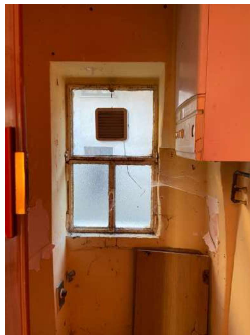
Wc piano primo caldaia