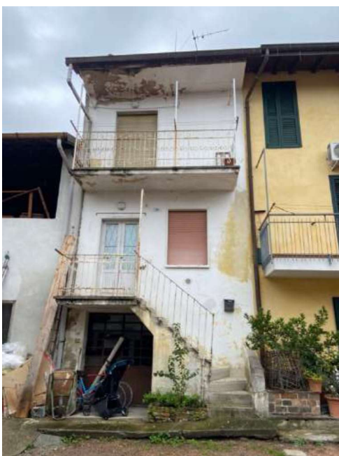
Unità immobiliare mapp.1129 sub.