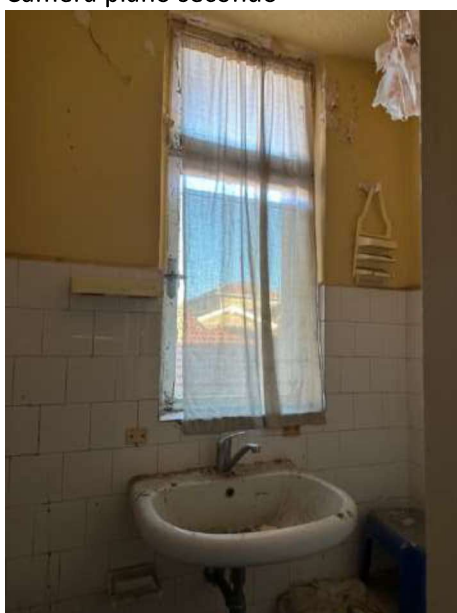
Servizio igienico piano secondo