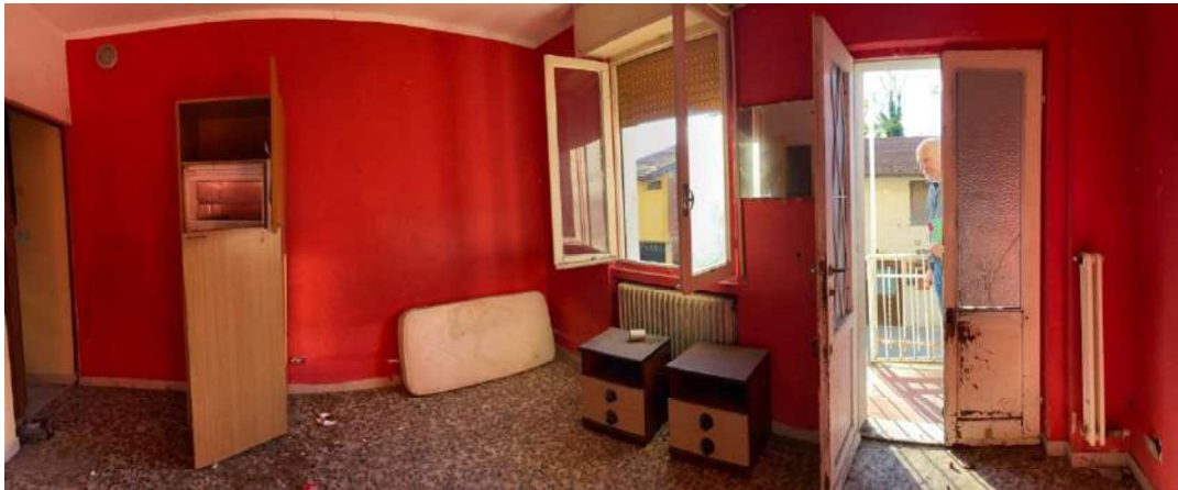
Piano primo cucina/soggiorno