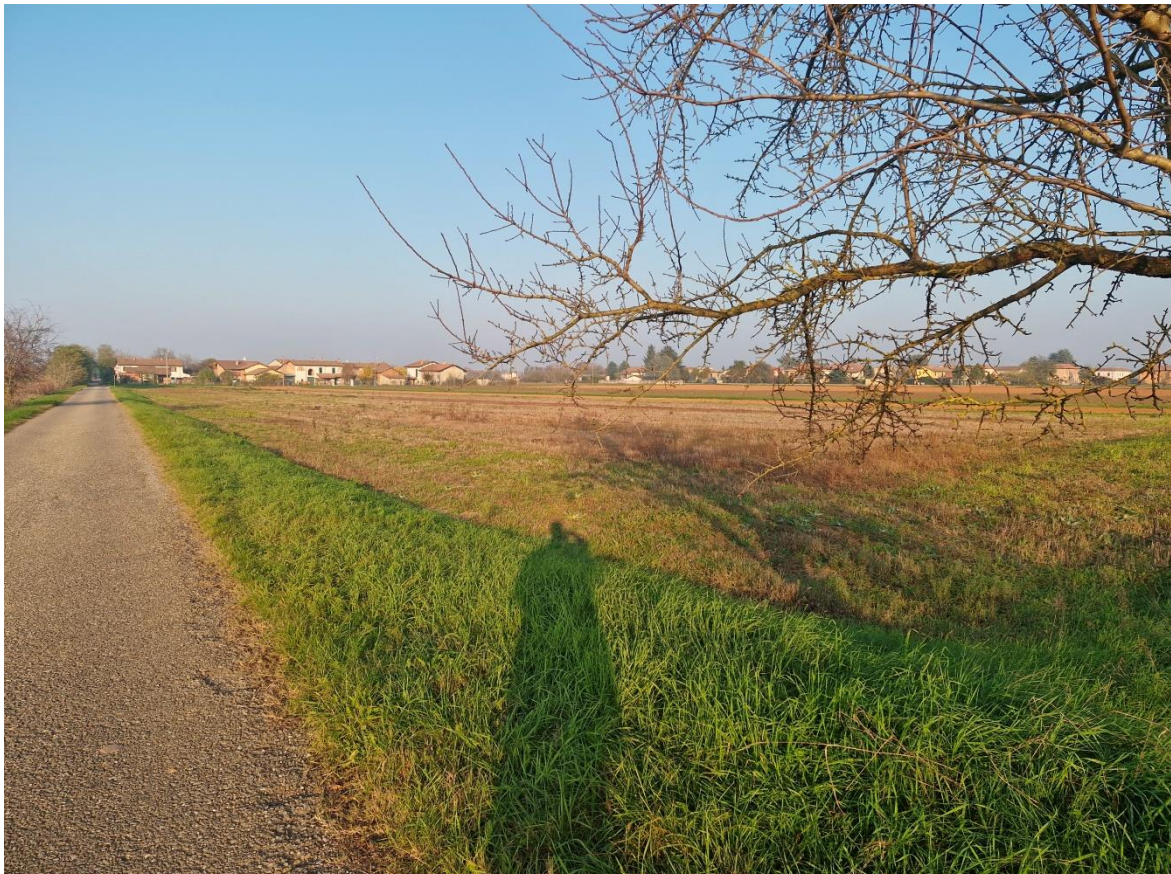
FOTO 12 – Terreno di cui al Mapp.le 149 – Vista lato Sud/Ovest – CORPO C