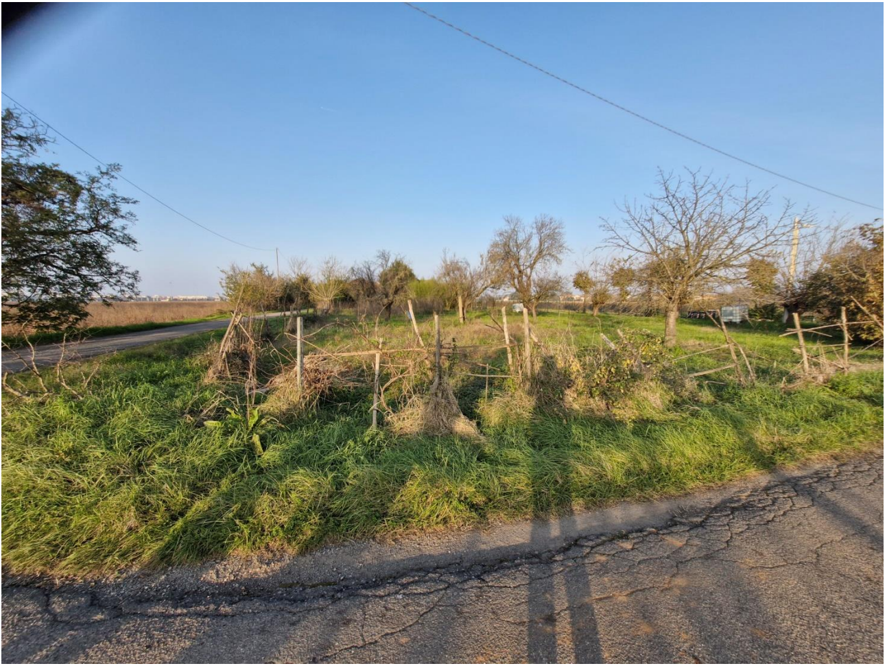
FOTO 13 – Terreno di cui al Mapp.le 151 – Vista lato Sud – CORPO C