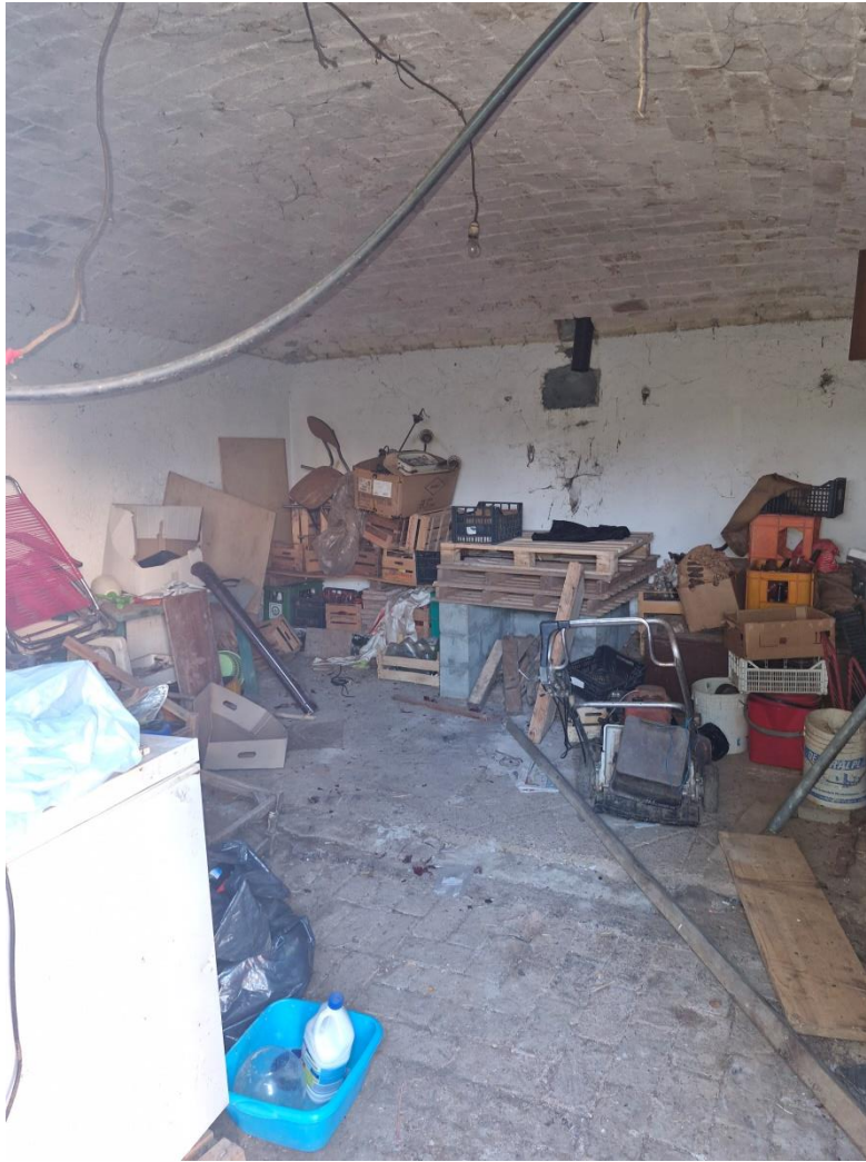
FOTO 5 – Interno locale pertinenziale ad uso sgombero sito al piano terra – CORPO A