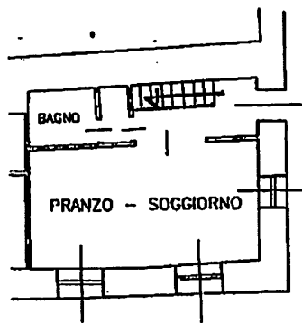
Piano Rialzato H. 2.50