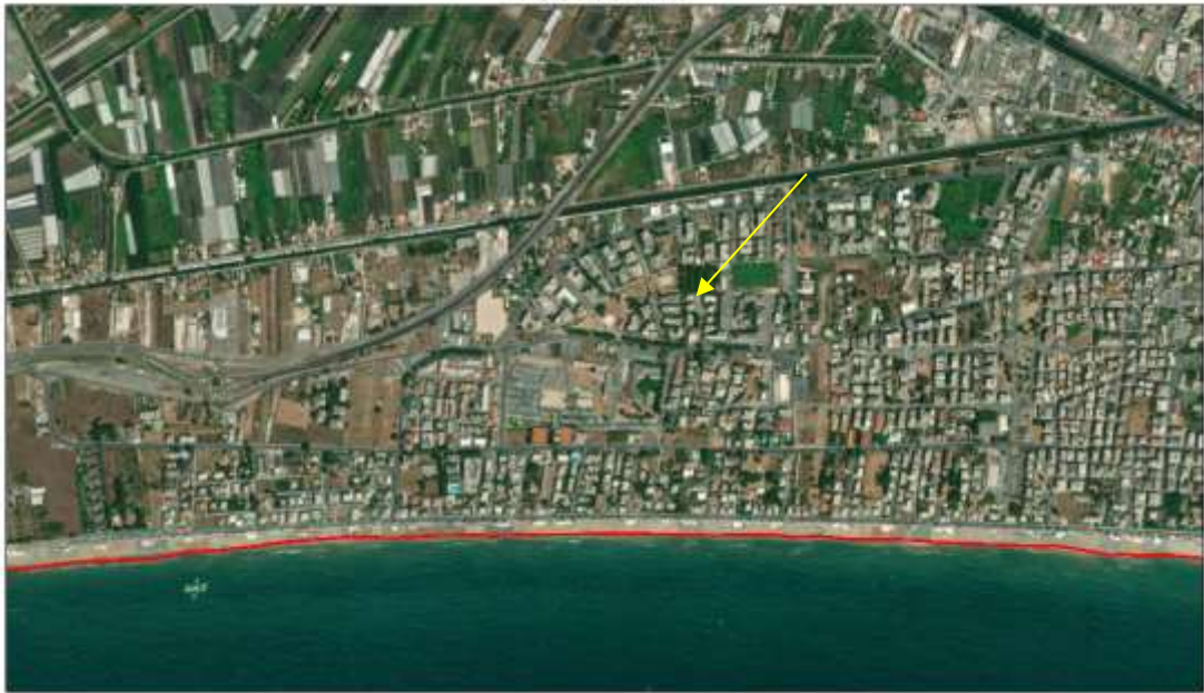
Figura 1 Vista aerea del Bene