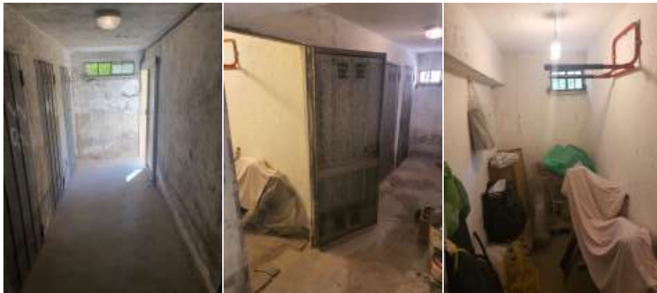
Figura 15 Locale cantina