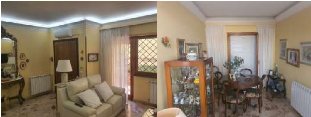
Figura 9 Soggiorno dell 'u.i. residenziale