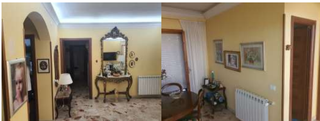
Figura 10 Soggiorno e ingresso bagno dell 'u.i. residenziale