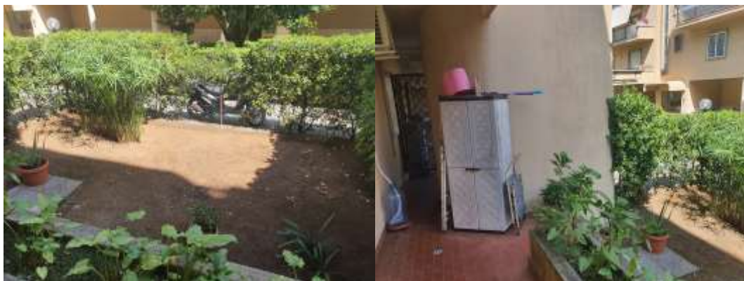
Figura 7 Vista zona tergaie dell 'u.i. residenziale e terrazzo a livello