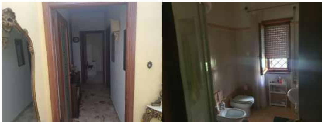
Figura 12 Accesso zona notte e servizio zona notte