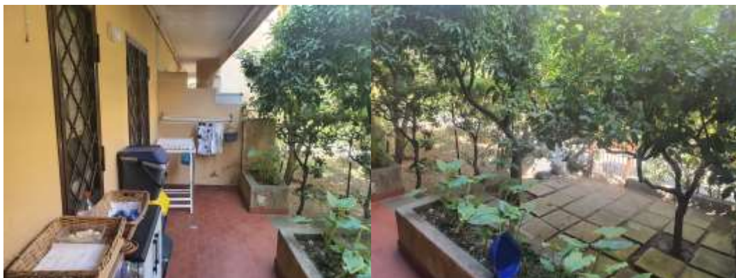
Figura 8 Vista zona tergaie dell 'u.i. residenziale e terrazzo a livello