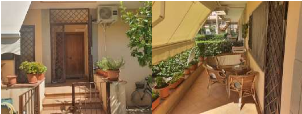
Figura 5 Vista ingresso 'u.i. residenziale e terrazzo a livello