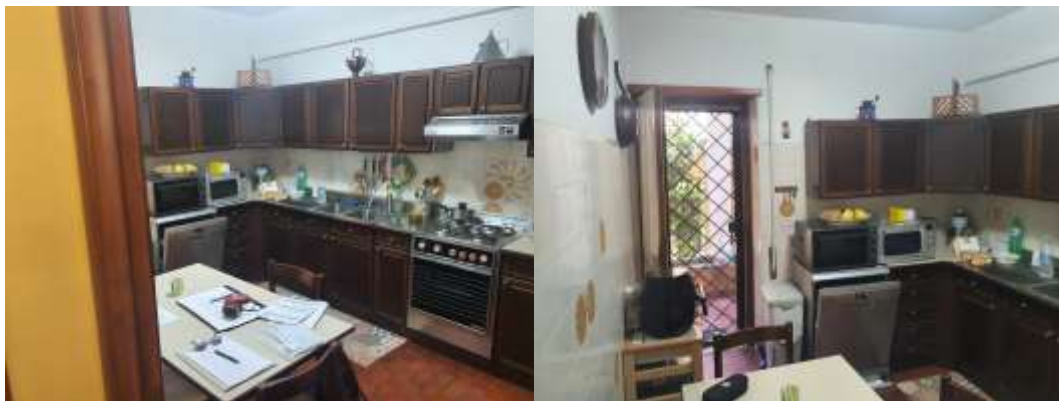
Figura 11 Cucina dell 'u.i. residenziale