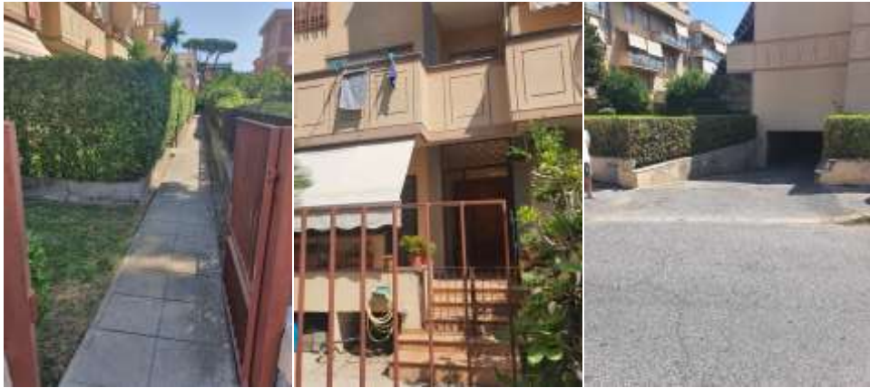
Figura 17 Accessi pedonali e carrabili dalla via Pitagora