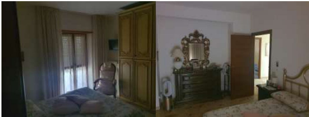
Figura 14 Stanza matrimoniale