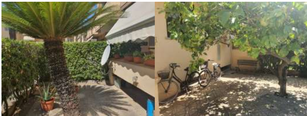
Figura 6 Vista ingresso 'u.i. residenziale e terrazzo a livello