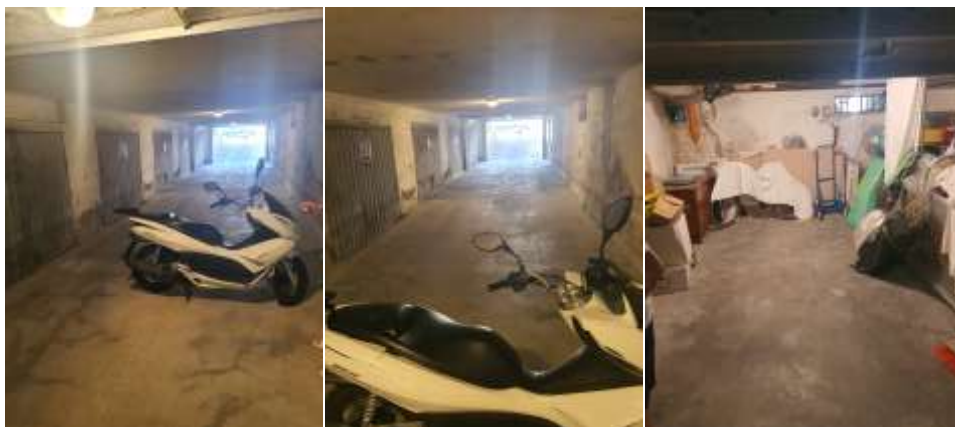
Figura 16 Locale box auto