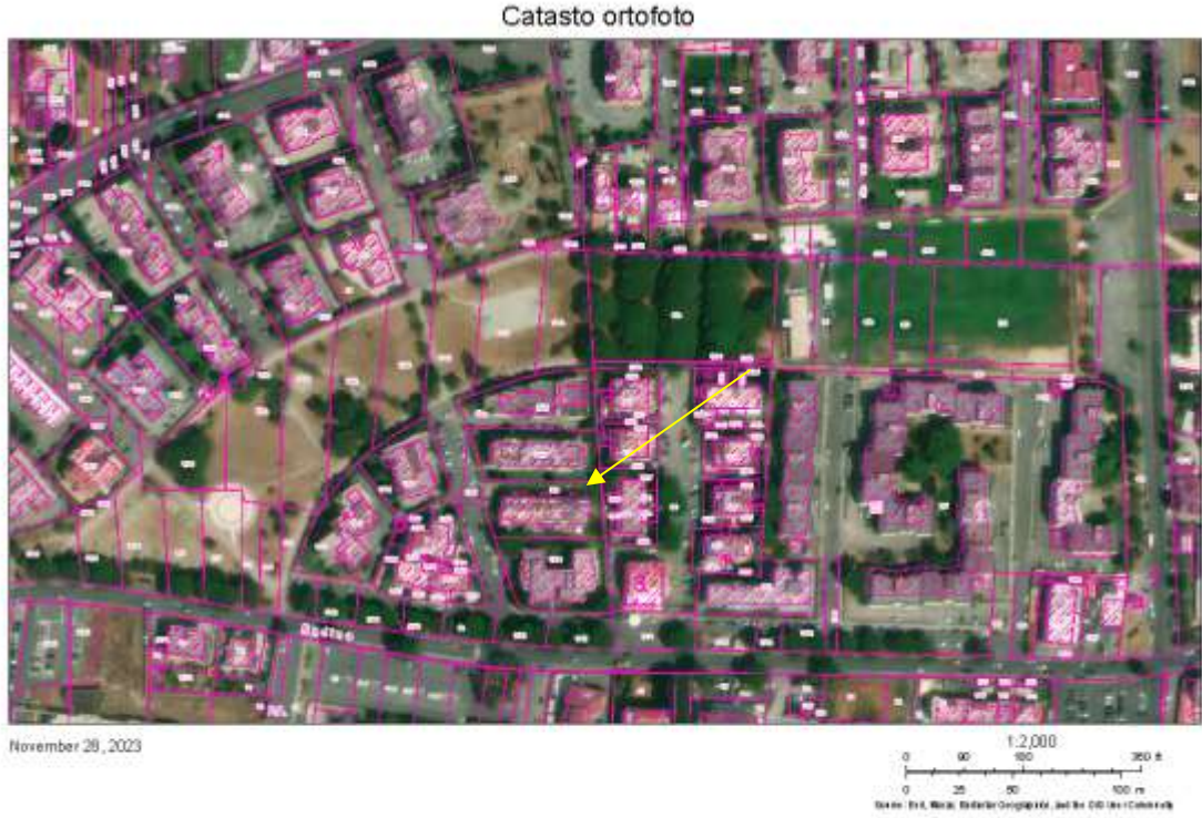
Figura 3 Vista aerea del Bene 1