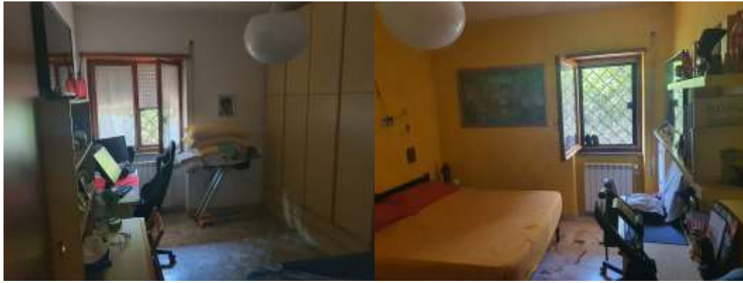
Figura 13 Stanza singola e stanza doppia