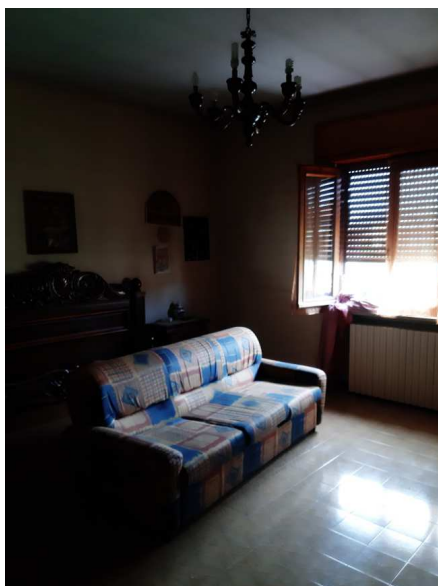
camera da letto