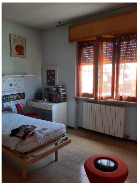
camera da letto