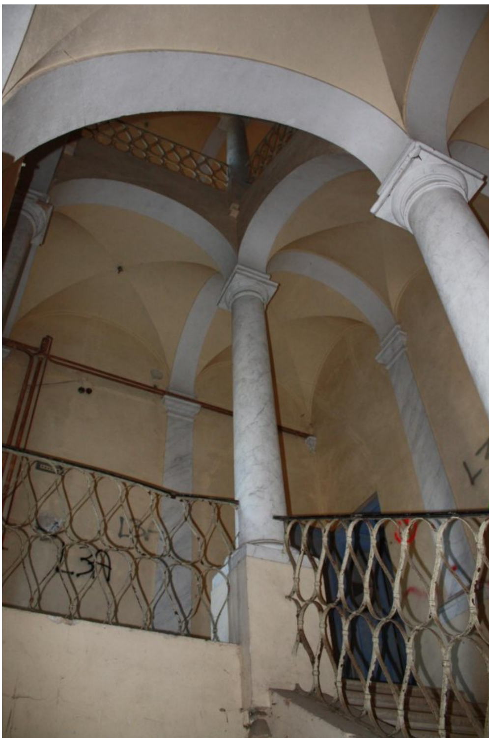
PIANO TERRA RIALZATO