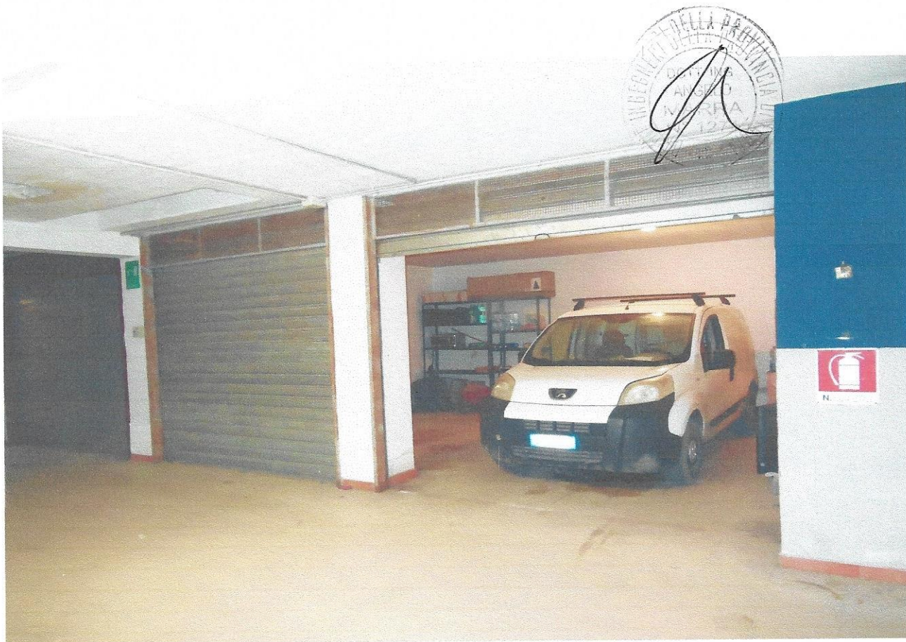
15 – Part. box (livello interrato edificio)