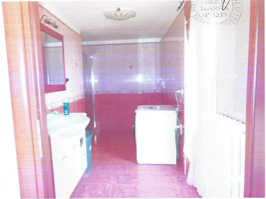
11 – Part. bagno padronale (secondo livello appart.)