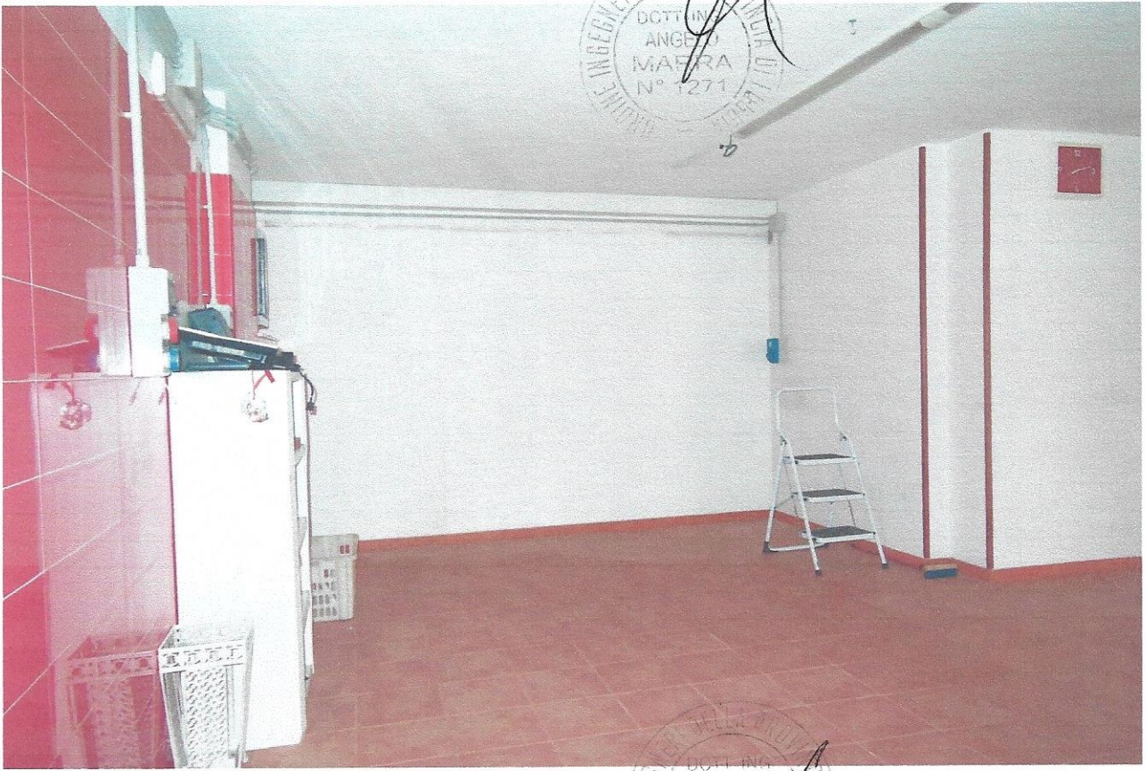
17 – Part. interno locale negozio