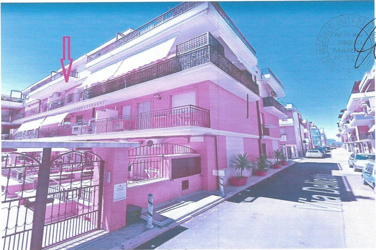
1 – Part. prospetto edificio (appart. + box) via Deliceto n. 1/D