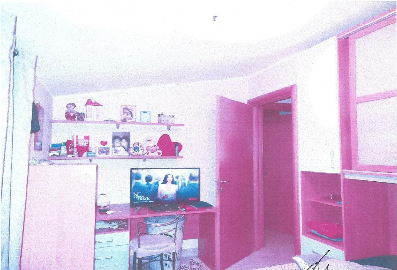
10 – Part. cameretta (secondo livello appart.)