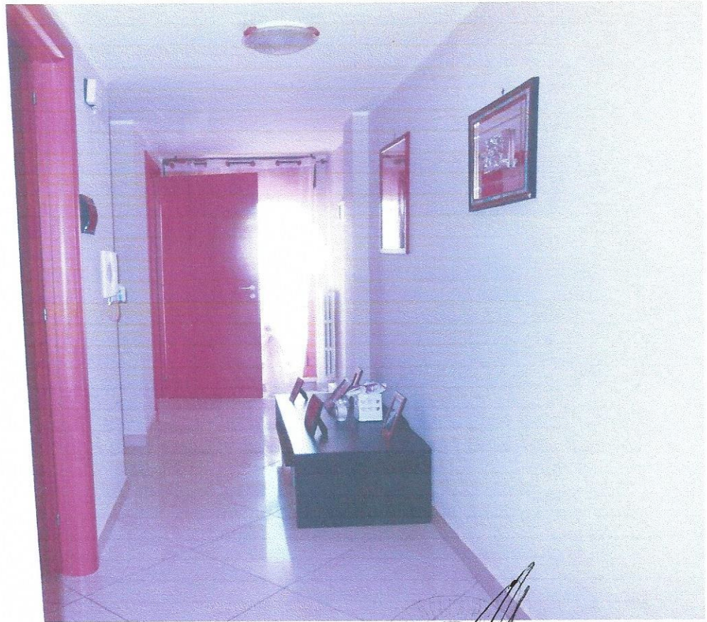
12 – Part. disimpegno (secondo livello appart.)