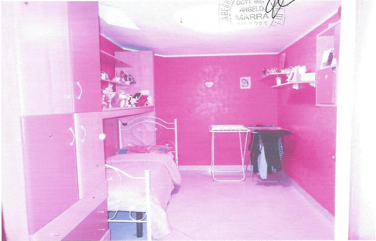
9 – Part. cameretta con lucernario (secondo livello appart.)