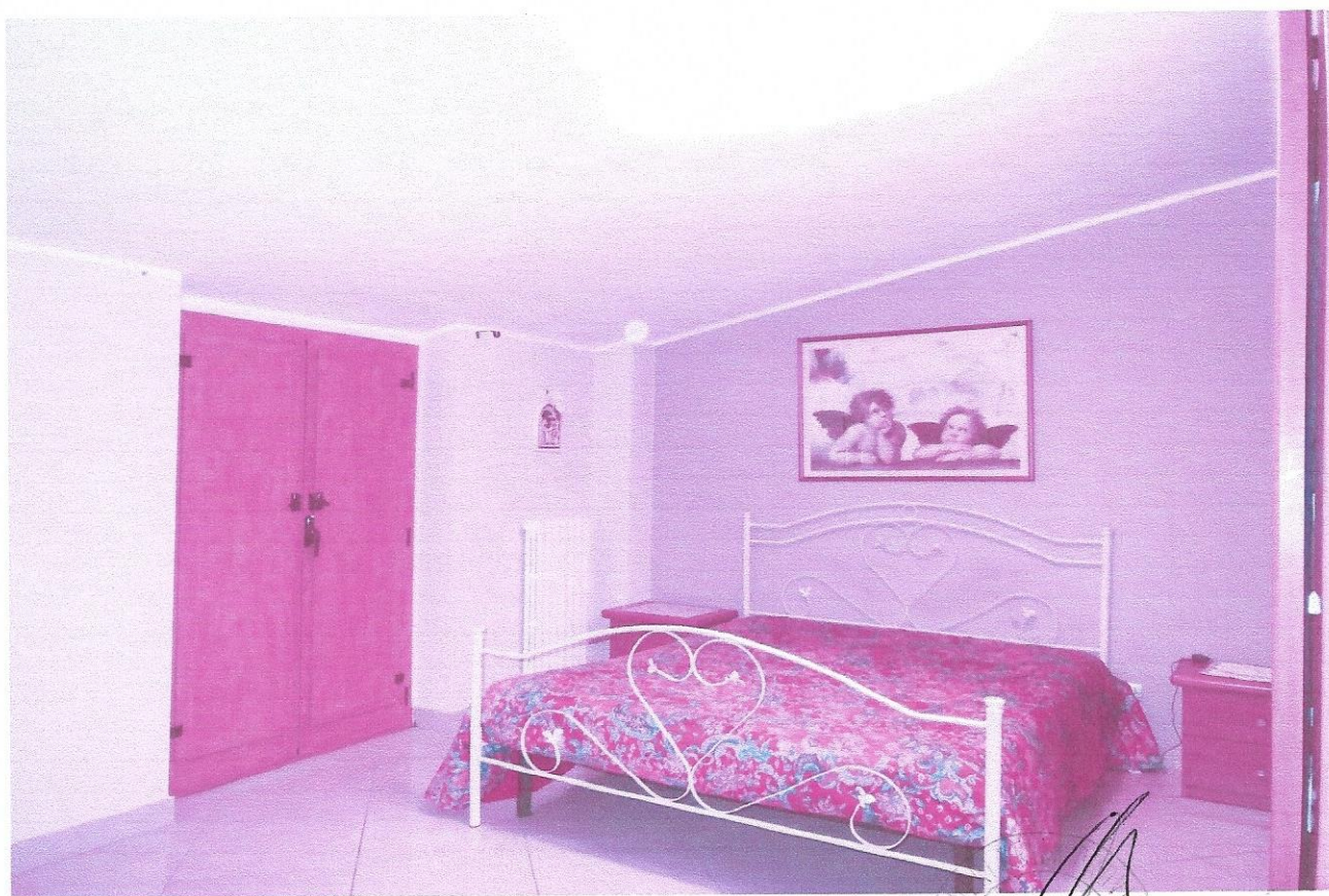
8 – Part. camera da letto matrimoniale (secondo livello appart.)