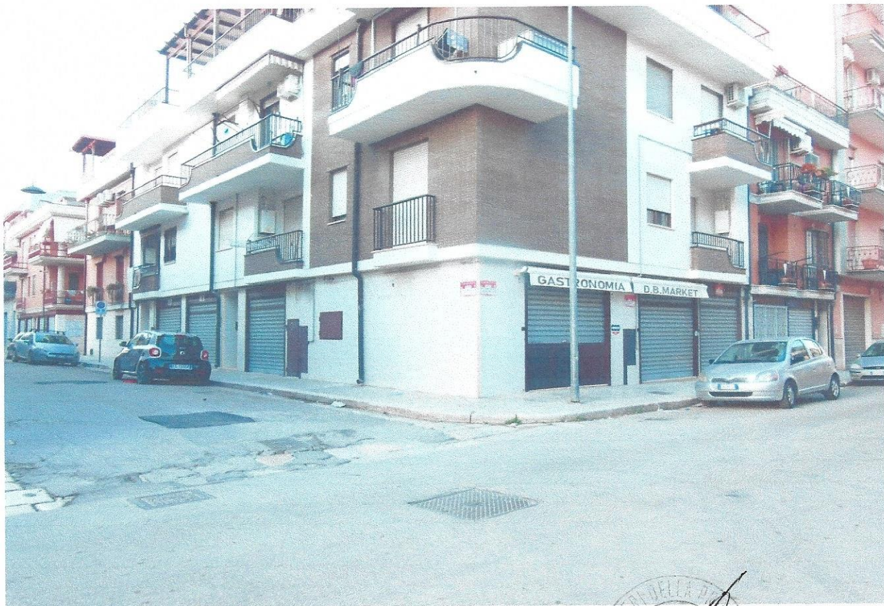
16 – Part. prospetto edificio (negozio) via Rodi n. 13