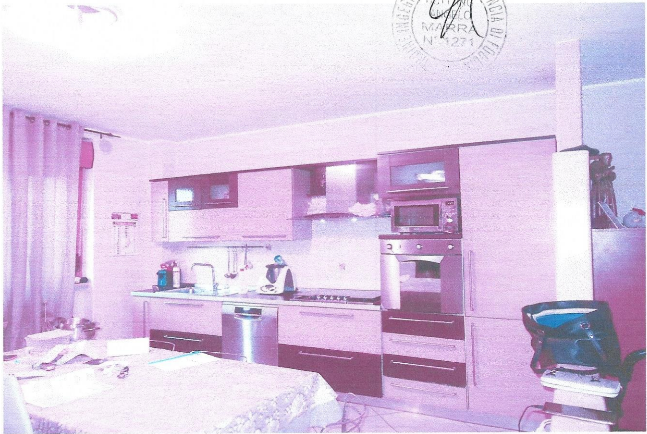
3 – Part. ambiente cucina ( primo livello appart.)