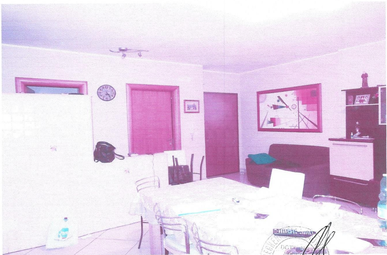
2 – Part. ambiente soggiorno-pranzo (primo livello appart.)