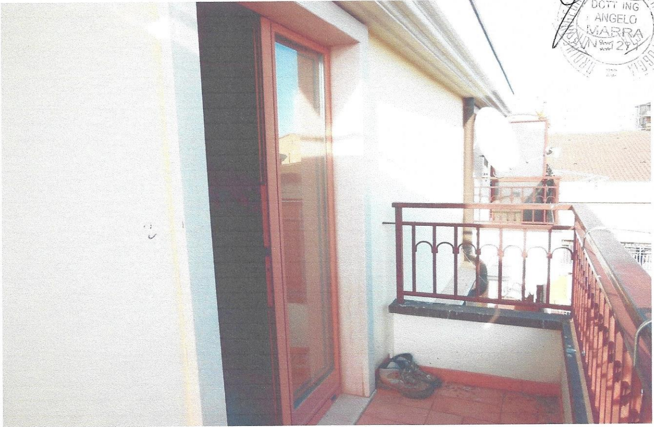
13 – Part. balcone tipo (secondo livello appart.)