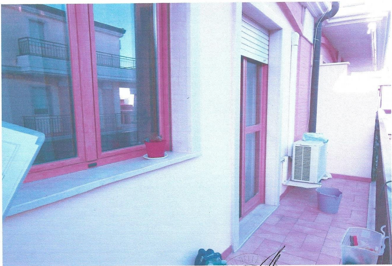
6 – Part. balcone (primo livello appart.)