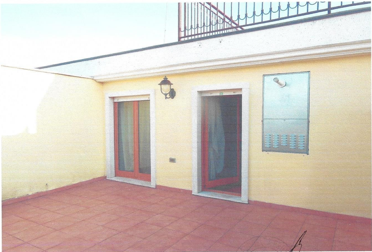
14 – Part. terrazzo (secondo livello appart.)