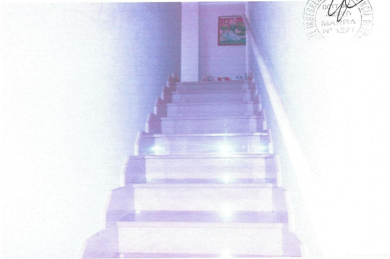
7 – Part. scala interna di collegamento zona giorno (primo livello) – zona notte (secondo livello)