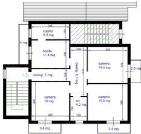
PIANO SECONDO h.300 cm SUL 113 mq SUA 82,80 mq balconi 13,4 mq