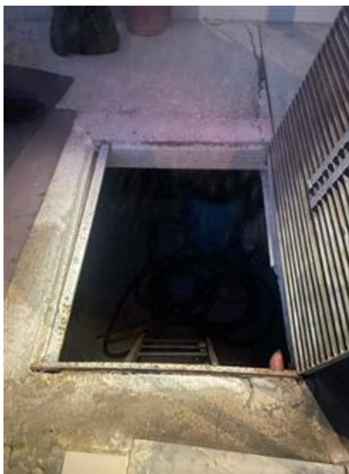
ingresso alla cantina interrata