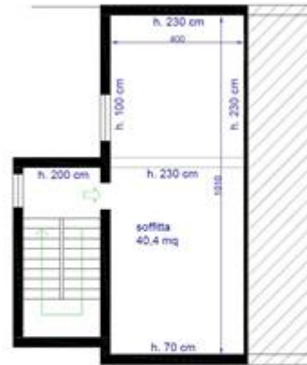
PIANO SOTTOTETTO SUL 47 mq SUA 40,4 mq