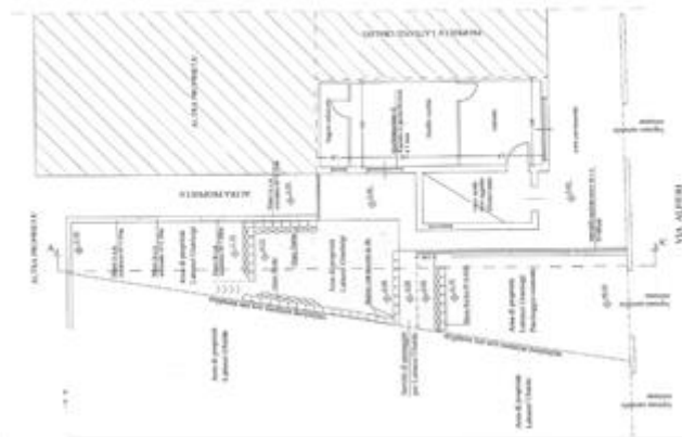
PROGETTO DI SISTEMAZIONE DEL LOTTO 2