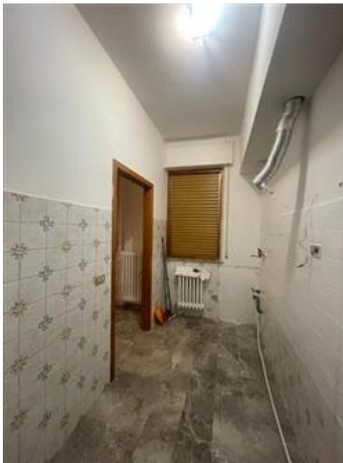
cucina al piano secondo

L'intero edificio sviluppa 5 piani, 4 piani fuori terra, 1 piano interrato. Immobile costruito nel 1968.