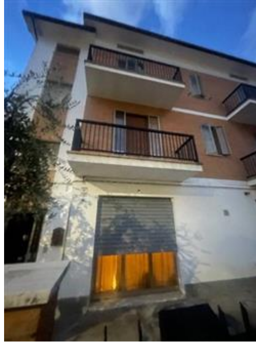
ingresso da vetrina