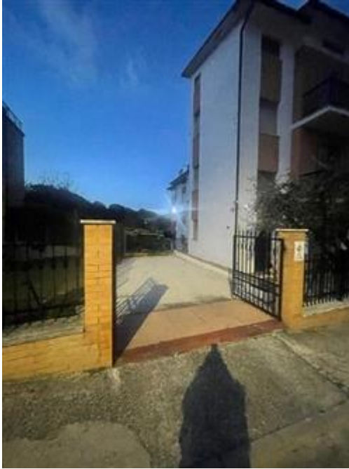
posto auto scoperto

L'intero edificio sviluppa 5 piani, 4 piani fuori terra, 1 piano interrato. Immobile costruito nel 1968.