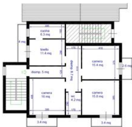
PIANO SECONDO h.300 cm SUL 113 mq SUA 82,80 mq balconi 13,4 mq