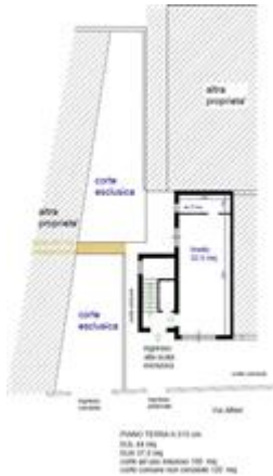
PIANO TERRA Più CORTE ESCLUSIVA