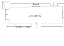
PIANTA PIANO INTERRATO h=303