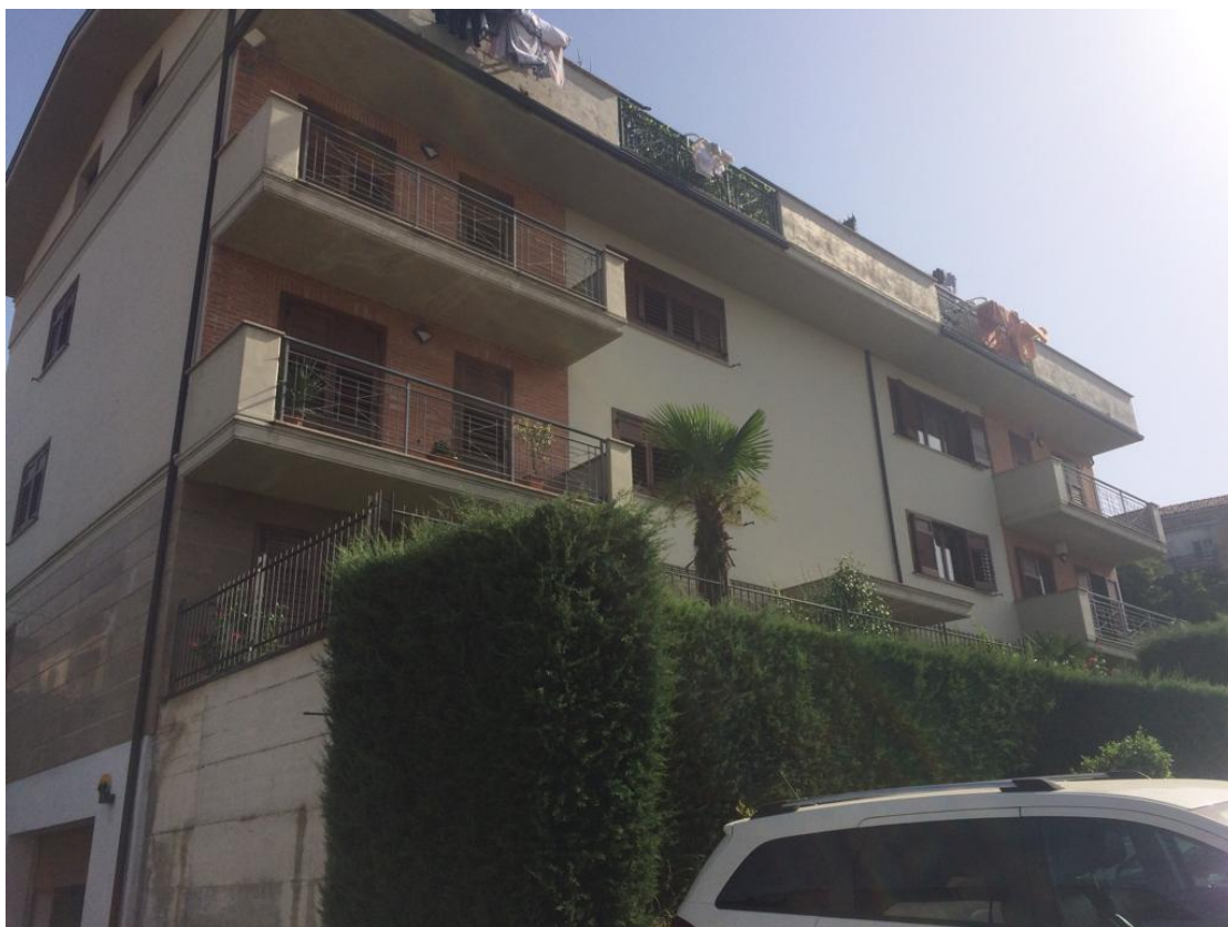
FOTO 3 BOX GARAGE