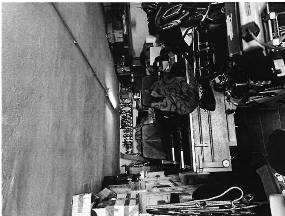
Figura 8 Interno sub 5