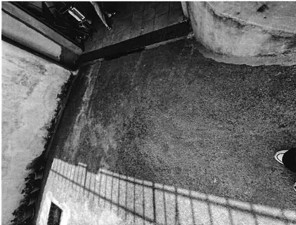
Figura 3 Dettaglio rampa