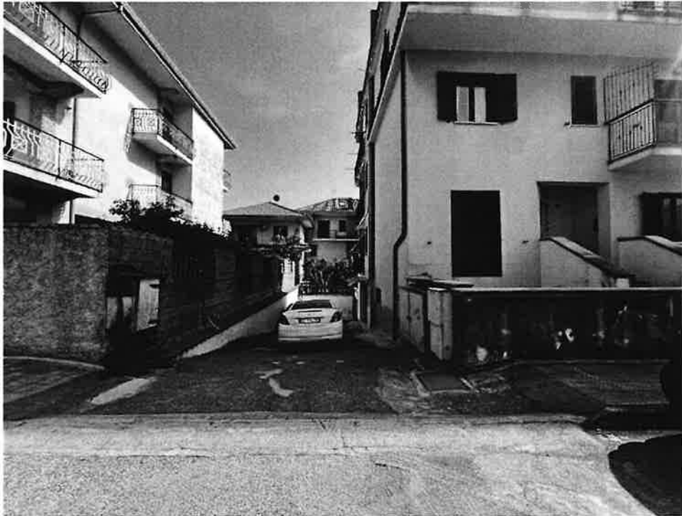
Figura 1 Via G. Donizetti n.8 Lamezia Terme - Accesso immobile Fg 85 part. 1999 sub 5