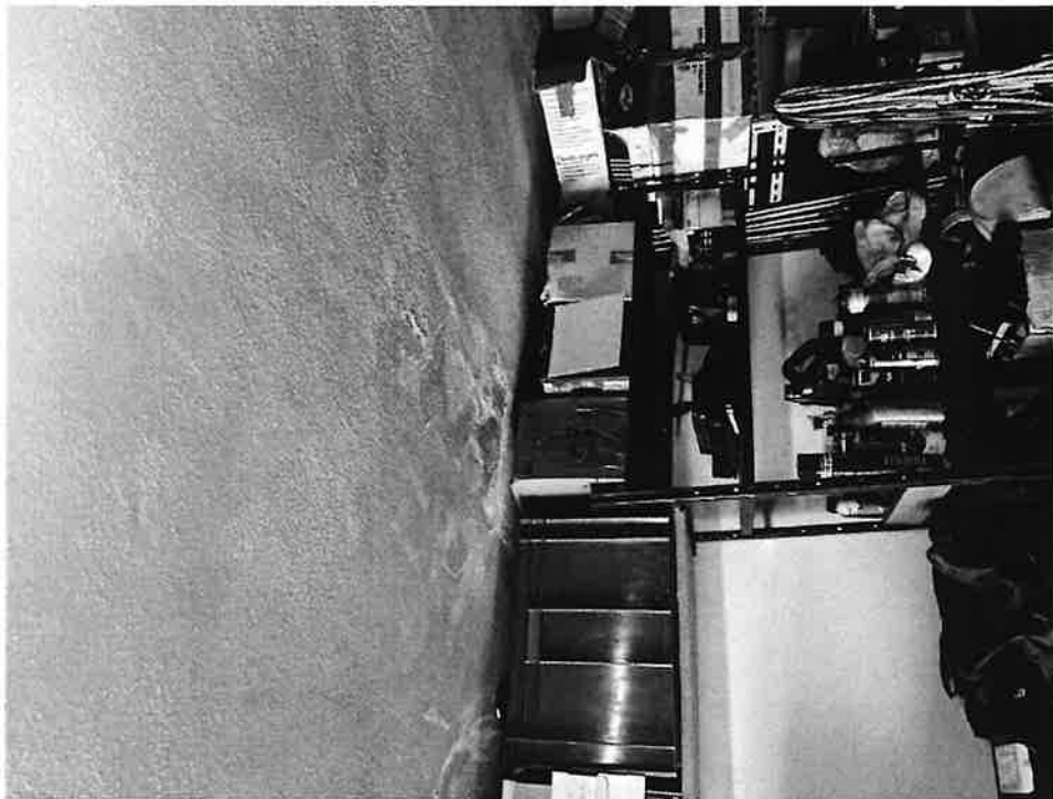
Figura 9 Dettaglio soffitto interno