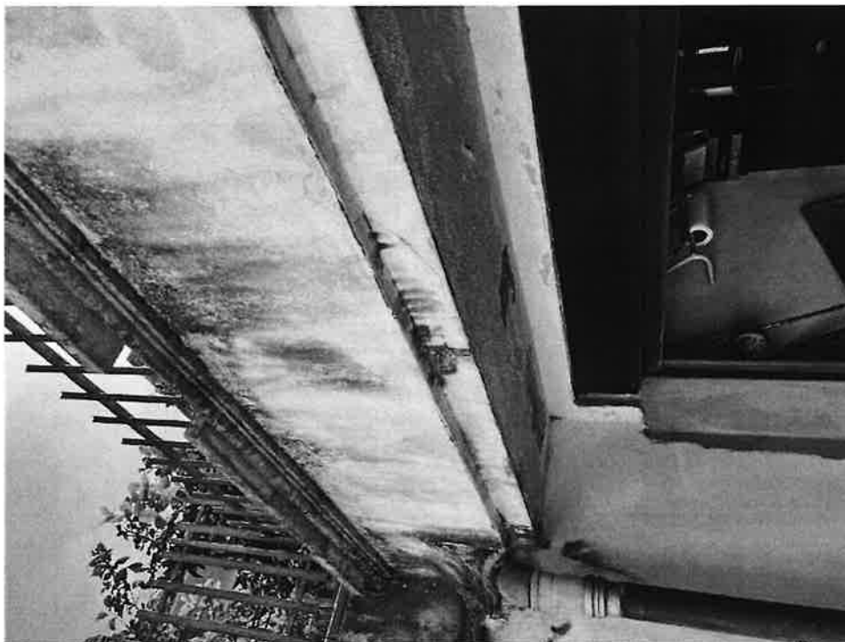
Figura 7 Dettaglio danni causati da infiltrazioni acqua dal terrazzo