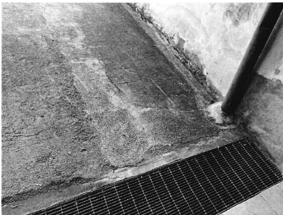
Figura 6 Dettaglio griglia raccolta acqua piovana