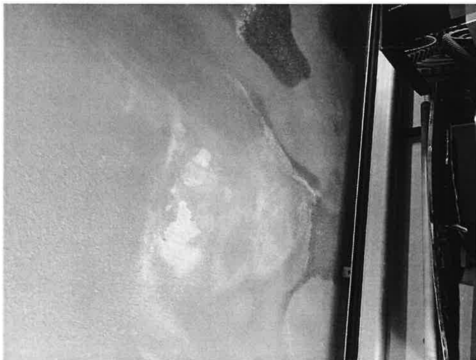
Figura 10 Dettaglio infiltrazioni acqua dal terrazzo sovrastante