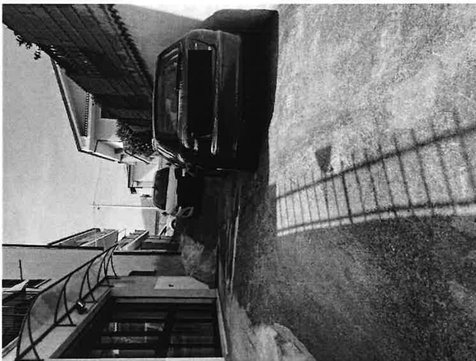
Figura 2 Dettaglio rampa vista dall'interno