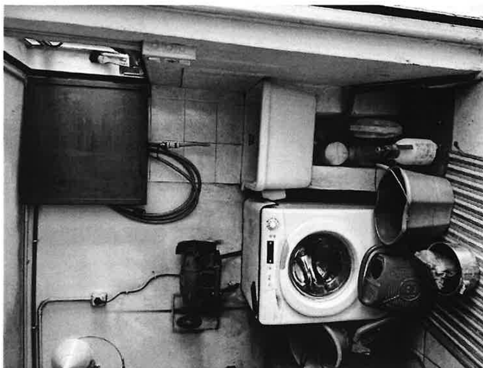
Figura 13 Angolo lavanderia