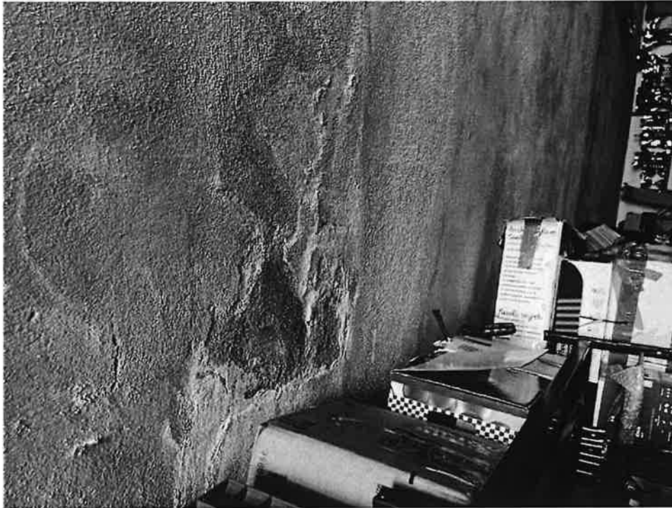
Figura 11 Dettaglio danno infiltrazione