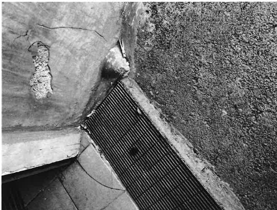
Figura 5 Dettaglio Griglia raccolta acqua piovana