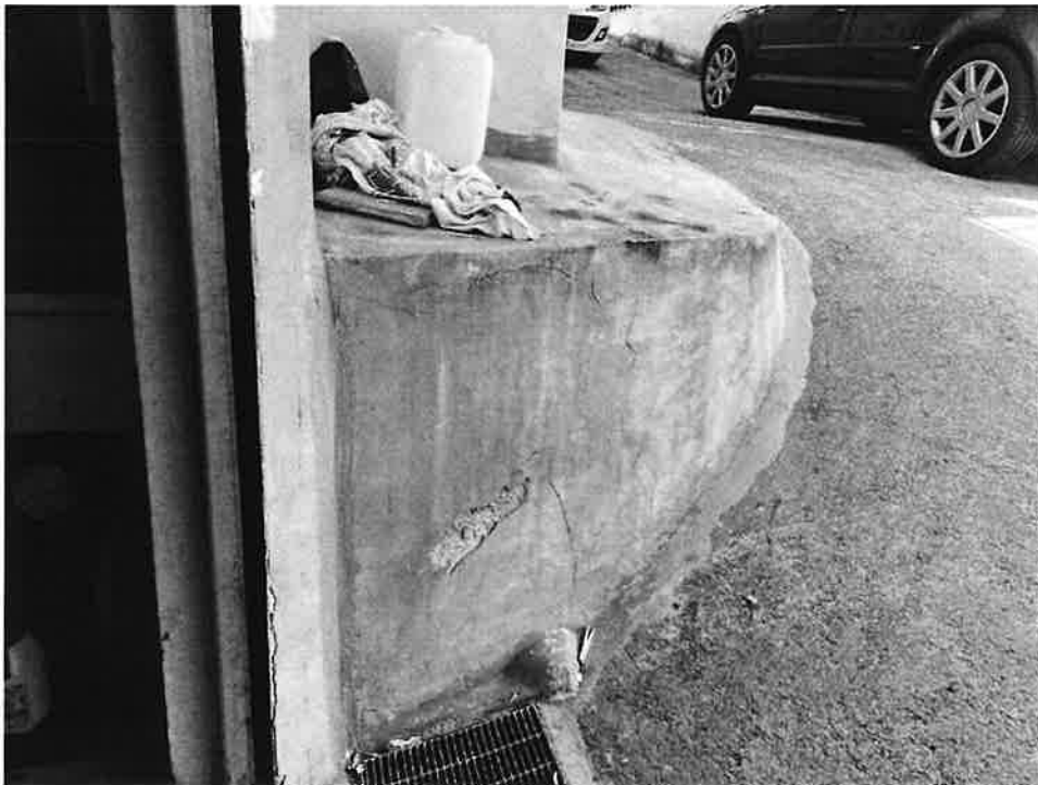
Figura 4 Dettaglio rampa : curva stretta e di difficile manovra che rende impossibile l'accesso