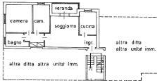
PIANO TERRA h. 280

Allegata alla dichiarazione presentata all'Ufficio Tecnico Erariale di VICENZA Scheda N.° _____