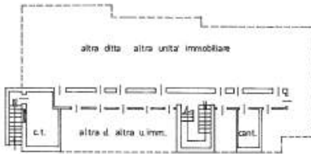
PIANTA PIANO SOTTOSTRADA h. 260