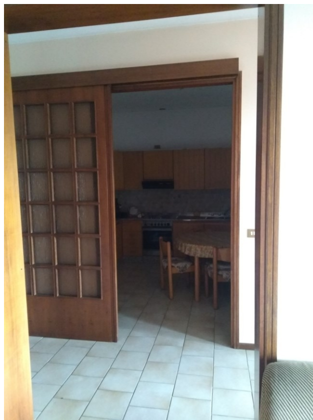
Figura 6 - Cucina