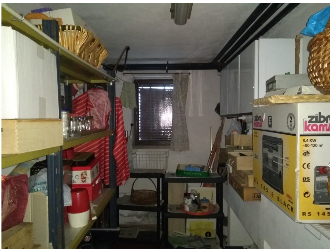
Figura 166 – Nuovo locale dispensa