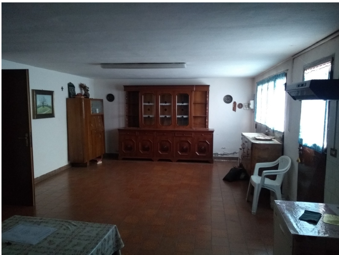
Figura 14 – zona autorimessa trasformata in cantina – demolizione tavolati dispensa