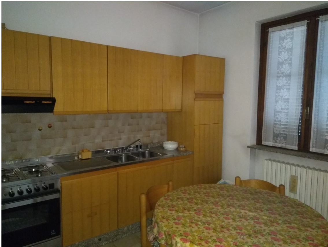
Figura 7 - Cucina