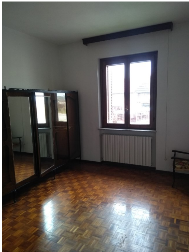
Figura 10 – Camera 3