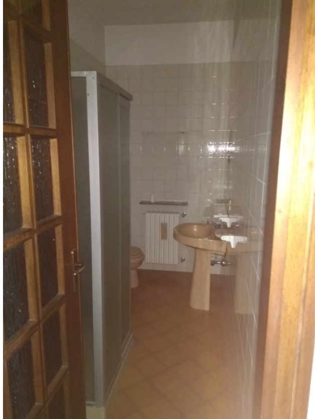
Figura 11 – Bagno piano terra