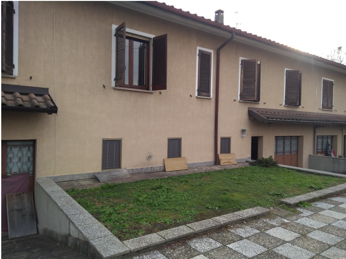
Figura 2 - Prospetto accesso sul retro