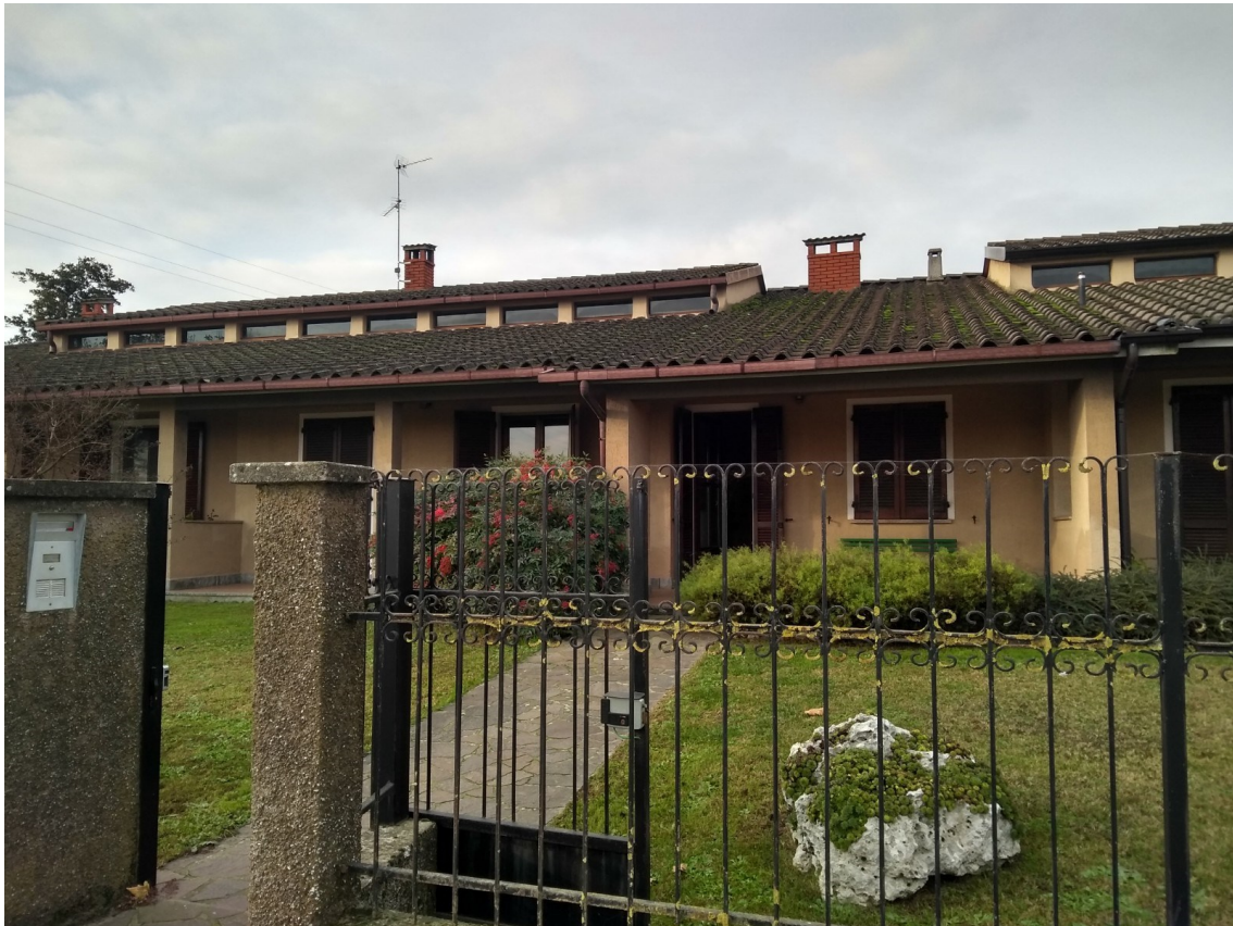
Figura 1 - Prospetto da via Matteotti