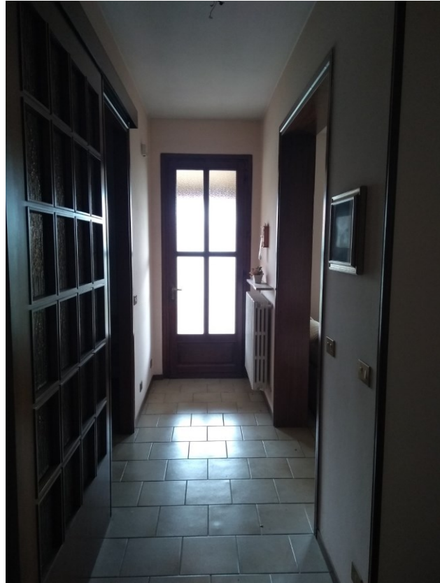
Figura 3 – Ingresso