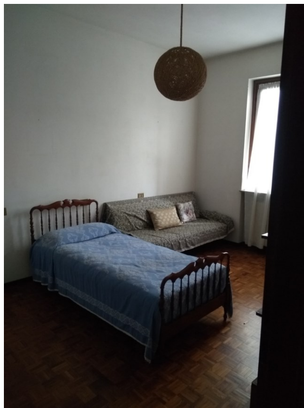
Figura 8 – Camera 1