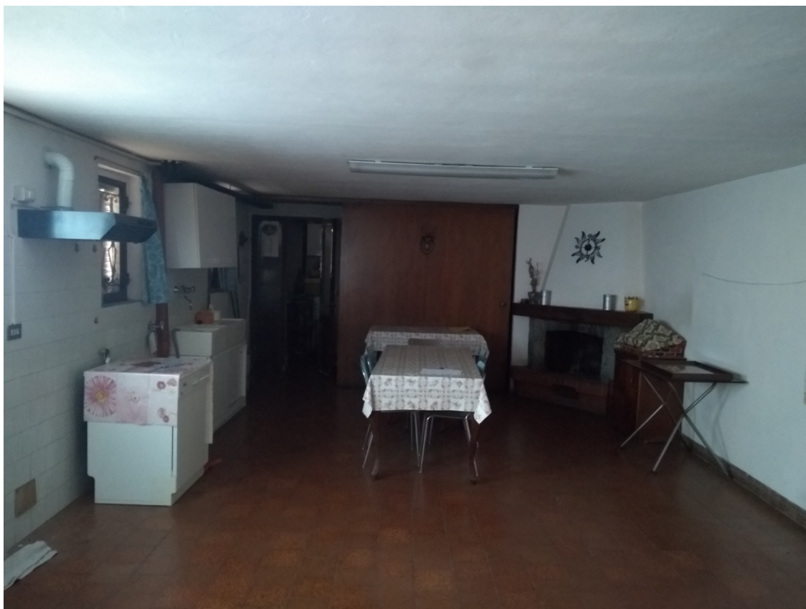
Figura 15 – Cantina e accesso a nuovo locale dispensa