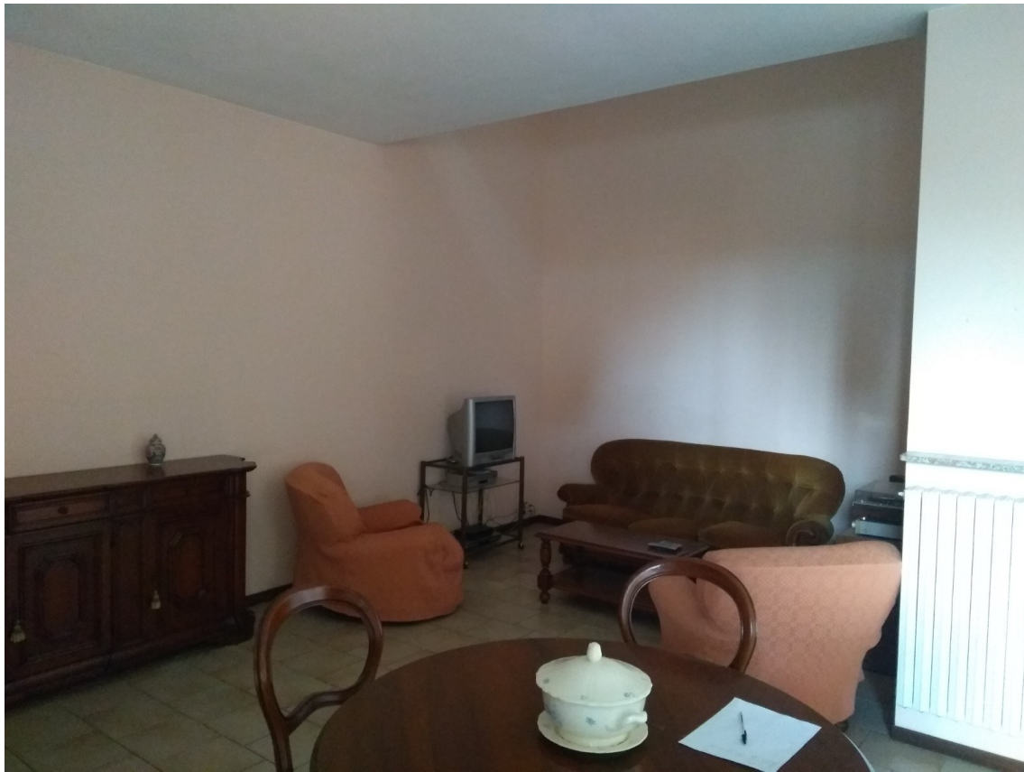
Figura 5 – Soggiorno