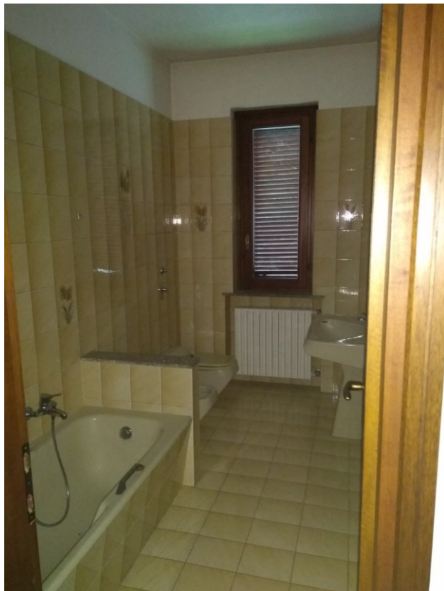
Figura 12 – Bagno piano rialzato