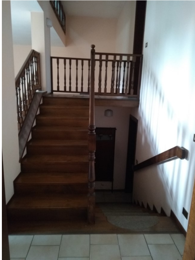
Figura 13 – Scale di accesso al piano rialzato e seminterrato