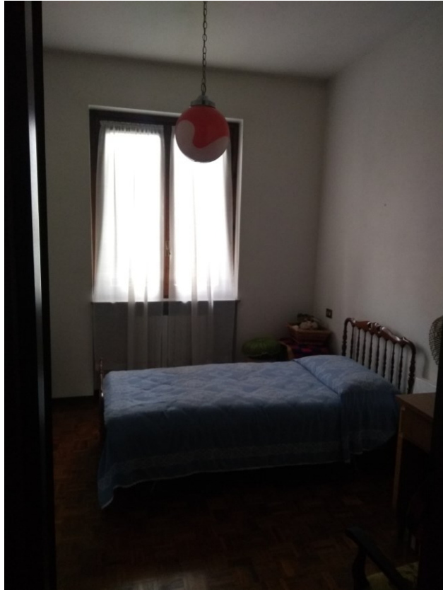
Figura 9 – Camera 2