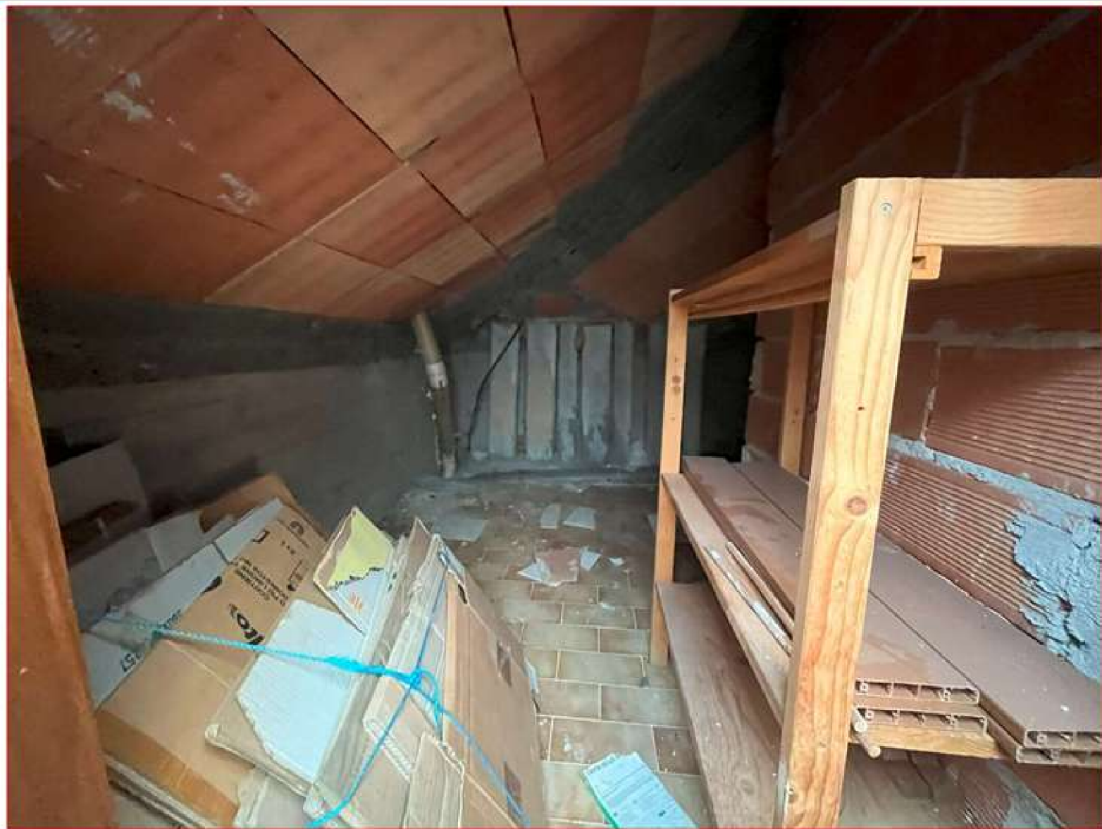
Figura 12. Intercapedine