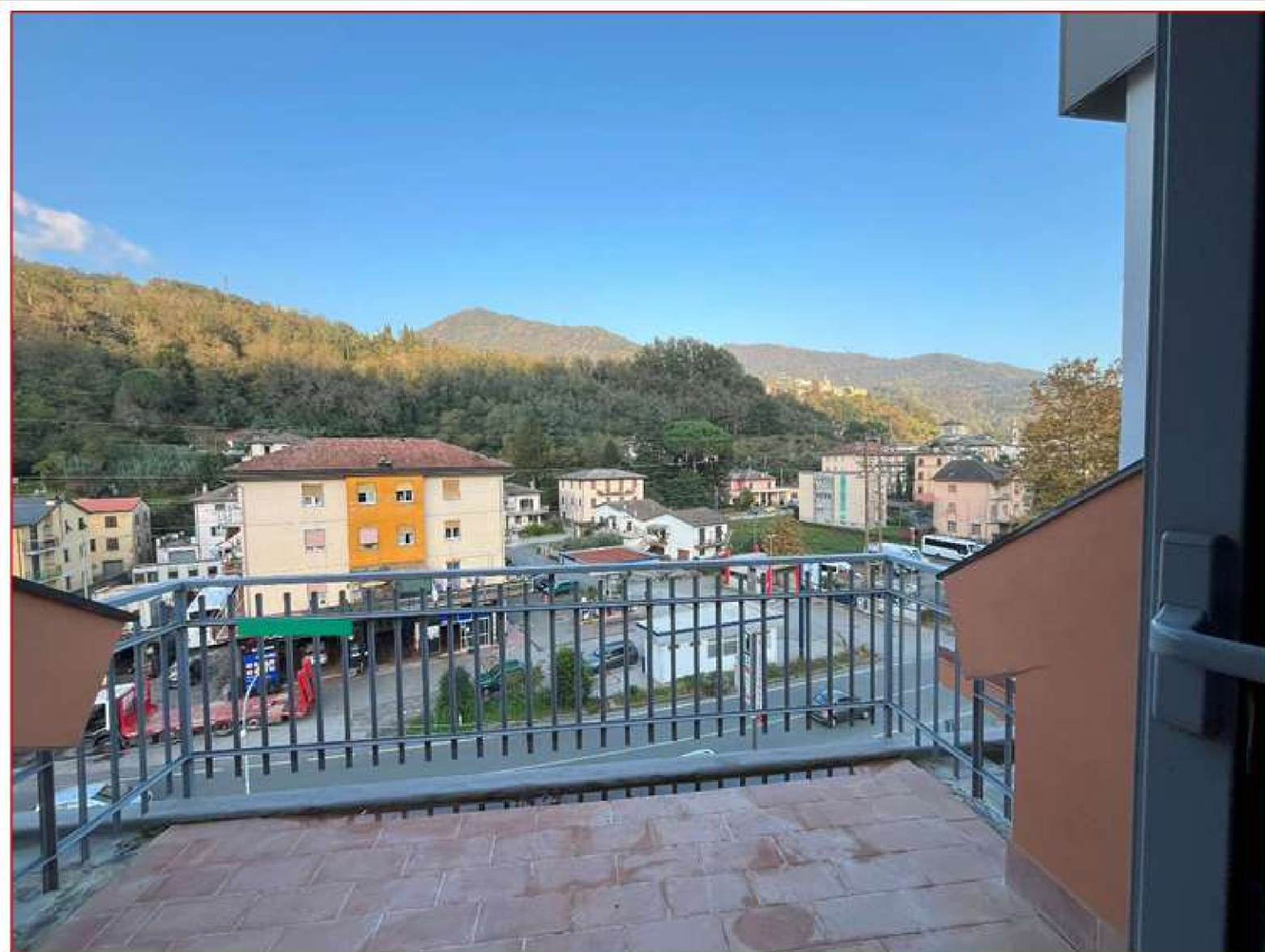
Figura 11. Terrazzo nord-est