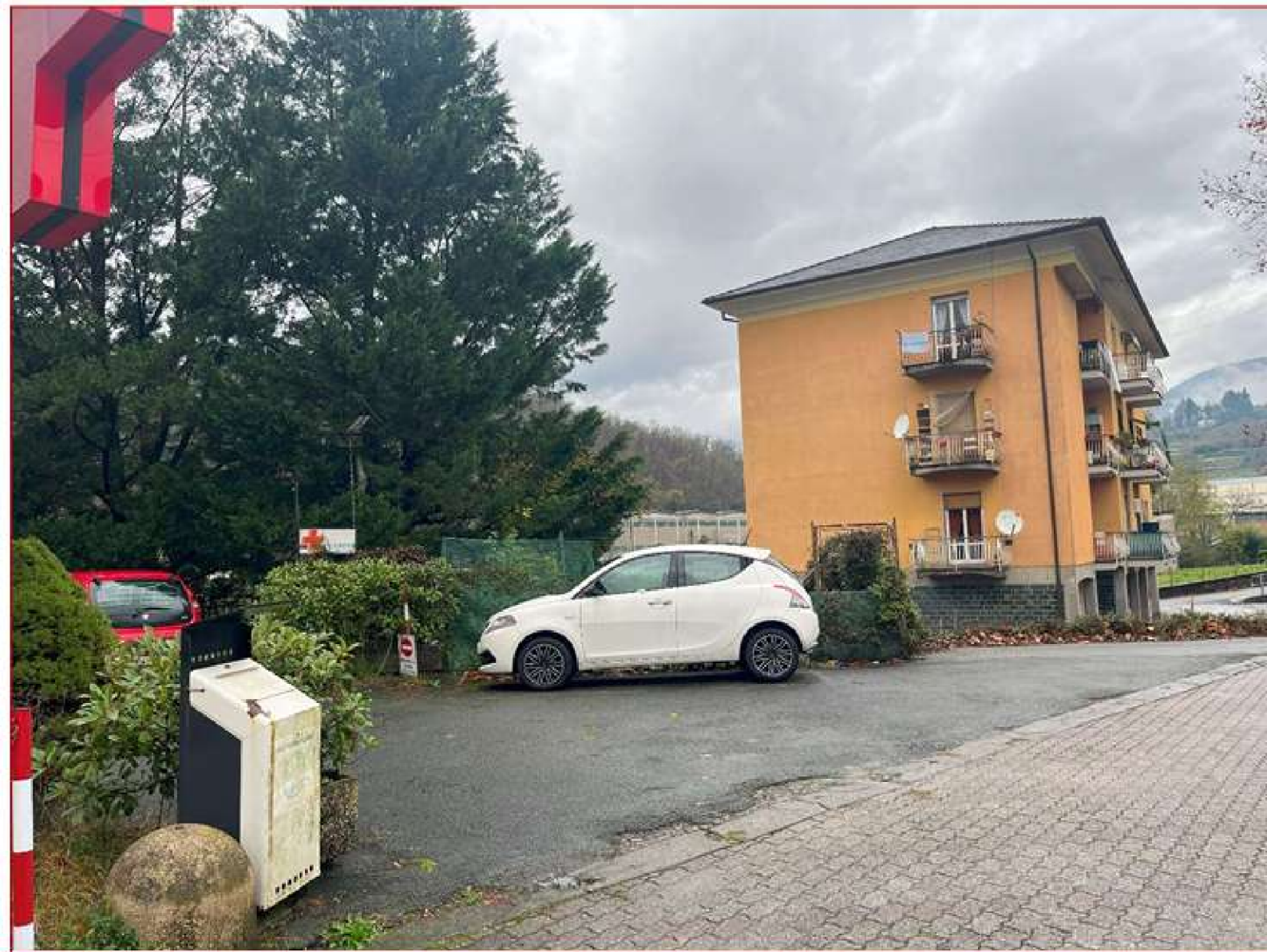
Figura 14. Posto auto ad uso esclusivo dell'int. 16