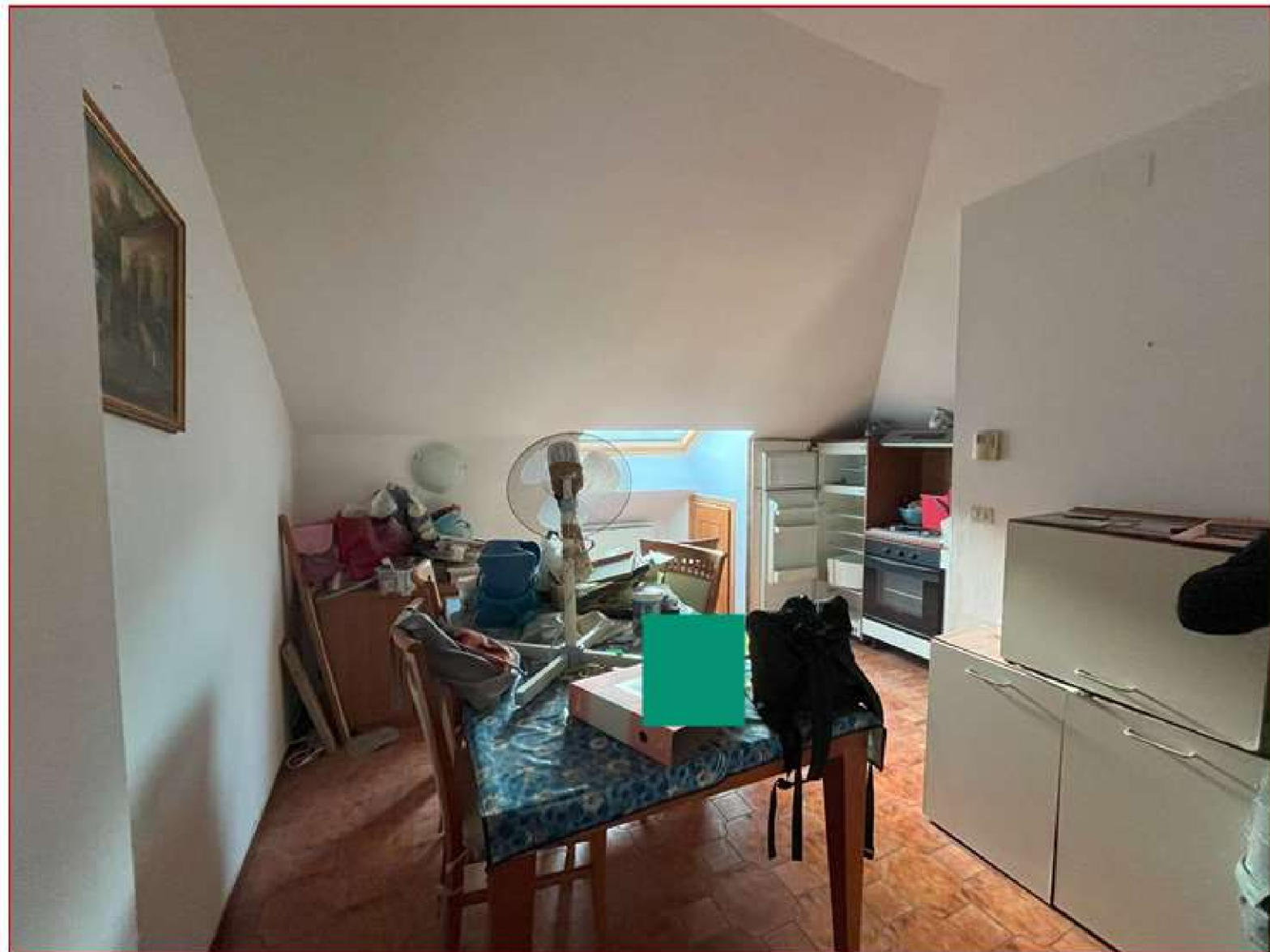
Figura 6. Zona pranzo e angolo cottura