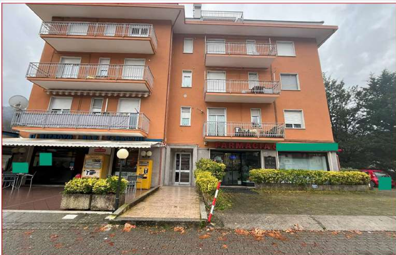
Figura 1. Viale A. De Gasperi, 53B – Prospetto nord - est