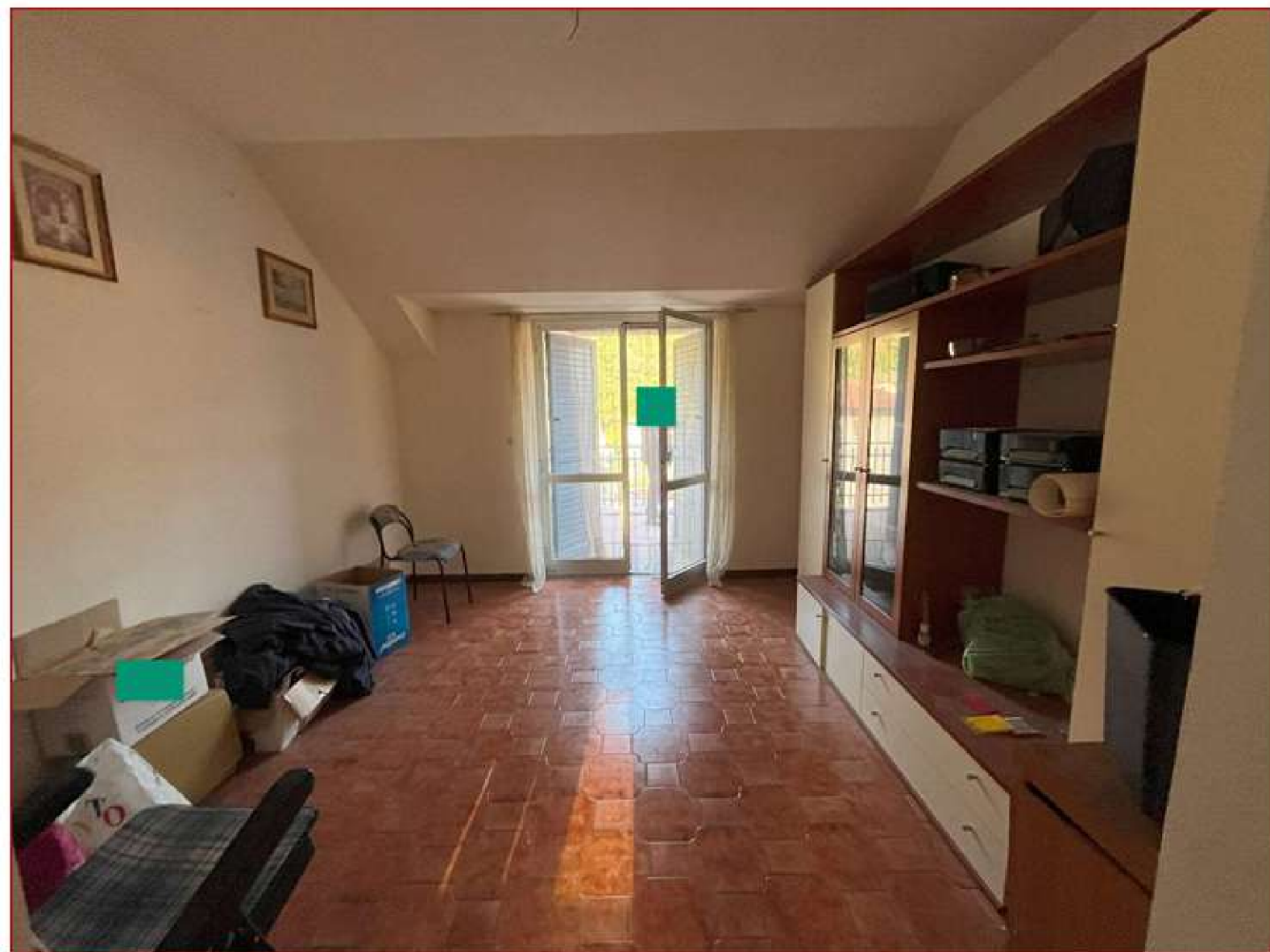
Figura 5. Camera