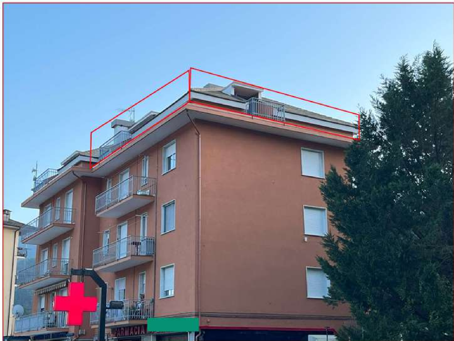
Figura 2. Viale A. De Gasperi, 53B – Angolo nord