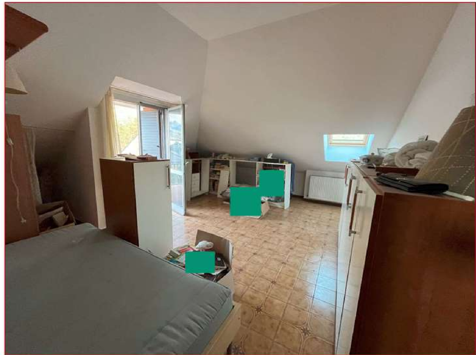
Figura 9. Camera