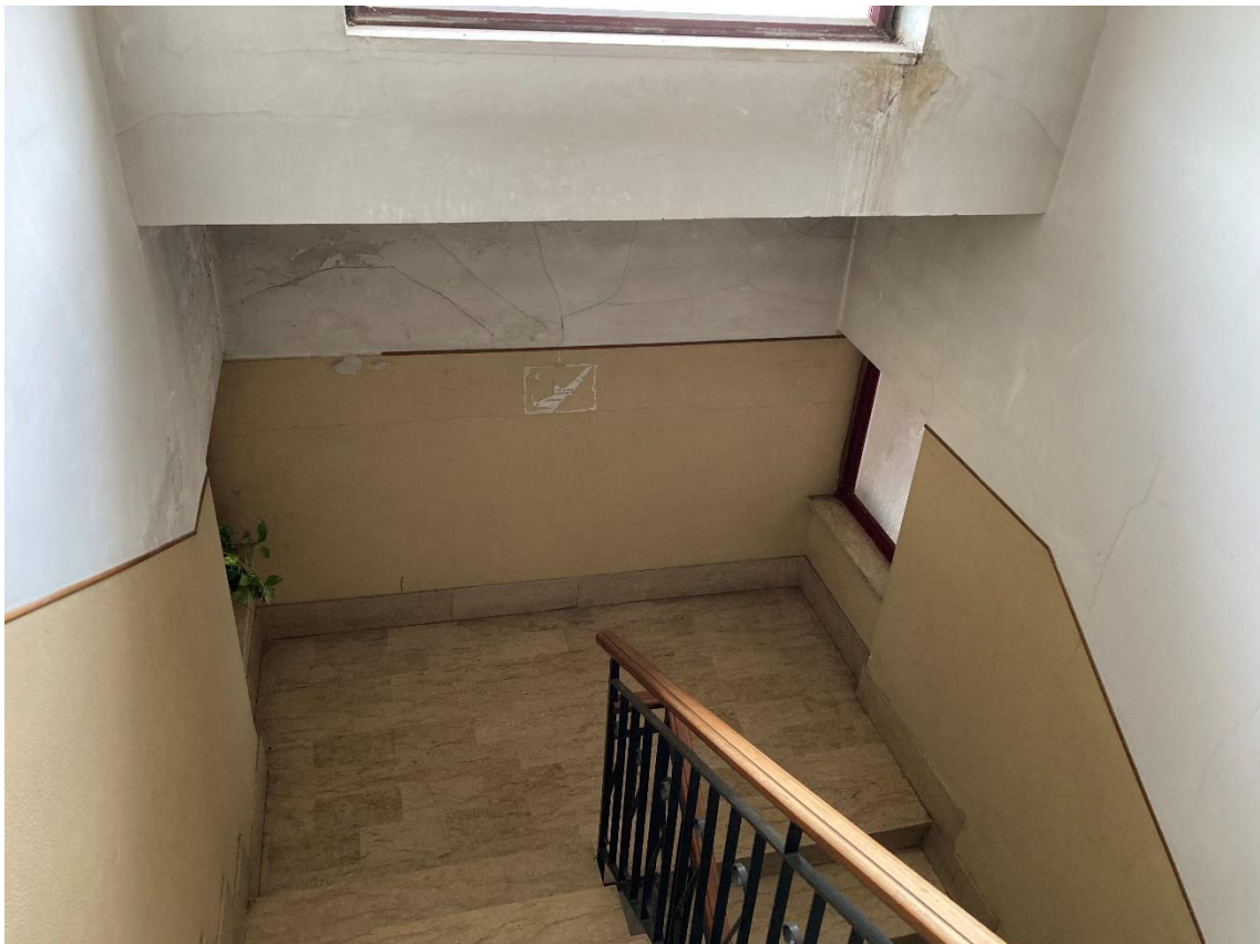
vano scala comune