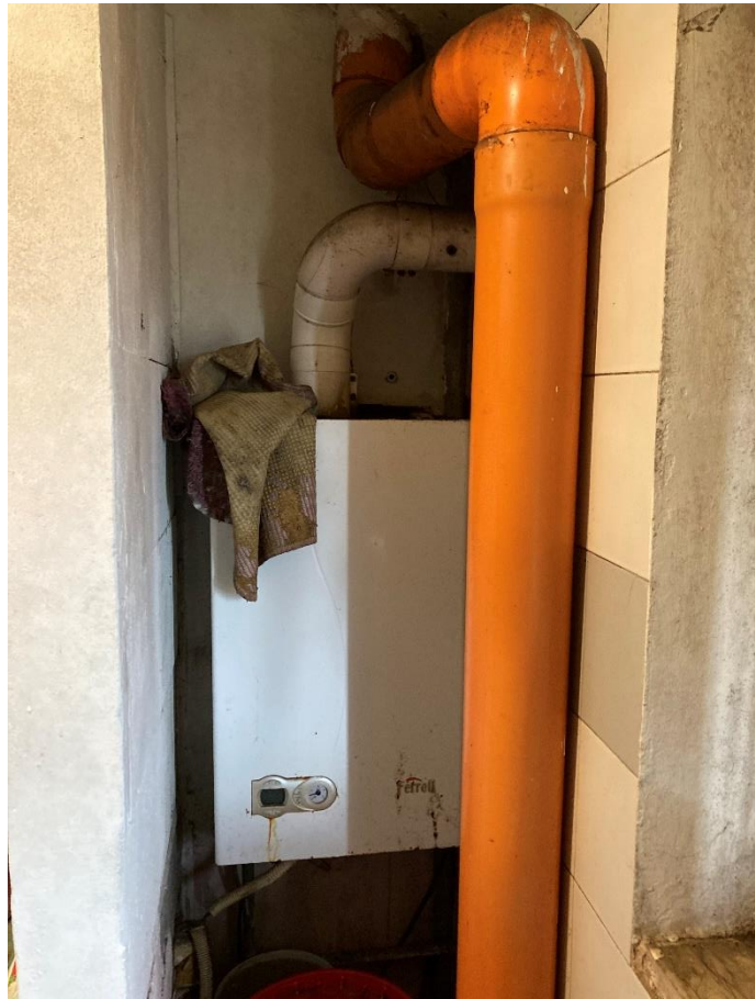
caldaia (posta in bagno)