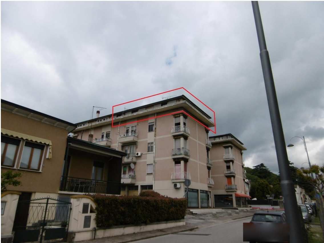
prospetto sud e ovest con individuazione immobile oggetto di perizia