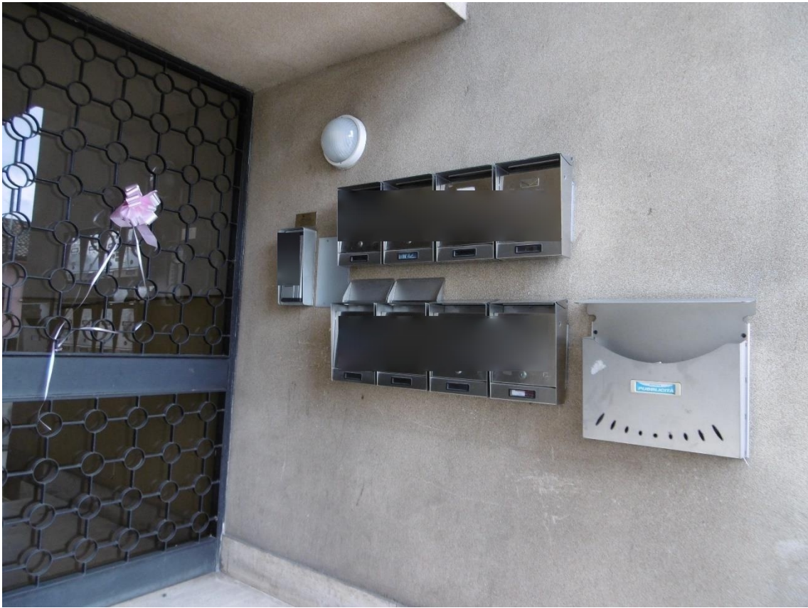
ingresso comune fabbricato