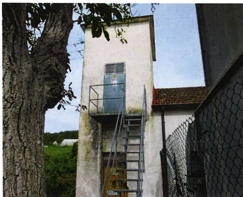
Cabina elettrica -PT-P1