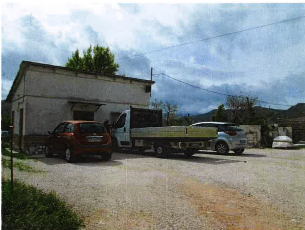
Palazzina ufficio e accessori