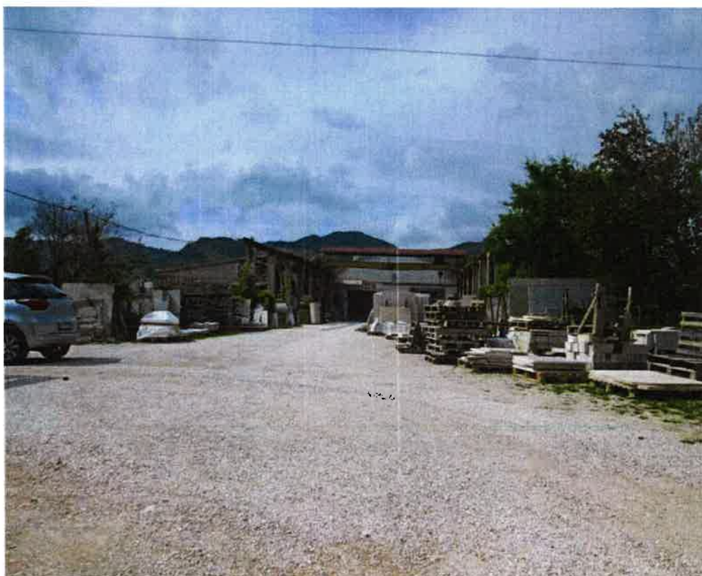
Piazzale d'ingresso al capannone