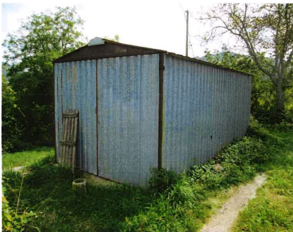
Box in lamiera zincata