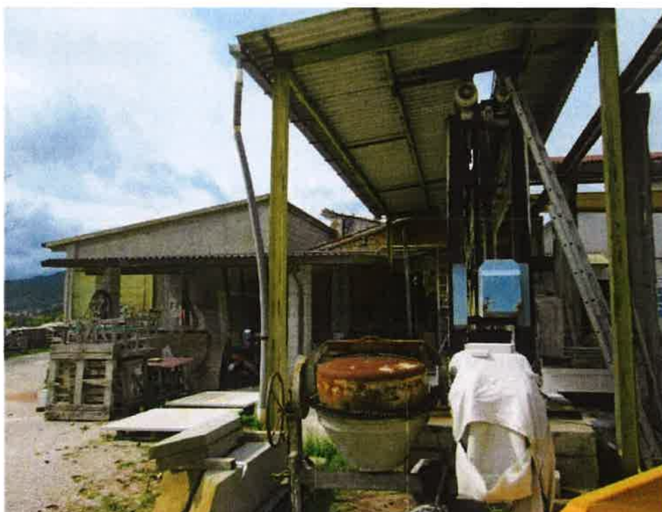
Tettoia in ferro