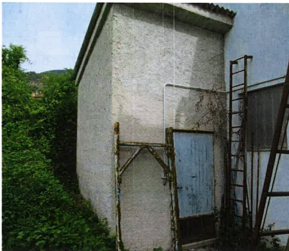
Centrale termica in disuso