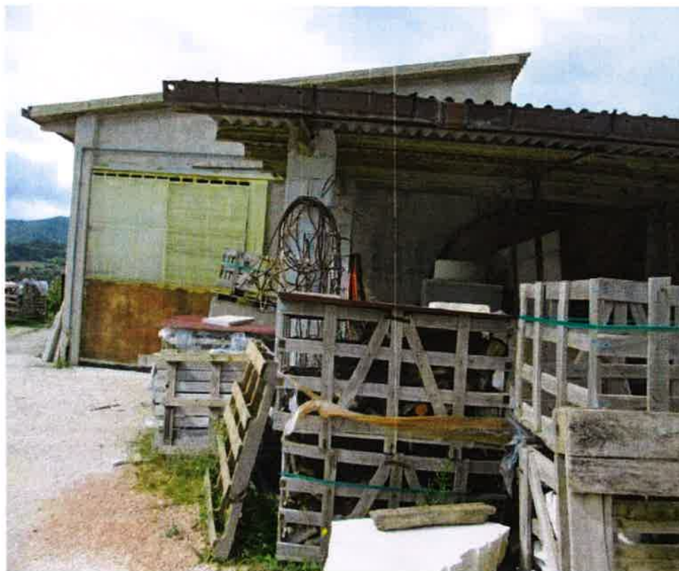
Tettoia in muratura