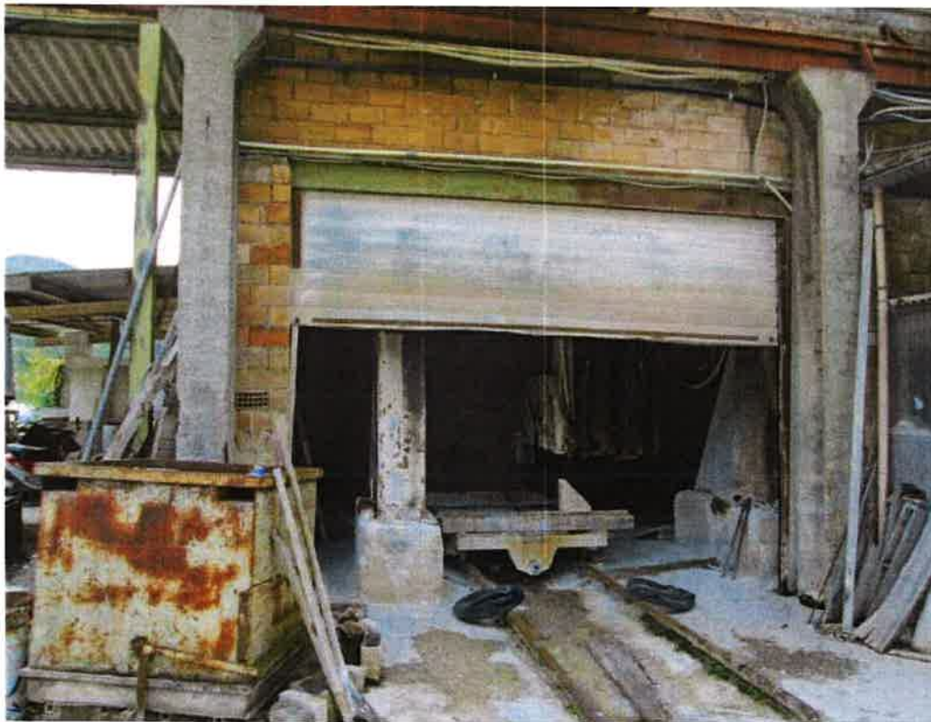
Ingresso Lab. Taglia blocchi