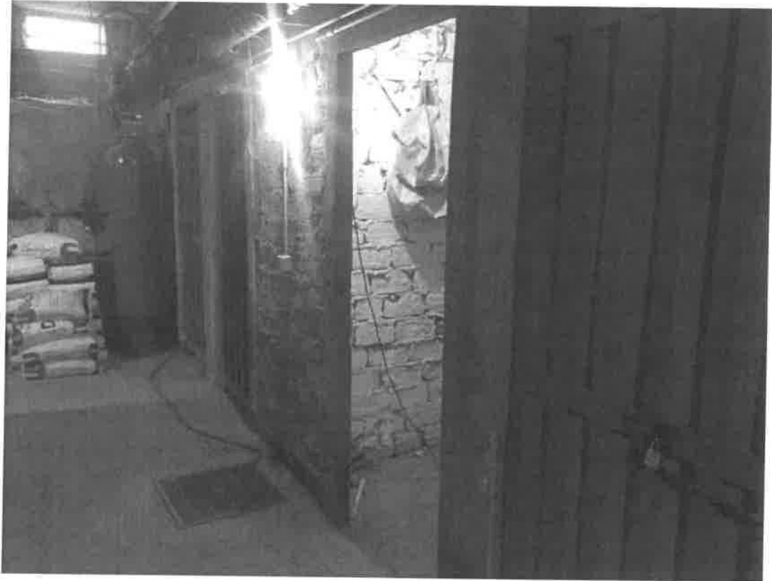
vista corridoio cantine