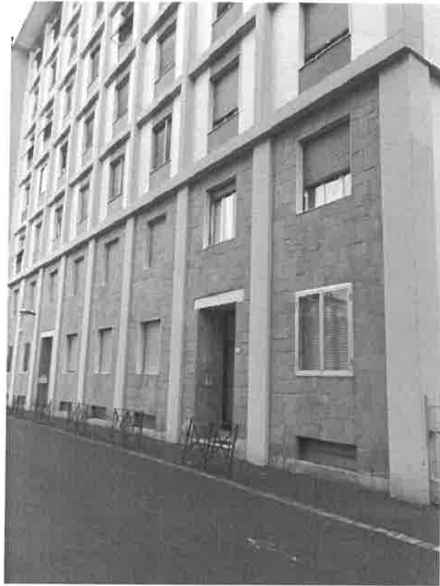
ingresso condominiale su Via Fiamberti