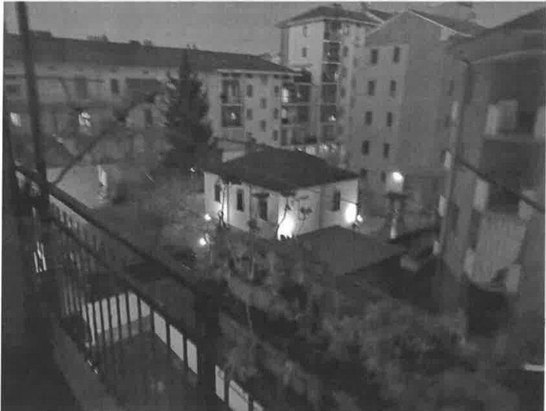
Vista da balcone interno