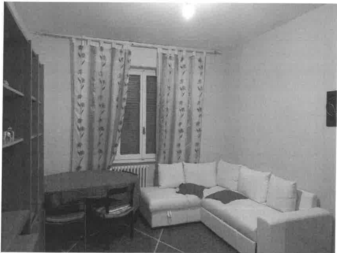
vista interna soggiorno