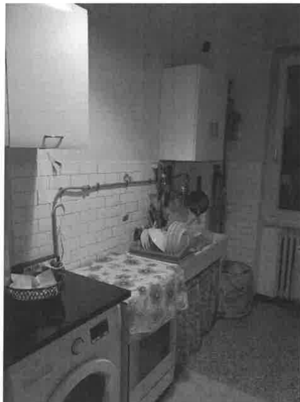
vista interna cucina