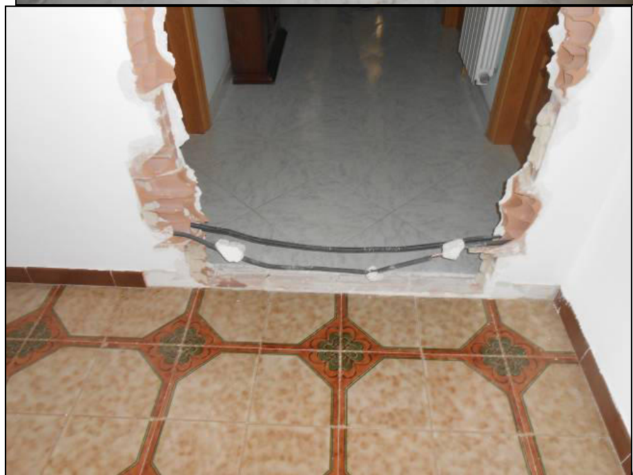
Fotografie dell'appartamento: camera riaccorpata (a); vano porta allo stato grezzo di accesso alla camera (b); vano porta murato sulla parete Ovest della camera (c); dettaglio dell'impianto elettrico da ripristinare (d); elemento radiante da collegare all'impianto di riscaldamento (e); dettagli dei battiscopa da ripristinare (f).