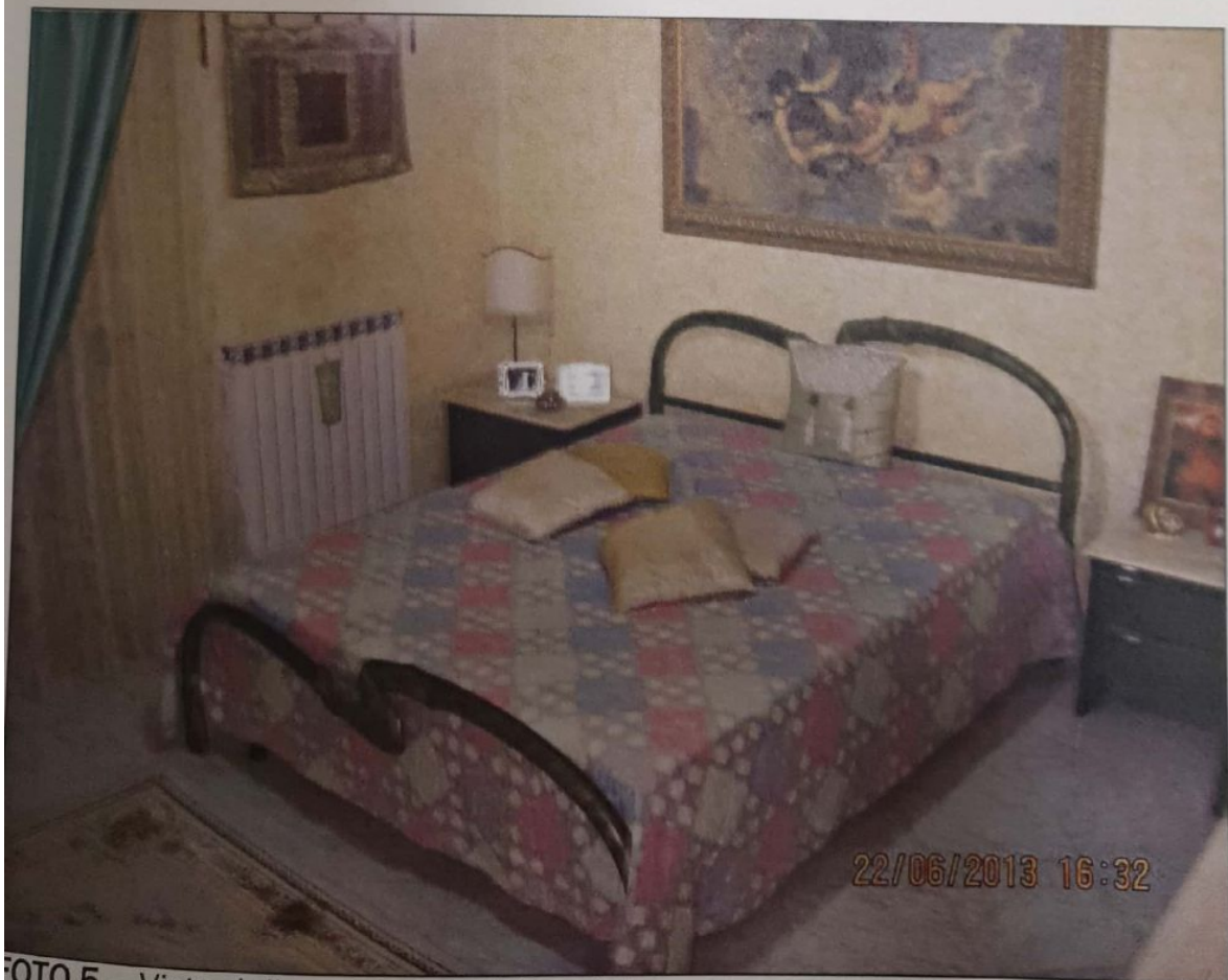
FOTO 5 - Vista della camera matrimoniale.