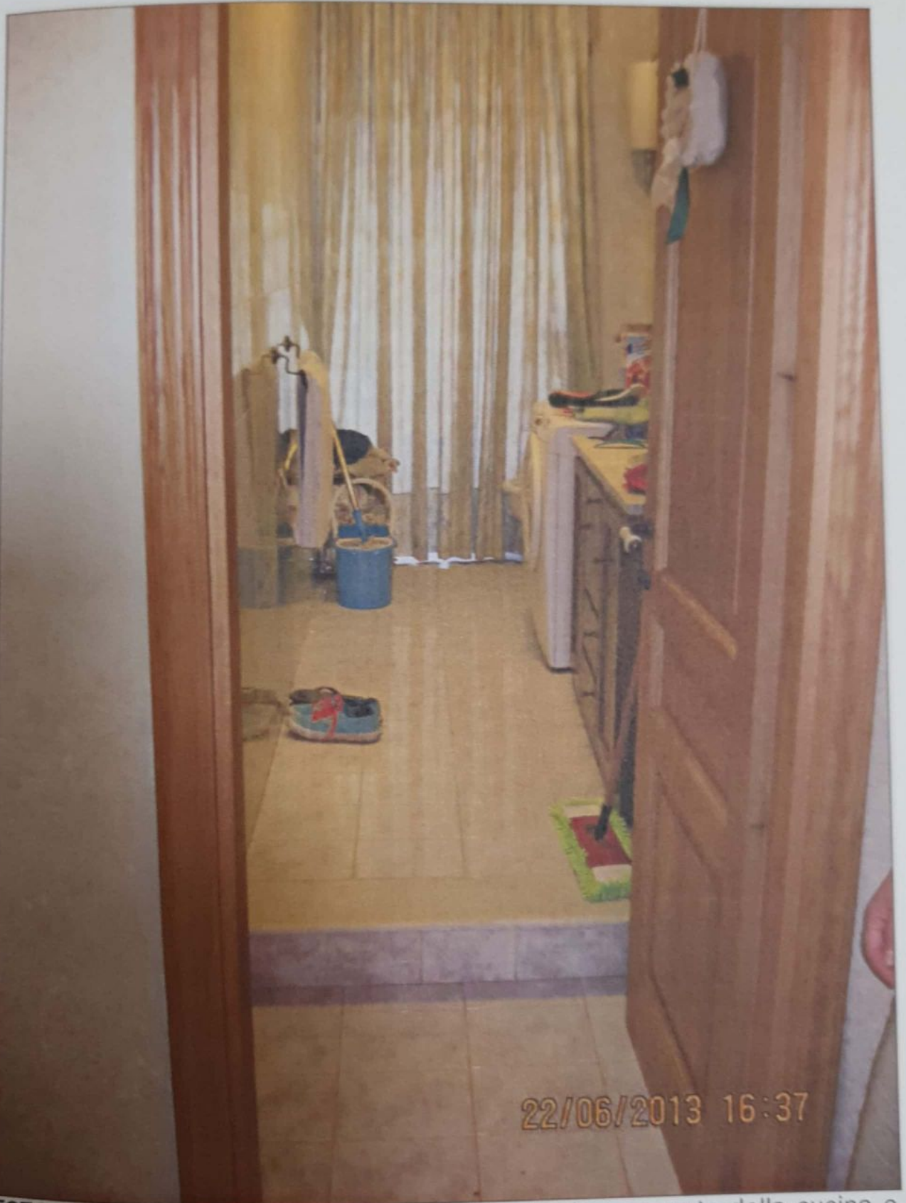
FOTO 12 - Vista del bagno di servizio ricavato da una parte della cucina e dove si riscontra l'ulteriore volume non indicato già nel condono del 1986.