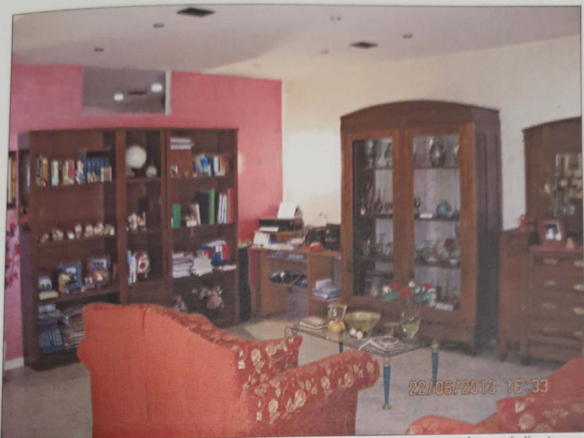
FOTO 10 - Vista del salone, dove si può riscontrare il punto luce della terza camera da letto ricavata da una parte del salone.