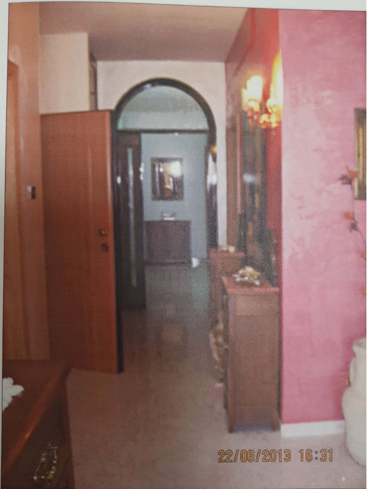
FOTO 3 - Vista dell'ingresso e corridoio dell'immobile oggetto di perizia.