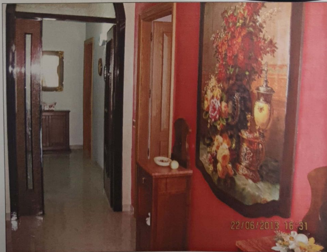
FOTO 2 - Vista del corridoio dell'immobile oggetto di perizia.