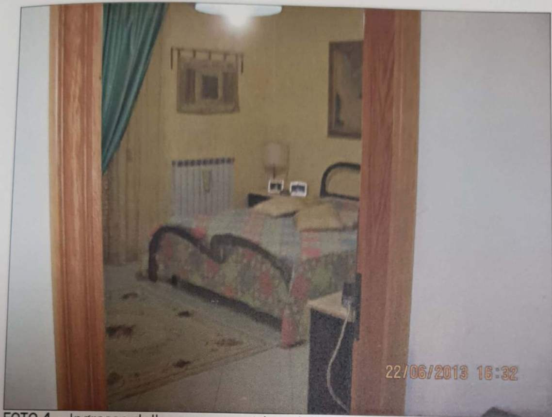
FOTO 4 - Ingresso della camera matrimoniale.