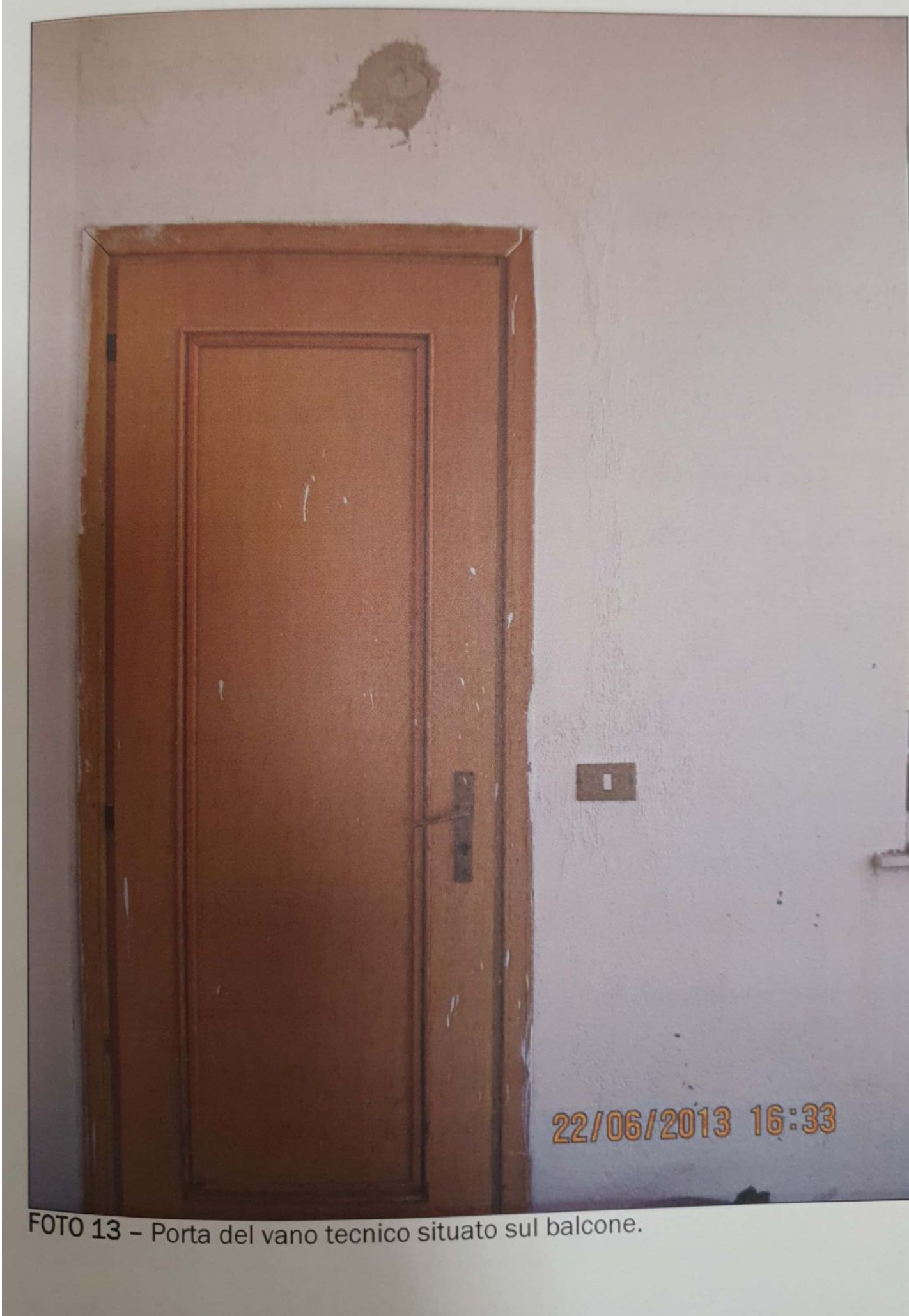
FOTO 13 - Porta del vano tecnico situato sul balcone.