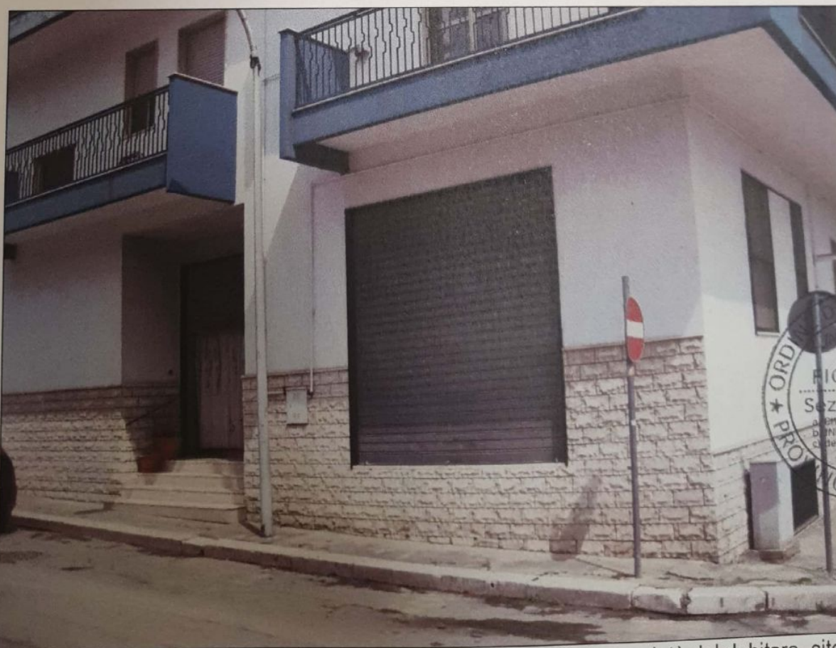
FOTO 10 – Ripresa fotografica esterna dell'immobile non più di proprietà del debitore, sito alla Via Irpinia, n. 6/b, piano terra.