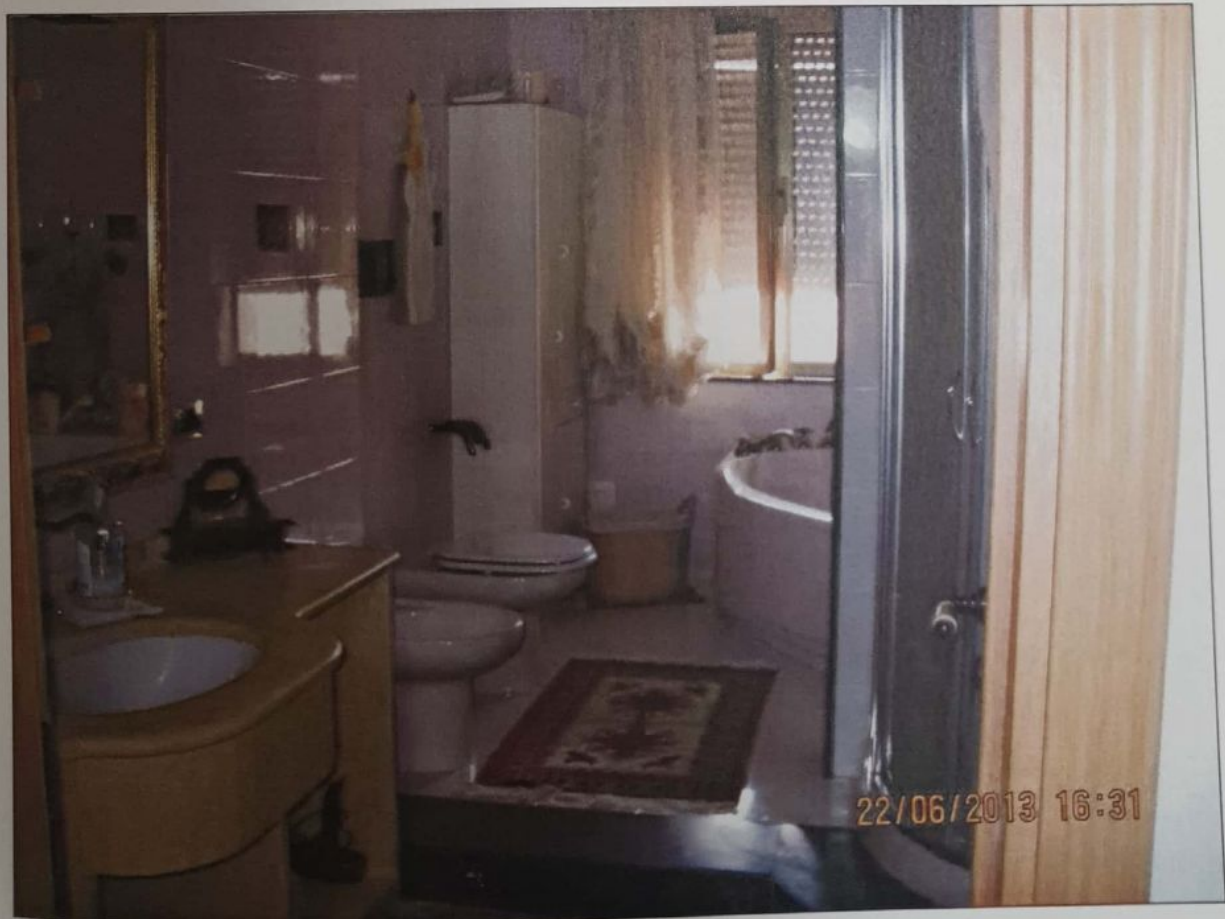
FOTO 9 - Vista del bagno già esistente.