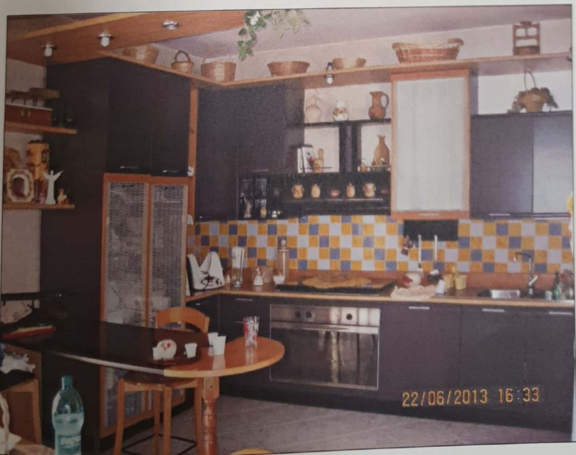
FOTO 11 - Vista della cucina.