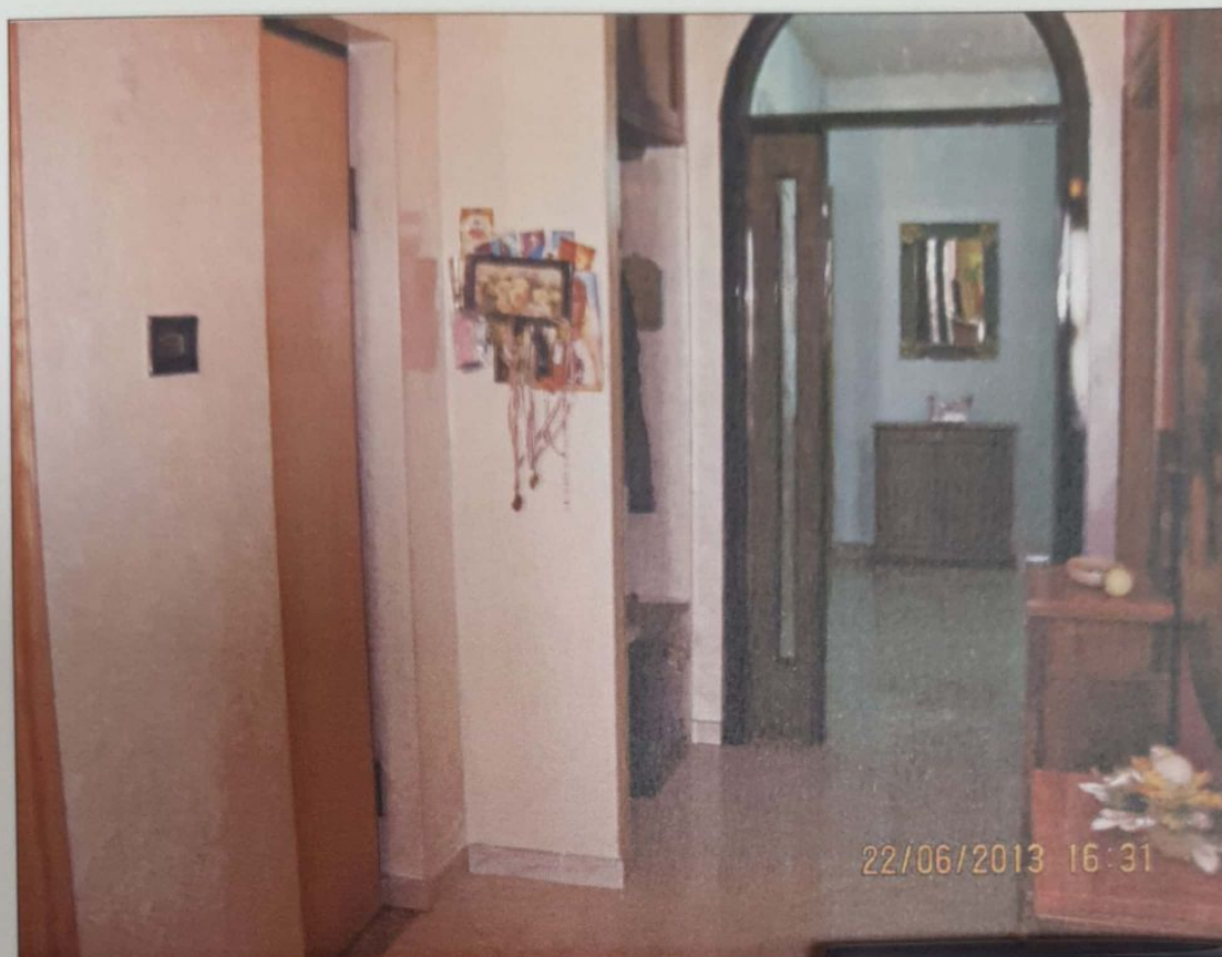
FOTO 1 - Ingresso dell'immobile di proprietà del sig. [redacted] piano di Via Irpinia n. 6 nel Comune di Ortona.