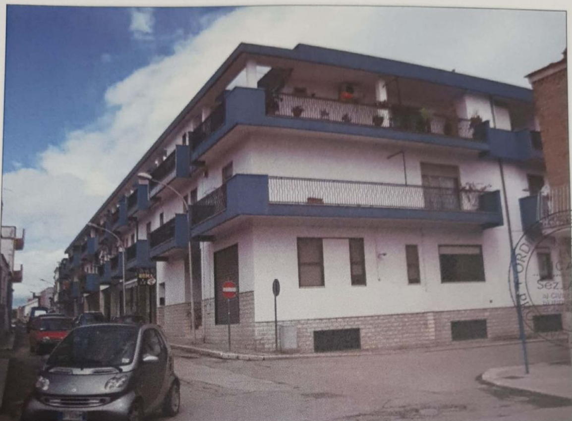
FOTO 9 – Prospetto Ovest dell'immobile oggetto di pignoramento sito al 2° piano.