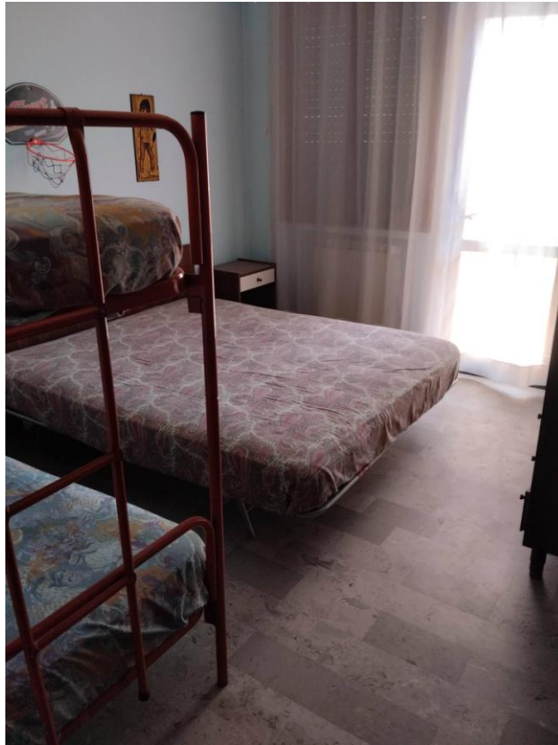
7 – CAMERA