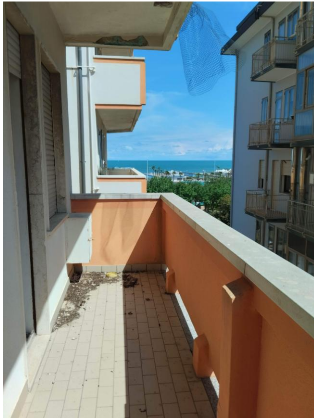
14 - TERRAZZA