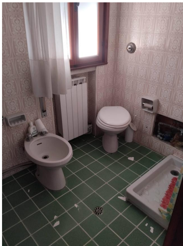
10 – BAGNO