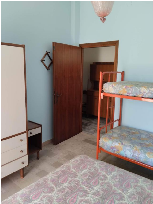
8 – CAMERA