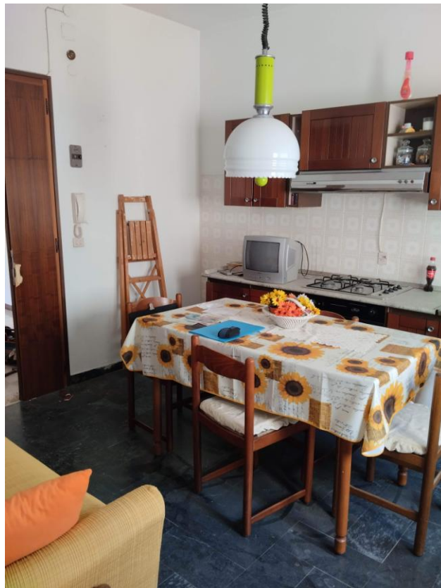
6 - CUCINA