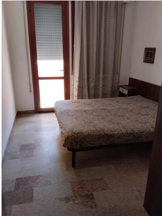
11 – CAMERA