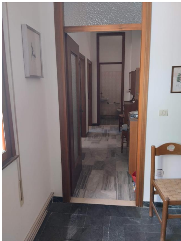
4 - CUCINA VS DISIMPEGNO