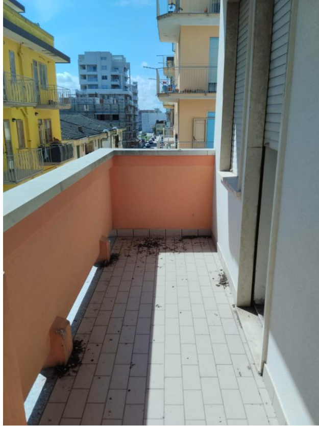
13 – TERRAZZA