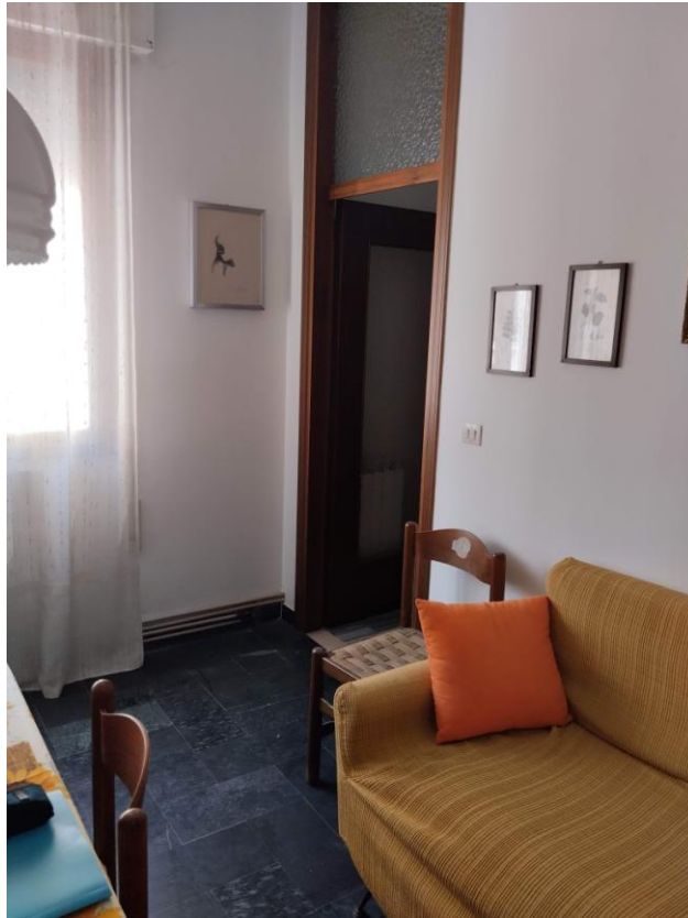
3 - CUCINA