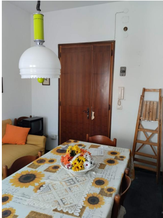
5 - CUCINA