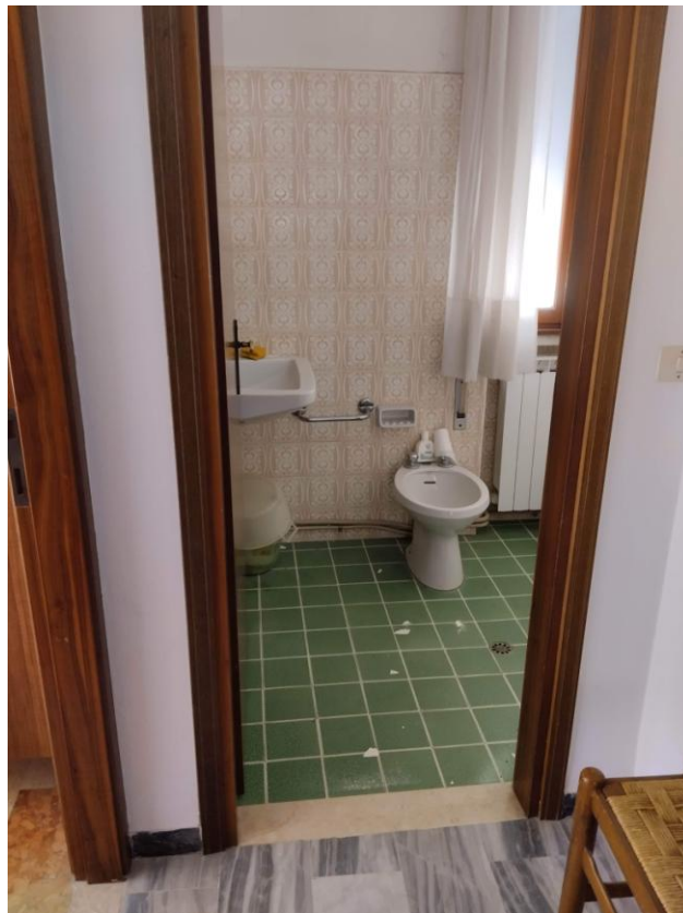
9 – BAGNO