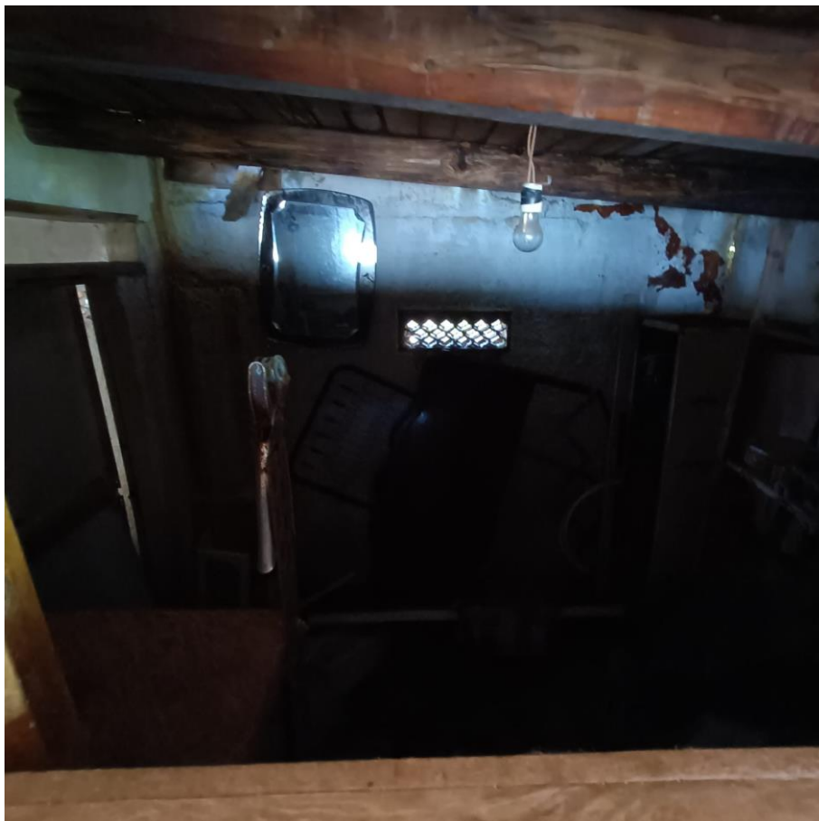
FOTO n.20 - Locale deposito da demolire