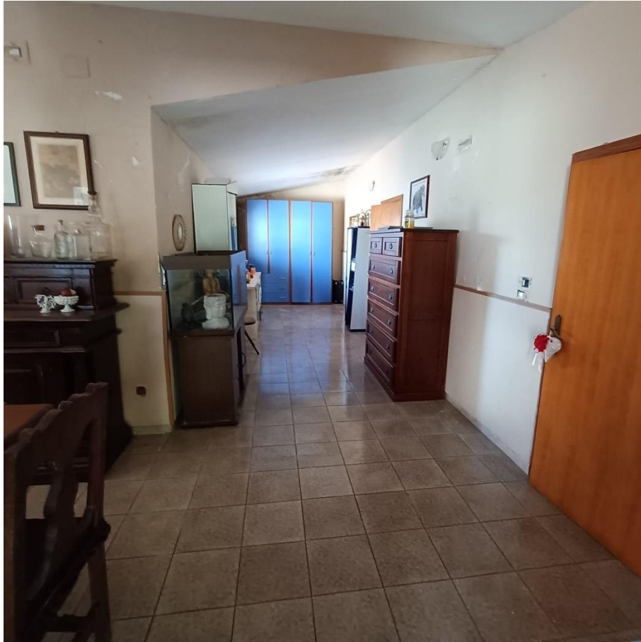
FOTO n.13 - Locale interno