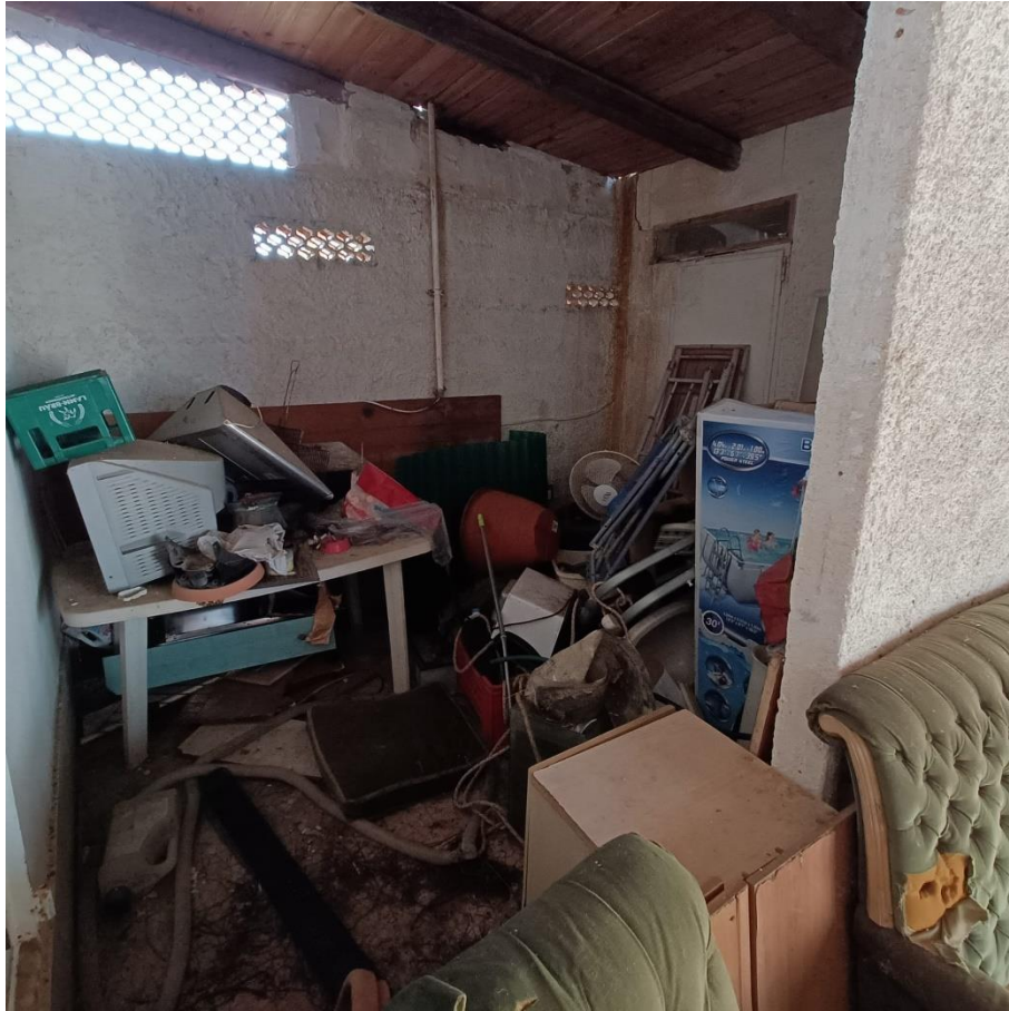
FOTO n.19 - Locale deposito da demolire