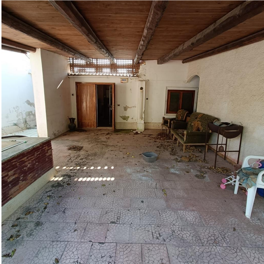
FOTO n.3 - Portico a sud-ovest