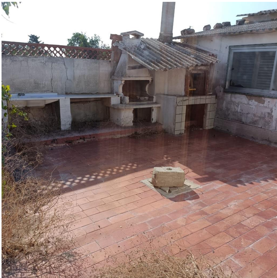
FOTO n.4 - Area retrostante