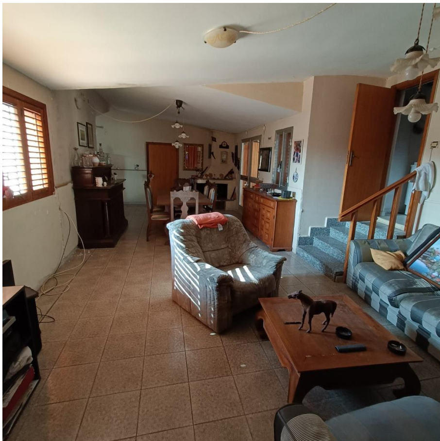
FOTO n.14 - Locale interno