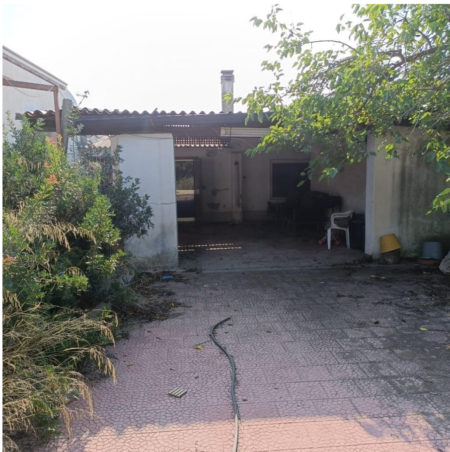
FOTO n.2 - Portico a sud-ovest