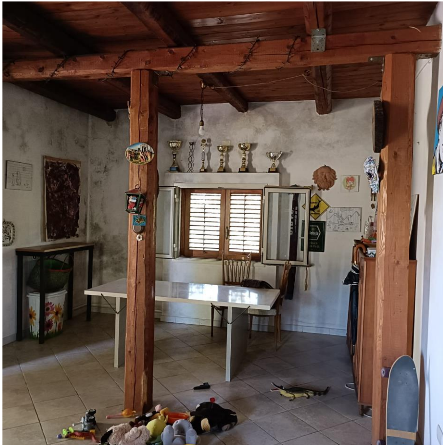
FOTO n.5 - Locale interno