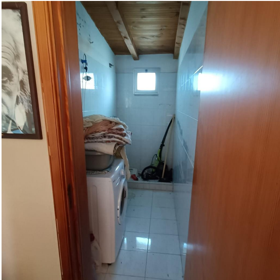
FOTO n.12 - Locale interno