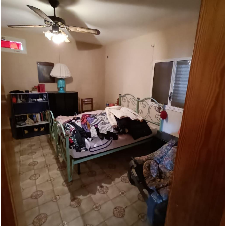
FOTO n.17 - Locale interno