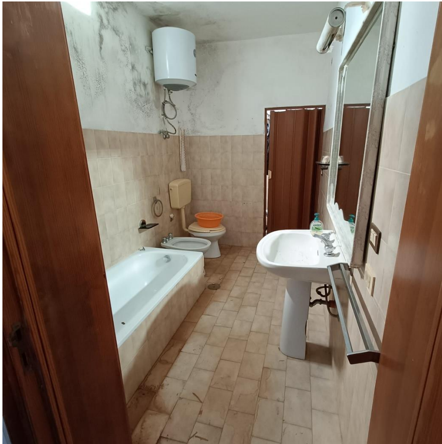
FOTO n.9 - Bagno