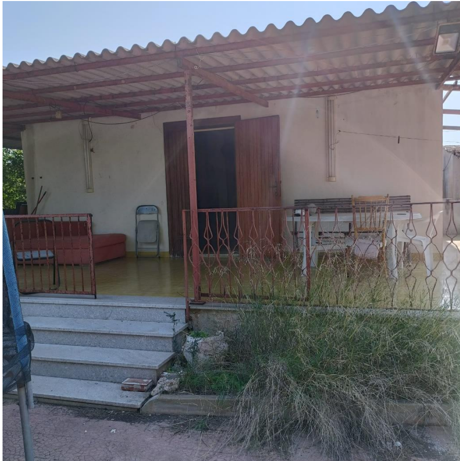
FOTO n.1 - Ingresso fabbricato