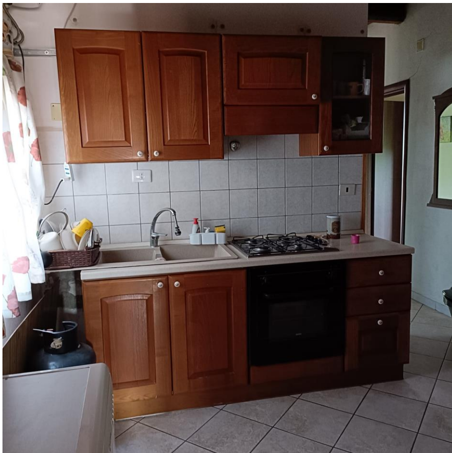
FOTO n.6 - Vano cucina