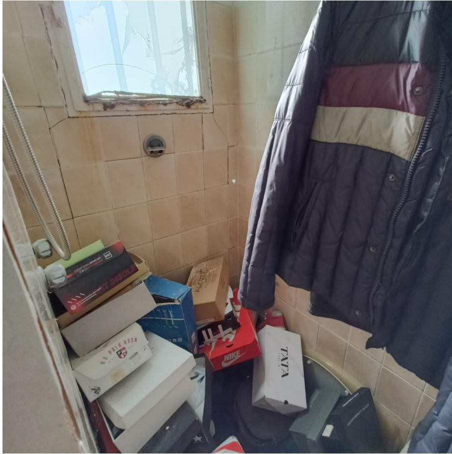
FOTO n.11 - Locale interno