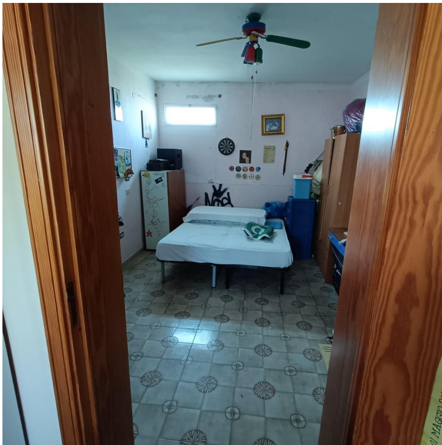
FOTO n.16 - Locale interno