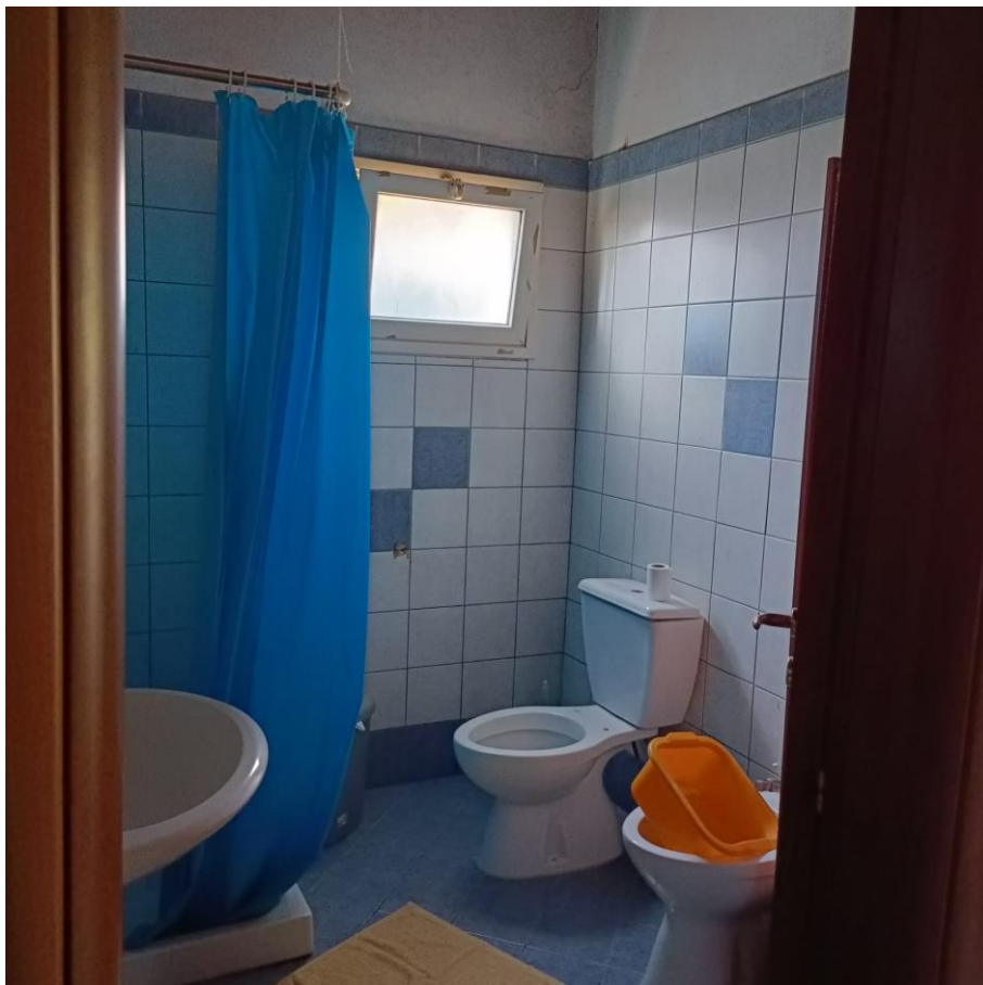
FOTO n.8 - Bagno