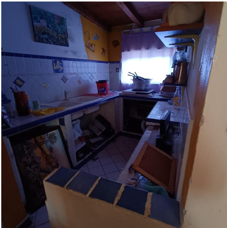
FOTO n.10 - Cucinino