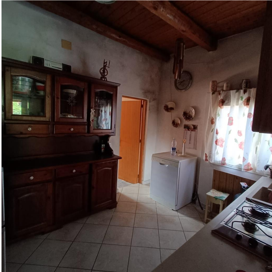
FOTO n.7 - Vano cucina