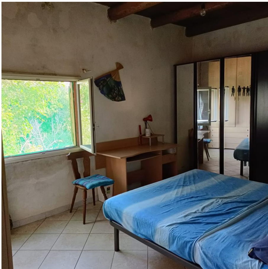
FOTO n.18 - Locale interno