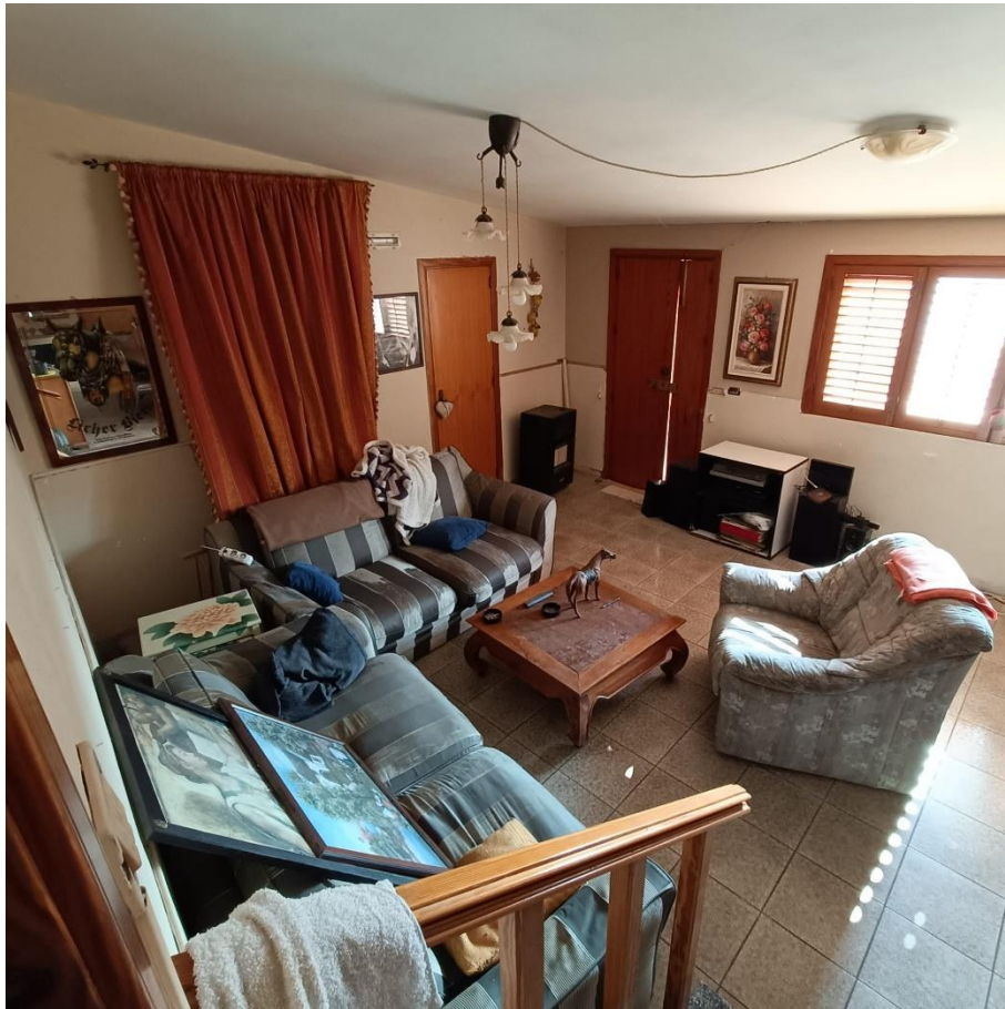
FOTO n.15 - Locale interno