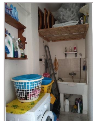
Foto della lavanderia