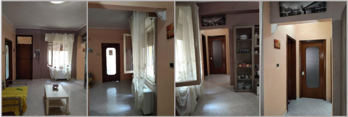
Foto dell'ingresso- salone e disimpegno