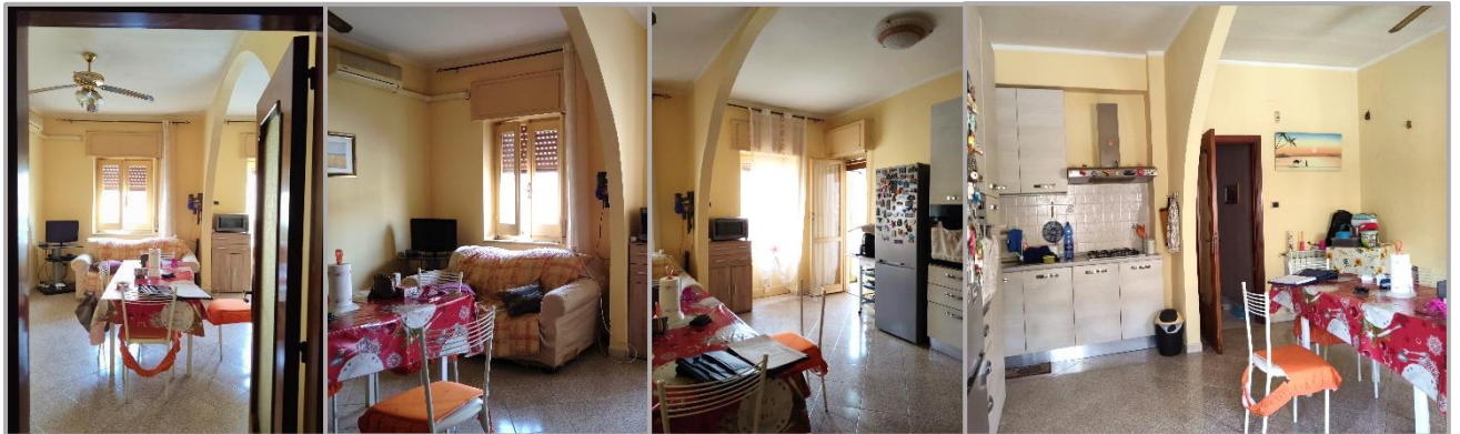
Foto della cucina