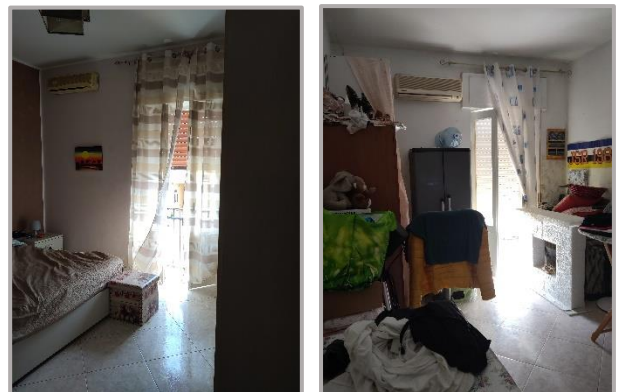
Foto delle due camere da letto