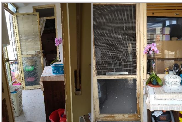
Foto del balcone