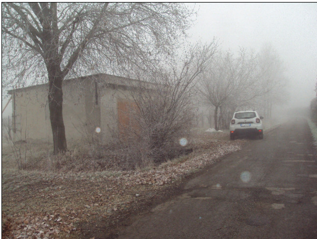
Foto 2: Vista prospettica del fabbricato e dei terreni da via Canale Di Migliarina