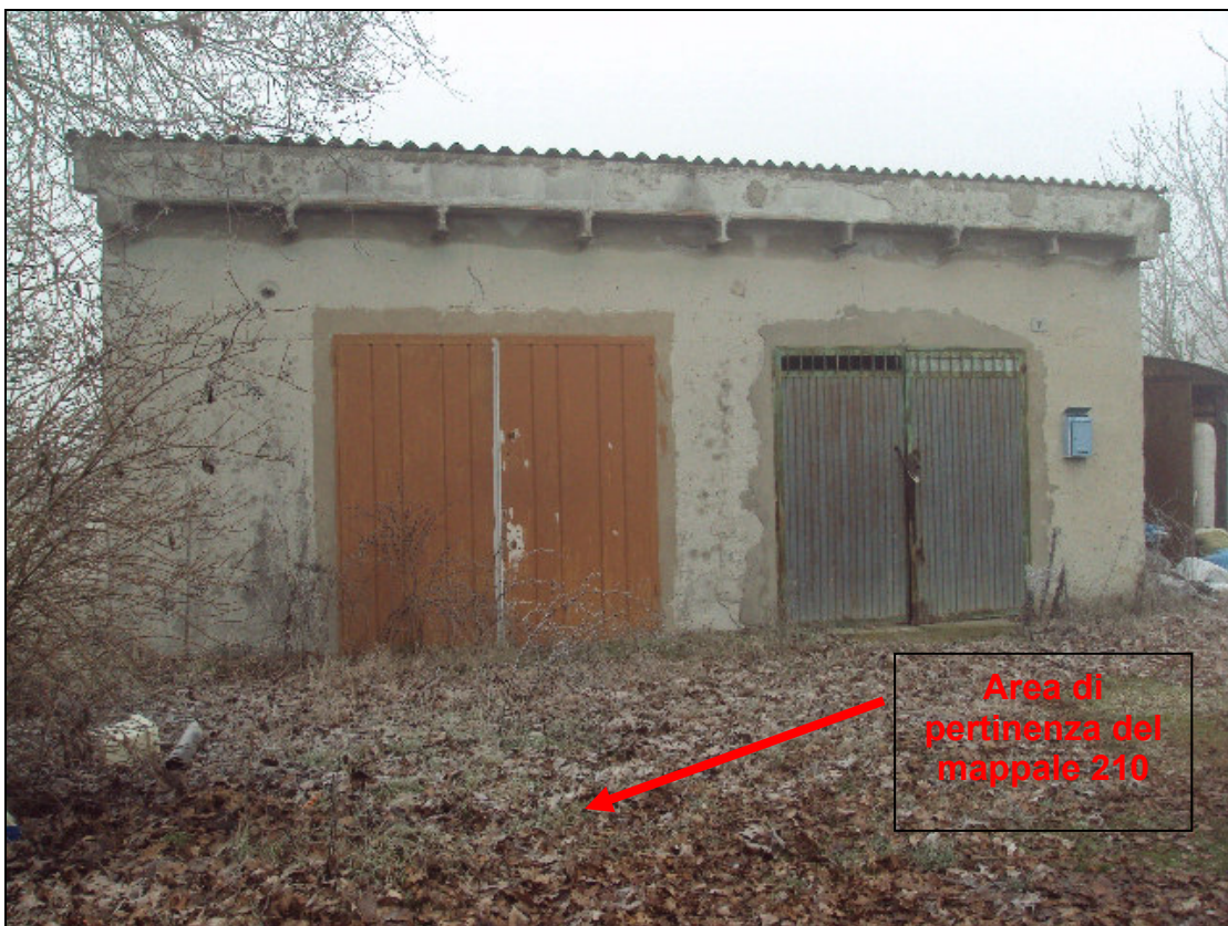
Foto 8: Prospetto principale est del fabbricato in muratura (Foglio 39 mappali 209 e 210) con area di pertinenza del mappale 210