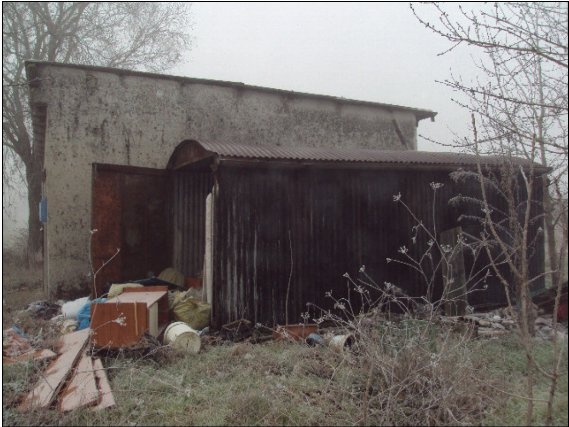
Foto 5: Prospetto laterale nord del fabbricato in muratura e del box prefabbricato in lamiera