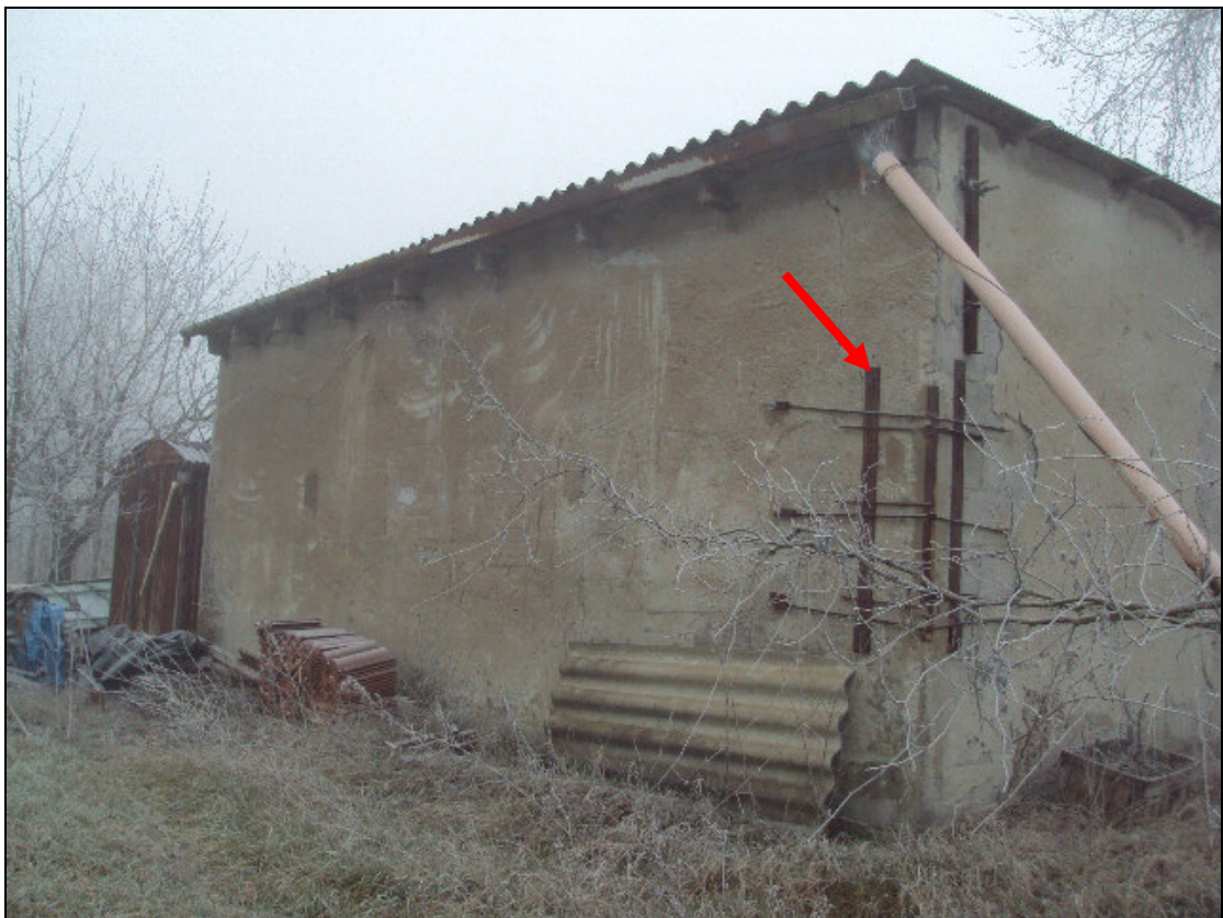
Foto 6: Prospetto retrostante ovest del fabbricato in muratura con sostegni in ferro provvisori e Prospetto retrostante ovest del box prefabbricato in lamiera