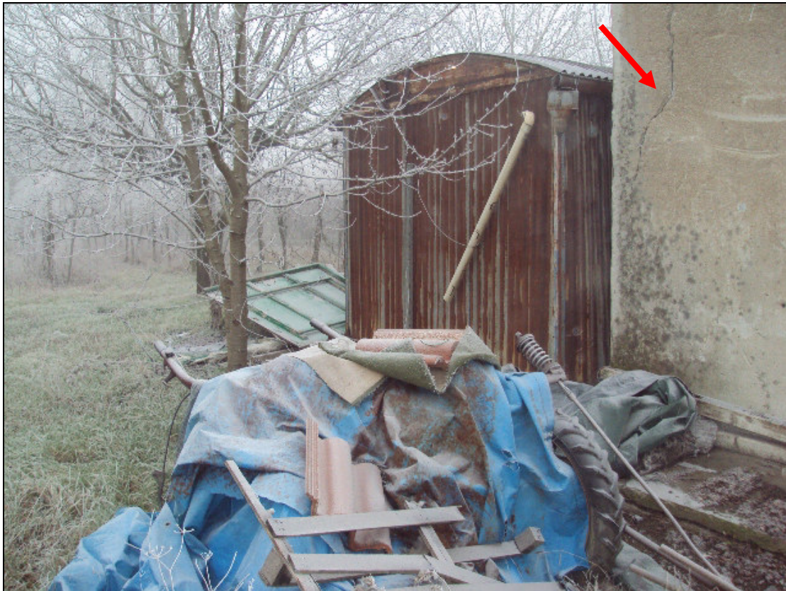
Foto 7: Prospetto retrostante ovest del fabbricato in muratura con quadro fessurativo importante