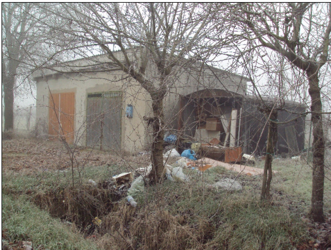
Foto 3: Prospetti principale est e laterale nord del fabbricato in muratura e box prefabbricato in lamiera, con accesso da via Canale Di Migliarina