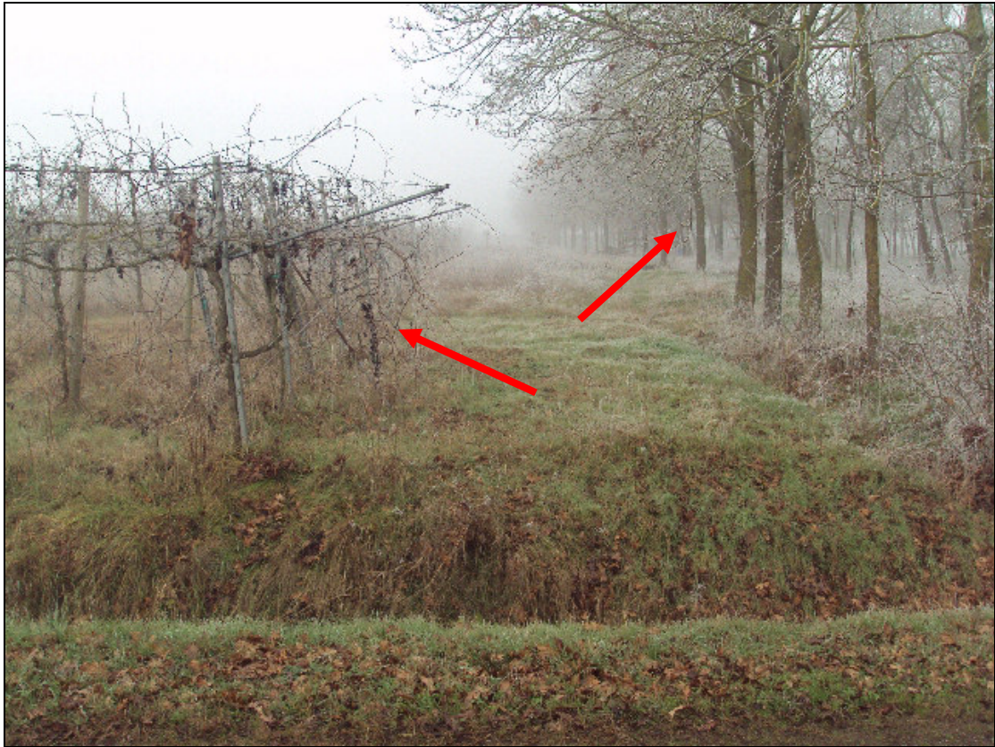
Foto 13: Terreni: Vigneto (mappale 62) e Vigneto, attualmente bosco (mappale 63)