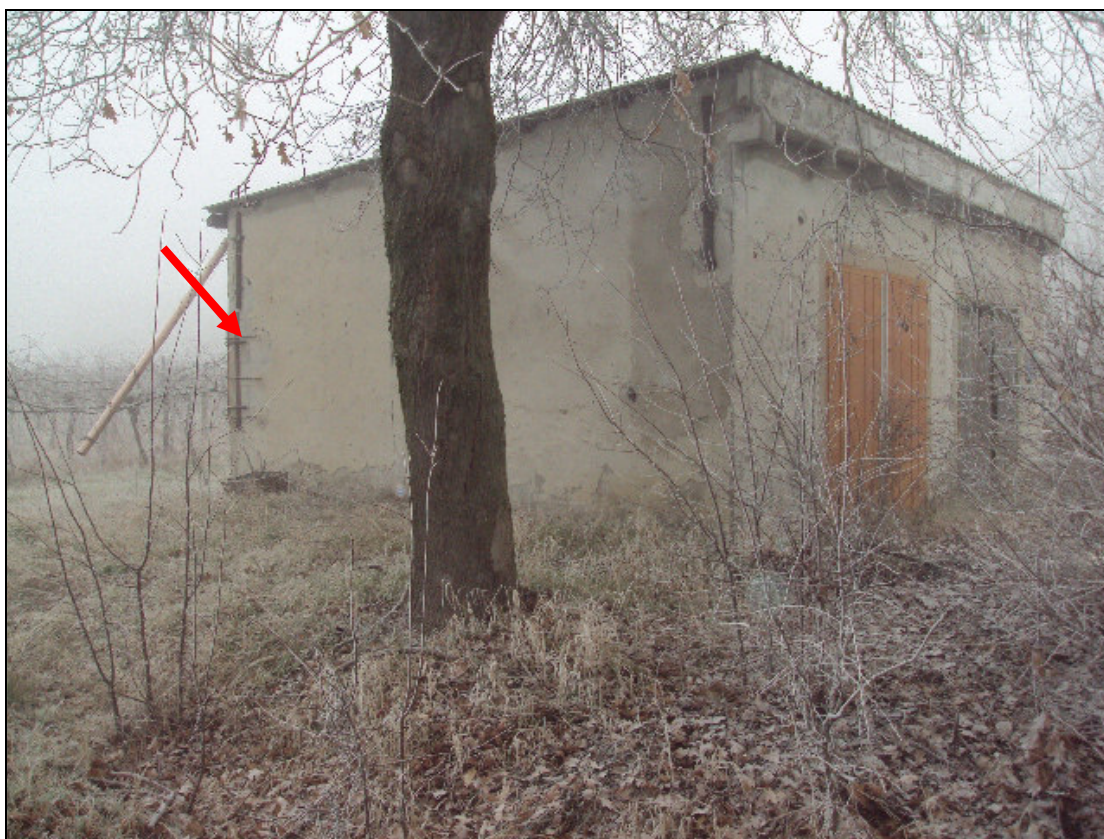
Foto 4: Prospetti principale est e laterale sud del fabbricato in muratura con sostegni in ferro provvisori