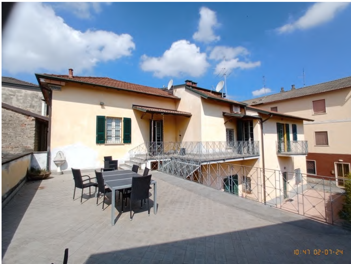
Vista d'insieme da est (Lato cortile comune)