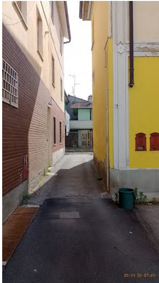
Passaggio dalla pubblica via verso il cortile comune