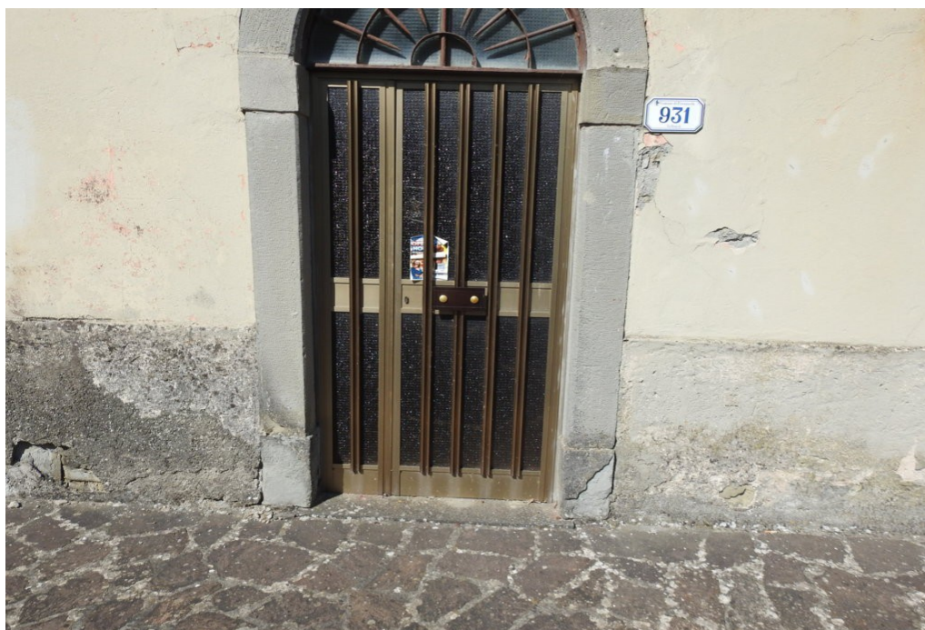
porta di ingresso