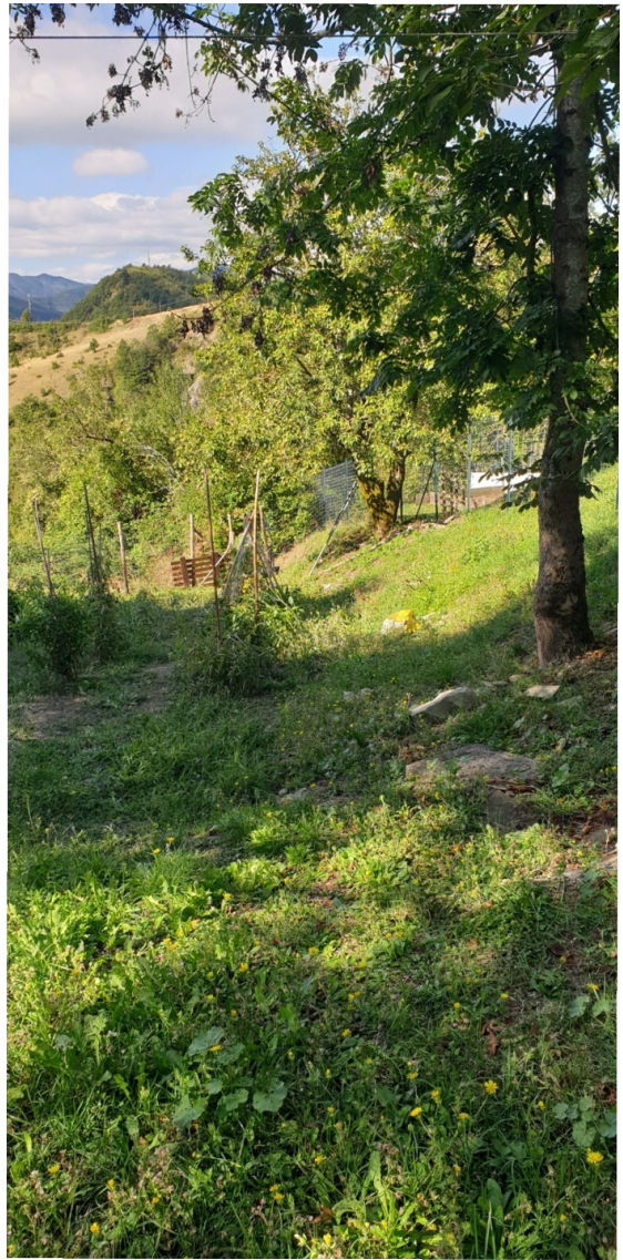
terreno di pertinenza