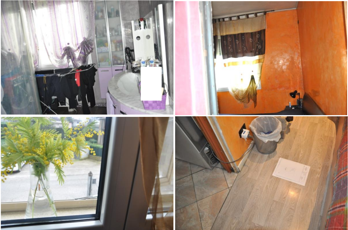
5. Particolare degli interni dell'abitazione (Sub 12).