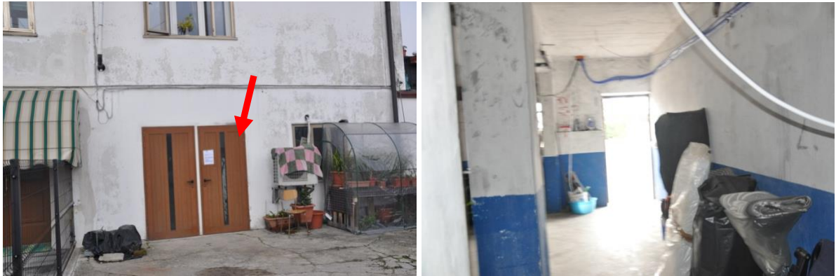
7. Piano terra. Il portone di destra da accesso al magazzino (Sub 14). Il portone di sinistra al sub 9 di proprietà di terzi, escluso dal compendio in vendita.