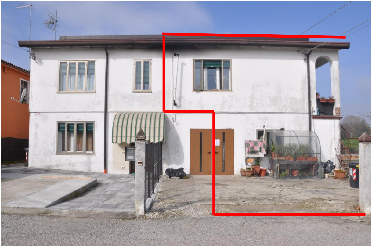
1. Facciata est. A destra la porzione pignorata. La recinzione non individua il confine fra i due cortili (si veda l'allegato 4) sommariamente individuato dalla linea rossa.