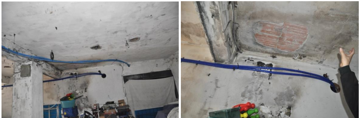
9. Piano terra. La zona dove si è sviluppato l'incendio.