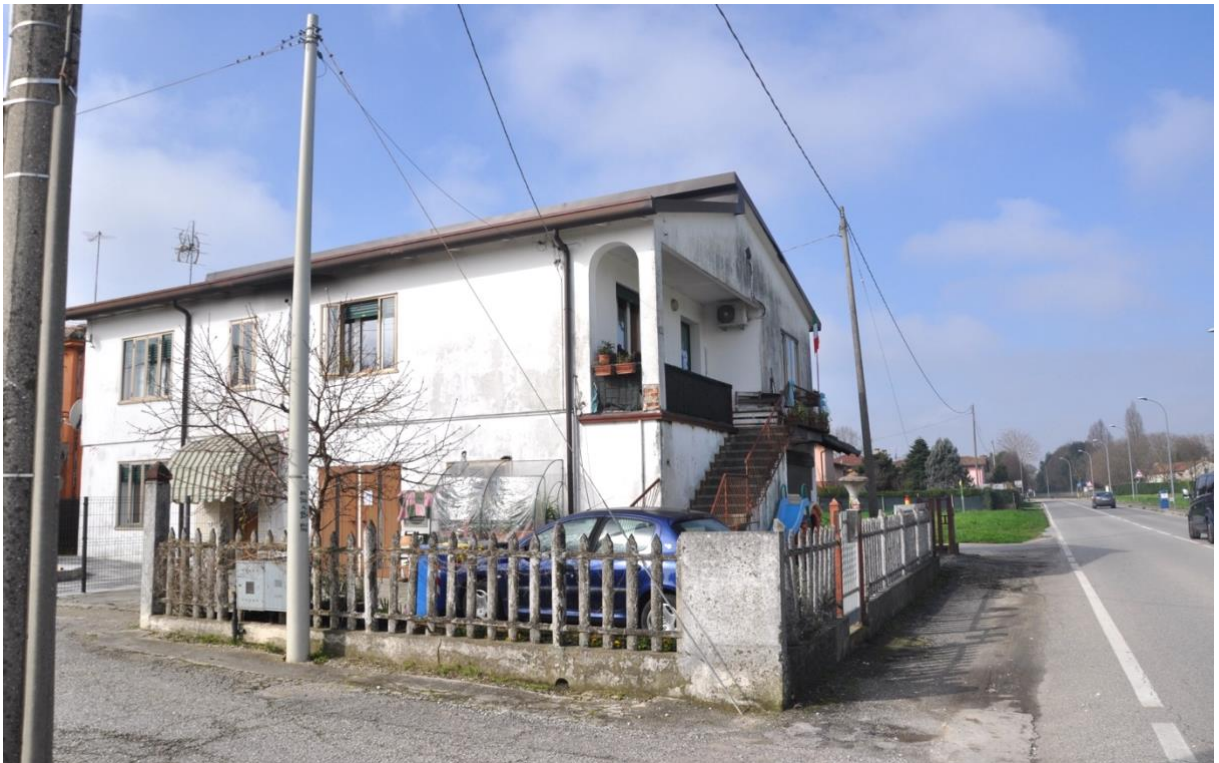
2. Facciata est e nord.