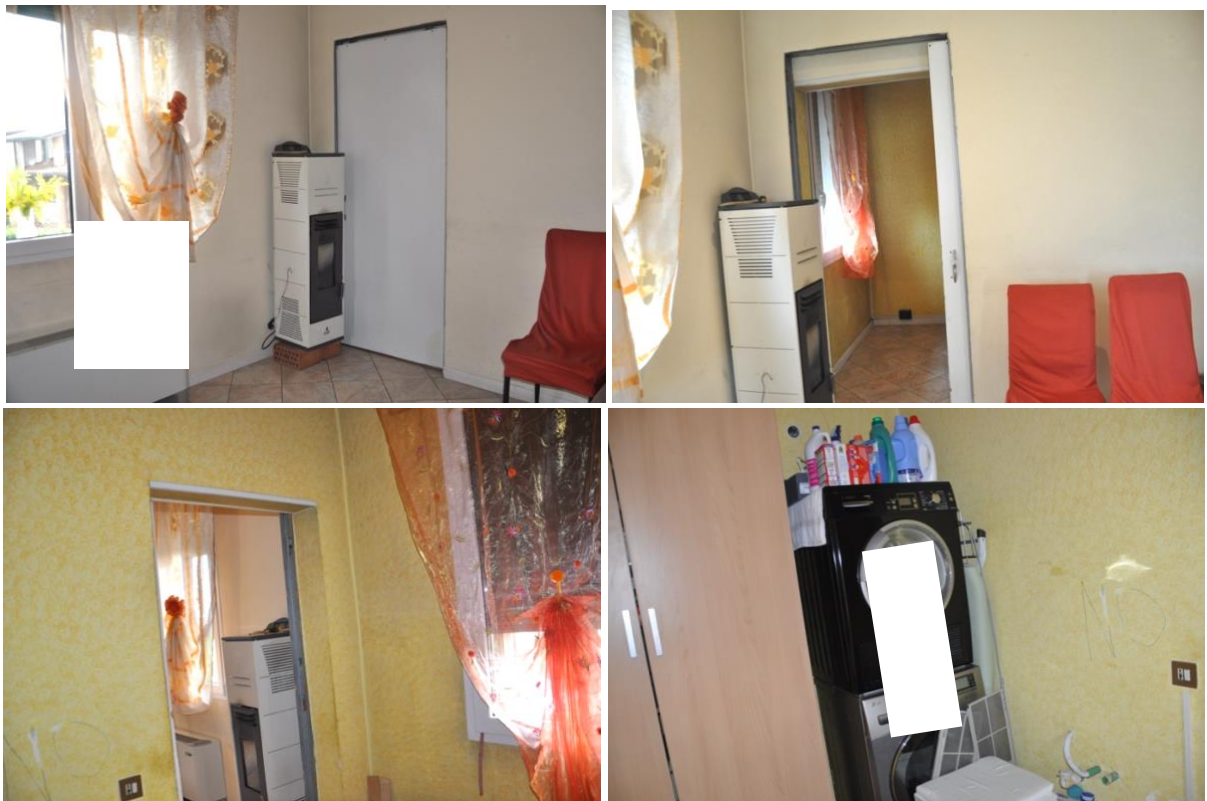
6. Ripostiglio comunicante con l'abitazione (Sub 13).