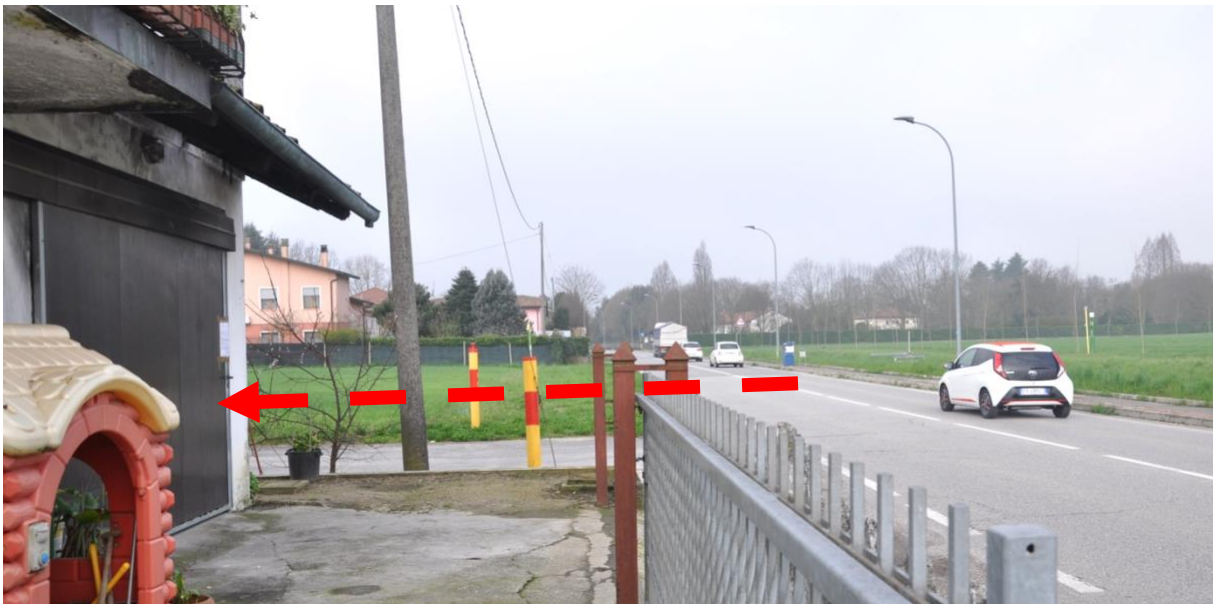
8. Piano terra. Accesso carraio al garage (Sub 11).