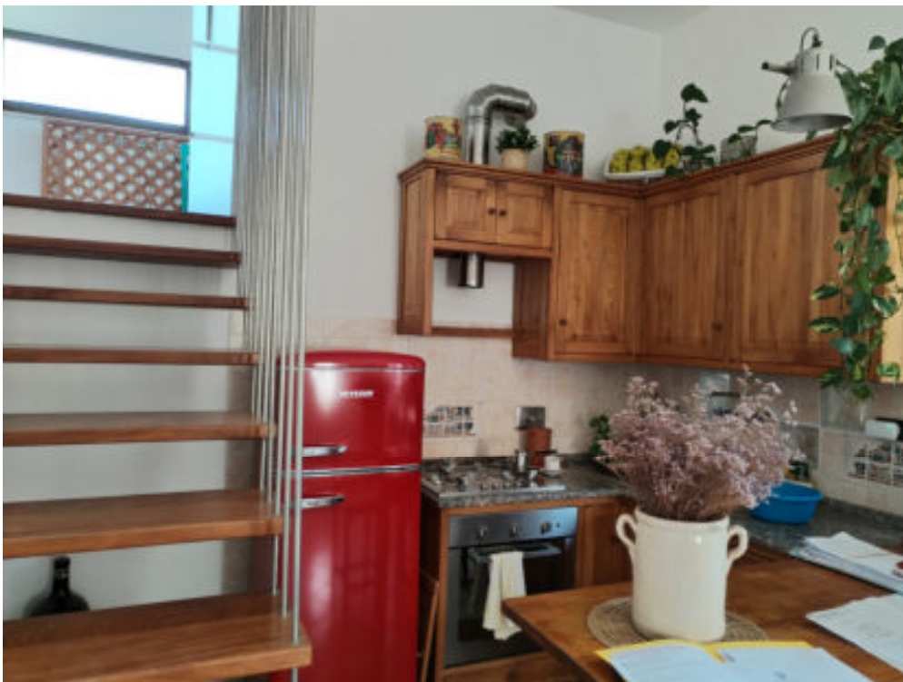
Foto n°15: interno del soggiorno/pranzo al piano rialzato ( particolare della scala di accesso al disimpegno mezzanino )