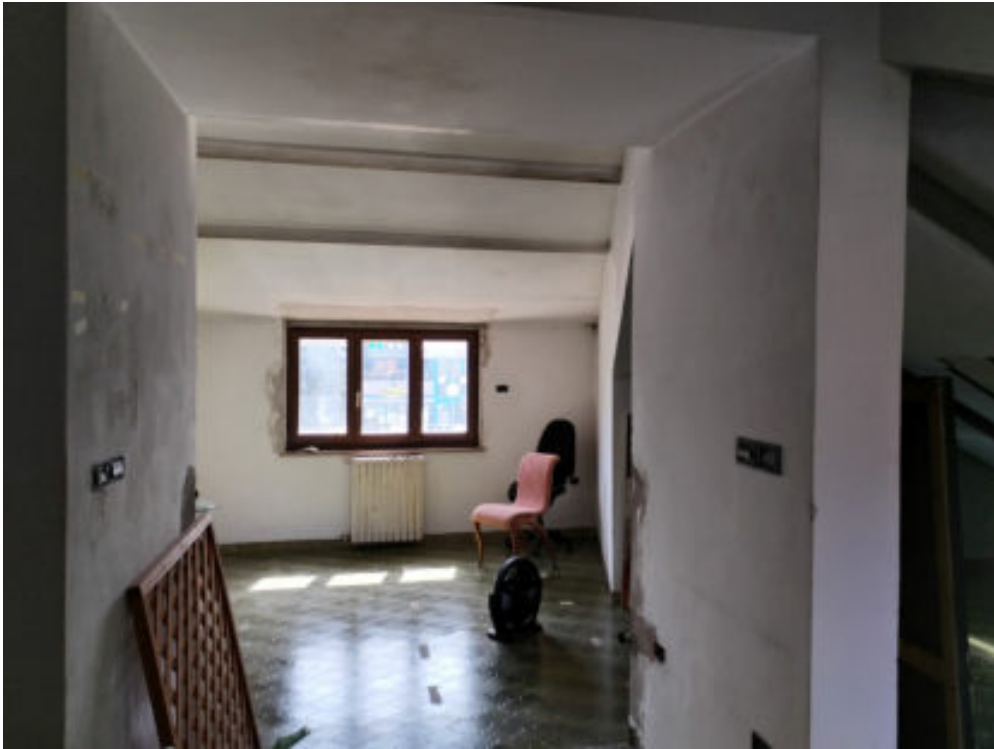
Foto n°20: interno della soffitta - particolare dell'abbaino sul prospetto ovest -