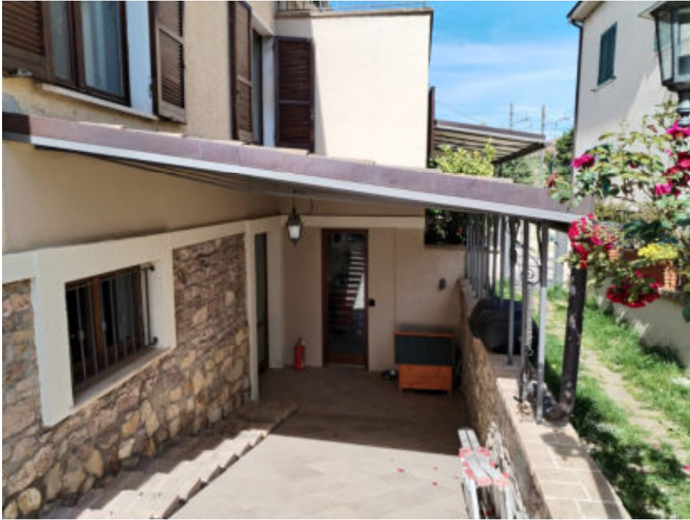
Foto n°10: rampa di accesso al piano primosottostrada e tettoia sovrastante – particolare della rampa con porta di accesso al P1S dal prospetto sud -