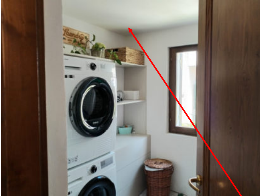
Foto n°14: interno della lavanderia al piano rialzato – particolare di tracce di umidità -