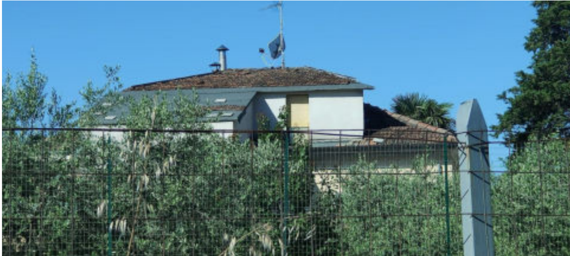
Foto n° 8/c: prospetto est del fabbricato oggetto di stima – particolare dell’abbaino visto dalla ferrovia -