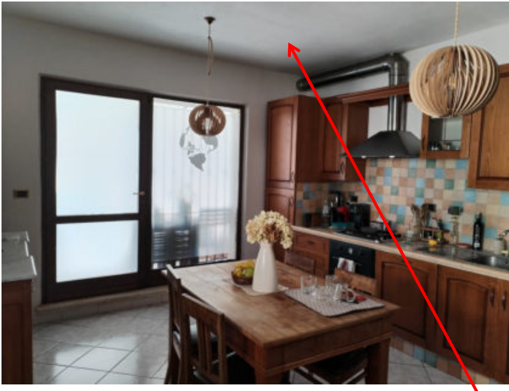
Foto n°25: cucina al piano terra – particolare del soffitto con tracce di umidità -