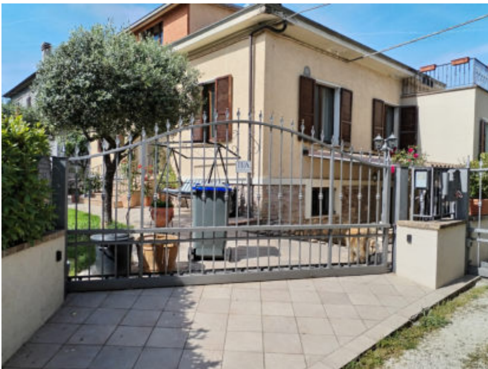
Foto n° 6: ingresso carrabile di accesso al fabbricato oggetto di stima