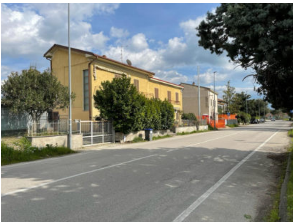
Foto n° 2: vista della zona fra Via Pasciana e Via F. Bettini ( lato sinistro provenendo da Spello )