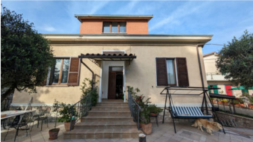
Foto n° 5: prospetto ovest del fabbricato oggetto di stima – particolare dell'abbaino e della scala d'ingresso al piano rialzato