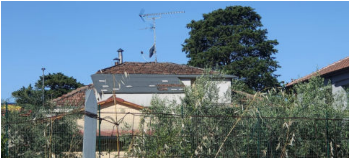
Foto n° 8/b: prospetto est del fabbricato oggetto di stima – particolare del vano disimpegno visto dalla ferrovia -