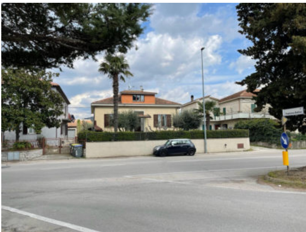
Foto n° 4: vista del fabbricato oggetto di stima nell'incrocio fra Via Pasciana e Via F. Bettini