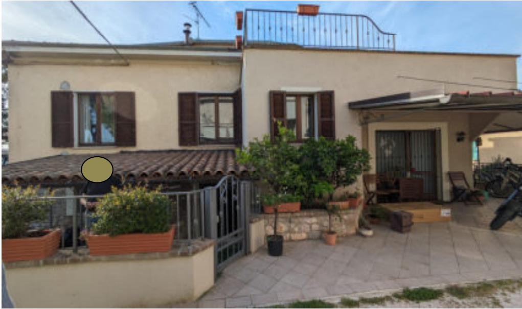
Foto n° 7 prospetto sud del fabbricato oggetto di stima – particolare della tettoia sud-est -