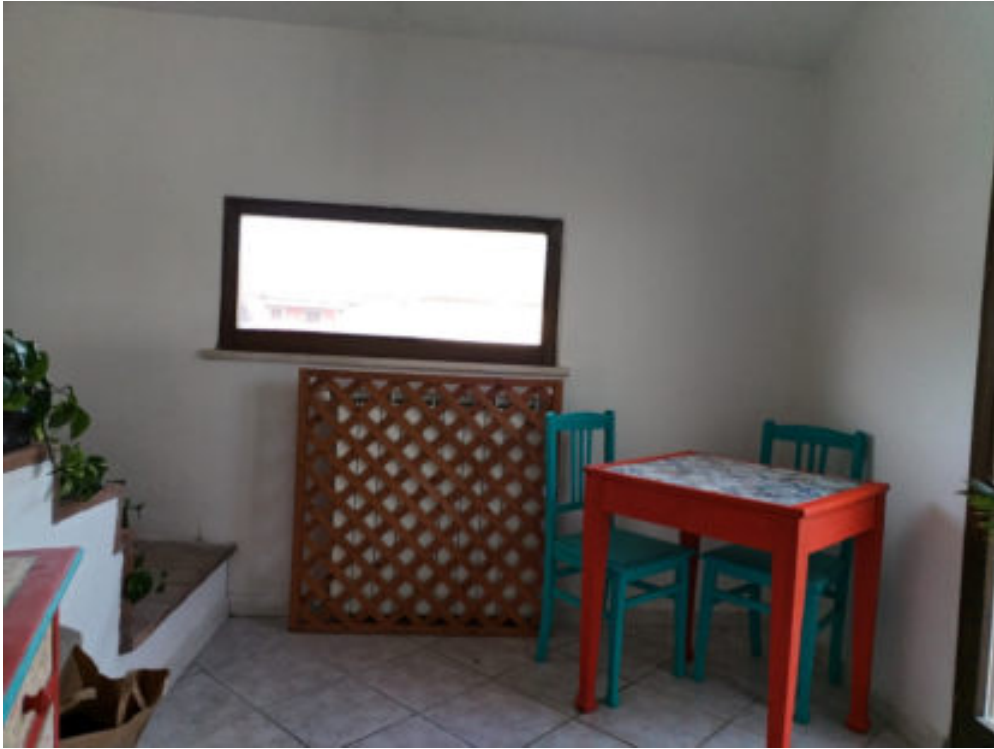
Foto n°16: interno del disimpegno mezzanino che conduce al piano soffitta ed al terrazzo