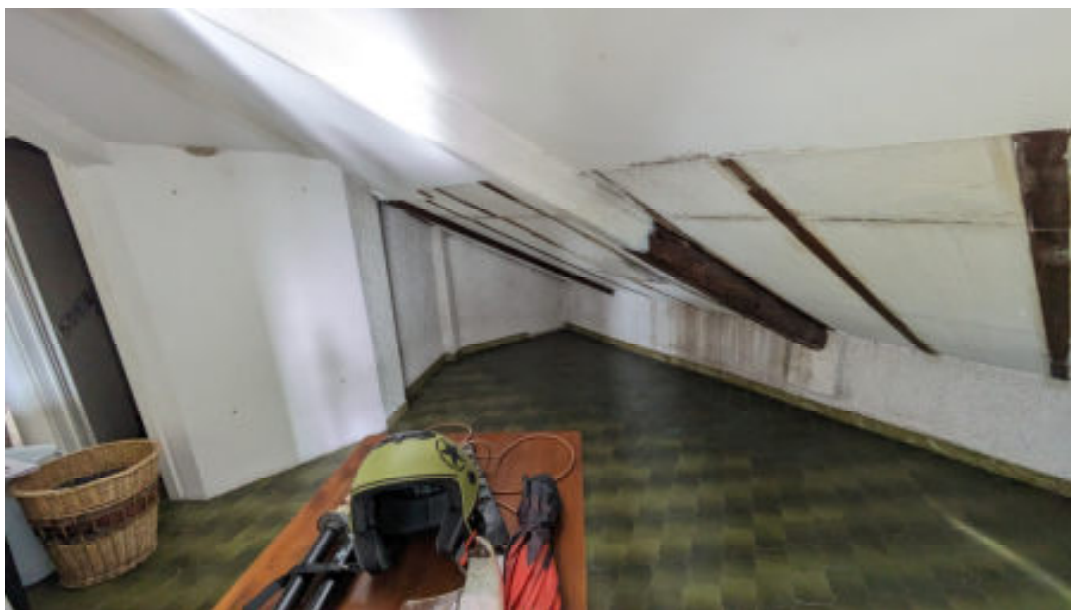
Foto n° 22: particolare del solaio di copertura in legno in precarie condizioni di manutenzione e conservazione