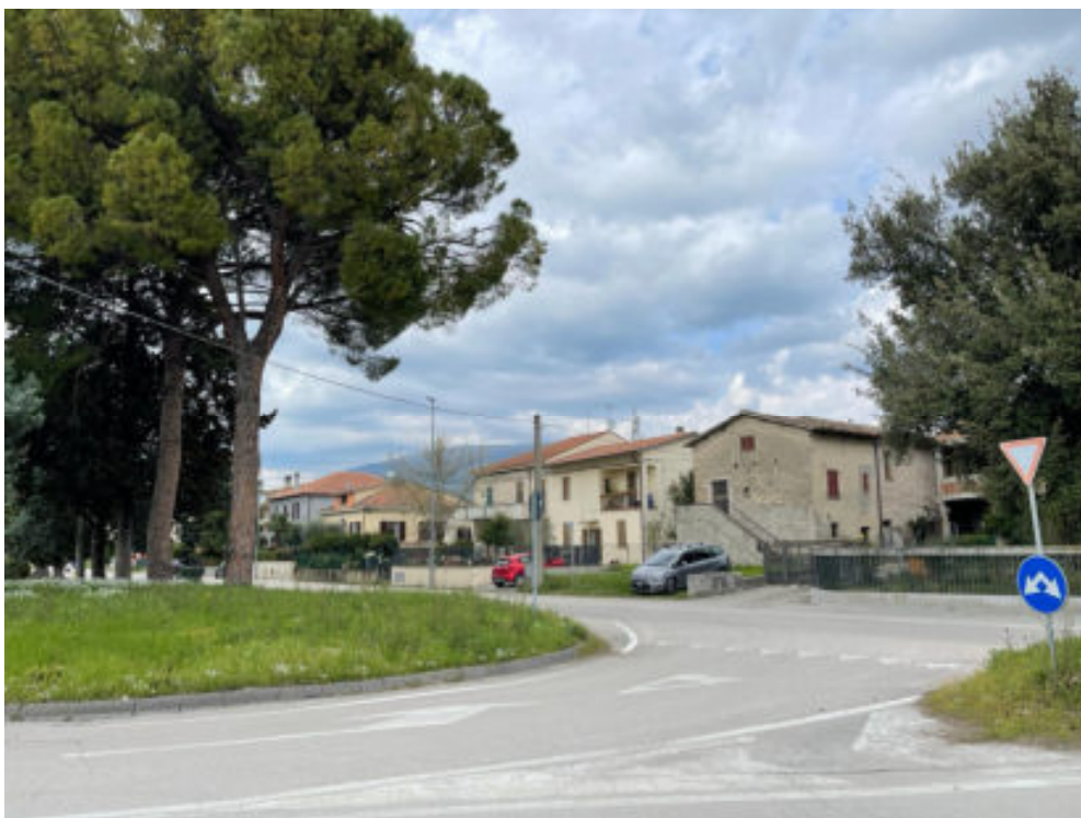
Foto n° 1: vista della zona fra Via Pasciana e Via F. Bettini ( lato destro provenendo da Spello )