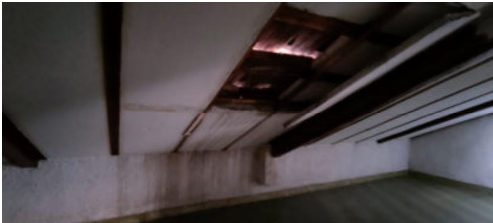
Foto n° 21: particolare del solaio di copertura in legno in precarie condizioni di manutenzione e conservazione ( si evidenziano infiltrazioni di acqua )