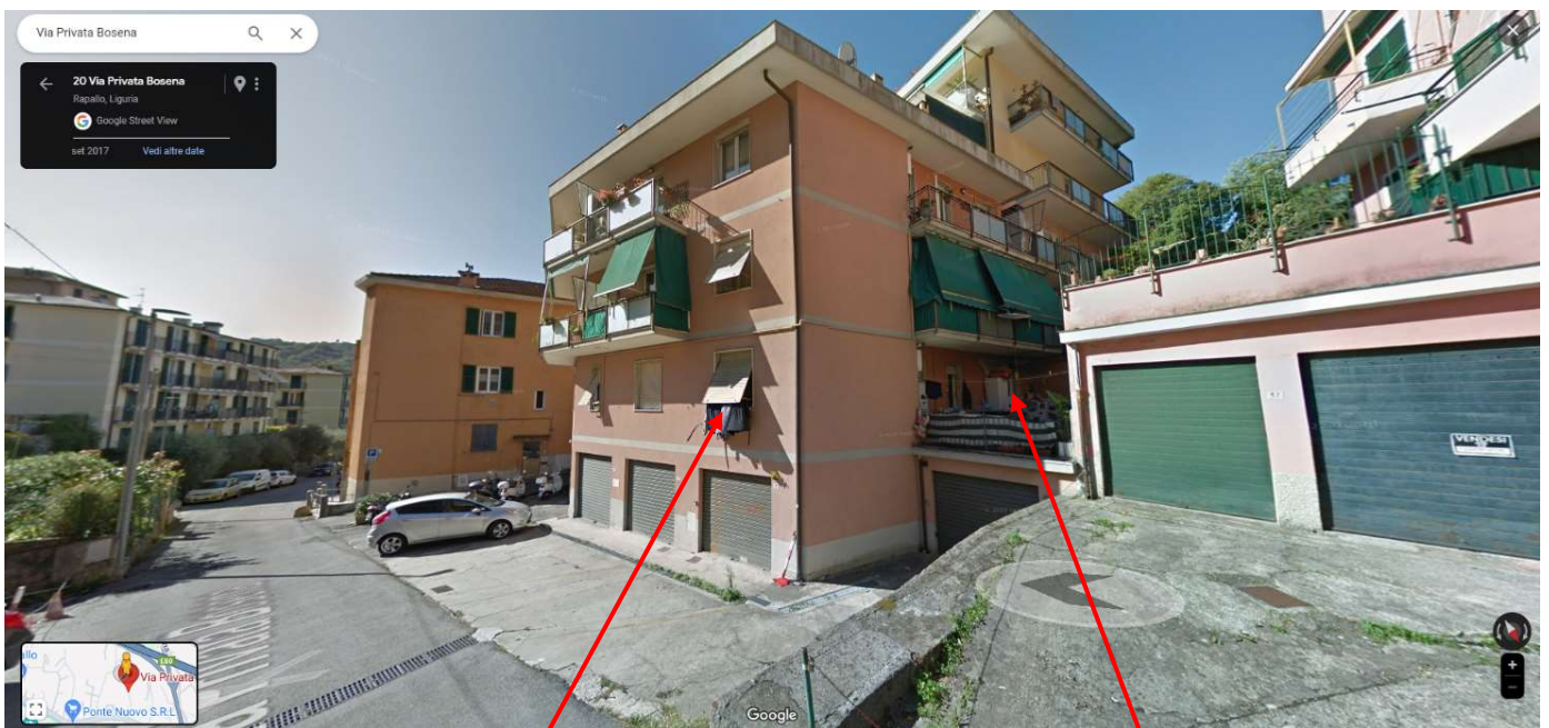
Finestra camera u.i. in oggetto