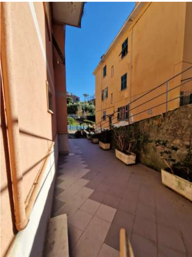
Foto 8 – 9 - 10: Accesso al condominio e area antistante il portone