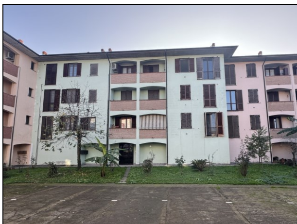
Foto 1: Prospetto del fabbricato nel quale è inserita l'unità immobiliare pignorata.