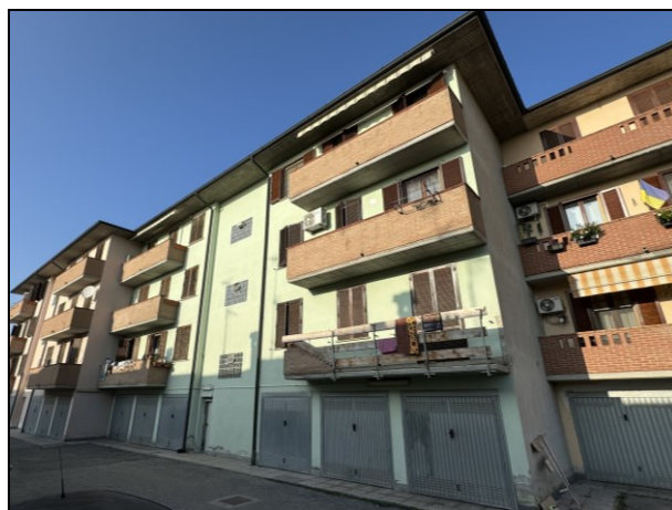
Foto 2: Prospetto del fabbricato nel quale è inserita l'unità immobiliare pignorata.