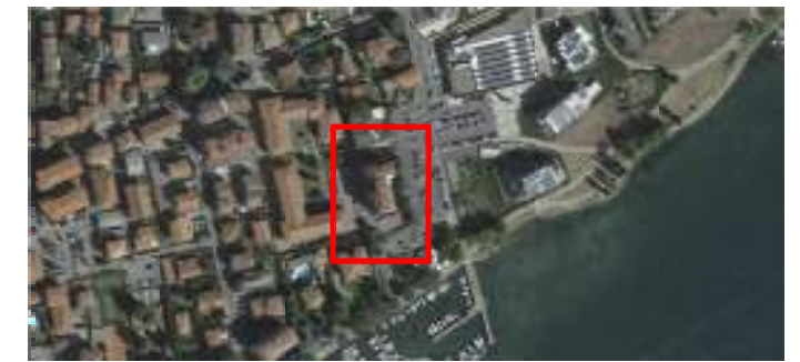
estratto fotogrammetrico

Sup lorda di pavimento: 109,28 mq Sup lorda terrazzo: 4,40 mq