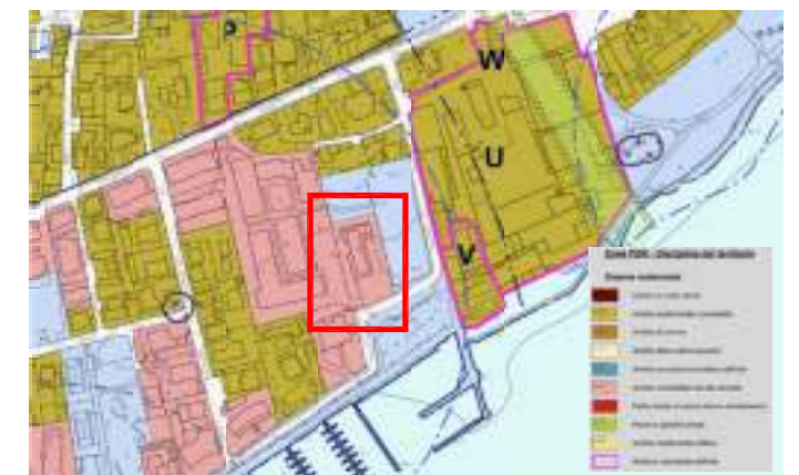
estratto PdR PGT vigente (fonte sito comunale)