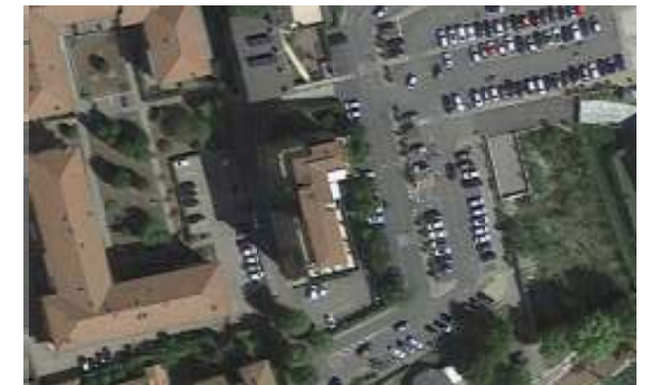
estratto fotogrammetrico