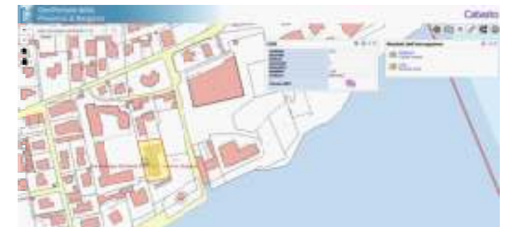
estratto mappa