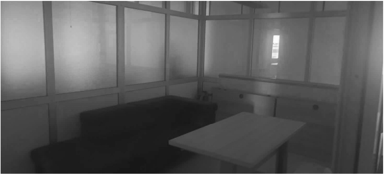
Foto n. 13 Sala interna