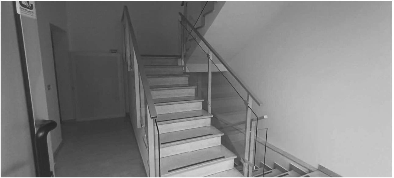
Foto n. 7 androne scale