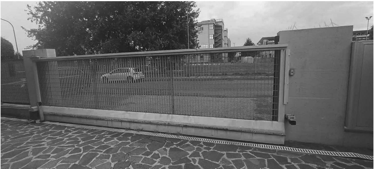
Foto n. 3 cancello carraio automatizzato per accesso ai posti auto