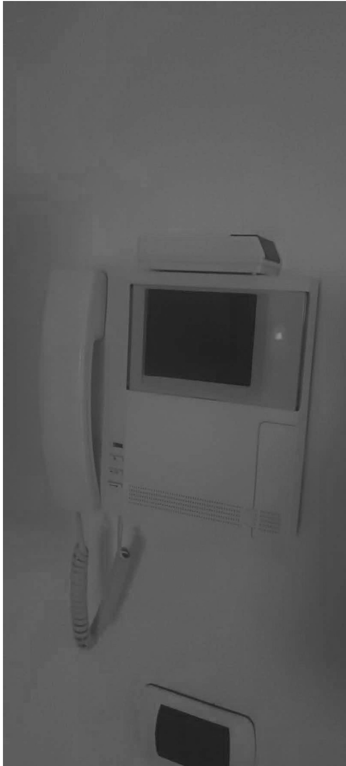
Foto n. 20 Impianto citofonico - particolare