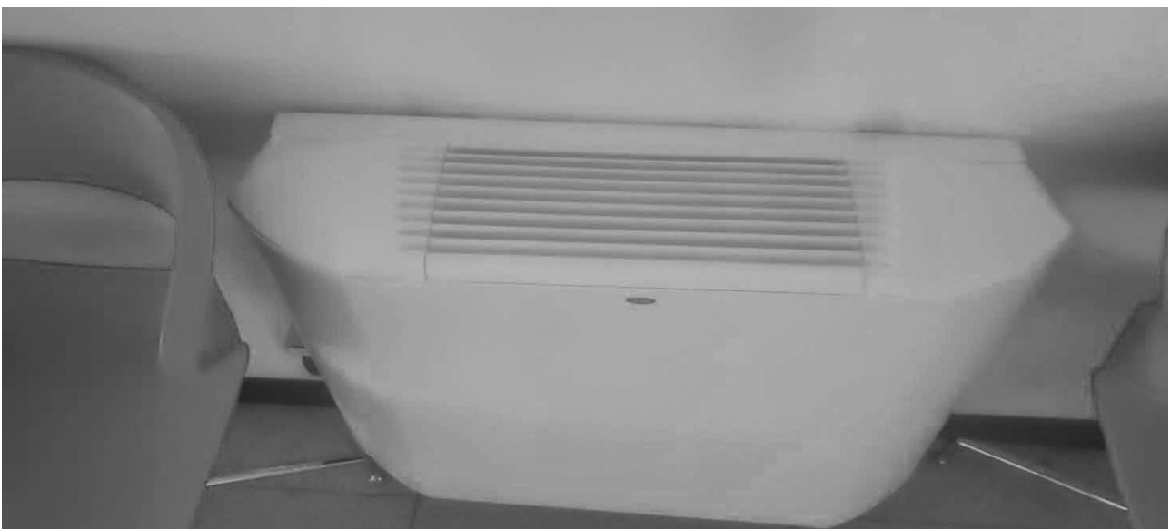
Foto n. 19 Diffusore aria fredda/calda - particolare