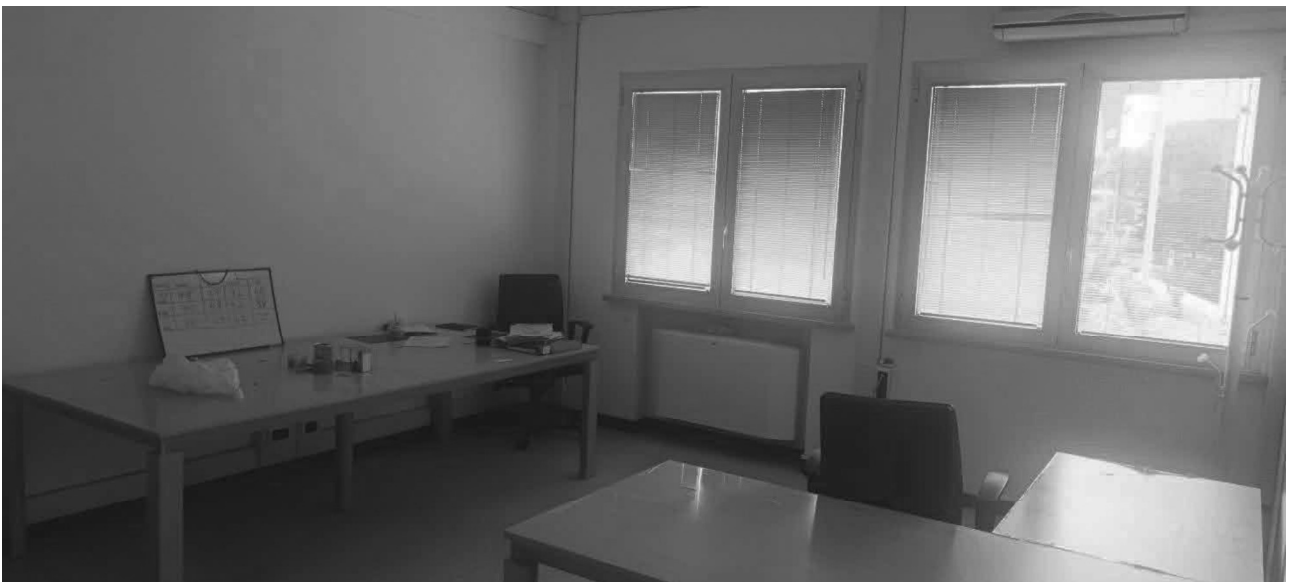
Foto n. 12 Ufficio 2