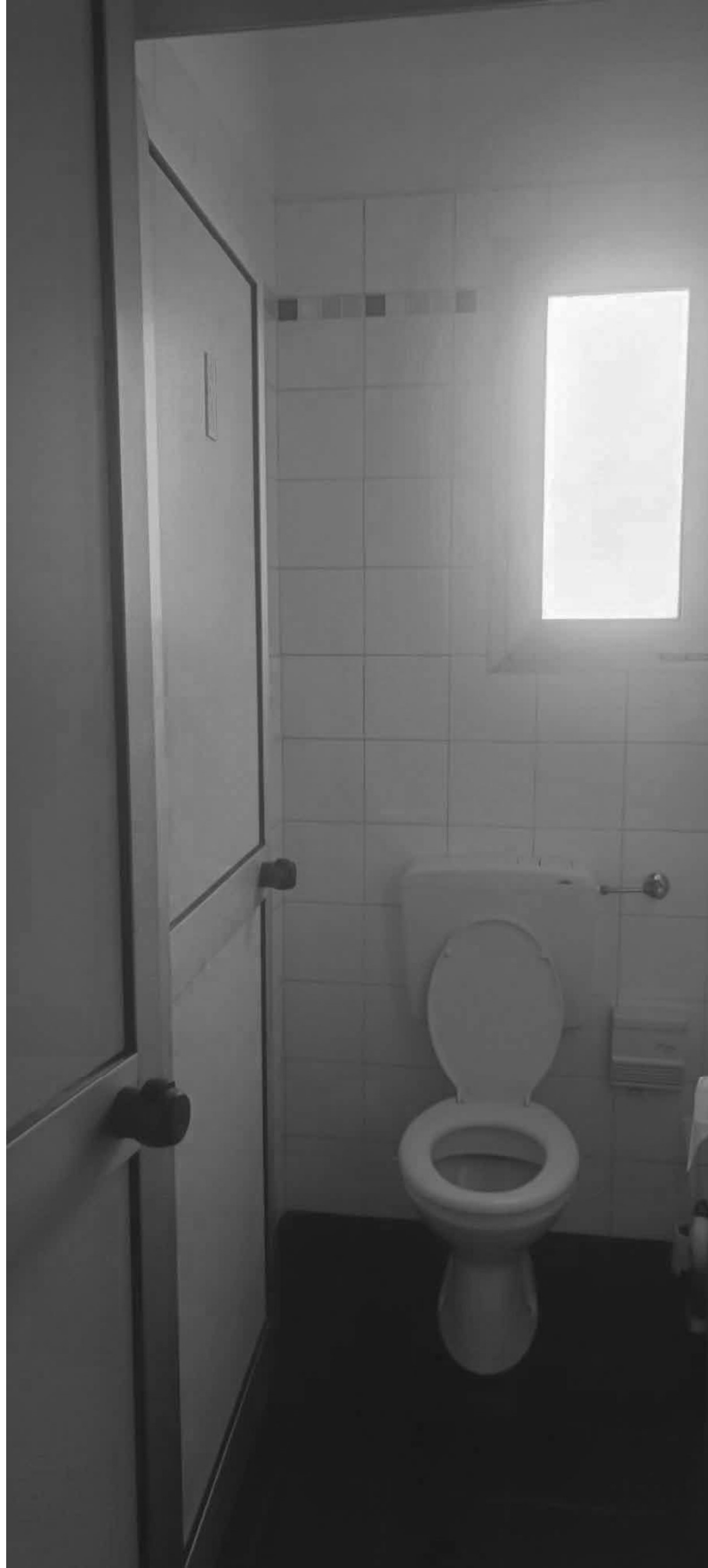
Foto n 16 servizi