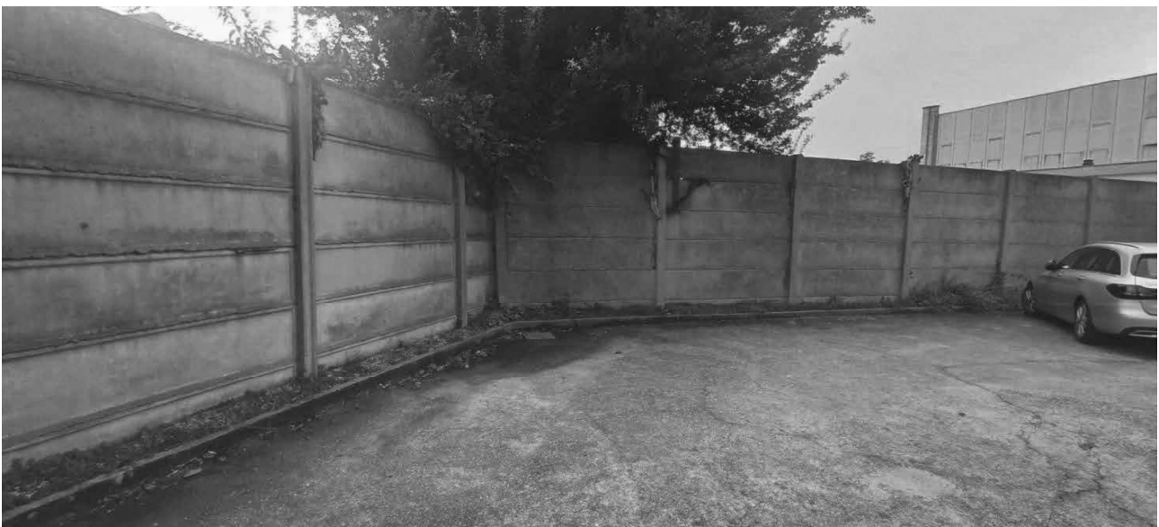
Foto n. 4 Posti auto