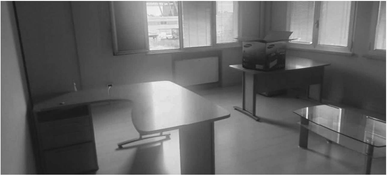
Foto n. 11 Ufficio 1