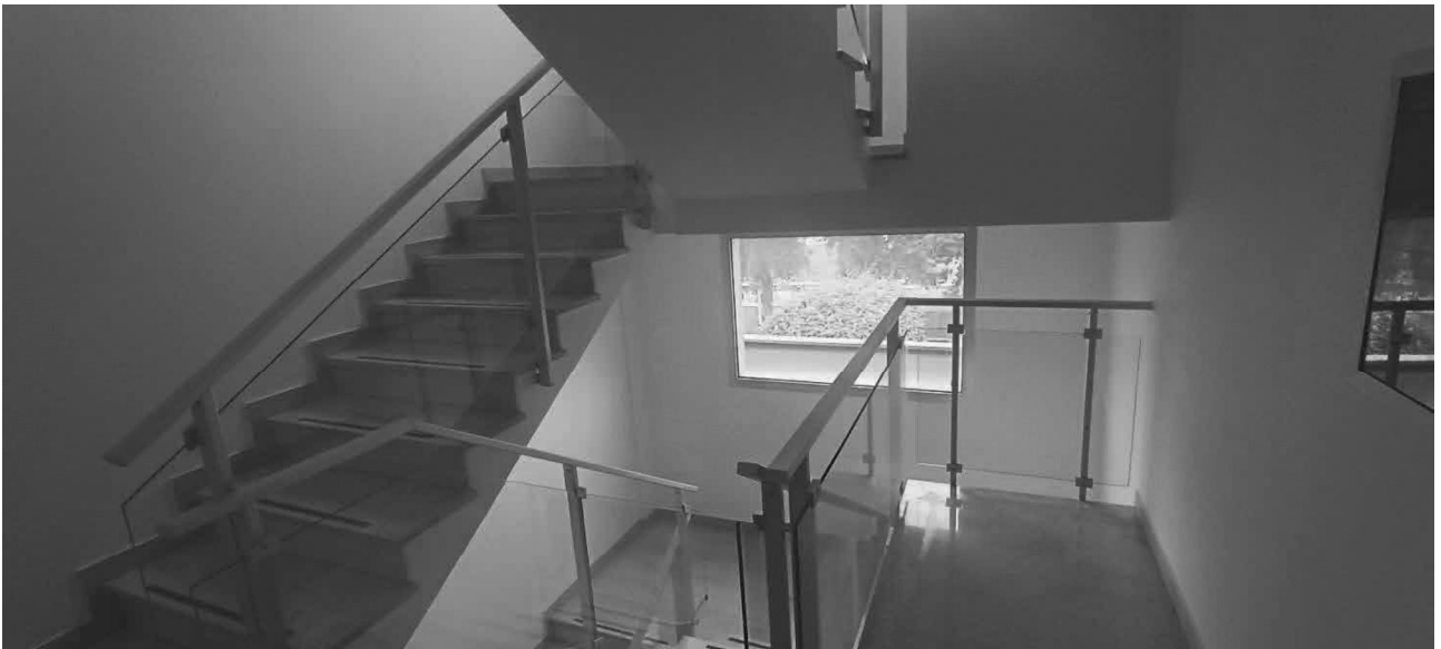
Foto n. 8 rampe scale al piano primo