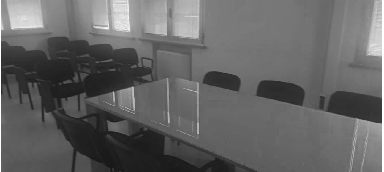
Foto n. 15 sala riunioni