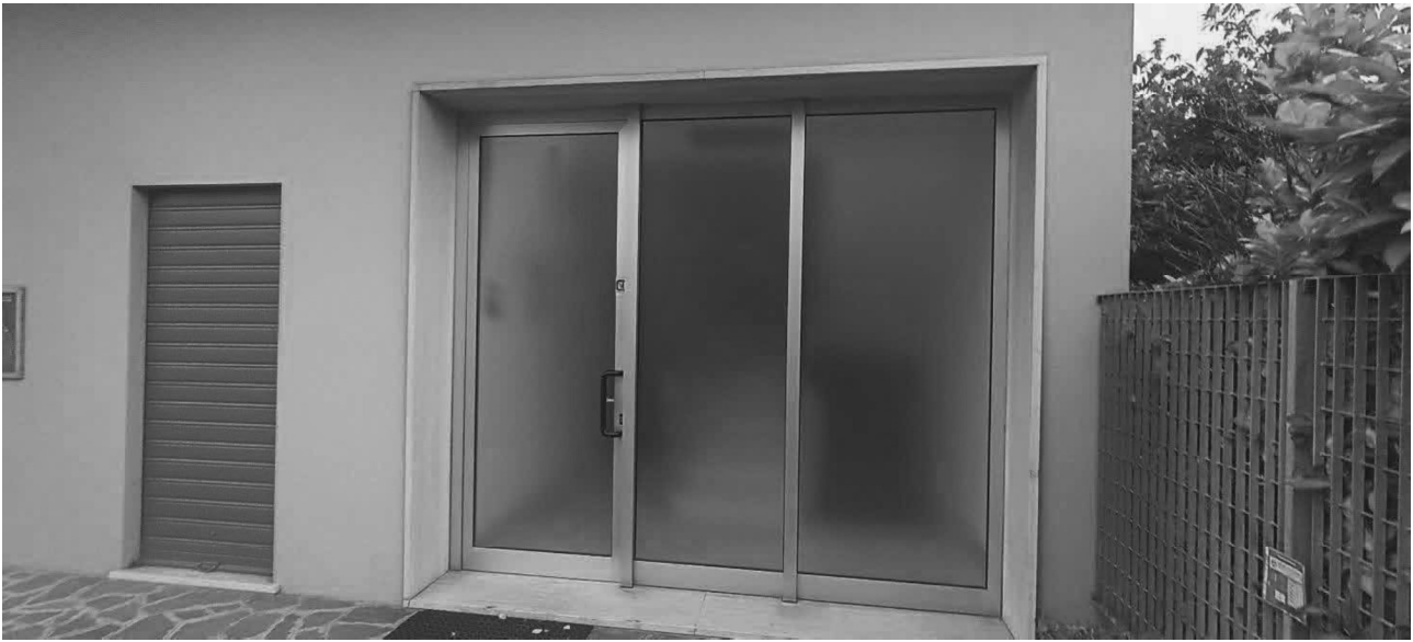
Foto n. 5 Portone di ingresso allo stabile su via cappelletto