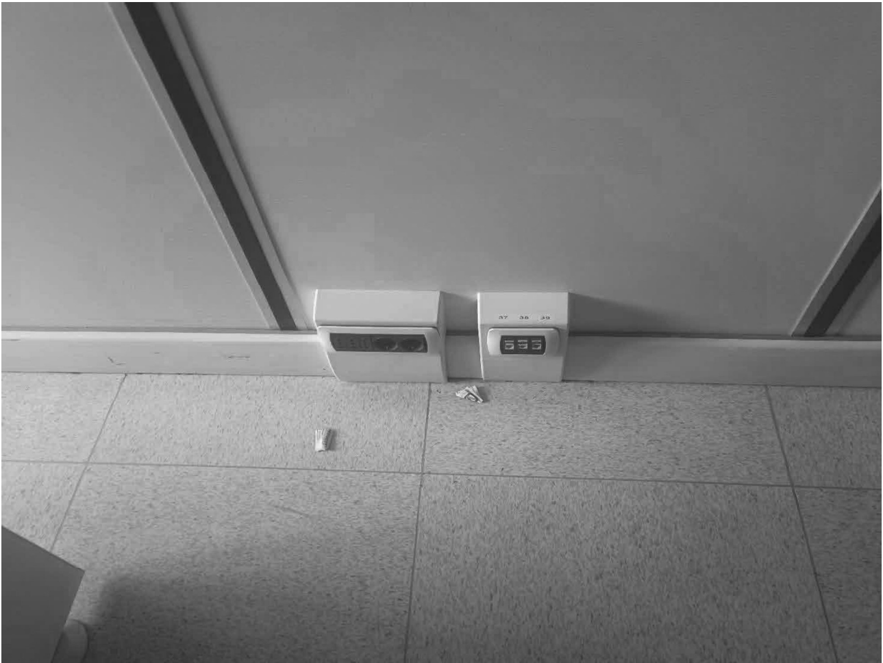
Foto n. 18 Impianto elettrico - particolare