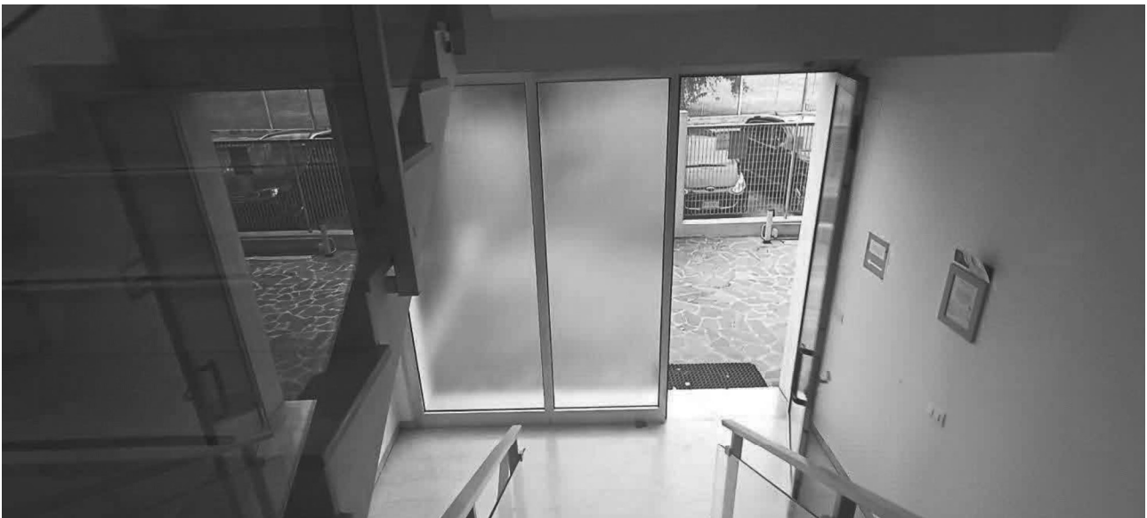
Foto n. 6 Portone di ingresso allo stabile su via cappelletto