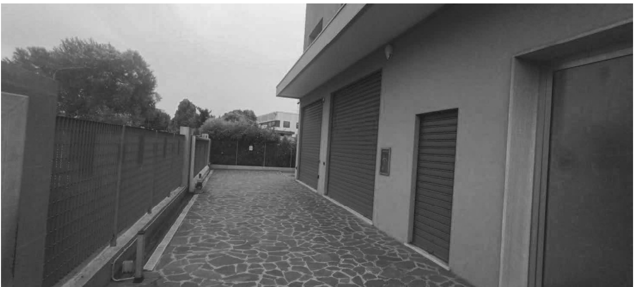
Foto n. 2 Edificio via cappelletto 6 vista porzione pavimentata fronte ingresso