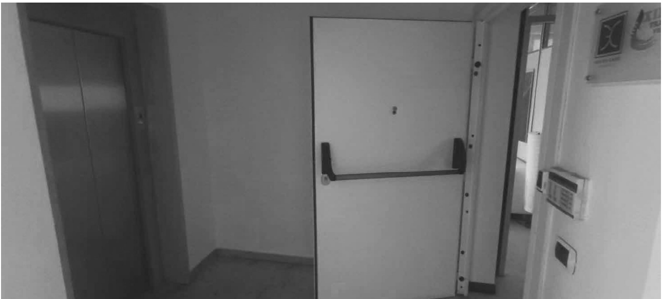
Foto n. 10 Porta di ingresso all'immobile principale e particolare ascensore