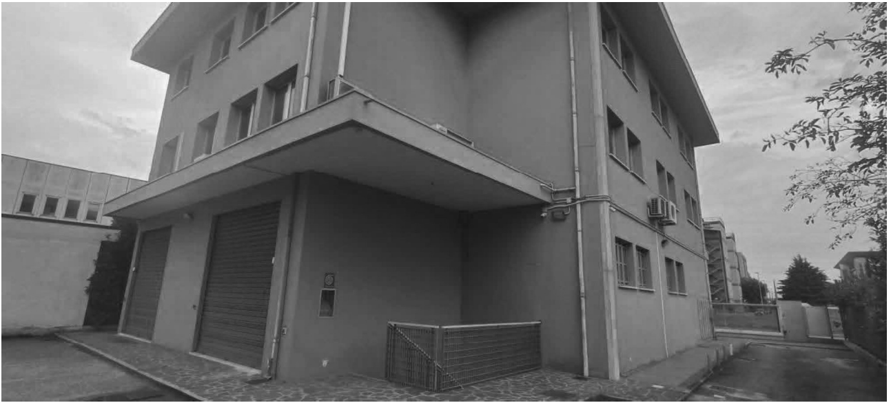
Foto n. 1 Edificio via Cappelletto n. 6 vista latero-posteriore