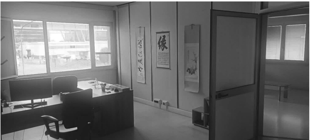
Foto n. 14 Ufficio 3