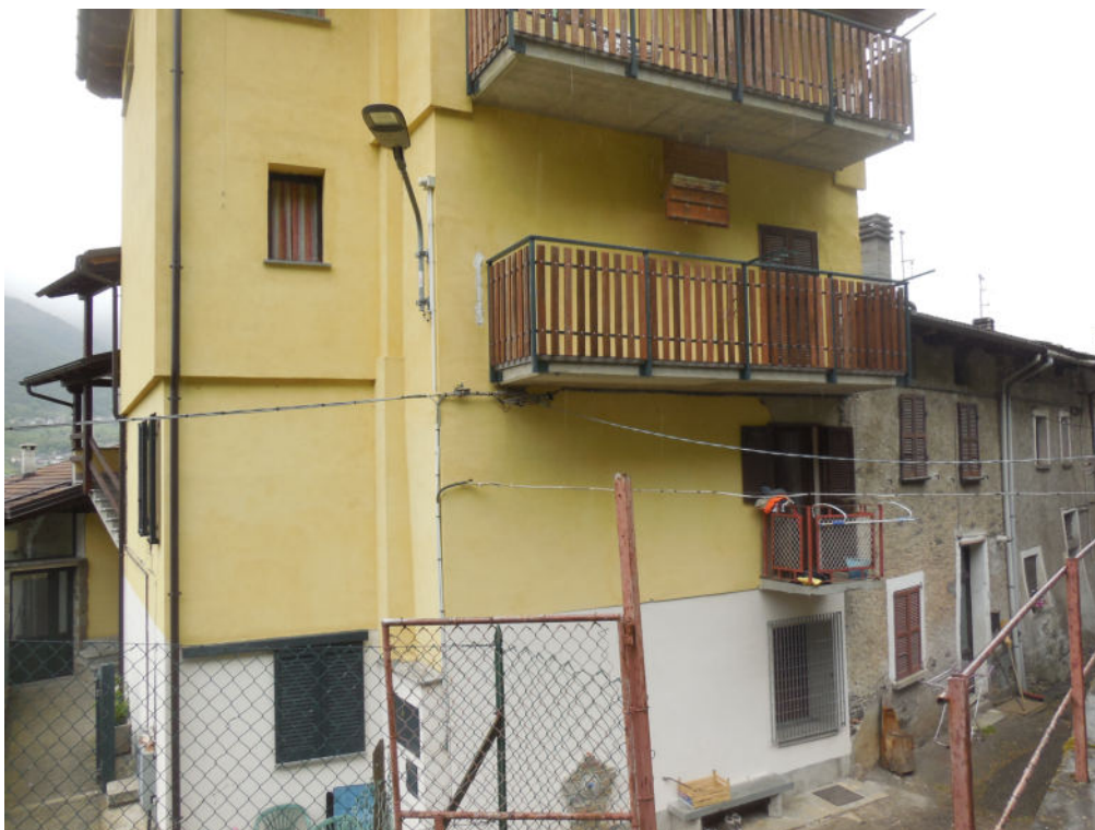
foto n. 6 particolare fronte ovest con vista ampliamento abusivo