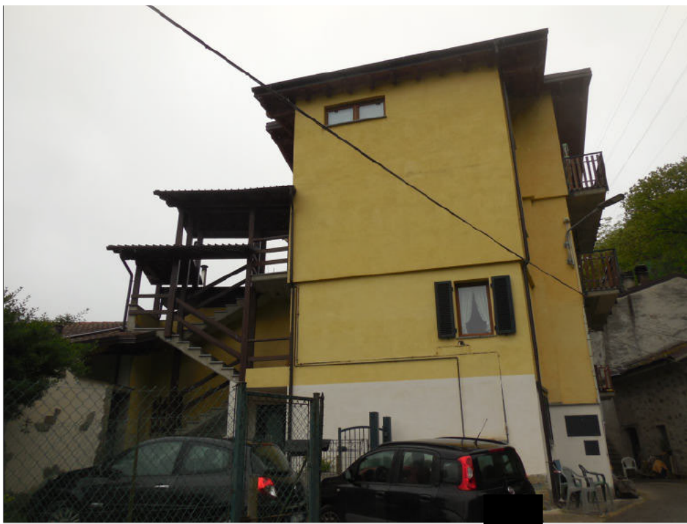
foto n. 4 vista fronte sud