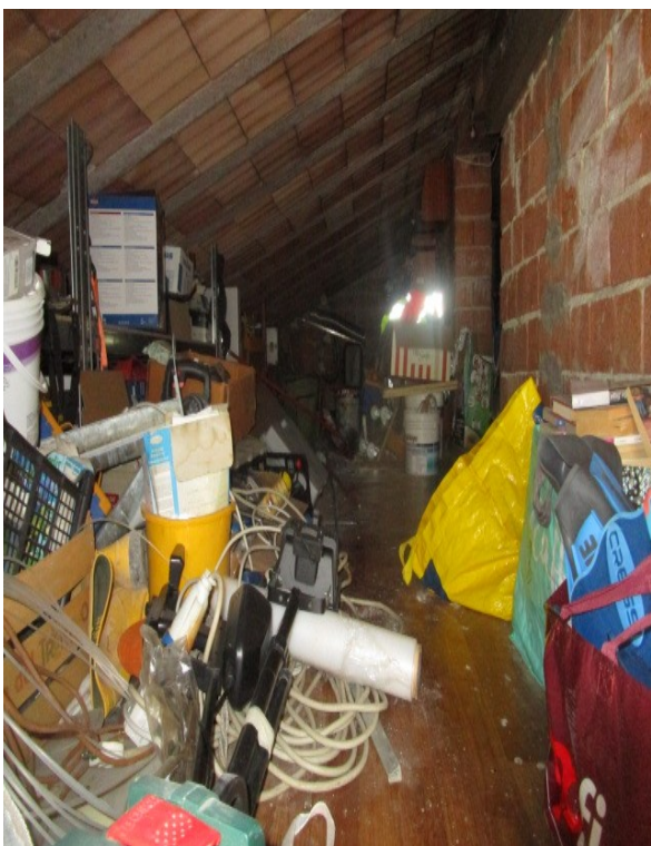
Figura 7: Sottotetto soprastante la superficie abitativa, utilizzato dagli esecutati, come ripostiglio.