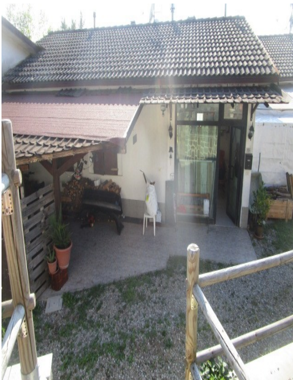
Figura 5: Prospetto principale dell'appartamento "a schiera", con vista del tetto autorizzato e delle ulteriori coperture abusive.