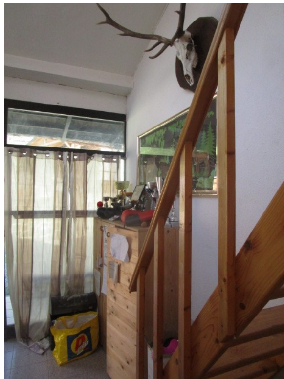
Figura 6: Ingresso all'appartamento, dal portico trasformato in veranda e scala al sottotetto, non concessionate.