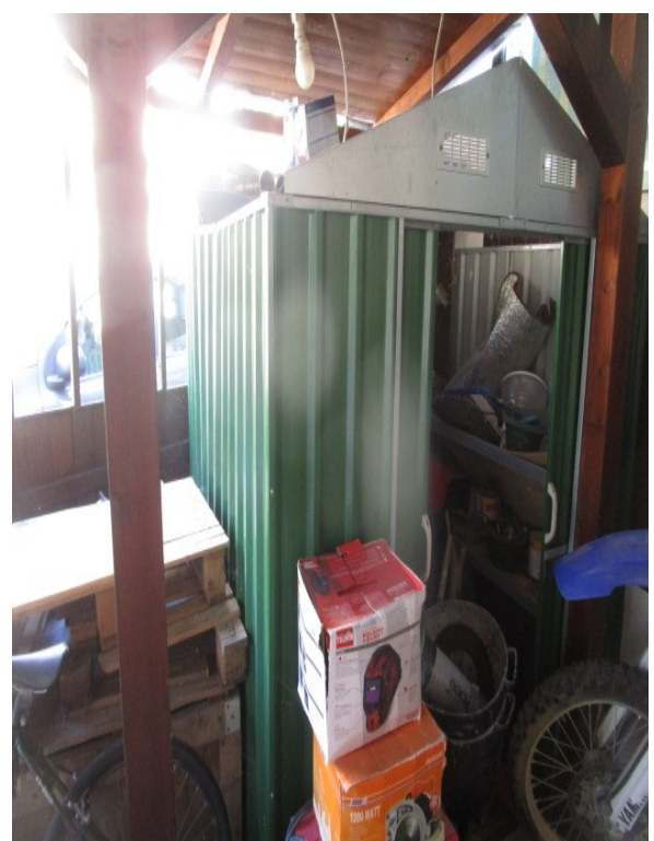
Figura 32: Prefabbricato in lamiera, installato sotto la tettoia impropria.