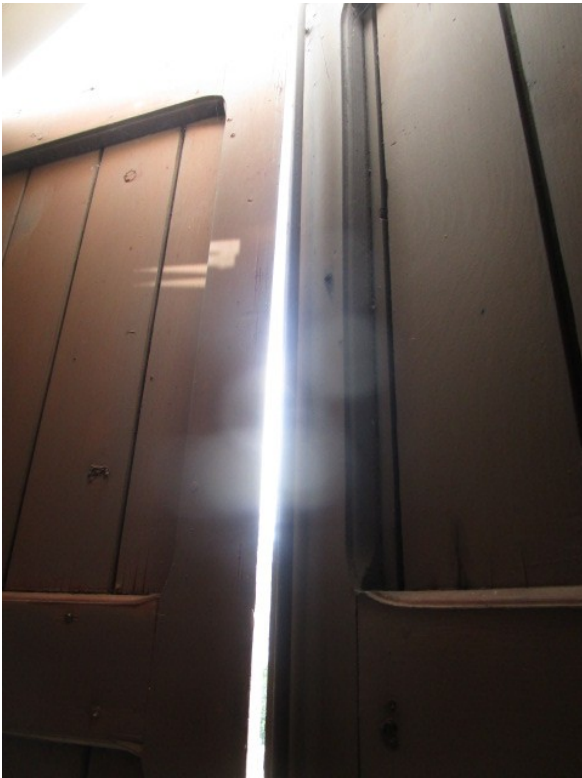
Figura 29: Modello di scuri in legno, a protezione delle finestre.