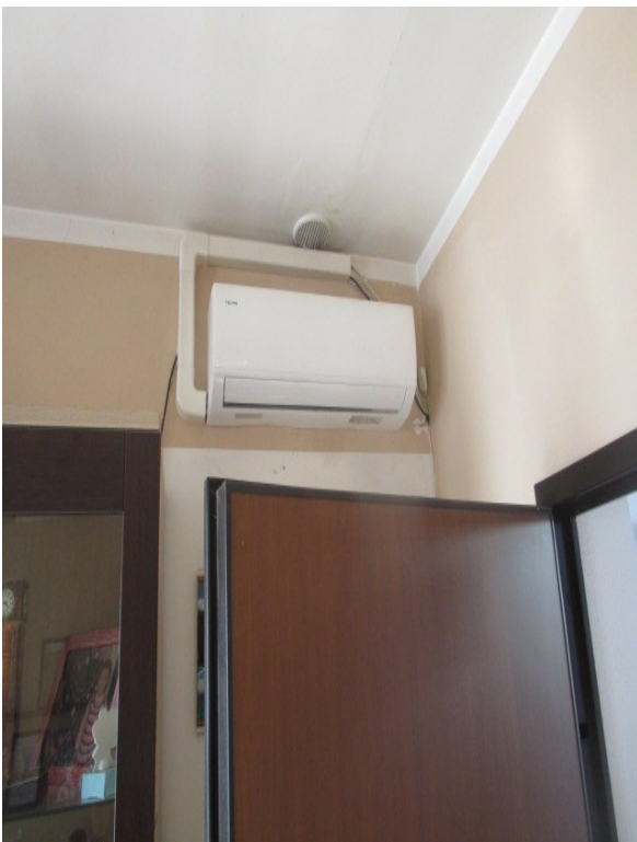
Figura 31: Climatizzatore con più diffusori, in dotazione al bene staggito.