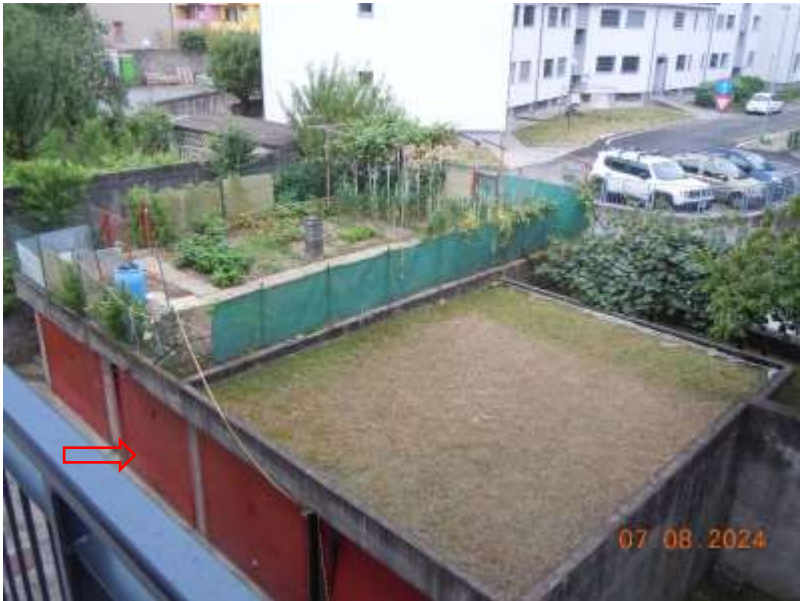
Box auto adiacente